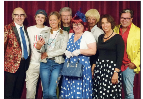
Insgesamt viermal spielen die Darsteller der „bühne 15 VHS“ die turbulente Komödie.

November, um 19.30 Uhr sowie Sonntag, dem 3. November, um 15 Uhr. Karten zum Preis von 10 Euro sind erhältlich unter www.luebeck-ticket.de , an allen LN-Verkaufsstellen, in der Stadtbücherei Bad Schwartau, Markt 14 (Barzahlung) sowie telefonisch als Vorbestellung unter 0451/2961822 und an der Abendkasse.