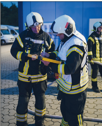
Die Atemschutzüberwachung kontrolliert die Atemschutzgeräteträger während der gesamten Alarmübung.