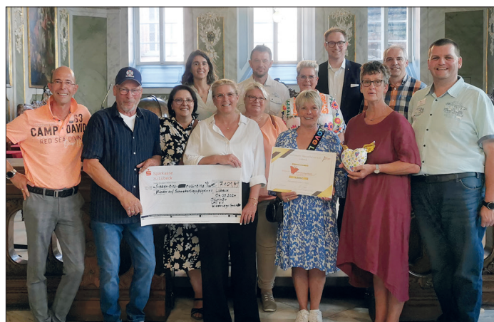
Große Freude herrschte vor Kurzem bei der Spendenübergabe im Lübecker Rathaus.