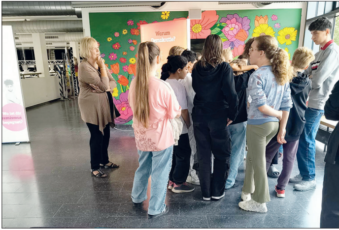
Bundestagsabgeordnete Bettina Hagedorn (SPD) besuchte die Wanderausstellung der Friedrich-Ebert-Stiftung „Demokratie stärken – Rechtsextremismus bekämpfen“ in der Cesar-Klein-Schule.

Ratekau. Mitte September besuchte die Bundestagsabgeordnete Bettina Hagedorn (SPD) die Wanderausstellung der Friedrich-Ebert-Stiftung „Demokratie stärken – Rechtsextremismus bekämpfen“ an der Cesar-Klein-Schule in Ratekau.