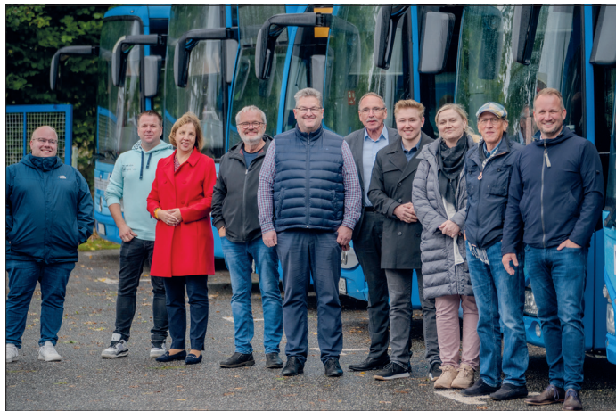
Mitglieder der SPD-Kreistagsfraktionen Ostholstein und Plön waren zu Gast bei den Verkehrsbetrieben des Kreises Plön.

Die SPD-Kreistagsfraktion Ostholstein ist jedoch überzeugt, dass der eingeschlagene Weg der richtige ist und der Kreis Plön ein Vorbild sein kann, wie es richtig gut läuft.