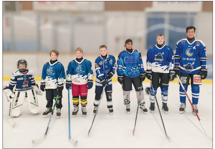
Eishockey-Spieler des CET.

(ab 4 Jahren) findet immer dienstags um 16 Uhr und samstags um 8 Uhr im ETC in Timmendorfer Strand statt.