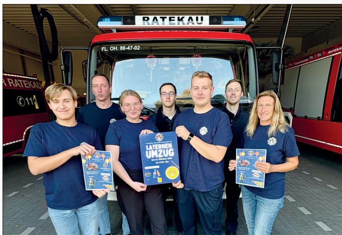
Ab 17 Uhr laden die Kameradinnen und Kameraden der Freiwilligen Feuerwehr Ratekau zum Laternenfest mit Umzug durch den Ort ein.

Ratekau. Am Samstag, dem 12. Oktober, lädt die Freiwillige Feuerwehr Ratekau ab 17 Uhr zu einem Laternenfest ein.