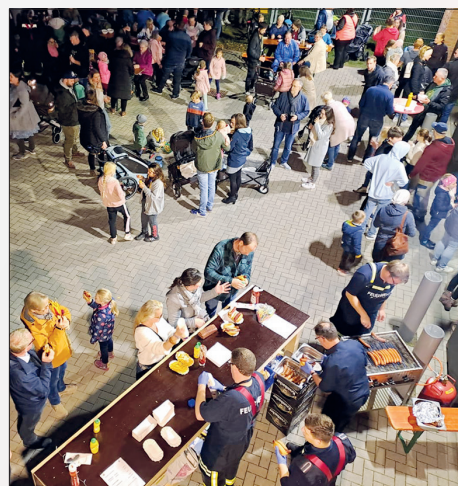
Die Festbesucher dürfen sich auf Leckerem vom Grill freuen.

Ab Einbruch der Dunkelheit setzt sich ein Laternenumzug vom Feuerwehrhaus aus durch den Ort in Bewe-