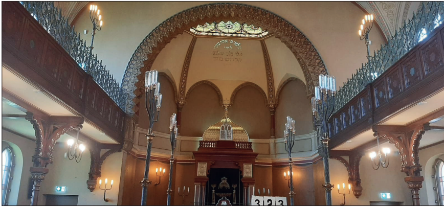
Der Kulturkreis und die VHS Timmendorfer Strand besuchten die Carlebach-Synagoge in Lübeck.