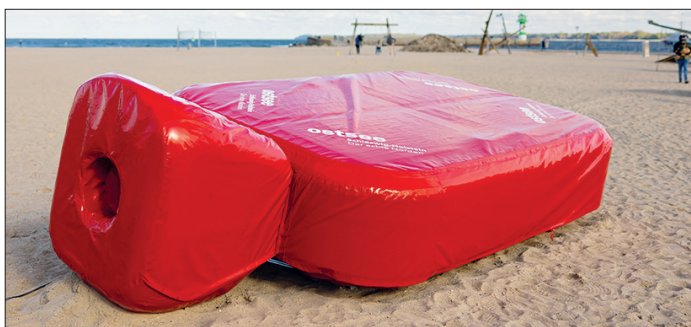
Bis Anfang März ist die Riesenwärmflasche unter anderem in Travemünde, Scharbeutz, Eutin, Plön und Timmendorfer Strand-Niendorf/Ostsee zu erleben.

Fasanenweg 16a Scharbeutz Tel. 04524/900-112 Info@hannes-gartenbau.de www.hannes-gartenbau.de