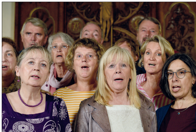
Mitglieder des Regionalchors Holsteinische Schweiz bei einer Probe.

Auf dem Programm stehen die Ergebnisse der einzelnen Workshops und das sind die Choralkantate „Christ ist erstanden“ von Dietrich Lohff für gemischten Chor, zwei Trompeten, Posaune und Orgel, der Titelsong aus der gleichnamigen