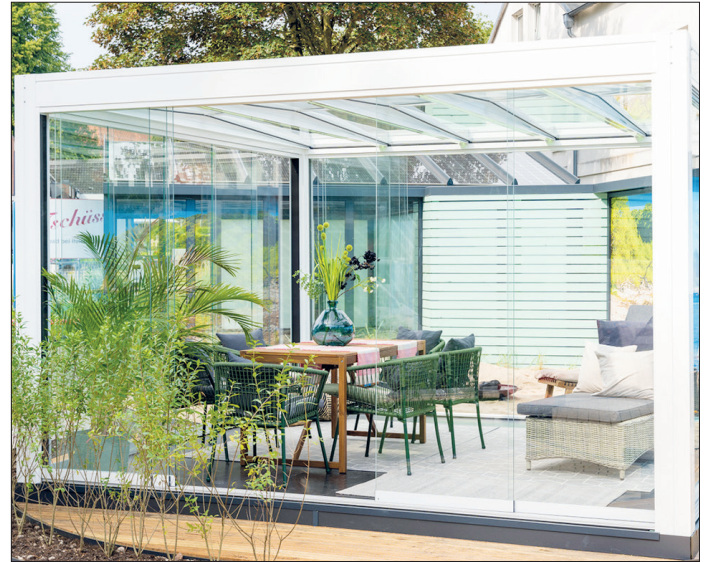
Mit dem Würfel-Wintergarten bietet das Traditionsunternehmen eine interessante Neuheit an.

Besichtig werden kann die Neuheit bei „Nelson Park Terrassendächer“ in Ahrensböck, Lübecker Straße 17, an allen Wochentagen von 9 bis 18 Uhr sowie samstags von 10 bis 14 Uhr. Weitere Infos: www.nelson-park-td.de .