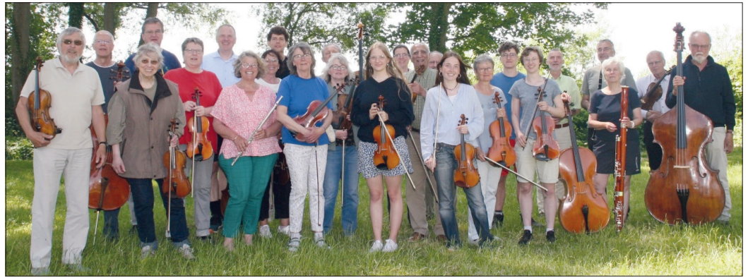
Das Kreiskammerorchester Ostholstein gibt ein Konzert in der Gleschendorfer Feldsteinkirche.