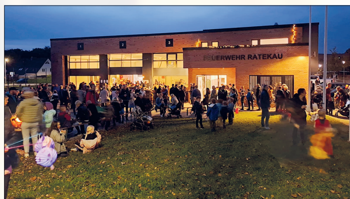
Auf dem Gelände der Freiwilligen Feuerwehr Ratekau geht es nach dem Laternenumzug gesellig zu.