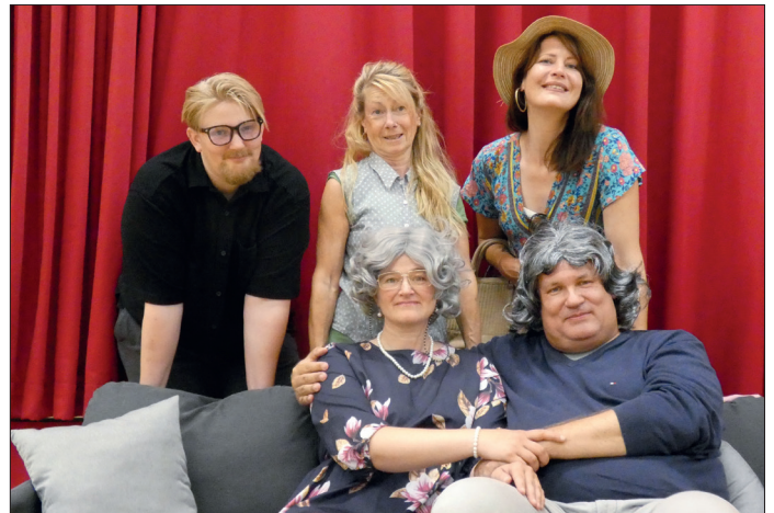
Am 12. Oktober führt die Crew vom Theater Fidelio erstmals die Komödie „Die lieben Eltern“ auf.

Die Karten kosten 16 Euro im Vorverkauf inklusive Gebühren und 18 Euro an der Tageskasse. Erhältlich sind sie unter anderem im Ticket-Shop auf der Website theater-fidelio.de.