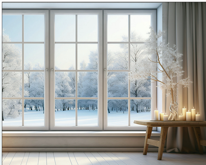
Bodentiefe Fenster holen auch im Winter die Sonne ins Haus.

da es sich hier um einen weiteren Zugangspunkt ins Hausinnere handelt. Bodentiefe Fenster, die sich öffnen lassen, benötigen im Obergeschoss eine Absturzsicherung. Über Heizverluste muss man sich keine Sorgen machen, denn moderne großflächige Fensterfronten sorgen dank Wärmedämmglas, moderner Rahmenkonstruktion und guter Abdichtung für eine sehr gute Wärmedämmung.