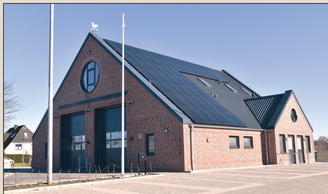
Am kommenden Wochenende findet zum ersten Mal das 1. Hemmelsdorfer Erntedankfest vor dem neuen Feuerwehrhaus statt.

uns die Premiere des Hemmelsdorfer Erntedankfestes und genießen Sie zwei Tage voller Freude, Musik und kulinarischer Köstlichkeiten. Wir freuen uns auf Ihren Besuch!“