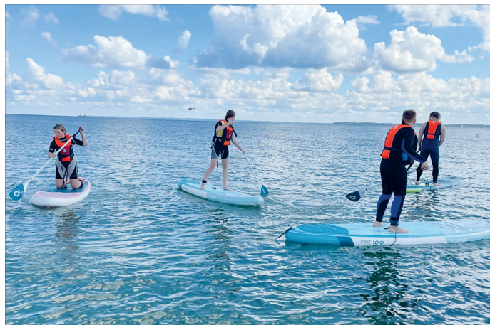
Die Schülerinnen und Schüler haben viel Spaß auf den Boards und freuen sich über den Start der SUP-AG am Scharbeutzer Strand.