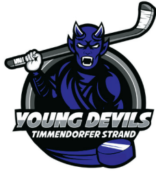
Das neue Logo der Young Devils.