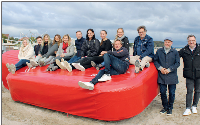
Am 2. Oktober wurde die Riesenwärmflasche, ein Gemeinschaftsprojekt des Ostsee-Holstein-Tourismus e. V. und seiner Mitglieder, in Travemünde enthüllt.

Travemünde. Etwas Neues kommt an die Ostsee und in die Holsteinische Schweiz: Seit dem 2. Oktober bringt eine beheizte Riesenwärmflasche Gemütlichkeit und Wärme in die Orte der „Ostsee Schleswig-Holstein“ und die Holsteinische Schweiz.