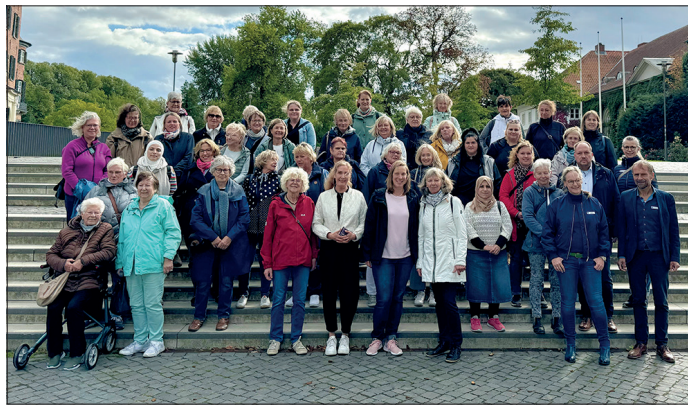
15 Jahre Familienzentren in Ostholstein: Koordinatorinnen und ehrenamtliche Mitarbeiterinnen der Familienzentren mit Vertretern der Kreisverwaltung.

Träger der Familienzentren sind der Deutsche Kinderschutzbund Kreisverband Ostholstein sowie Ortsverbände Heiligenhafen und Eutin, die Gemeinde Ahrensböök und die Lebenshilfe Ostholstein. Für die Arbeit vor Ort sind in allen Familienzentren hauptamtliche Koordinatorinnen zuständig. Sie gelten stets als erste Anlaufstelle und sind für die regionalen Netzwerke verantwortlich.