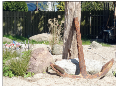
Am Tag des Friedhofs kann in Niendorf an der Hävener Allee auch die Gemeinschaftsgrabanlage „Am Strand“ besichtigt werden.

Auch die Kirchengemeinde Niendorf/Ostsee mit ihrem Friedhof an der Hävener Allee beteiligt sich am Sonntag, dem 13. Oktober, an diesem Tag. Begonnen wird mit einem Gottesdienst um 14 Uhr in der Friedhofskapelle. Im Anschluss daran gibt es ein buntes Programm für jedermann, wie zum Beispiel Führung über den Friedhof oder Basteln mit Kindern. Für Kaffee und Kuchen ist ebenfalls gesorgt.