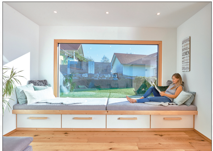
Holzfenster schaffen ein behagliches Wohnklima.

Dennoch sind Kunststoffenster mit einem Marktanteil von 58 Prozent führend, vor Fenstern aus Holz, Holz-Aluminium und Aluminium. Das dürfte vor allem am Preis liegen: Sie sind rund ein Viertel günstiger als Holzfenster. Meist bestehen Kunststoffenster aus Polyvinylchlorid (PVC), einem robusten, witterungsbeständigen Material. Ihre Lebensdauer liegt bei 40 bis 50 Jahren. Außerdem sind sie pflegeleicht. Optisch sind Holzfenster die Gewinner. Vor allem klassische Modelle wie Sprossenfenster sind nicht nur bei Altbausanierern beliebt. Die Investition in Holzfenster lohnt sich auch mit Blick auf die Nachhaltigkeit. Bei richtiger Pflege halten Holzfenster bis zu 50 Jahre, zudem sind sie umweltfreundlich und recycelbar. Etwa alle fünf Jahre sollten Holzfenster neu gestrichen werden.