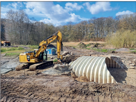
Die Stadt Bad Schwartau gibt bekannt, dass das „ Auenprojekt Schwartau “ (Renaturierung der Schwartau) kurz vor dem Abschluss steht. Der beliebte Wanderweg zwischen Groß Parin Osterkampsredder und Ratekau wird in Kürze wieder freigegeben.