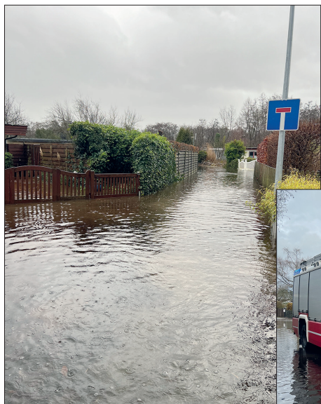
Ein Teil der Aalbeek-Siedlung in Niendorf/Ostsee steht wieder einmal unter Wasser.