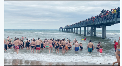
150 Freiwillige stürzten sich beim Anbaden in Niendorf/Ostsee in die 11 Grad kalte Ostsee. Damit hat das Anbade-Quartett im Anbade-Monat Mai in der Lübecker Bucht in Niendorf das Finale gefeiert. Zuvor wurde in Retzin, Scharbeutz und Travemünde angebadet. Vier Orte, viermal Anbaden mit 870 Anbadende und über 2.200 Zuschauer.