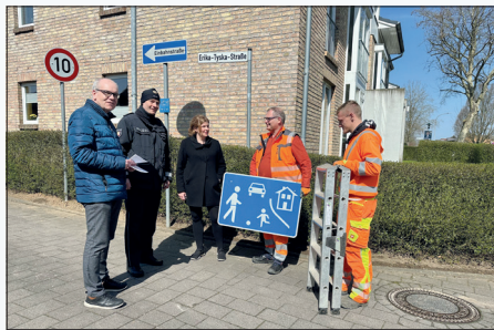
Spielstraße, zu schnell fahrende Fahrzeuge und lange Umwege durch eine vorübergehende Einbahnstraßenregelung. In Stockelsdorf erhitzen sich in der Erika-Tyska-Straße die Gemüter über die wechselnden Verkehrssituationen. Nach vielem Hin und Her einigen sich die verantwortlichen aller zuständigen Behörden auf einen Kompromiss: Es gilt jetzt Tempo 10 km/h.