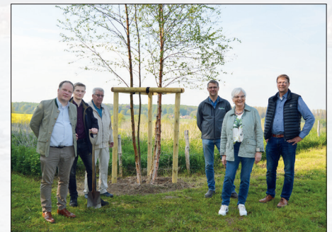
Bei seiner Gründung 2019 hat sich der Umweltbeirat der Gemeinde Stockelsdorf unter anderem auf die Fahnen geschrieben, alljährlich an einer anderen Stelle im Gemeindegebiet den jeweiligen „ Baum des Jahres “ zu pflanzen. Am Aussichtspunkt ins Curauer Moor steht jetzt eine junge Moorbirke.