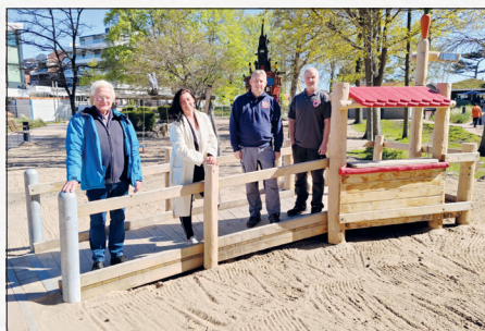
Es ist geschafft: Ein neues Inklusionsspielgerät für Kinder mit Beeinträchtigungen wird auf dem Kinderspielplatz im Kurpark Scharbeutz offiziell zum Bespielen freigegeben.