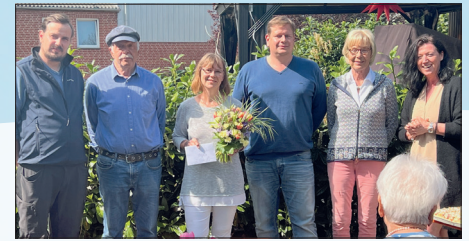
Die Gemeinde Scharbeutz vergibt den Umweltpreis an die Dorfschaft Schulendorf und die Firma Rahlf & Söhne in Schürsdorf für die Instandsetzung des Storchennestes in Schulendorf.