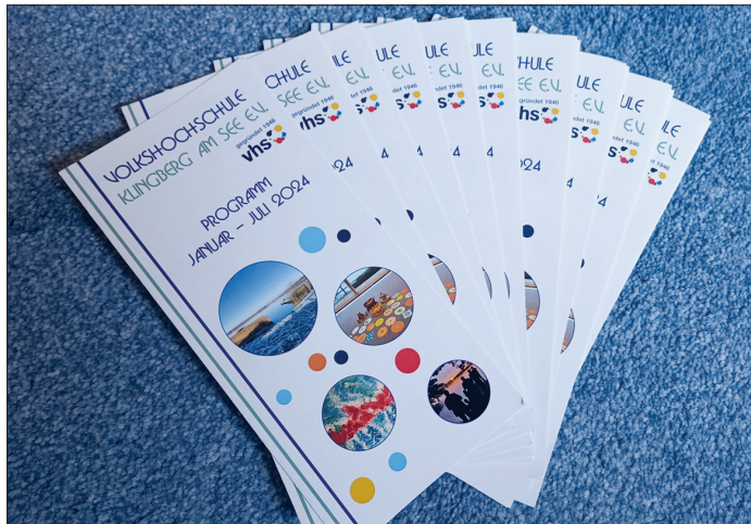
Das neue Programm der Volkshochschule Klingberg am See e.V. steht fest.

Lüften. Der Vortrag ist dank der Bundesförderung für Energieberatung der Verbraucherzentrale kostenfrei. Er findet von 18.30 bis 20 Uhr in Kooperation mit dem Gemeinnützigen Verein für Lübeck-Moisling/Genin und Umgegend e.V. statt. Veranstaltungsort ist das Vereinsheim des SV Rot-Weiß Moising, Brüder-Grimm-Ring 4b in Lübeck. Anmeldungen unter Telefon 0451/72248 oder per E-Mail an luebeck@vzsh.de .