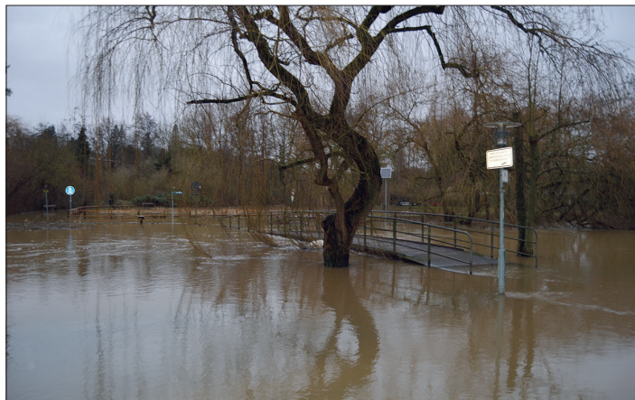
Der überschwemmte Kurpark von Bad Schwartau.

formiert, so dass man Hilfe in Form von Großpumpen anfordern könnte, wenn es die Situation erforderlich macht. Das ursprünglich als reine Ferienhaus-Siedlung angelegte Gebiet ist auch als Überschwemmungsgebiet bekannt. Das Wasser sammelt sich dort bei starkem Regenfall, da der Hemmeldorfer See und die angrenzenden Grünflächen das Wasser nicht mehr aufnehmen können. Damit das Oberflächenwasser nicht in die Schmutzwasser-