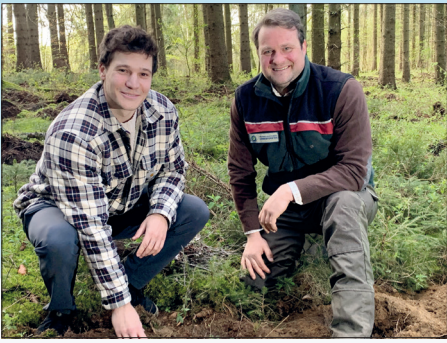
Mit dem „Crewwald“ für mehr Klimaschutz in Schleswig-Holstein: Sänger Wincent Weiss pflanzt einen Wald bei Pansdorf.