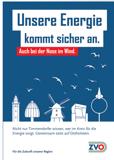
Ein Plakat der neuen Werbekampagne.

Das Gewinnspiel läuft bis zum 31. Januar. Anschließend wird die Gewinnerin oder der Gewinner gezogen und persönlich kontaktiert. „Wir wünschen allen Teilnehmenden viel Erfolg!“