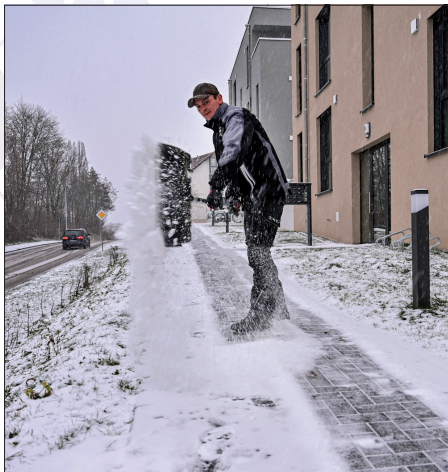
Mieter oder Eigentümer sind im Winter verpflichtet, für einen eisfreien Fußweg zu sorgen.

Die Häufigkeit des Räumens hängt letztlich von der Witterung und der Verkehrsbedeutung eines Weges ab. Bei extremem Schneefall oder heftiger Glatteisbildung ist gerade auf stark frequentierten Wegen außergewöhnlicher Einsatz gefordert. Nur wenn Räumen und Streuen witterungsbedingt zwecklos sind, kann man warten, bis beispielsweise der Schneefall nachlässt oder ganz aufhört. Auch müssen Wege meist nicht in gesamter Breite geräumt werden. Meist genügt es, einen Streifen frei zu schaufeln oder auf einer bestimmten Breite zu streuen.