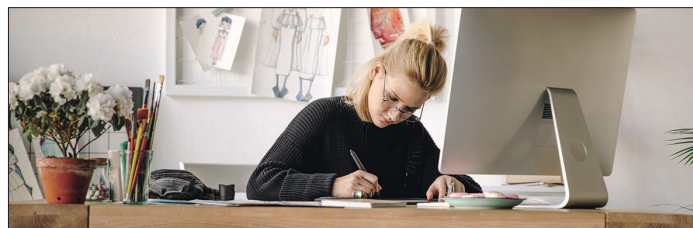
Fragen rund ums Berufsfeld Kommunikationsdesign werden morgen im BiZ beantwortet.

Die Veranstaltung findet im BiZ der Agentur für Arbeit Lübeck, Hans-Böckler-Straße 1 in Lübeck, statt. Anmeldungen erfolgen unter der Telefonnummer 0451/588-397 oder per E-Mail unter luebeck.veranstaltungen@arbeitsagentur.de an.