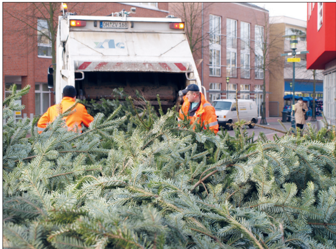
In den folgenden Tagen werden wieder die ausgedienten Tannenbäume kostenlos vom ZVO abgeholt.

Die Kunden werden gebeten, Weihnachtsbaumschmuck vollständig zu entfernen.