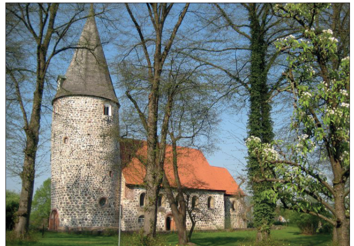
Traditionell lädt der Gemeinnützige Förderverein „Freunde der Ratekauer Kirche e.V.“ in der Feldsteinkirche zum Neujahrskonzert ein.

KLÜMPER BAU Professionelle Bausanierer im Bereich Balkonsanierung, Trockenlegung, Innensanierung, Trockenbau, Dach- und Flachdachsanieierung uvm.