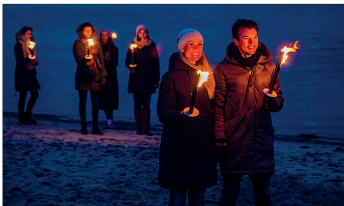
Am Freitag findet wieder die beliebte Fackelwanderung am Niendorfer Strand statt.

die Tour bereit. Nur solange der Vorrat reicht. Die Wanderung beginnt und endet an dem Seebrückenvorplatz, Niendorf/Ostsee (Niendorfer Balkon). Start ist um 19.30 Uhr. Ostseecard-Besitzer und Einheimische zahlen 3 Euro, Erwachsene 5 Euro, Kinder- und Jugendliche 2 Euro. Kinder bis 5 Jahre sind kostenfrei. Anmeldung unter www.timmendorfer-strand.de/erlebnisse . Bei schlechtem Wetter wird die Fackelwanderung abgesagt und man kann auf die nächste umbuchen oder das Geld wird erstattet.