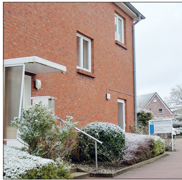
Die Infoveranstaltung findet in den Räumen des Pflegekinderdienstes und der Adoptionsvermittlung in Eutin statt.

Privatpersonen, auch ohne pädagogische Ausbildung, übernehmen Aufgaben der öffentlichen Erziehungshilfe. Der Pflegekinderdienst des Kreises Ostholstein ist stets auf der Suche nach neuen Pflegeeltern, die bereit sind zu helfen und Kinder für eine kürzere oder längere Zeit aufnehmen. Haben Sie Freude am Zusammenleben mit Kindern? Möchten Sie Vertrauen schenken, Mut machen und Geduld zeigen? Verfügen Sie über Einfühlungsvermögen, Zeit und Belastbarkeit? Können Sie sich vorstellen, einem fremden Kind einen Platz in Ihrer Familie zu geben? Sind Sie offen für die Zusammenarbeit mit der Herkunftsfamilie, dem Jugendamt so-