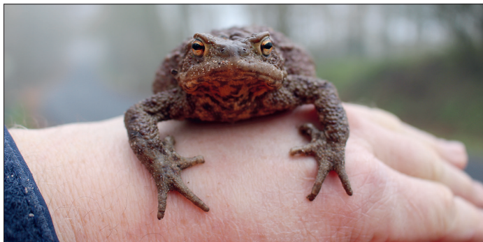
Die Gemeinde Scharbeutz sucht Betreuer für einen Amphibienzaun in Gronenberg.