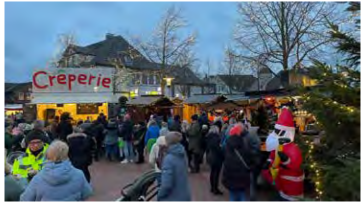
Der Weihnachtsmarkt in Schönberg war sehr gut besucht.