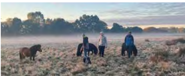
Schüler lernen, für Tiere Verantwortung zu übernehmen.

sation, leiten gemeinsam mit den Klassenlehrern der beteiligten Klassen die Arbeiten im Garten, in der Küche und die Versorgung der Tiere an. Als neues Ziel haben sich die Gestalter von Theos Wiese vorgenommen, das Säen, Pflegen, Ernten und Genießen auf der Fläche von Theos Wiese zusammenzubringen. Dazu soll im großen Zelt im hinteren Bereich eine Außenküche entstehen. Dort sollen nicht nur Speisen für den eige-