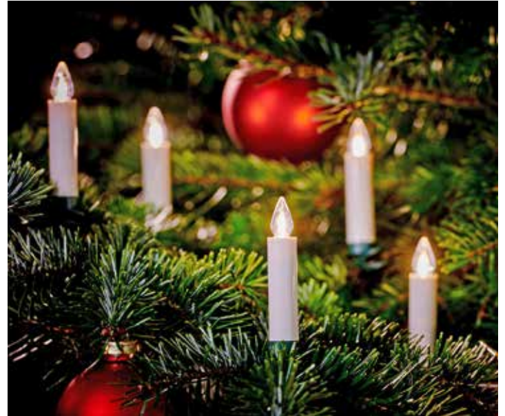
Kabellose Kerzen bringen den Weihnachtsbaum auf sichere Weise zum Strahlen.

(DJ/D). Schätzungen zufolge werden auch in diesem Jahr wieder etwa 30 Millionen Weihnachtsbäume die Wohnzimmer in Deutschland festlich schmücken. Mit Abstand am beliebtesten ist die Nordmanntanne. Immer mehr Menschen kaufen ihre Bäume frühzeitig und nicht erst direkt vor Heiligabend. Das sind die wichtigsten Tipps für Einkauf, Befestigung, Frische und