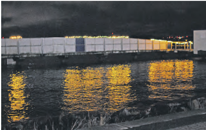
Weihnachtliche Beleuchtung spiegelt sich im Wasser der Kieler Förde, taucht die Seebadeanstalt in malerisches Licht.

dem lebendigen Adventkalender nicht klappt, dann können wir das auch selber“, so die erste Vorsitzende des Fördervereins. „Denn alles war vorbereitet für den 4. Dezember, und es wäre schade gewesen, wenn die Mühe umsonst gewesen wäre“, erzählt sie. Sie sollte Recht behalten. Das Engagement hat sich gelohnt. „Min-