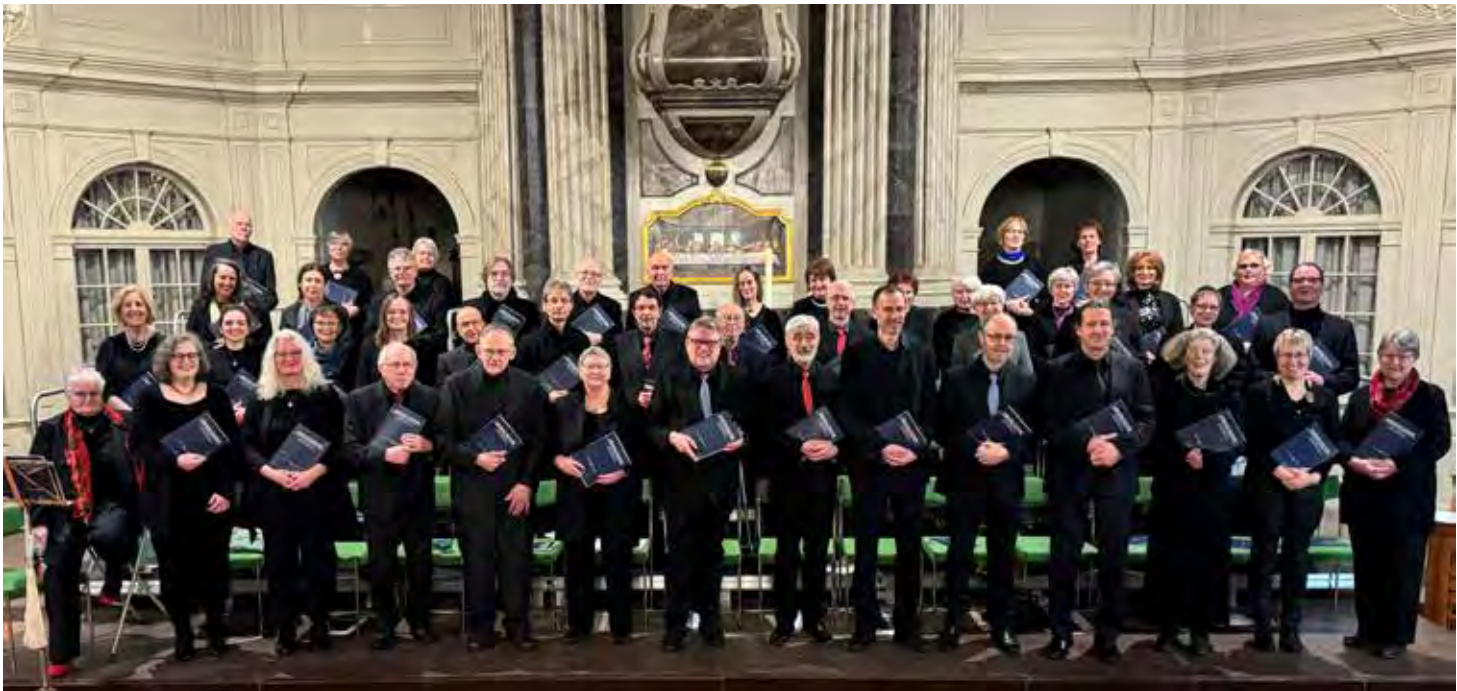
Die Schönberger Kantorei singt am Vorabend des 4. Advents Teile aus Bachs Weihnachtsoratorium.