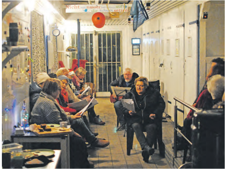
Bei Weihnachtsliedern, Punsch und Gebäck ging es in der Seebadeanstalt es eng zu, und gemütlich.