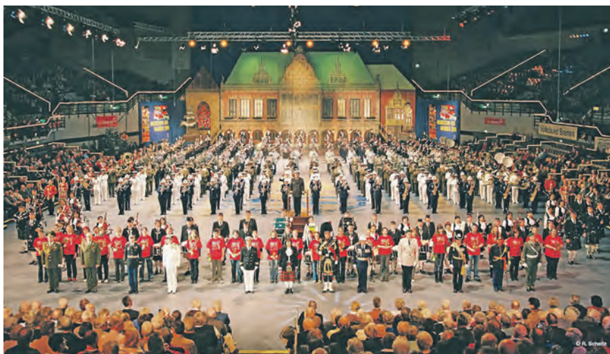
Ein einmaliges Erlebnis: Mehr als 700 Musiker und Tänzer präsentieren das große Final-Bild in der Event-Halle in Bremen.

Tagesfahrt am Sonnabend, 18. Januar, mit Busfahrt direkt ab Kiel, Schwentinental und Preetz inklusive Eintrittskarte für die frühe Nachmittagsvorstellung zum Komplettpreis ab 89,90 Euro als auch eine komfortable Weekend-Reise nach Bremen vom 18. bis 19. Januar an. Bei der Wochenend-Reise residieren die Leser in Bremen ebenso super-zentral wie auch