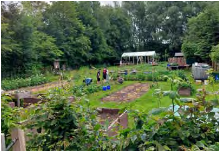
Im Garten von Theos Wiese lernen Schüler, wie sich Obst und Gemüse anbauen lassen.

Verlegung der Strom- und Wasserversorgung sowie die Anschaffung weiterer Küchengeräte und -utensilien genutzt werden. Da der Verein seine vielfältigen Aktivitäten neben Mitgliedsbeiträgen und Schulprojekt-Beiträgen auch aus Spenden finanziert, sind Zuwendungen sehr willkommen. Mehr über den Verein „Theos Wiese“ ist zu finden unter https://www.theos-wiese.org/ .