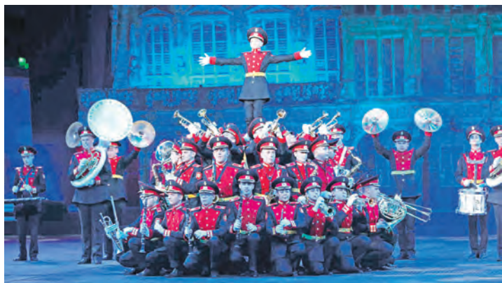
Show- und Repräsentations-Orchester aus aller Welt begeistern in Bremen die Besucher des Bremen Tattoo 2025.

Fischereihafens. Das Komplettpreis-Paket ist zum Sonderpreis von 189,90 Euro inklusive der Busfahrt ab Kiel, Schwentinental und Preetz ab sofort buchbar. Anmeldungen sind ab sofort bei den Leser-Reisen des Burg-Verlages in Eutin unter Telefon 04521-701130 oder direkt online auf leserreisen.der-reporter.info möglich.