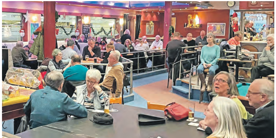
Welches Los gewinnt als nächstes? Wer am 19. Dezember ins Oxyd kommt, ist bei der Ziehung live dabei.

Schönberg (mm). Wenn am Donnerstag, 19. Dezember, im „Oxyd“ die große „X-Mas-Wichtelparty“ steigt, dann finden zwei Aktionen des Gewerbevereins ihren Höhepunkt: Weihnachtstaler- und Wichtelsuchaktion. Vor allem erstere hat lange Tradition und ist im Schönberger Weihnachtsgeschäft nicht mehr wegzudenken. Seit mehr als 25 Jahren danken Schönberger Gewerbebetriebe ihren Kunden mit „Weihnachtstalern“. Will heißen: Beim Einkauf bekommen sie seit Ende November von vielen teilnehmenden Betrieben eines von insgesamt 30000 Weihnachtslosen geschenkt. So auch nächstes Wochenende, wenn am Sonnabend einige Geschäfte länger öffnen, und am folgenden Tag, beim „Sonntags-Shopping“ (12 bis 15 Uhr).