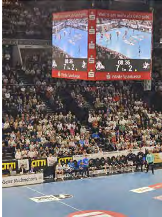
Support: Heute ist auch die Halle gefragt.

gehen, stehen also ein wenig mehr unter Druck. Schon vier Tage später ist der Rekordmeister erneut zum Siegen verdammt. Am 14. Dezember 2024 geht es um 16 Uhr gegen den SC DHfK Leipzig in eine Auswärtsbegegnung. Die Hausherren stehen aktuell im gesicherten Mittelfeld, sind aber beileibe kein Selbstgänger. Auch hier müssen zwei Pluspunkte am Ende auf