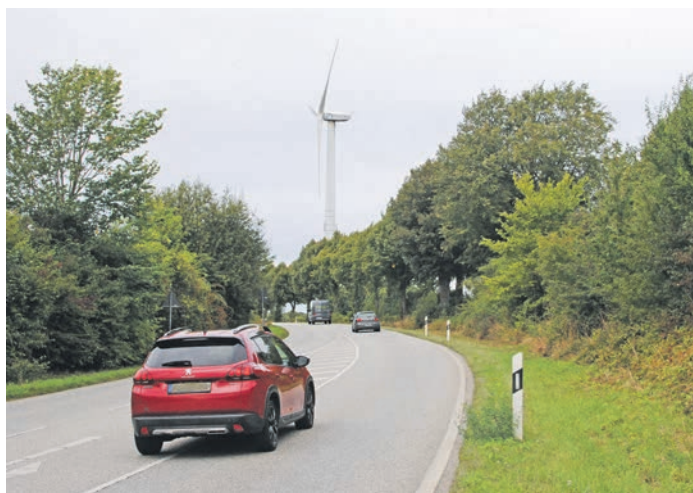
Dieses Windrad steht an der Straße, die von Brodersdorf nach Laeboe führt.

Windkraftanlagen zu bauen. Mehr noch: Um neue Anlagen errichten zu können, müssen die hierfür erforderlichen Flächen im Landesentwicklungsplan (LEP) als "Vorrangfläche" ausgewiesen sein. Brodersdorf spielte darin nie eine Rolle. Doch mit der Ampel-Regierung drehte der Wind. Berlin forcierte die "Energiewende". 2022 änderte der Bundestag das Bundesnaturschutzgesetz. Zudem ist das Land Schleswig-Holstein verpflichtet, bis 2027 mindestens drei Prozent seiner Landesfläche für Windanlagen auszuweisen. Hinzu kommt die sogenannte "Gemeindeöffnungsklausel" im Baugesetzbuch. Will heißen: Gemeinden dürfen von der Regel abweichen, wenn die Gemeindevertreter das mehrheitlich beschließen. Das ist in Brodersdorf am 22. April dieses Jahres geschehen, mit fünf zu zwei Stimmen. Um das Projekt zu stoppen, schlossen sich