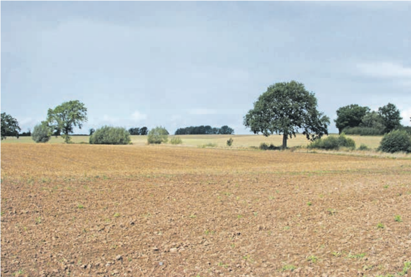
Blick vom ausgeschilderten Rundweg auf landwirtschaftlich genutzte Flächen der Hagener Au.