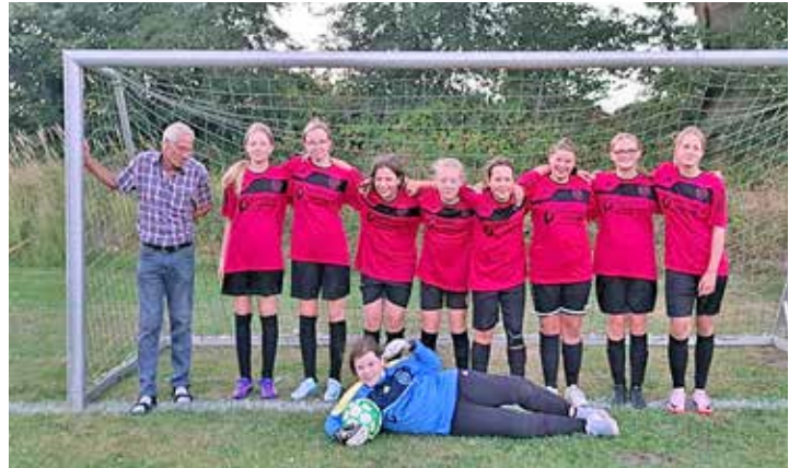
Auch die C-Mädchen freuen sich auf weitere Mitspielerinnen.

Auch hier gilt: Wer Lust hat, kommt vorbei und trainiert einfach mit!