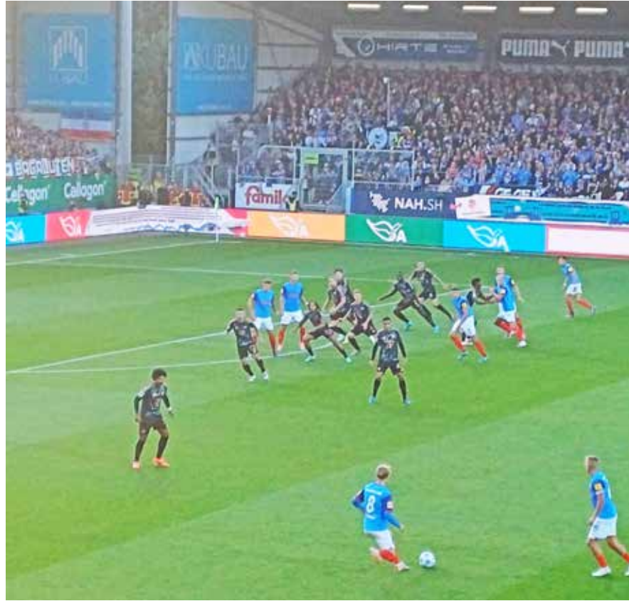
Einer der wenigen Kieler Angriffe.