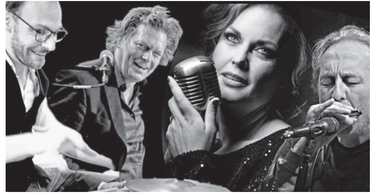
Das ist die Musikformation „Mrs. King & her Jewels“.