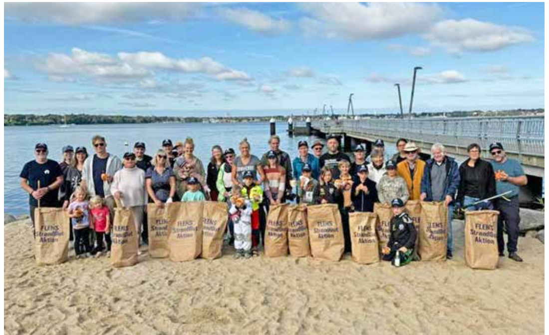
Das sind die kleinen und großen Helfer, die bei der Reinigungsaktion mitgemacht haben.

Mönkeberg (t/mm). Ordnung muss sein: Exakt 1.130 Zigarettenstummel haben insgesamt 40 Einheimische und Gäste beim Mönkeberger Strand am Sonntagvormittag (15. September) anlässlich der „Flens StrandGut-Aktion“ eingesammelt. „Wir haben tatsächlich gezählt“, betont Ulli Hehenkamp vom Verein