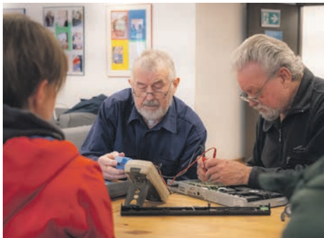
Dank fachkundiger Hilfe lassen sich viele alte Geräte reparieren.

kreativen Mitmachaktionen mitgebrachte, alte Kleidung aufwerten, mit Ton arbeiten oder sich schminken lassen. Die AWO Fahrrad-Selbsthilfe-Werkstatt führt kleinere Wartungen durch, und der Verein „Werk Statt Konsum“ ist mit seiner offenen Holzwerkstatt vertreten. Für das leibliche Wohl ist mit Kaffee und Kuchen gesorgt. Eingeladen sind alle, die sich für Nachhaltigkeit interessieren und diesen besonderen Tag mitfeiern möchten. Zum letzten Mal in diesem Jahr wird am 23. November repariert.