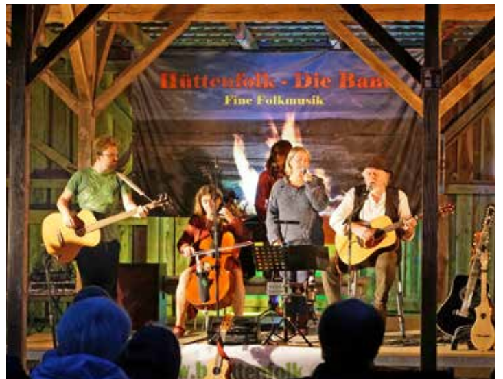
Am 20. September sorgt „Hüttenfolk“ in der Kultur-Diele für Furore.

in Deutsch und Englisch, mal schnell, mal langsam. Zum Einsatz kommen diverse Instrumente und Gesang. Der Eintritt kostet 12 Euro. Karten sind telefonisch unter 0431-53027049 erhältlich.