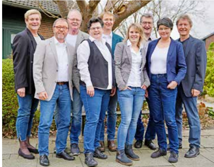
Sängerinnen und Sänger aus ganz Schleswig-Holstein bilden das Ensemble „Die Choriosen“.

Für ihr Konzert im Herrenhaus von Gut Wahlstorf haben die Sängerinnen und Sänger, die von Eutin bis Flensburg über ganz