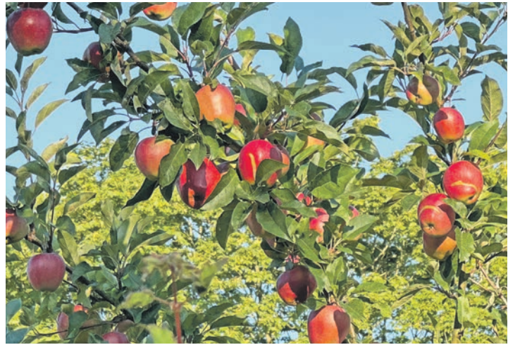
Treffpunkt für das Event ist eine malerische Streuobstwiese in der Weinbergsiedlung.

nehmen. Zudem bietet der „Weidelandschaften e.V.“ Fleischprodukte vom Galloway an und ein BBQ-Stand sorgt für kulinarische Köstlichkeiten. Neben dem Naturgenuss steht der Naturschutz im Mittelpunkt: Die robusten Galloways beweiden die angrenzenden Flächen natürlich nachhaltig und tragen so maßgeblich zur Förderung der Artenvielfalt auf den Wilden Weiden bei. Diese extensiv genutzten Flächen bieten Lebensräume für zahlreiche seltene Pflanzen und Tiere. Die Schwentine schlängelt sich hier malerisch durch die Landschaft. Für die ganze Familie gibt es spannende Naturführungen