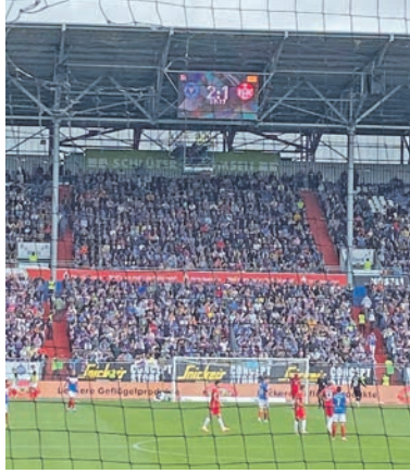
Die Holsteinfans erwarten Sonnabend den VfL Wolfsburg.