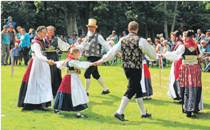
Tanz- und Trachtengruppe bei einem ihrer vielen Auftritte