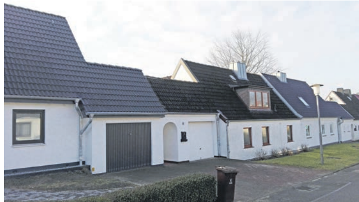
Dieses Foto von 2017 zeigt typische Häuser in der Fischersiedlung „Am Heidberg“. In Bildmitte: Hausnummer 9, vor der umfassenden Grundsanierung.

Am Heidberg 9, 24226 Heikendorf: Eine ganz normale Adresse, wo ein ganz normales Haus steht. Eine Doppelhaushälfte mit kleinem Vorgarten und Garage, ein weiß gestrichenes Eigenheim wie Tausend andere. Nichts scheint ungewöhnlich. Auffällig ist nur ein kleines, hellgrünes Schild mit der Hausnummer „9“, als Qualitätssiegel für ein „Klimahaus“. Es bestätigt: Dieses Gebäude erfüllt die hohen Anforderungen an ein KfW-Effizienzhaus. Ein Blick hinter die unspektakuläre Fassade macht deutlich, wie sich das Beste aus zwei Welten vereinen