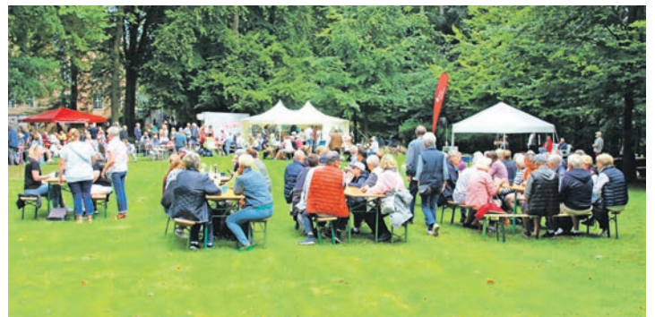
Die Wiese hinter dem Schloss

September an Ort und Stelle. Und in der Region freut man sich schon jetzt auf die 24. Probsteier Korntage 2025!