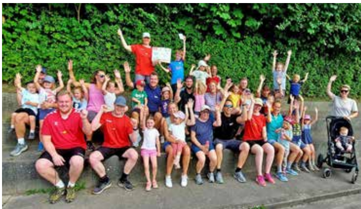
Stolz und froh sind die Lauf-Teams über die erreichte Kilometerzahl.