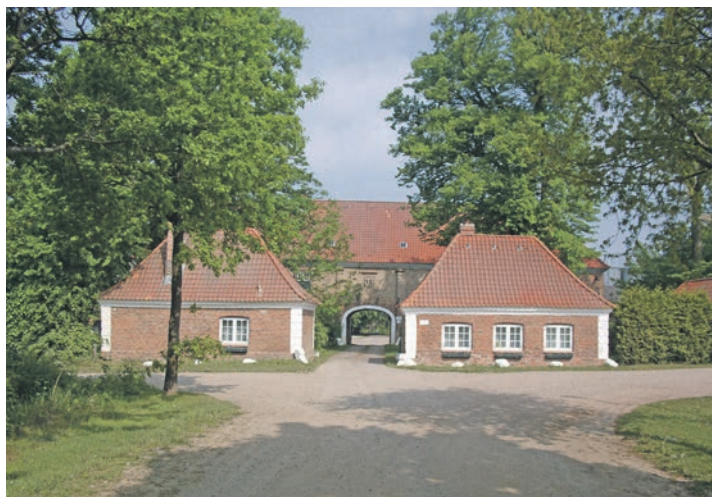
Das Torhaus von Schmoel aus dem Jahr 1699.