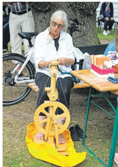
Diese Dame bewegte ihr Spinnrad im Takt zur Musik