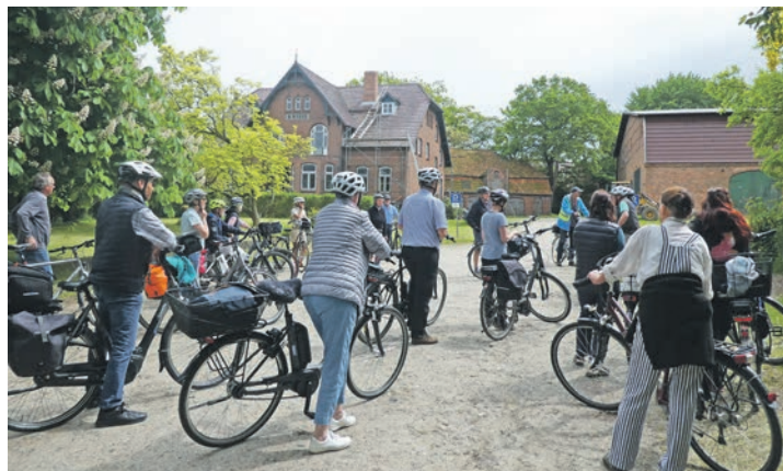
Hof Wiese in Krummbek.

möglichkeit. Bitte Regenschutz nicht vergessen, da nicht nur bei schönem Wetter gefahren wird. Die Teilnahme kostet 4 Euro pro Teilnehmer.