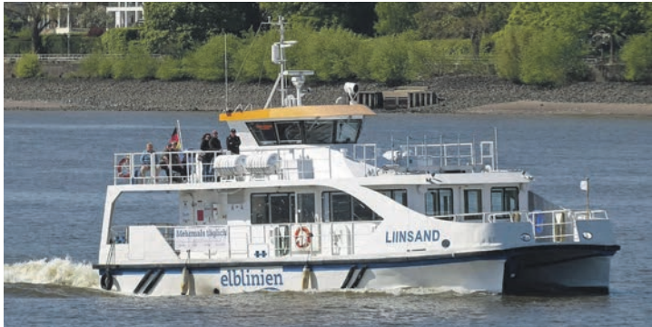
Unter Probsteer-Flagge Kurs Dänemark reisen unsere Leser*innen bei der Premieren-Kreuzfahrt mit dem neuen Highspeed-Katamaran.

Uhr unter Telefon 04521-701130 oder direkt online auf leserreisen.der-reporter.info möglich.