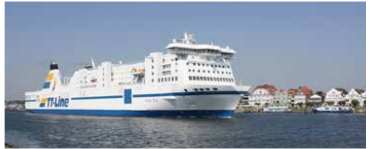
Unterwegs mit den Jumbo-Linern der TT-Line zum großen Jubiläum Kurs Schweden.

Heikendorf/Mönkeberg (t). Ein genussvoller Advents-City-Trip voller Erlebnisse zum einmaligen Superpreis von nur 225 Euro erwartet die Probsteer-Leser zum Top-Termin des Jahres 2024 vom 12. bis 14. Dezember mit dem Genuss-Erlebnis des weltweit einmaligen Lucia-Lichterfestes in Malmö in Schweden, wenn am 13. Dezember die Lichterkönigin mit ihrem imposanten Gefolge – in Weiß gekleidet und mit Lichterkronen geschmückt – zur festlichen Lucia-Feier mit Chören, Sternsängern und festlicher Livemusik mit Umzug und Festauftritt die traditionellen Weihnachtslieder erklingen lässt. Außerdem entdecken die Gäste die malerischen Weihnachtsmärkte am Öresund zum ausgiebigen