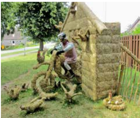
Meine Oma fährt im Hühnerstall Motorrad.

Sei es die angebotenen Kutschfahrten durch die Probstei, die Mühlenbesichtigung mit