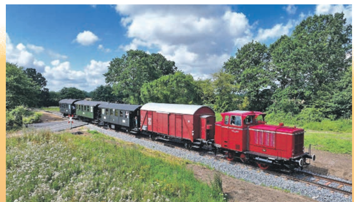
Museumszug am Haltepunkt Stakendorf.

Bahnhofsbereich in Bewegung gesetzt werden.