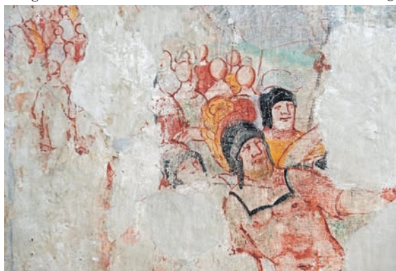
Freigelegte Wandmalerei in der Preetzer Klosterkirche aus der Zeit der Gotik.

und Eiderstede gehören dazu, auch Groß Buchwald und Bissee am Bothkamper See. Obwohl Bistekesse auch in der Urkunde von 1224 als eines der Klosterdörfer genannt wird. An diesem Ort verlässt die Eider den Bothkamper See an seinem Südufer und mäandert im großen Bogen in Richtung Brügge und weiter Richtung Kiel, wo die Eider kurz vor der Fördegen Westensee abbiegt. Von dem Ort „To dem Kyle“ versprach sich Graf Adolf VI, der die Stadt zwischen 1233 und 1242 gründete, hansischen Aufschwung (der allerdings ausblieb). In seiner Stiftung an das Kloster Preetz lässt er über seinen Vorgänger nichts mehr verlauten – stattdessen gibt er sich als Gründer des Nonnenkonvents. Der Graf starb 1261 als Mönch im Kieler Marienkloster, seiner Stiftung. 1261 hatte auch das Preeter Nonnenkloster „Marienfelde“ nach mehrmaligen Umzügen seinen endgültigen Platz in Preetz gefunden und begann in den 1260-er Jahren mit dem Bau seiner Klosterkirche.