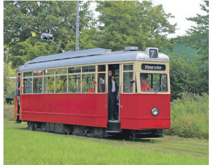
Die Museumsstraßenbahn zieht – wie jeden Mittwoch, Samstag und Sonntag – unermüdlich ihre Kreise auf der Demonstrationsstrecke am Museumsbahnhof Schönberger Strand – hier mit einer Bahn aus Hamburg.

stehen Eisenbahnfahrzeuge etwa aus der Zeit von 1870 bis in die 1950-er Jahre zur Besichtigung. Eine Handhebeldraisine kann im