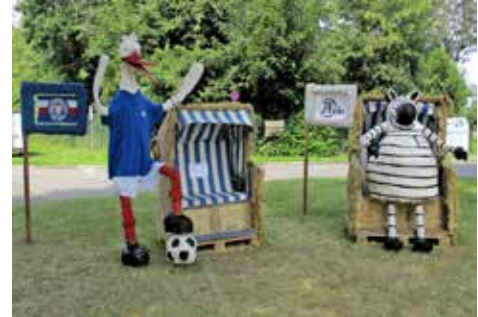
Mit Hand und Fuß zum Erfolg.