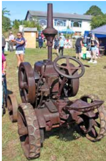
Auch er fährt noch...

Perkams gab einen kurzen Einblick über die verschiedenen Themengebiete auf dem Veranstaltungsgelände: Traktoren jeden Alters sowie Dreschmaschinen, mobile Ausstellungen wie „Dächer der Probstei“ oder „Wie