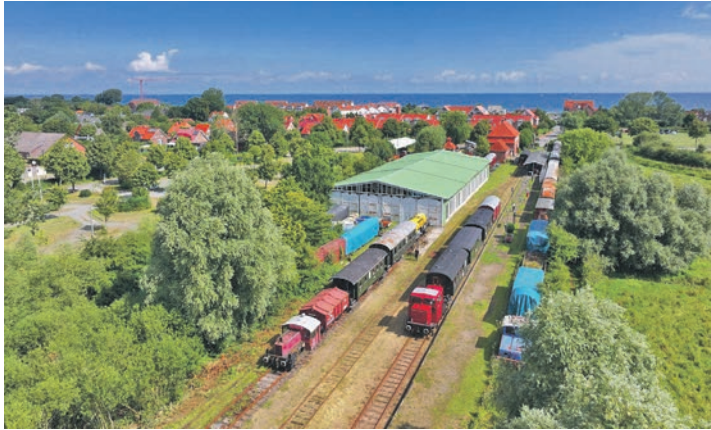
Der Eröffnungszug steht abfahrbereit im Museumsbahnhof Schönberger Strand.

Schönberger Strand erneuert wurde und die Eröffnungszüge gefahren sind. Der Museumszug fährt jetzt sonn-