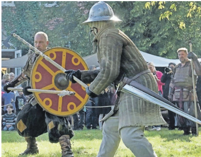
Kampfszene nach mittelalterlichem Vorbild, hier vorgestellt am Kreismuseum in Plön beim Slawentag 2023.

Jahrhundert entwickelten, während der Brandschutz in früheren Zeiten in den Händen des Klosters gelegen habe, ergänzt Christoph Pfeifer. „Die Feuerwehren waren aber auch für das Gesellschaftsleben in den Dörfern von Bedeutung.“ Und auch das Schulwesen werde thematisiert, denn „bis ins späte 19. Jahrhundert befand es sich unter der Regie des Klosters“. So hätten die Dorfschulen immer eine Anbindung an das Kloster gehabt. Der berühmte Limes saxoniae, wohl eine Art Grenzstreifen im Verlauf sich aneinanderreihender Moore, Bäche, Bruch- und Urwälder, verlief auch durch das Gebiet des heutigen Kreises Plön. Dieses Thema werde der Schusterachtverein aufgreifen. Spezielle Fahrradtouren bieten die Gelegenheit, diesen Limes