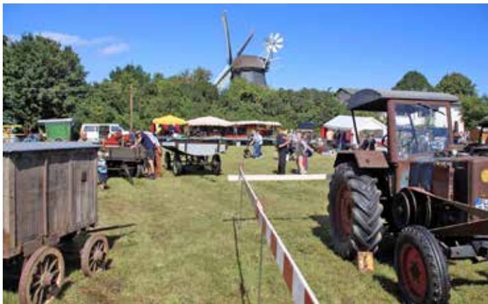
Das Gelände hinter der alten Windmühle.

zwölf und 18 Jahren. Sie haben Interesse an dem Umgang und dem Restaurieren alter Maschinen. Alle zwei Wochen treffen sie sich von 16 bis 18 Uhr. Und dann heißt es: schrauben, schleifen, grundieren und lackieren, was das Werkzeug hergibt.