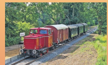
Auf neuen Gleisen erreicht der erste Planzug aus Schönberg (Holst.) den Haltepunkt Stakendorf der Museumsbahn.

Auf dem Museumsgelände des VVM am Schönberger Strand verkehrt außerdem eine historische Straßenbahn mittwochs, samstags und sonntags zwischen 11 und 17 Uhr, jede halbe Stunde und nach Bedarf – und der besteht fast immer. Gleichzeitig ist auch die Fahrzeughalle geöffnet, in der weitere historische Bahnen aus Hamburg, Kiel,