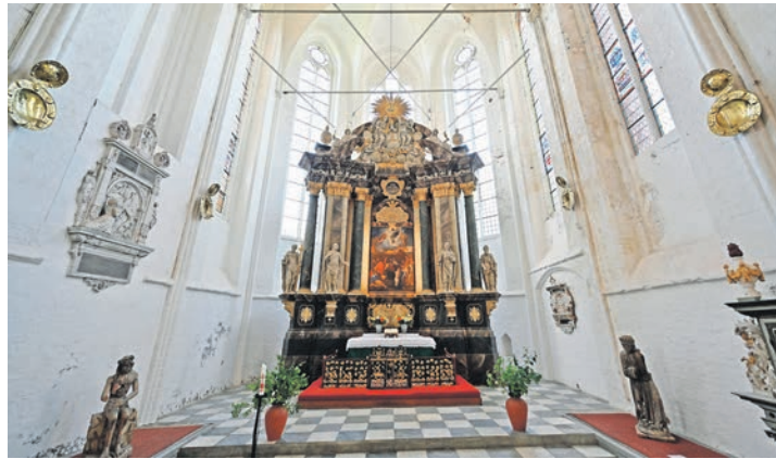
Chorraum der Klosterkirche Preetz.

Die Seefahrer fuhren entlang der Nordseeküste bis Eiderstedt und Eideraufwärts Richtung Westensee. Ein kurzer Weg führte zur För-