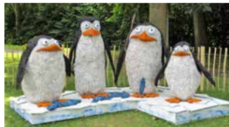
Die Pinguine aus Madagascar.