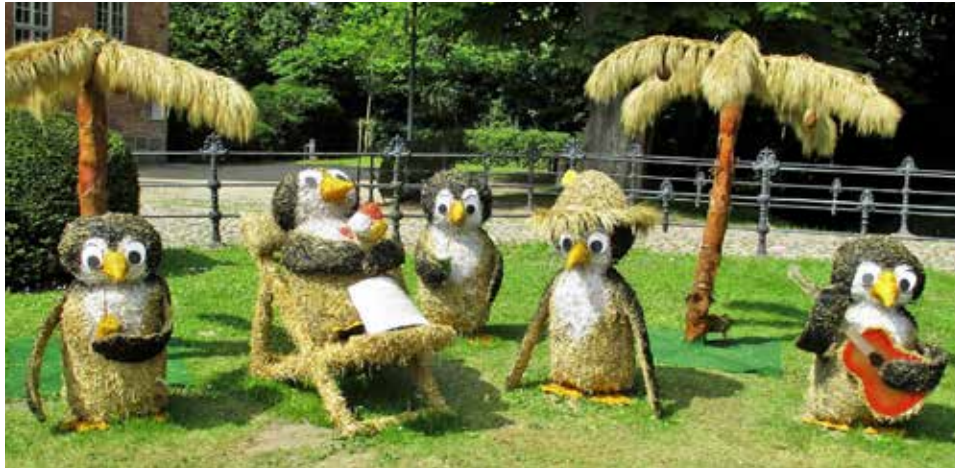
Klimawandel macht es möglich.

Kreis Plön (kas). Die 23. Probsteier Korntage wurden am 27. Juli feierlich in Barsbek eröffnet. Seitdem fahren viele Rad- und Autofahrer sowie Busse aus ganz Schleswig-Holstein die 19 teilnehmenden Orte ab und erfreuen sich an den ideenreichen Strohfiguren. Die Strohkünstler aus der Probstei zaubern im wahrsten Sinne des Wortes: Jahr für Jahr immer wieder neue Strohfiguren. Die locken nicht nur die einheimische Bevölkerung zu einem zünftigen Ausflug, sondern auch Auswärtige und Urlaubsgäste. Insgesamt vier Wochen lang war dazu Gelegenheit -