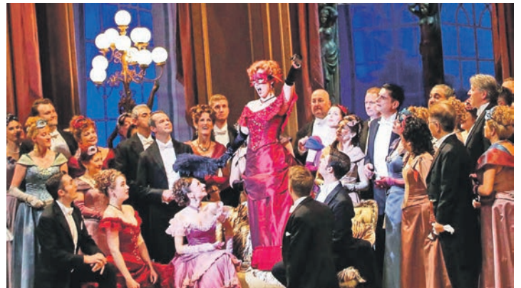
Opulentes Musikvergnügen mit „Der Fledermaus“ und der Sächsischen Staatskapelle erwartet die Leser in der Dresdener Semperoper.

Mönkeberg/Heikendorf (t). Aushängeschild der Semperoper Dresden erwartet mit dem umjubelten Operetten-Erfolg „Die Fledermaus“ von Johann Strauss in einer großartigen Ausstattung und mit einem hochkarätigen Solisten-Ensemble sowie im Orchestergraben mit der weltberühmten Sächsischen Staatskapelle in ganz großer Besetzung