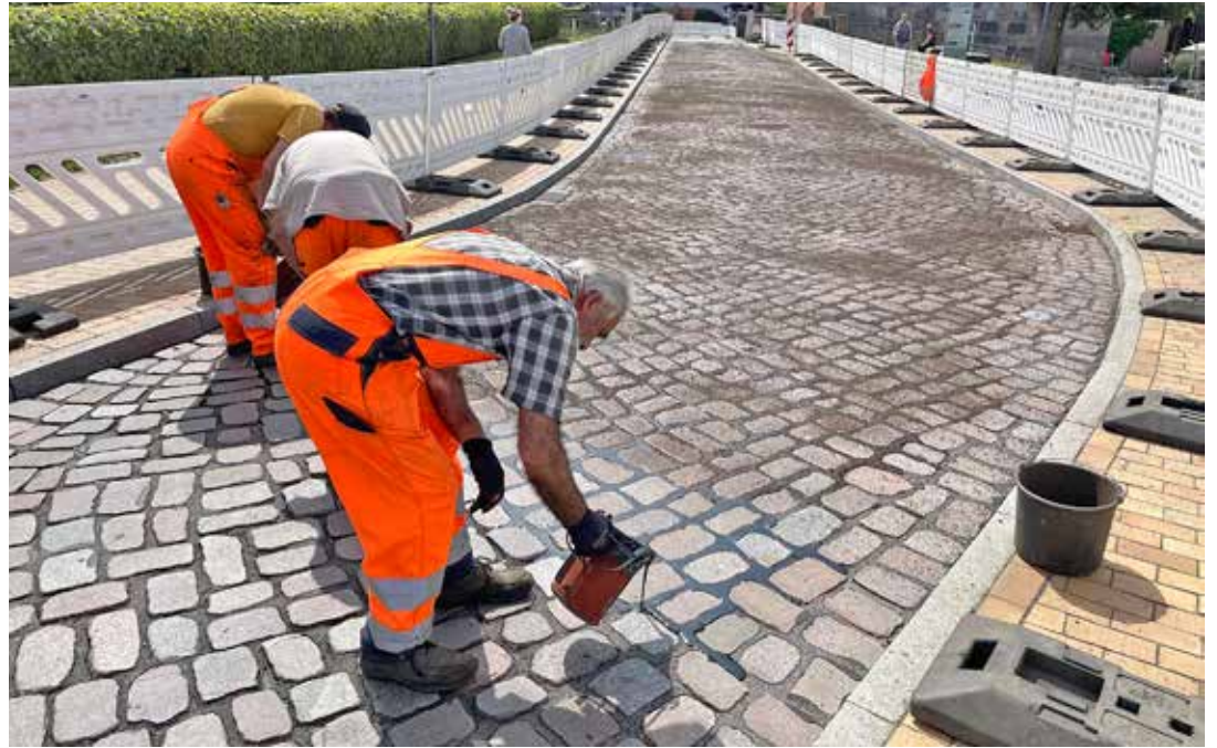
Damit die Fugenmasse besser aushärtet, wird die Fahrbahn mit Splitt abgestreut.

Neumühlen-Dietrichsdorf (mm). Die kurzzeitige Sperrung hat sich gelohnt. Ende Juli war die alte Schwentinebrücke zwischen den Kieler Stadtteilen Wellingdorf und Neumühlen-Dietrichsdorf einige Tage für den Autoverkehr komplett abgeriegelt. Damit eine weitgehend ebene Straße entsteht, wurden die Fugen im Kopfsteinpflaster gefüllt. Grund Obwohl seit Sanierung der Brücke vor anderthalb Jahren die Fahrbahn aus „geschliffenen“ Kopfsteinen besteht, war das Überqueren des historischen Bauwerks kein Vergnügen. Vor allem Radfahrer wurden kräftig durchgerüttelt. Wenige Wochen nach Ende der damaligen Bauarbeiten klafften daumendicke Fugen zwischen