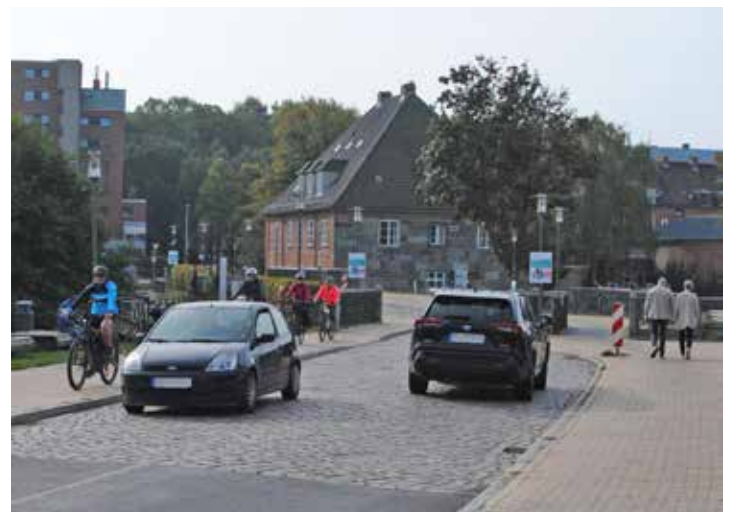
Seit Grundsanierung der Brücke vor anderthalb Jahren müssen Radfahrer die Fahrbahn nutzen. Längst nicht alle hielten sich an diese Vorschrift.