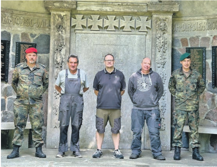
Die Reservistenkameradschaft Schönberg kümmert sich um den Erhalt von Kriegsgräbern.

Schönberg (t). Zur Pflege von Kriegsgräbern trafen sich Ende Juli sechs Kameraden der Reservistenkameradschaft Schönberg auf dem Friedhof in Schönberg. Ihr Ziel: Das Ehrenmal der gefallenen Kameraden aus erstem und zweitem Weltkrieg soll wieder instandgesetzt werden. In einem fünfständigen Einsatz beseitigten sie zunächst die alten Fugen an