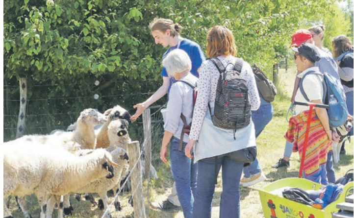
Naturabenteuer bieten Tierkontakte und gemeinschaftliche Naturerlebnisse.