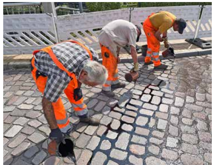
Straßenbauer gießen eine schwarze, klebrige Flüssigkeit in die Fugen zwischen den Pflastersteinen.

den einzelnen Steinen. Rad- und Elektrorollerfahrer standen daher vor einem Dilemma. Seit Sanierung der Brücke müssen sie ohne Wenn und Aber die Fahrbahn nutzen. So schreiben es riesige Schilder beidseits der Straße vor. Doch längst nicht alle hielten sich daran, nutzten verbotenerweise die topfebenen Gehwege. Und riskierten ein Bußgeld. Denn ab und zu kontrollierte das Ordnungsamt. In mühsamer Handarbeit gossen Straßenbauer nun eine schwarze, klebrige Flüssigkeit in die Fugen, die schnell aushärtet. Mit dem Gehoppel auf der Fahrbahn dürfte jetzt endgültig Schluss sein. Überflüssig werden dürften damit auch Überlegungen, Radfahrer mit anderen Maßnahmen auf die Fahrbahn zu zwingen, etwa mithilfe von Bremsbügeln auf dem Gehweg.