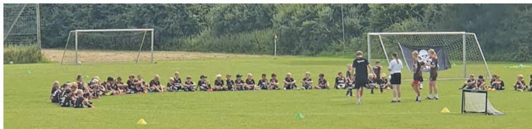
Rbaukencamp am Seekrug - knapp 60 Kinder haben teilgenommen.

Wer noch Lust und Laune hat, mit dem SV Knudde 88 Giekau in die neue Saison zu starten, kann