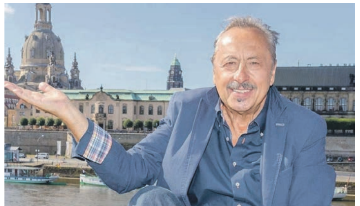
„Stubbe“ als Gefängniswärter „Frosch“ begeistert stets die Besucher der Semperoper.

tige Karten in allen Kategorien buchbar!). Am zweiten Tag ist eine erlebnisreiche Panorama-Rundfahrt ins winterliche Erzgebirge zum Sonderpreis von nur 15 Euro zusätzlich buchbar. Zum Abschluss der Reise können die Leser am Sonntagvormittag den Besuch der Frauenkirche Dres-