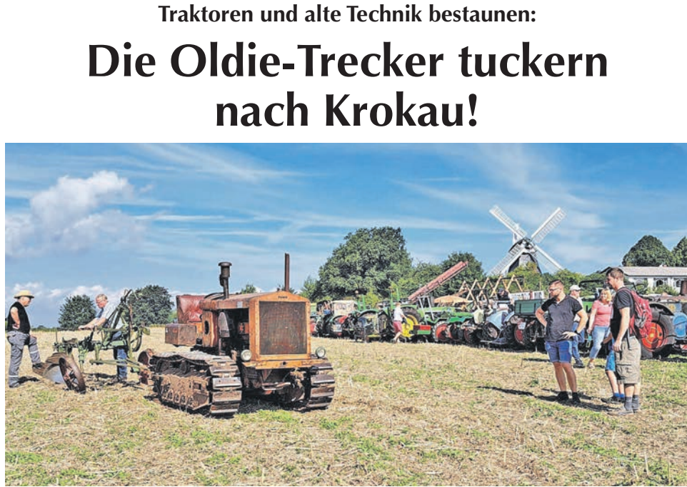
Am Wochenende steht die alte Technik der Landwirtschaft in Krokau im Mittelpunkt. Mehr dazu auf Seite 3

Seebestattung mit der MS Mira auch ab Laboe! Neumühlen-Dietrichsdorf & Heikendorf • Telefon 0431 / 20 27 67 (Tag und Nacht) • www.bischoff-bestattungshaus.de