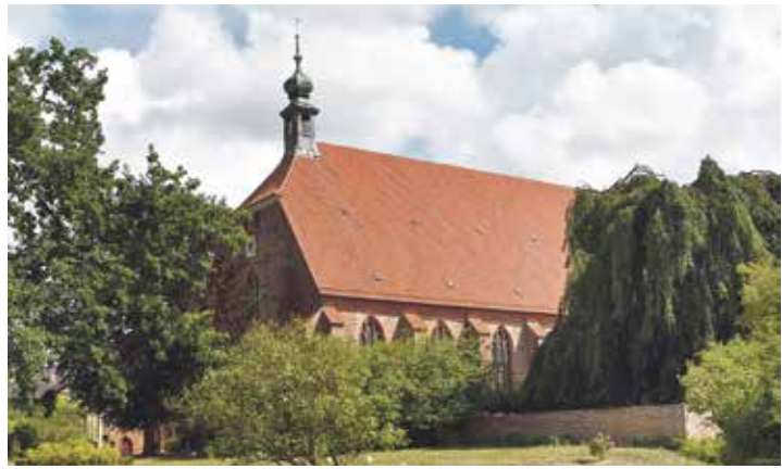
Die Klosterkirche kann im Rahmen der Führungen dienstags, mittwochs, donnerstags und sonnabends um 15 Uhr besichtigt werden.

Nur an eindeutigen Stellen wird die Malerei ergänzt, etwa bei Ausbrüchen der Fugen oder Kratzern: „Wir retouchieren nur, wo wir uns