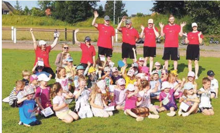
Mini Sportabzeichen beim TV Laboe - ein echtes Abenteuer.

Laboe (t/los). 38 Leichtathletik-kinder des TV Laboe im Alter von 4 bis 6 Jahren haben am 15. Juli 2024 das Mini Sportabzeichen im Rahmen eines Aktionstags gemacht. Seit Anfang Mai wurden die einzelnen Disziplinen in fünf Stationen immer montags auf dem Sportplatz geübt. Balancieren, Werfen, Slalom- und Zickzacklauf, Sprungvarianten und Laufen steckten das Spektrum der sportlichen Herausforderungen ab. Zugrunde liegen Koordination, Ausdauer und Kraft, die auch beim Sportabzeichen für „die Großen“ gefordert sind. Eingepackt waren diese jedoch in eine lustige Abenteuer-geschichte, die von der „Suche nach dem verschwundenen Piratenschatz“ handelte