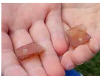
Ein Junge zeigt, was er aus Bernstein gemacht hat.