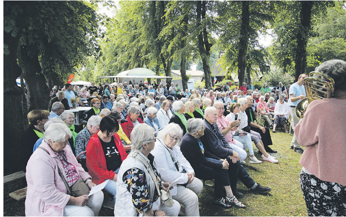
Zum Gottesdienst spielte der Posaunenchor aus Giekau.