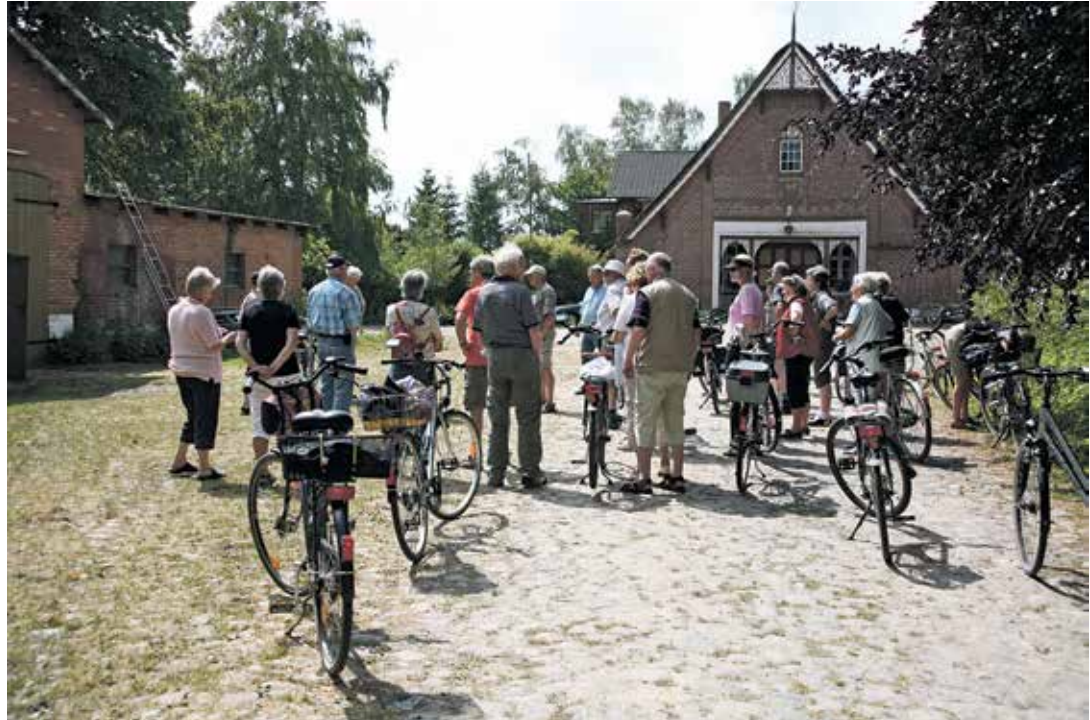
Sehenswert: Der Hof Hof Vöge-Lesky in Ratjendorf liegt auf der Strecke.

Durch teilweise schon abgeerntete Raps- und Getreidefelder führt die Fahrt zum ehemaligen Meierhof Ottenhof, ab hier begleitet die Salzau, einer der beiden Zuflüsse des Selenter Sees, die Rad-