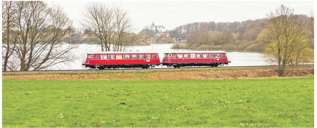
Ein historischer Schienenbus fährt durch die reizvolle Landschaft der Holsteinischen Schweiz.

Kreis Plön/ Ostholstein (t). Der Verein „Historische Eisenbahn Holsteinische Schweiz“ lädt für Sonnabend, 3. August, zu Fahrten mit Schienenbus, Draisine und Schiff durch die Holsteinische Schweiz ein. Im Oldtimer Schienenbus geht es von Neumünster über Kiel und Plön nach Malente-Gremsmühlen und Eutin. Von Malente aus lässt sich zudem eine Draisinenfahrt Richtung Lütjenburg oder eine 5-Seen Fahrt zubuchen. Die Abfahrten sind in Neumünster Hauptbahnhof um 10.46 Uhr, in Kiel Hauptbahnhof um 11.28 Uhr und in Plön um 12.25 Uhr. Malente wird um 12.34 Uhr erreicht. Dort ist Umstieg zu den Draisinen (Abfahrt 13 Uhr) oder zum Schiff (Abfahrt 14 Uhr) möglich. Die Schienenbusfahrt endet um 12.41 Uhr in Eutin. Auf eigene Initiative ist eine Rundfahrt auf dem Eutiner See (Stadtucht) ab 14 Uhr möglich. Zurück geht es um 16.16 Uhr von Eutin und um 16.23 Uhr von Malente. Ankunft in Plön um 16.32 Uhr, in Kiel um