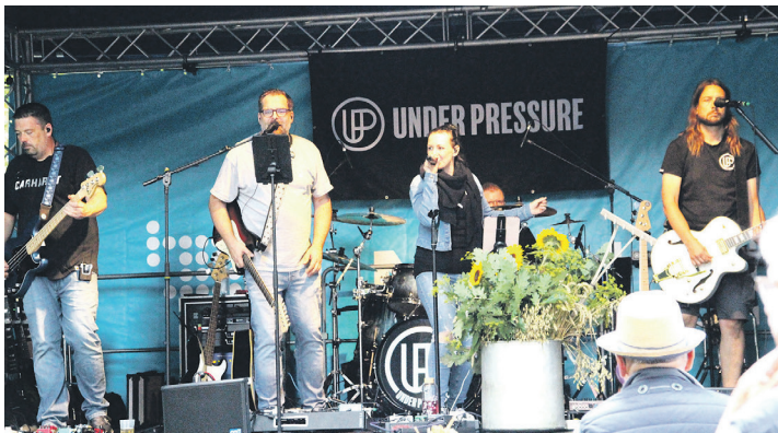
Die Band „Under Pressure“ spielte bekannte Stücke des Rock- und Popgenres.

rer in die 60-er bis 80-er Jahre mit ihren gesanglich tollen Titeln und Stimmen. Die anderen Hoheiten wurden zwischenzeitlich vorgestellt. Es waren drei Erntepinzessinnen, die Rapsblütenkönigin mit Prinzessin von der Insel Fehmarn, die Lammkönigin mit Prinzessin aus Nordfriesland, die Rapsblü-