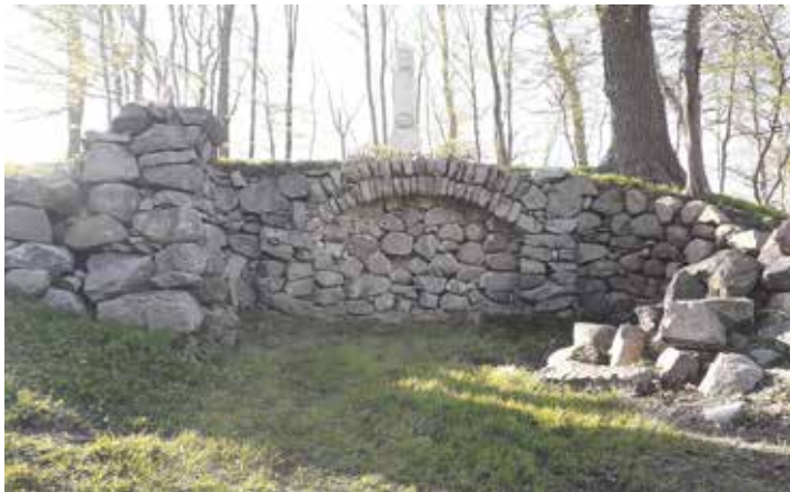
Eine Grotte mit Stele befindet sich im Park von Gut Salzau.

Die nächste Radwanderung führt am 20. August 2024 nach Stein.