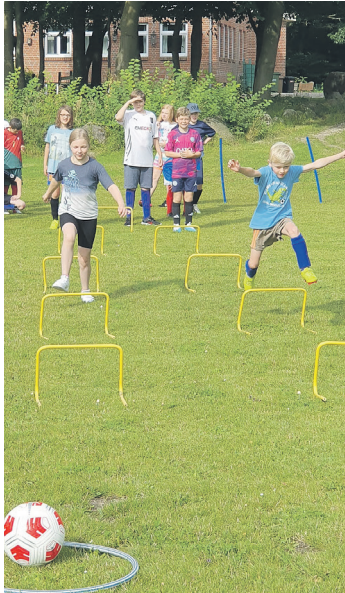
Wer erreicht beim Hürdenlauf als Erster den Ball?

Giekau (t). Pünktlich zu den Ferien startete auch in diesem Jahr der Kinderferienpass der Stadt Lütjenburg. Zahlreiche Veranstaltungen bieten Kindern im Alter von 6 bis 13 Jahren viele Möglichkeiten, Abenteuer zu erleben. Unter anderen wurde beim SV