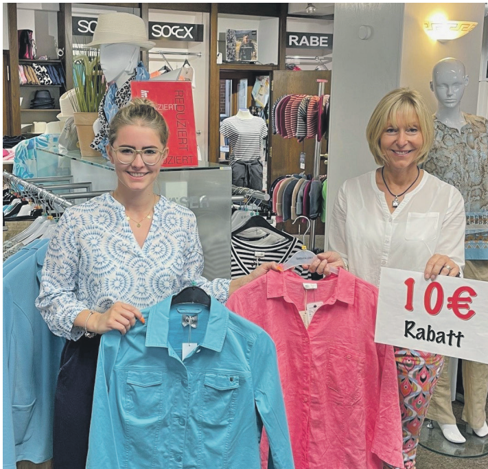
Wer leichte und frische Sommerbekleidung sucht, kann diese Woche beim Modehaus Lindau auf Schnäppchenjagd gehen.

im Sommerschluss-Verkauf zu finden. Als besonderes SSV-Highlight gibt es bei Lindau noch bis Sonntag, 4. August, zusätzlich 10 Euro Rabatt ab einem Einkauf von 79,95 Euro. Am Sonntag ist das Modehaus in Schönberg wegen des Flohmarktes von 11 bis 15 Uhr geöffnet. Die Strandfiliale „Ostseebrise“ am Schönberger Strand ist jetzt täglich von 12 bis 18 Uhr (sonntags bis 17 Uhr) geöffnet. Das gesamte Team freut sich auf ihren Besuch