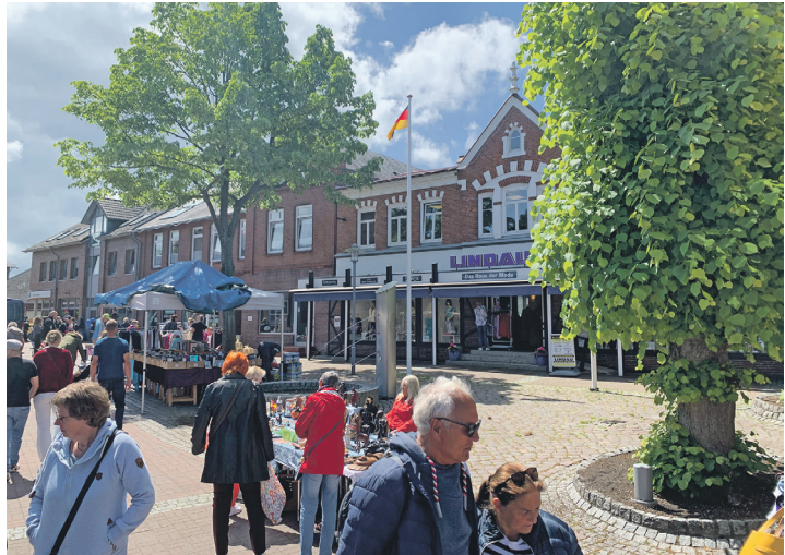
Am Sonntag, 4. August, findet in Schönberg ein Flohmarkt statt. Auch einige Betriebe öffnen anlässlich dieser Veranstaltung.

sucher und auch Urlaubsgäste werden sich freuen und diesen Tag für einen ausgiebigen Flohmarktbummel und eine kleine Shopping Tour durch die Schönberger Geschäfte nutzen und später vielleicht auch noch einmal einen Ausflug in die Strandbereiche Schönbergs machen. Auch das Wetter soll wieder mitspielen für den entspannten Erlebnisrundgang durch den Ortskern. Die ansässigen Restaurants und Cafés und Eisdieleen sind auch am 4. August wieder geöffnet und bieten den vielen Besuchern das bewährte kulinarische Angebot. Die teilnehmenden Betriebe freuen sich auf Ihren Besuch. Auf nach Schönberg!