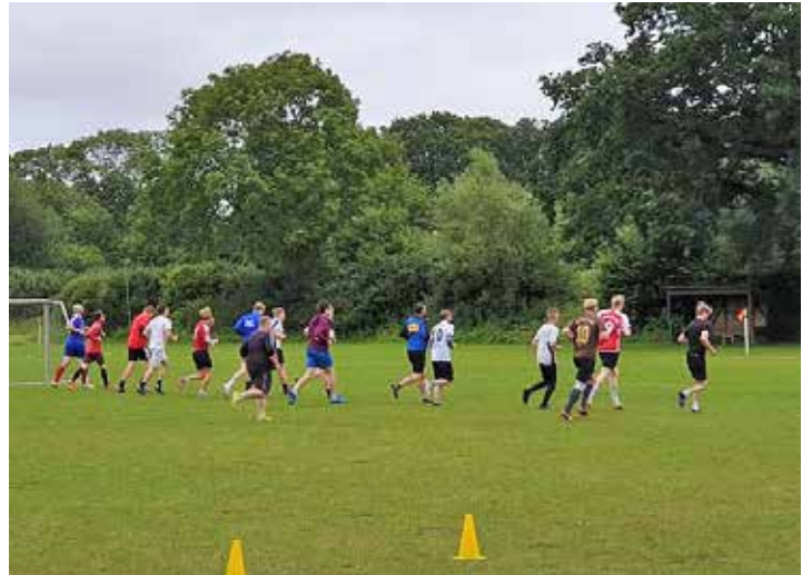
Derzeit bereiten sich die Herren des SV Knudde 88 Giekau für die Kreisklasse C vor.