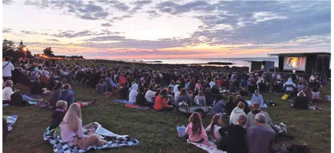
Im August startet wieder die Veranstaltungsreihe Kino am Meer.

Kalifornien/ Schönberg (t). Es ist wieder soweit: im August wird der Deich in Kalifornien zum Treffpunkt für Kinofans und Musikliebhaber. Beim Kino am Meer werden dann jeden Dienstag im August großartige Blockbuster auf dem Deich gezeigt. Das Open-Air-Kino bietet neben den Filmen auch einen atemberaubenden Blick aufs Meer und spektakuläre Sonnenuntergänge. Bevor die Filme, im Licht der Abenddämmerung um zirka 21.15 Uhr starten, können sich die Gäste ab 19 Uhr auf musikalische Unterhaltung mit Live-Musik von Bands und Solokünstlern aus der ganzen Republik freuen. Für das leibliche Wohl sorgt das kultige Gastroschiff „Ankerplatz 4“. Liegestühle und Sitzsäcke mit Weinkisten als Tische und Laternen schaffen eine gemütliche Atmosphäre. Der Eintritt ist frei, also hinsetzen, entspannen und genießen. Für die Musiker geht während der Konzerte der Hut herum. Den ersten Kinoabend am Dienstag, 6. August eröffnet Adam Wendler. Der kanadische Folk-Pop Multiinstrumentalist aus Ontario lebt zurzeit in Berlin. Seit vielen Jahren schreibt er seine eigenen Songs und teilt diese mit der Welt. Adam Wendler hat bereits vier Alben veröffentlicht – zuletzt 'The Compass LP', ein "Compilation Album", welches seine vielseitigen Songwriting-