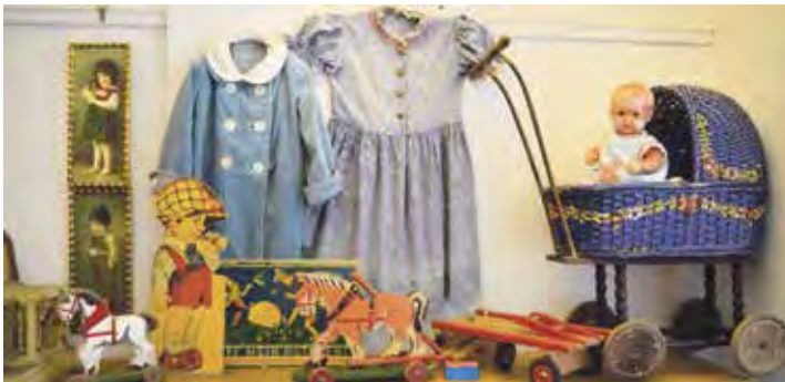
Historisches Spielzeug und Kinderkleidung spiegeln die Welt des Nesthäkchens - Grund genug, für einen Besuch in der Ausstellung des Kindheitsmuseums.

Wunsch des Verlegers und erzählen von Annemaries Kindern und Enkelkindern.