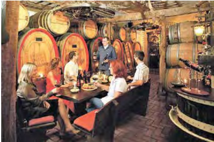
Stimmungsvolle Stunden erwarten die Leser zur Weinlese am Rhein zum Feiertags-Termin.

Hotelzimmer und lobenswerte rheinische Gastlichkeit vom großen Frühstücksbuffet bis zu den abendlichen Schlemmerbuffets. Umgeben von weltberühmten Weinbergen genießen die Gäste zudem preisinklusive herrliche Bus-Panorama-Ausflüge und zwei großartige Fluss-Kreuzfahrten auf Rhein und Mosel.