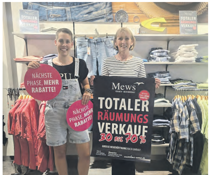
Die Mitarbeiterinnen laden zum Räumungsverkauf ein.

vielfältige Auswahl an Modeartikeln „bei Mews“ freuen. Besonders hervorzuheben ist der verkaufsoffene Sonntag am 28. Juli 2024. An diesem Tag haben modebewusste Käufer von 11 bis 16 Uhr Gelegenheit, im Modehaus Mews zu shoppen.