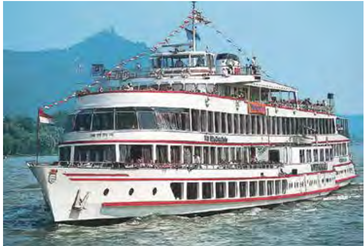
Herrliche Rhein- und Mosel-Kreuzfahrten gehören zum großen Genießerprogramm der Probsteer-Sonderreise im Oktober zur Zeit der Weinlese.

Zum großen Leistungspaket gehören neben der Fahrt im erstklassigen Fernreisebus ab Kiel, Schwentinental und Preetz drei Übernachtungen im Winzer-Hotel nebst Gästehaus direkt am Rhein mit dreimal Schlemmerfrühstück vom Buffet und drei Abendessen im Hotel als Buffet oder Drei-Gang-Menü. Zum