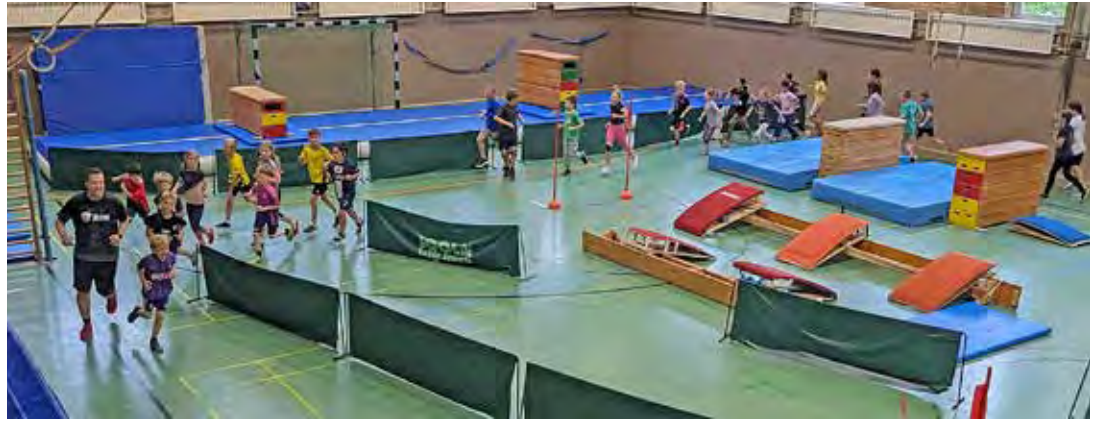
Nach dem Aufwärmen bewältigten die kleinen Ninjas verschiedene Hindernisse.