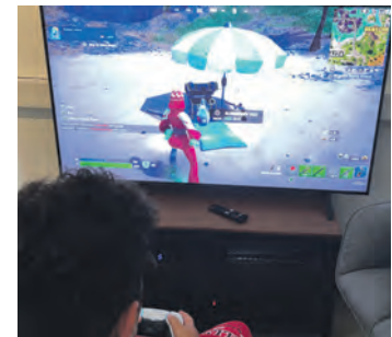
Ein Junge testet die „PlayStation 5“.

sehr zügig gegangen und neben der reichhaltigen technischen Ausstattung sei der Raum gründlich renoviert worden. Schon jetzt zählt sie im Jugendtreff pro Tag durchschnittlich rund dreißig Jugendliche im Alter von 10 bis 17 Jahren. Tendenz steigend. Mitunter sei der Zulauf so groß, „dass Mitarbeiter Mühe hätten, die vielen neuen Namen zu ler-