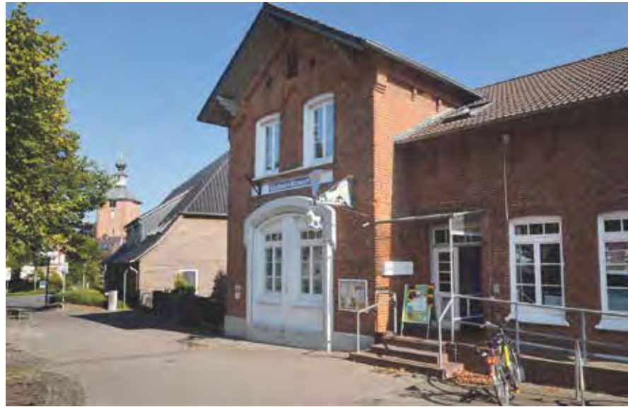
Das Kindheitsmuseum Schönberg in der Knüllgasse lädt zur Lesung aus der Reihe Nesthäkchen ein. Die Autorin Else Ury kam im KZ Auschwitz-Birkenau ums Leben.

verkauft. Else Ury schrieb die Manuskripte ihrer Bücher handschriftlich mit Bleistift und benutzte dafür oft Schulschreibhefte. Ihre Bücher wurden in mehrere Sprachen übersetzt und fanden Verbreitung in Holland, Schweden, Schweiz, Frankreich, Norwegen und in den USA. Weitere Informationen über die Kinderbuchautorin Else Ury und ihre Biografie gibt es im Rahmen der Lesung erfahren.