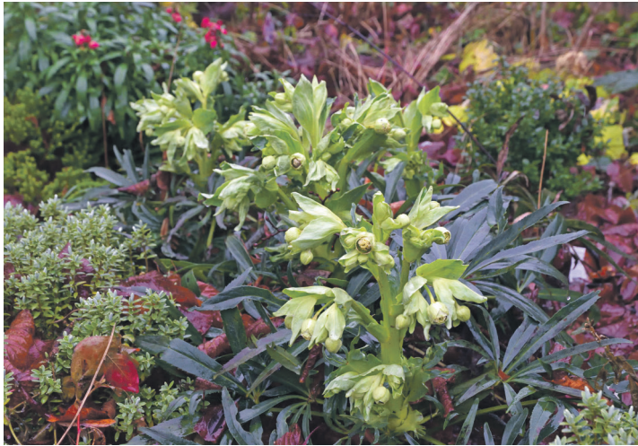
Die grüne Nieswurz Helleborus foetidus ist eine Insektenweide in den Wintermonaten, auch wenn man es zu der Zeit kaum vermuten würde. Hummeln fliegen mitunter bei wenigen Plusgraden los.

öffnen häufig schon im November ihre Blüten voller Pollen und Nektar. Idealerweise ist der Boden locker und humushaltig und der Standort halbschattig bis sonnig. Dann ergibt auch die Englische Heide ( Erica darleyensis ) einen großartigen Partner dazu, denn sie zeigt ebenfalls ab Oktober erste Blüten – und das bis Ende April. Auf ein saures Bodenmilieu ist sie übrigens nicht angewiesen. Ein paar Lenzrosen ( Helleborus orientalis ) dazugepflanzt wird das Blütenangebot ab Februar noch reichhaltiger. Wo Halbschatten gegeben ist, kann zudem die Palmblatt-Nieswurz ( Helleborus foetidus ) wunderschöne Akzente setzen. Die Pflanze blüht ab Januar in leuchtendem hellen Grün. Alle Insekten, die im Jahr früh unterwegs sind (Hummeln fliegen ab wenigen Grad Celsius los), finden in ihren Blüten eine wichtige Nahrungsquelle. Tipp: Eine dicke Schicht verrottendes Herbstlaub versorgt diese Nieswurz mit den nötigen Nährstoffen. Je vitaler sie ist, desto eher versamt sich das eher kurzlebige Gewächs, das wie die Christrose in lichten Wäldern Europas zuhause ist.