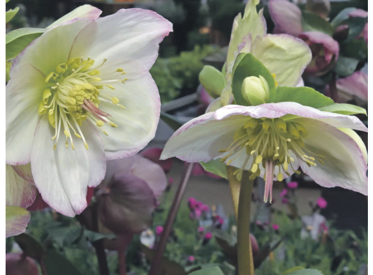
Wer Herbstbeete plant und vorbereitet, sollte auch an Christrosen und ihre Verwandten denken. Frühe Vertreter von Helleborus niger blühen bereits im November auf.

Die Bergminze ( Calamintha nepeta ) zählt zu den Stauden mit der längsten Blütezeit. Sie hat duftendes Laub. Ab Juli öffnet sie ihre kleinen zartblauen Blüten. Häufig sind diese noch Anfang