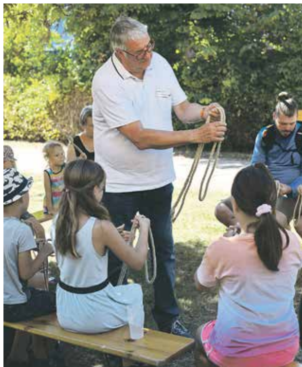
Im Rahmen der Reihe der Ferienaktionen zeigt das Probstei Museum die Herstellung von Seilen und Knotentechniken.

Zunächst wird die museumseigene Seilwinde und ihre Funktion erläutert. Anschließend wird damit in einer gemeinsamen Aktion ein langes Seil gedreht. In der Landwirtschaft wurden Seile früher für verschiedene Zwecke eingesetzt. Sie wurden beispielsweise dazu benutzt, um Tiere auf der Weide anzupflocken oder die Ernte auf dem Wagen festzuzurren. Auch Kinder nutzten Seile bereits früher zum Springen und Spielen. Im Anschluss haben die Kinder und Erwachsenen die Möglichkeit, einige Knotentechniken an Kurzseilen zu erproben und alte Springseil-Spiele nachzuspielen.