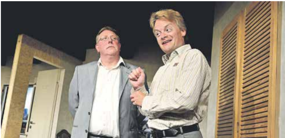
Fotograf Hans-Dieter Spitzeck (Christian Becker) sieht in seinem Zimmernachbarn einen Freund. Doch der ist Profikiller (Jan Steffen). Mehr zu der Komödie auf Seite 3.