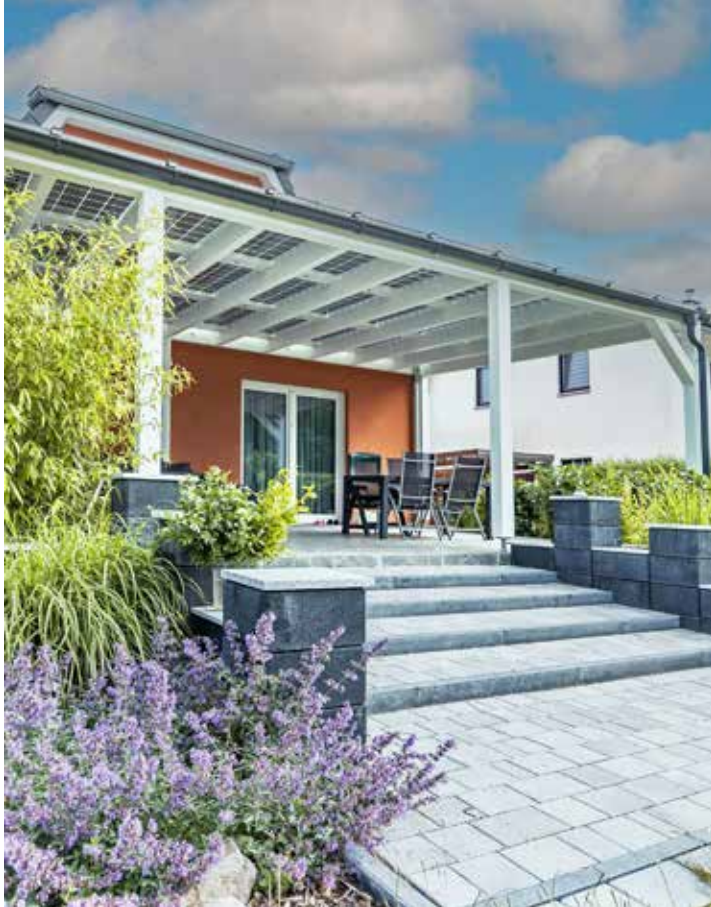
Ein Terrassendach mit Solarelementen spendet Schatten an sonnigen Tagen und gewinnt gleichzeitig umweltfreundliche Energie.

Solarzäune schaffen Sichtschutz und Privatsphäre und machen sich zudem durch den erzeugten Strom mit der Zeit von allein bezahlt. Experten empfehlen dabei sogenannte Duplex-Elemente: Sie können auf beiden Seiten Solarenergie gewinnen und somit den Ertrag nochmals deutlich steigern. Bereits 25 laufende Meter Zaun reichen aus, um bis zu 4.000 Kilowattstunden Strom zu gewinnen.