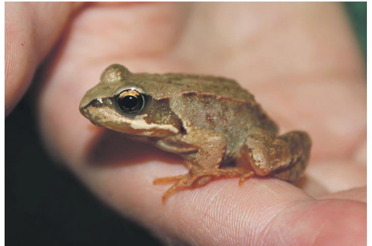
Auf der Tour durch die Natur gibt es manche Begegnung - zum Beispiel mit kleinen Fröschen.

zwei Terminen, Mittwoch, 24. Juli und Freitag, 30. August statt, jeweils um 10 und 14 Uhr. Pro Tour sind die kleinen Naturentdecker rund zwei Stunden unterwegs. Auf dem Programm stehen Aktivitäten wie zum Beispiel die Suche nach Bachflohkrebsen und Egel in der Hagener Au. Pro Kind kostet die Teilnahme 5 Euro.