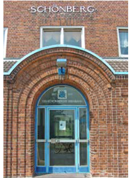
Der Schönberger Bahnhof.

Tipp: Die nächste Tour führt am 6. August 2024 nach Salzau.