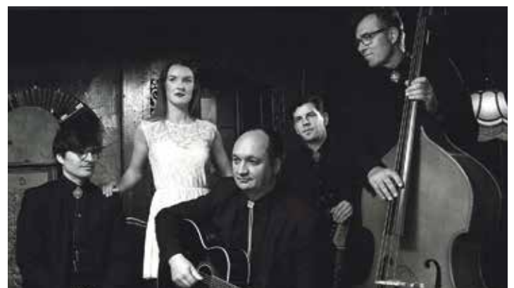
A Tribute to Johnny Cash - The LineWalkers –

Dabei fehlt es nie an Unterhaltung und Spaß. Das Publikum ist Teil des Ganzen und wird auch tanzend seiner Rolle gerecht. Wie beim „echten“ Johnny-Cash-Konzert gibt es die großen Hits oder auch mal ganz spezielle Songs auf Zuruf, so das wirklich jeder auf seine Kosten kommt. Dabei ist schon so mancher Saal aus den Fugen geraten, wenn „Ring Of Fire“ oder „Ghost Riders In The Sky“ erklingt. Also nicht verpassen, „Walk The Line“!