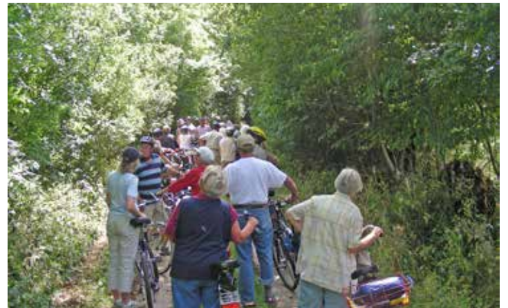
Radeln auf historischen Wegen: Der Redder bei Gödersdorf.

Liebe Weißwurst-Fans! vom 18. - 20.7.24 sind wieder Weißwurst-Tage Öffnungszeiten: