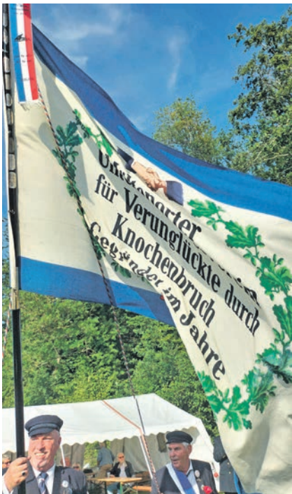
Während des Umzugs marschieren Gildebrüder mit der Fahne vorneweg. Das alte Motto ist nach wie vor gültig: „... für Verunglückte durch Knochenerbruch“.

es eine Ehre, den neuen König vertreten zu dürfen. Gildemusikanten und bestes Sommerwetter begleiteten den traditionellen Fahnumzug durch den Ort. Perfekt zum strahlend blauen Himmel passte, dass dieses Jahr erstmals Kinder Gelegenheit hatten, anlässlich des