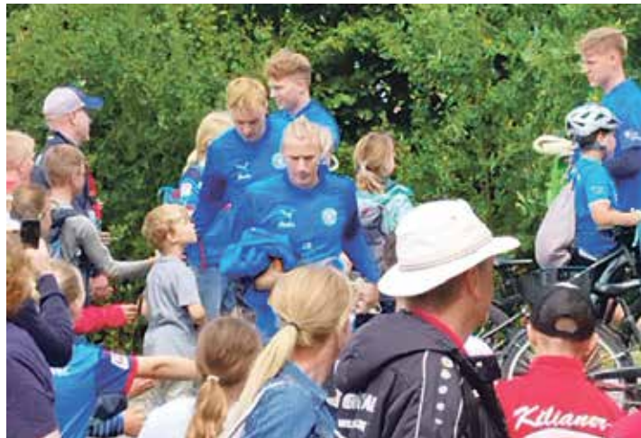
Volksnah: Die KSV beim Saisonauftakt in Gettorf.

ven und Ersatzspieler. Auch nach dem Spiel war er zu keiner Stellungnahme bereit und verließ das Stadion schnell. Kaum tröstlich: Für ihn gibt es bei dieser EURO sicherlich keinen Einsatz mehr. Trotzdem zeigte die DFB-Elf erneut ein starkes Spiel und schied mehr als unglücklich aus dem Turnier aus. Coach Julian Nagels-