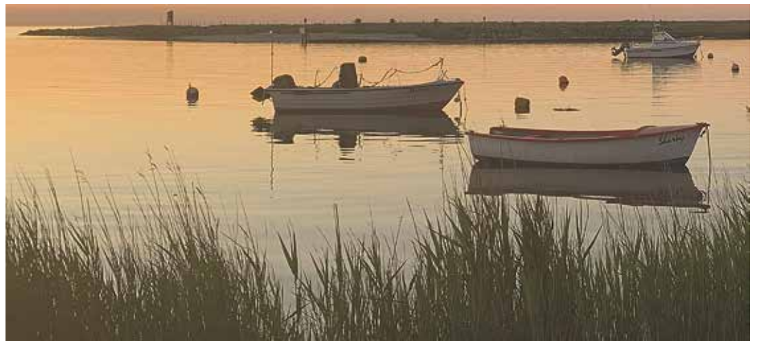
Im schummerigen Abendlicht zaubern diese Fischerboote eine stimmungsvolle Atmosphäre.

Bereits am Nachmittag singt der Shantychor Paloma aus Neumünster und DJ Nils legt Musik auf für die Kinderdisco. Von 18 Uhr an steht dann Disco mit NDR-Moderator Nils Söhrens auf dem Programm. Eine ganz besondere Attraktion ist für die Zeit der Dämmerung geplant: das Wasserfeuerwerk „flames of water“, eine Komposition aus Wasser, Licht und Musik. Einen