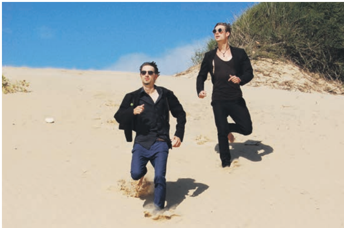
Die Brüder von Tanga Elektra mit ihrem unverwechselbaren Sound aus Neo-Soul, Elektro und Funk-Elementen.