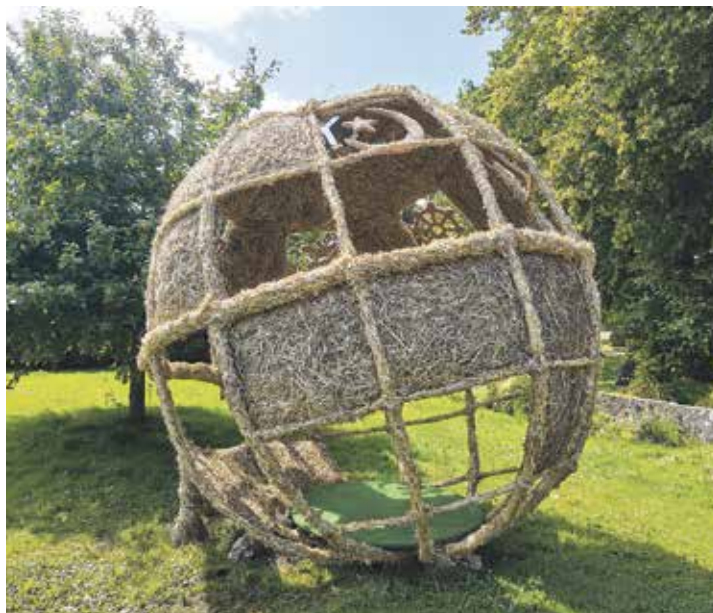
Nicht nur die Strohfürer aus Bendfeld und Barsbek (Titelseite) zeugen von der Kreativität der Teams aus den Probsteier Dörfern.