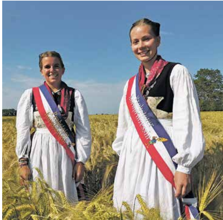
Die Kormajestäten präsentieren die Probstei bei offiziellen Anlässen.

Shaun das Schaf, die Ottifanten oder ein Buckelwal, kunstvoll