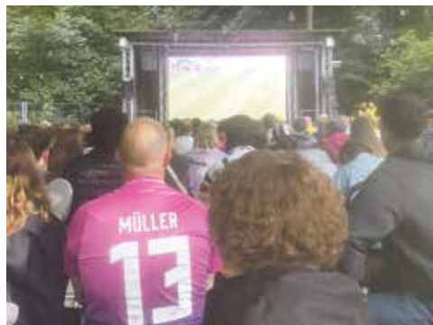
Trauer nach dem DFB-Aus auch in der Forstbaumschule.

Kreis Plön (dif). Die Europameisterschaft 2024 im eigenen Land endete für Deutschland am vergangenen Freitag gegen Spanien. In einem dramatischen Viertelfinale unterlag das Nagelsmann-Team den Iberern mit 1:2 (0:0) n.V. Der Leipziger Olmo brachte den Turnierfavoriten mit 1:0 in Front (51.), Florian Wirtz glich für die Gastgeber in Minute 89 aus. In der Verlängerung war Deutschland dann das klar bessere Team, kassierte aber eine Minute vor dem Ende durch Merino den „k.o.“. Vorher hatte der mehr als schwache Unparteiische Taylor aus England ein klares Handspiel des Spaniers Cucurella übersehen, ja nicht einmal via TV angeschaut. Überhaupt lieferte der überheblich auftretende Taylor ein echtes Skandalspiel ab, verteilte ohne Not und Linie gefühlte 50 Karten- am Ende waren es 15 und eine gelb-rote- an die Akti-