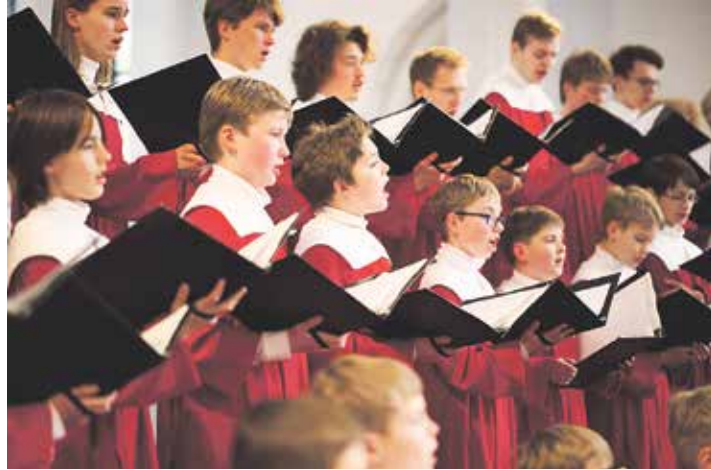
Der Kieler Knabenchor singt am Sonnabend in Preetz.

Der Kieler Knabenchor wurde vor mehr als 50 Jahren gegründet und als schulübergreifende Arbeitsgemeinschaft aller Kieler Schulen organisiert. Er wird so-