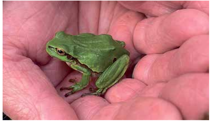
Auf gute Nachbarschaft: Der Tag der Offenen Tür soll für die tierischen Bewohner des Schutzgebietes sensibilisieren.

Rinder im Naturschutz (an der Highlander-Weide) – Sechste Station: Insektenwand und Bienenpflanzen (nach der Highlander-Weide) Außerdem werden gegen 14 und 16 Uhr zwei kurze Exkursionen angeboten, bei einem Vogelquiz und einem Pflanzenquiz kann man das eigene Wissen prüfen. Alle Aktivitäten werden fachkundigen Gruppenmitglieder betreut, die sich auf viele Fragen