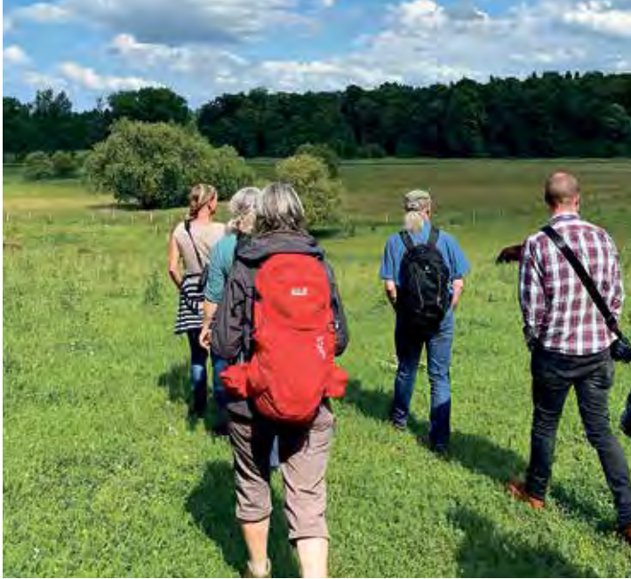
In der Weinbergsiedlung von Schwentinetal lassen sich wilde Orchideen, beruhigender Baldrian und gemütliche Galloways entdecken.

Orchideen, den kleinen Baldrian und eine Vielfalt an wilden Kräutern entdecken, die in diesem geschützten Gebiet, das sonst nicht zugänglich ist, gedeihen. Die Route ist sorgfältig geplant, um den Besuchern die faszinierende Flora und Fauna dieses Gebietes im Schwentinetal nahezubringen und gleichzeitig informative Einblicke in die nachhaltige Bewirtschaftung und den Naturschutz zu geben. Nach der Wanderung erwartet die Teilnehmer ein kulinarischer Abschluss: Ein kleiner Imbiss (Preise laut Aushang) vom Verein „Weidelandschaften“, der für seine Spezialitäten aus Galloway-Rindfleisch bekannt ist.