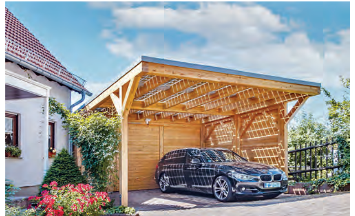
Praktische Lösung: Ein Solarcarport liefert Energie fürs E-Auto.

Batterien sorgt, stellt zumeist die bequemste Lösung dar. Sowohl die ökologische als auch die finanzielle Bilanz fällt dabei noch besser aus, wenn der Strom dafür aus eigener Gewinnung stammt - zum Beispiel von einem Carportdach, das mit Photovoltaikmodulen (PV) bestückt ist.