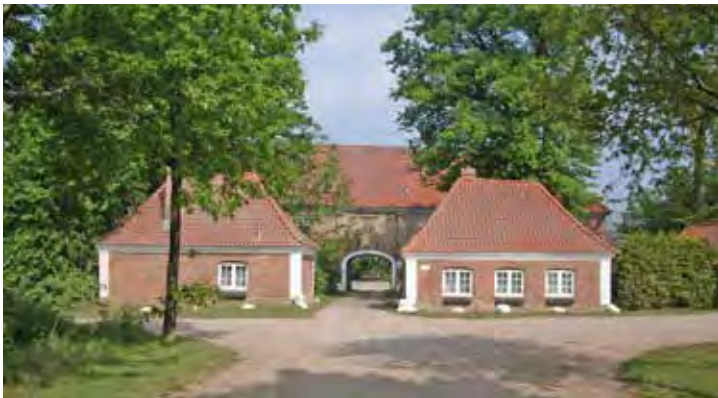
Das alte Torhaus des Gutes Schmoel stammt aus dem Jahr 1699.

Grenzgraben zur Probstei überquert und nach kurzer Zeit die Ortschaft Stakendorf erreicht. In den Dörfern Bendfeld und Stakendorf ist die ursprüngliche Dorfanlage als Rundling noch gut zu erkennen. Auch in Stakendorf sind zahlreiche Bauten von Hermann Götsch zu bewundern. Nach weiteren 4 Kilometern ist am Ortseingang von Schönberg mit der „Villa Dietrich“ der wohl prächtigste Bau von Hermann Götsch zu bewundern. Gegen 18 Uhr erreichen die Teilnehmer nach rund 25 Kilometern wieder den Ausgangspunkt in Schönberg. Die Tour ist für jeden zu bewältigen. Getränke und Verpflegung sollten mitgenommen werden, es gibt keine Einkehrmöglichkeit. An wetterangepasste Kleidung sollte geachtet werden. Die Teilnahme kostet 4 Euro pro Teilnehmer. Die erforderliche Anmeldung erfolgt unter 04344 - 3174 oder info@probstei-museum.de . Die nächste Radwanderung führt am 23. Juli 2024 nach Probsteierhagen.