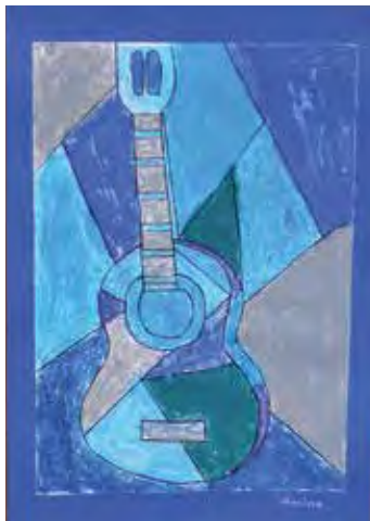
Die „blaue Gitarre“ steht stellvertretend für die „blaue Periode“ des Künstlers Pablo Picasso.