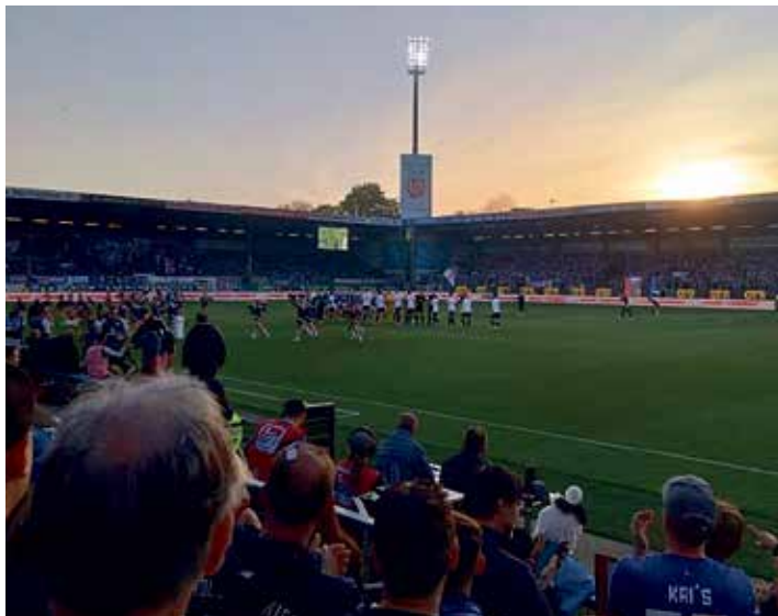
Holsteins-Bundesligasaison liegt in den Startlöchern.

Kreis Plön (dif). Die deutsche Nationalmannschaft bleibt bei der heimischen Europameisterschaft im Turnier und steht nach einem 2:0 (0:0) -Erfolg über Dänemark am kommenden Freitag im Viertelfinale. Dort wartet dann mit Spanien sicherlich der Top-Favorit auf die Nagelsmann-Elf. Doch auch wenn am Ende der neunzig Minuten ein verdienter Weiterkommen stand, bis dahin war es in Dortmund ein harter Weg. Ohne den gesperrten Jonathan Tah und auch ohne Florian Wirtz, dafür mit Niclas Füllkrug und Leroy Sane ging es los. Auch hatte David Raum den Vorzug vor dem Stuttgarter Maximilian Mittelstädt erhalten. Eine wichtige Entscheidung sollte der Video-Assistent (VAR) haben, der gleich dreimal eingriff. Zuerst wurde der DFB-Elf ein Kopfballtreffer von Nico Schlotterbeck aberkannt (4.). Grund: Ein vorheriges Foulspiel von Mitspieler Joshua Kimmich. Doch die Gastgeber waren kaum geschockt, machten dort weiter wo sie aufgehört hatten, verpassten aber ein schnelles Tor. Dann ging es (35.) aufgrund eines starken Gewitters erst einmal gut 25 Minuten