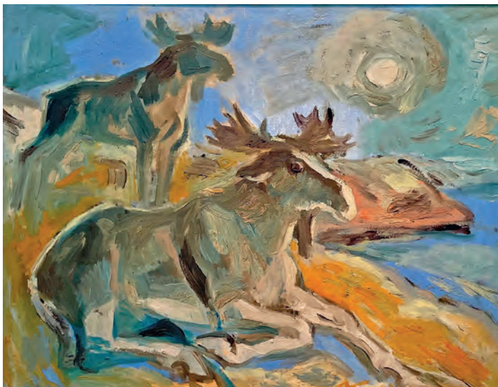
Ein beliebtes Motiv der Künstler in Nidden waren Elche.