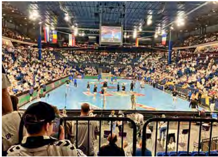
Mit den Neuen wieder in die Champions-League?