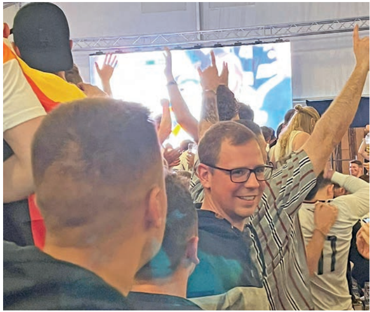
Torjubel beim „public viewing“.