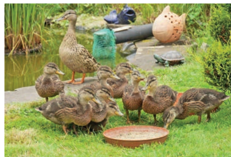
Aufgeregtes Gedrängel an der Futterschale, die Mutter hält Wache.

und beobachtet aufmerksam die Umgebung und den Himmel. Jetzt wird es nicht mehr lange dauern und sie werden den sicheren Garten verlassen. Einerseits sind Wichelmanns dann traurig, auf der anderen Seite aber glücklich, dass der gesamte Nachwuchs überlebt hat und eines Tages als Eltern zurückkommen werden und dann bei ihnen ihre Küken großziehen werden.