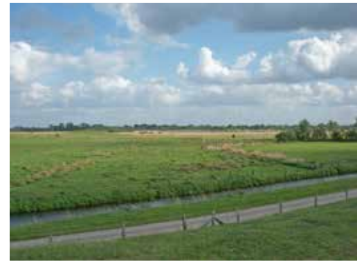
Die Radwanderung führt neben vielen weiteren reizvollen Stellen auch zum neuen Deich, hier mit Blick auf den Barsbeker See.