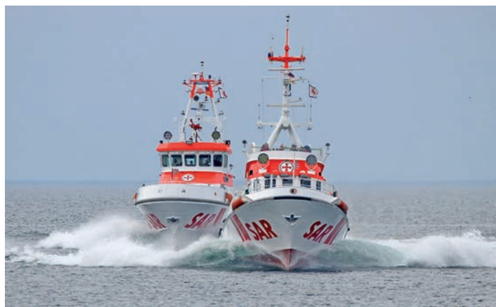
Die Seenotrettungskreuzer NIS RANDERS (I.) und ARKONA der Deutschen Gesellschaft zur Rettung Schiffbrüchiger (DGzRS) gemeinsam unterwegs auf der Ostsee.