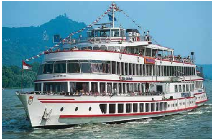
Herrliche Rhein- und Mosel-Kreuzfahrten gehören zum großen Genießer-Programm der Probsteer-Sonderreise im Oktober zur Zeit der Weinlese.

Zum großen Leistungspaket gehören neben der Fahrt im erstklassigen Fernreisebus ab Kiel, Schwentimental und Preetz drei Übernachtungen im Winzer-Hotel nebst Gästehaus direkt am Rhein mit dreimal Schlemmer-Frühstück vom Buffet und drei Abendessen im Hotel als Buffet oder Drei-Gang-Menü. Zum Rahmenprogramm gehören preisinklusive ein großer Panorama-Ausflug zu den „Höhepunkten am Rhein“ mit Besuch im Weinstädtchen Rüdesheim mit Freizeit zum Bummel in der Drosselgasse und eine mehrstündige Erlebnis-Schiffahrt entlang des Mittelrheins rund um die Loreley sowie am nächsten Tag ein großer