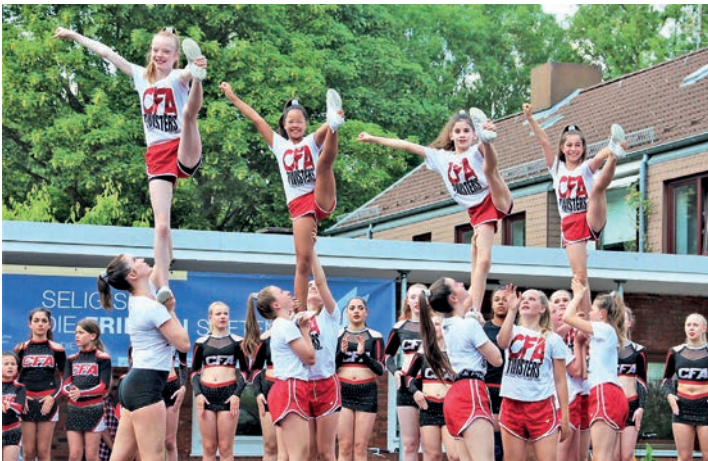
Auch dieses Jahr wieder mit dabei: CheerForce Athletics vom KMTV Kiel.

Kinderprojekten der Schleswig-Holsteinischen Krebsgesellschaft. Anlässlich des 100-jährigen Stadtteil-Jubiläums wird um 14.45 Uhr das „Eingemeindungs Hick - Hack im Zeitraffer“ präsentiert. Höhepunkt des Kieler Woche Stadtteil-fests sind die Grußworte der Stadt Kiel um 15 Uhr, und die Verleihung der Goldenen Pogge durch den Dietrichsdorfer Gesprächskreis, die er Bürgern verleiht, die sich in besonderer Weise für ihr ehrenamtliches Engagement in Dietrichsdorf verdient gemacht haben.