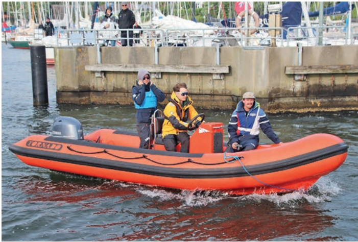
Ein Kontrollboot der MSK fährt zur Startlinie

Insgesamt nahmen 24 Boote, aufgeteilt in vier Gruppen, daran teil. Die Eigner kamen auch aus Schilksee, Laboe, Kiel und einer