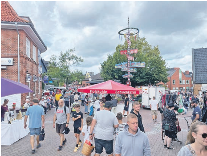
Schönberg lädt für Sonntag, 23. Juni, zum Sommer-Flohmarkt und Shopping-Bummel ein.

Kalifornien und am Schönberger Strand sind die Restaurants und Geschäfte geöffnet. Zum verkaufsoffenen Sonntag in Schönberg haben auch die ansässigen Restaurants, Cafés und Eisdielen geöffnet und bieten den vielen Besuchern das bewährte kulinarische Angebot. Die teilnehmenden Betriebe freuen sich auf Ihren Besuch.