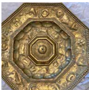
Die Taufschale soll restauriert werden.