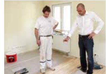
Mit einer baubegleitenden Qualitätskontrolle können Mängel auf der Baustelle fürs Eigenheim bereits frühzeitig festgestellt und behoben werden. So vermeidet man eine Verschleppung bis zur Bauabnahme.

Auch das Risiko einer sogenannten „konkludenten Abnahme“ sollte vermieden werden, rät Erik Stange. Sie lässt sich mit einem „schlüssigen Verhalten“ des Bauherrn begründen, wenn er etwa das Haus längere Zeit nutzt, ohne Beanstandungen zu äußern, oder wenn er die Schlussrechnung abschlagsfrei begleicht.