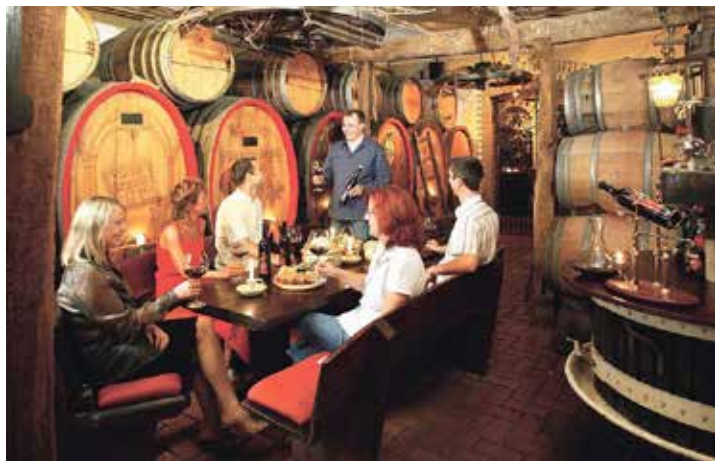
Stimmungsvolle Stunden erwarten unsere Leser*innen zur Weinlese am Rhein zum Feiertags-Termin.

Erlebnisausflug in die verträumten Mosel-Weindörfer entlang der Uferstraße und der Moselschleifen in die vielbesungene Weinstadt Cochem mit Freizeit und einer Genießer-Schiffahrt auf der Mosel auf schönster Strecke mit eindrucksvoller Schleusenfahrt. Anmeldungen und Buchungen sind ab sofort bei den Probsteer-Leser-Reisen des Burg-Verlages in Eutin unter Telefon 04521-701130 oder direkt online auf leserreisen.der-reporter.info möglich.