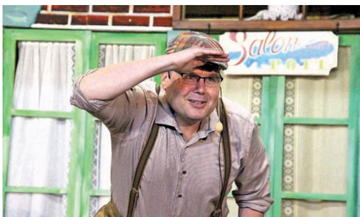
Was hat Winfried Lustmann (Mike Schwensen) da entdeckt?

Lieben bringen die Hausgemeinschaft gehörig durcheinander, und das gibt richtigen Schlamassel. Souffleuse ist wieder Maren