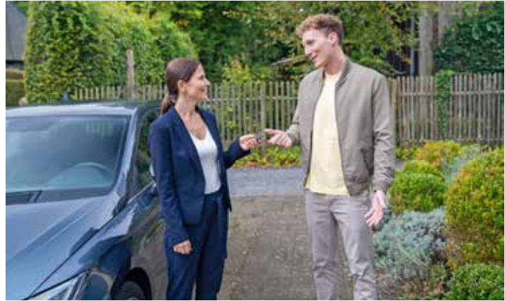
Beim Autokauf ist für mehr als Dreiviertel der Deutschen der Preis das wichtigste Kriterium.

Schon heute sind Pkw mit Elektromotor bei den laufenden Kosten attraktiver als Verbrenner. So sind die Ausgaben für den benötigten Strom geringer als die für Benzin oder Diesel, wenn man die Möglichkeit hat, sein Auto zu Hause zum optimalen Stromtarif zu laden. Wegen steigender CO 2 -Bepreisung wird sich diese Entwicklung perspektivisch noch verstärken. Außerdem ist die Wartung eines E-Autos weniger aufwendig und somit kostengünstiger. Ein Ölwechsel sowie die Abgasuntersuchung entfallen, dazu fehlen Verschleißteile