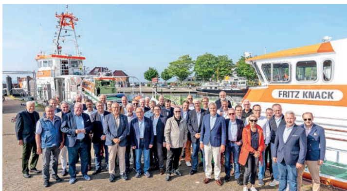
Das beschlussfassende Gremium der Deutschen Gesellschaft zur Rettung Schiffbrüchiger (DGzRS) am 31. Mai im Hafen von Laboe am Rande seiner turnusgemäßen Tagung in Kiel