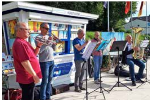
Das Mare Brass Quintett spielt aus seinem umfangreichen musikalischen Repertoire.