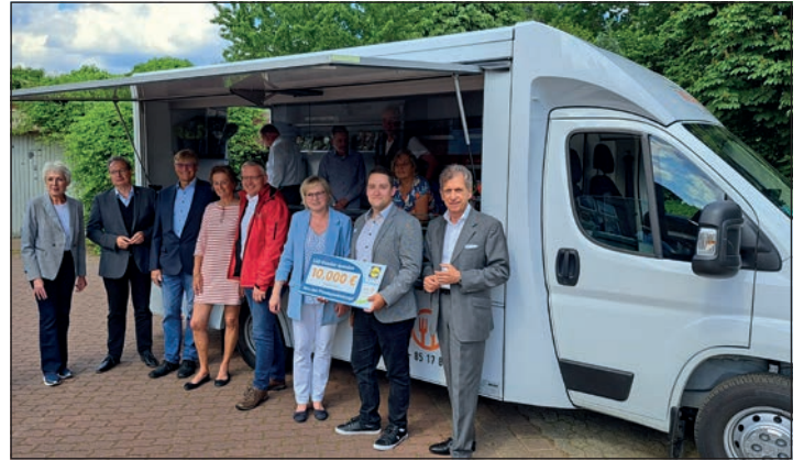
Bei der Tafelmobil-Einweihung in Preetz waren auch zahlreiche Spender und Sponsoren dabei.

Das Tafelmobil läuft bereits seit Dezember im Probebetrieb und steuert mittwochs Schwentinental und donnerstags das Preetzer Bugenhagenhaus sowie das ehemalige Landhaus Schellhorn im Amt Preetz-Land an. Es bietet so rund 190 Menschen Unterstützung mit Lebensmitteln. „Die Erfahrung zeigt, dass die Lebens-