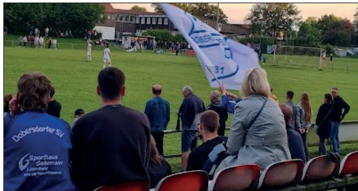
Zahlreiche mitgereiste Fans unterstützten die SG Dobersdorf/Probsteierhagen beim Endspiel in Neumünster um den Pokal der Nichtliga-Mannschaften.

Neumünster/ Dobersdorf (t). Den „Pokal für Nichtliga-Mannschaften“ durften die Fußballer der Spielgemeinschaft Dobersdorf/Probsteierhagen II vorige Woche zwar nicht mit nach Hause nehmen. Doch das Endspiel beim SV Tungendorf Neumünster hat gezeigt: In puncto Zuschauerbeteiligung sind die Anhänger aus der Probsteierhagen Hand. Mehr als 100 Schlachtenbummler hatten sich auf den Weg gemacht, um ihre Mannschaft beim Endspiel um den neugeschaffenen Pokal für Nichtligamannschaften an-