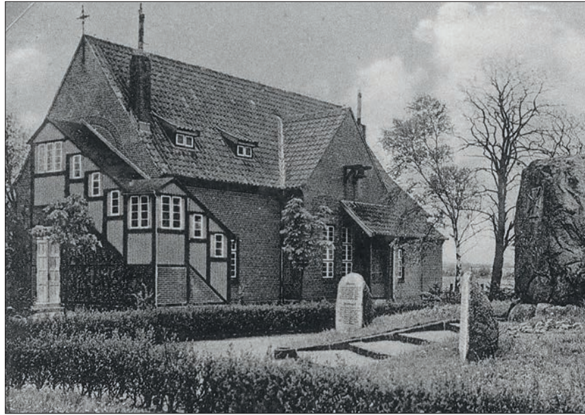
Das ehemalige Gildehaus als erste Heikendorfer Kirche, um 1924.

Heikendorf (t/mm). Die evangelisch-lutherische Kirchengemeinde Heikendorf feiert dieses Jahr ihren einhundertsten Geburtstag. Damit ist sie eine vergleichsweise junge Gemeinde. Im Mittelalter hatten die Heikendorfer Christen keine eigene Kirche. Um einen Gottesdienst zu feiern, mussten sie bis nach Kiel fahren. Etwas einfach gestaltete sich das Gemeindeleben etwa ab dem Jahr 1300, als Heikendorf zur Marienkirche in Schönkirchen gehörte. Diese Verbindung hatte 600 Jahre Bestand. Wer als Heikendorfer Gottesdienst feiern, kirchlich heiraten, oder sein Kind taufen lassen wollte, musste stets nach Schönkirchen. Immerhin, geselliges Beisammen im Schönkirchener Krug waren willkommener Lohn für die damals noch beschwerliche Strecke. Die Bevölkerung Heikendorf wuchs sprunghaft in die Höhe, als Kiel kaiserliche Marinestadt wurde. Eine eigene geistliche Versorgung war gefragt. So entstanden nach dem Ersten Weltkrieg Pläne, eine selbstständige Kirchengemeinde vor Ort zu gründen. Erste Gottesdienste und Konfirmandenunterricht fanden bereits ab 1919 in der Heikendorfer Schule statt. Ein Jahr später gründete man den „Kirchlichen Verein“. Als Anschubfinanzierung für wei-