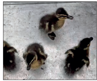
Sieben kleine Stockenten-Küken konnte die Polizei am Montag in Kiel aus dem Holstenfleet retten.

Mit viel Fingerspitzengefühl und Geduld gelang es den Polizeikräften, die Küken einzeln mit dem Kescher aus dem Wasser zu