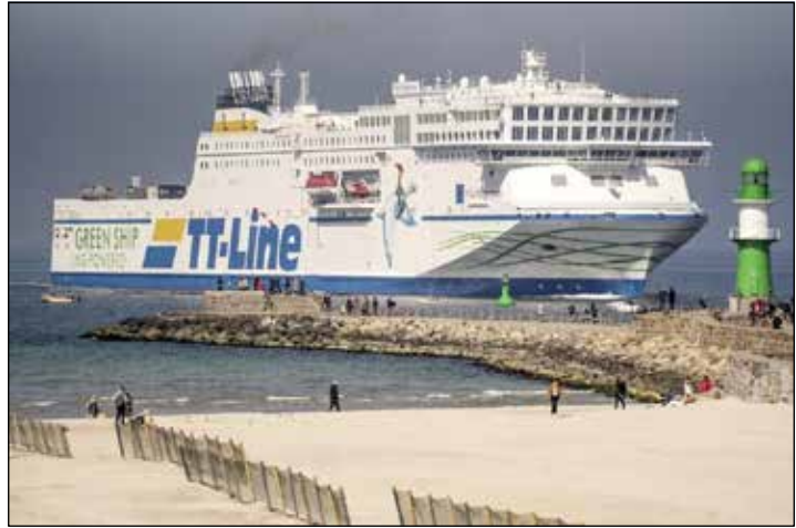
Unterwegs mit den Jumbo-Linern der TT-Line zum großen Jubiläum Kurs Schweden.

Am zweiten Tag ist eine große Stadtrundfahrt mit fachkundiger, deutschsprachiger Reiseleitung