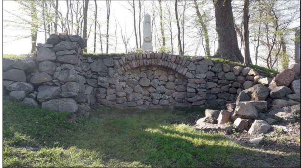
Grotte mit Stele im Park von Salzau.

Schönberg/ Salzau (t). Das Probstei Museum Schönberg lädt zur nächsten Radtour auf historischen Pfaden ein. Am Dienstag, 11. Juni führt der Kurs nach Salzau. Rund 25 Kilometer werden an diesem Tag geradelt. Start ist um 14 Uhr am Probstei Museum Schönberg, Ostseestraße 8-10. Die Teilnahme kostet 4 Euro. Eine Spende zugunsten des Museums ist ebenfalls willkommen. Die Anmeldung erfolgt telefonisch unter 04344 3174 oder per Email an info@probstei-museum.de . Nach einer kurzen Einführung auf der „Groot Deel“ des Museums führt die Tour vorbei an der Schönberger Windmühle durch das Schönberger Gewerbegebiet nach Ratjendorf. Hier liegt der Ursprung des Probstei Museums auf dem Hof Vöge-Lesky. Über den Peissen, mit immerhin 54 m über NN die höchste Erhebung der Probstei, geht es in den Bereich des ehemaligen Adelsgutes Salzau. Durch Getreidefelder führt die Fahrt zum ehemaligen Meierhof Ottenhof. Über Charlottental erreicht man das Herrenhaus Salzau von 1882, das sich bis vor wenigen Jahren noch Landeskulturzentrum nennen durfte und auf eine wechselvolle Geschichte zurückblicken kann. Beeindruckend ist auch der Blick von der Gartenseite mit der Spiegelung im Teich. Mit etwas Glück können wir