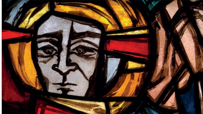
Eines der kunstvoll gestalteten Glasfenster im Altarraum.

Tansania, die in einer der ärmsten Regionen der Welt liegt. Heikendorf unterstützt dort soziale Projekte und Bildung. Seitdem findet jedes Jahr ein „Tansania Tag“ statt. Eine weitere Partnerschaft besteht seit 1991 zur Kirchengemeinde in Roja, Lettland. Inzwischen hatte die alte Orgel ausgedient. Rund eine Viertel Million DM an Spenden konnte die Gemeinde mobilisieren, mit der Orgelbauer Führer 1994 ein neues Instrument bauen konnte. 1995 wurde die evangelische Kindertagesstätte Upendo eingeweiht. In der Amtssprache von Tansania, Kisuaheli, bedeutet das „Liebe“. 1997 konnte das Gemeindehaus öffnen. Im selben Jahr zog der Weltladen in