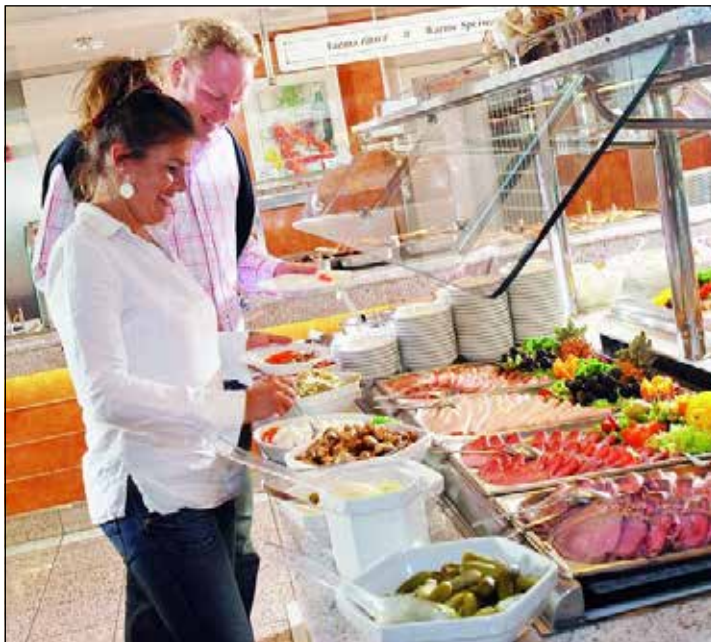
Auch kulinarisch werden die Probsteer-Leser an Bord der Märchenschiffe auf dem Hin- und Rückweg rundum verwöhnt.

und die kurze Weiterfahrt in die Hafen-Metropole Malmö am Öresund mit Unterkunft im exklusiven First-Class-Hotel mit reichhaltigem Frühstück vom Buffet für zwei Nächte. Viel Freizeit zum Stadtbummel steht zur Verfügung. Am dritten Tag erfolgt die Rückreise zur Einschiffung in Trelleborg auf eines der großen Märchen-Fährschiffe der TT-Line zur Überfahrt nach Deutschland inklusive Abendessen an Bord. Anmeldungen sind ab sofort im Probsteer-Leser-Reisen-Büro des Burg-Verlages in Eutin unter Telefon 04521-701130, täglich von 9 bis 13 Uhr, sowie direkt online auf leserreisen.der-reporter.info möglich.