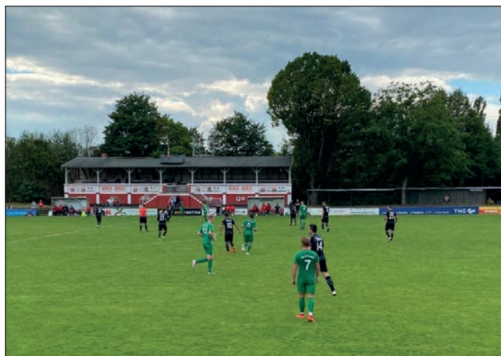
In Sachen Punkte zogen dunkle Wolken auf dem Kiliaplatz auf.

Für die Jungstörche der KSV Holstein, die sich ab Sommer ja Bundesliganachwuchs nennen dürfen, war es eine kleine „auf-und-ab“-Spielzeit. Zeitweise stand die Elf von Sebastian Gunkel an der Spitze und eigentlich erst als bekannt wurde, dass es keine Meldung für einen eventuellen Aufstieg in die 3. Liga geben würde, war der Wurm drin und das Team landete am Ende