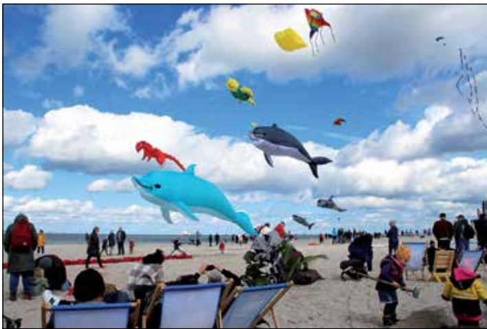
Wie groß einige Drachen tatsächlich sind, wird beim Starten oder Landen deutlich.

schminken oder den eigenen Drachen mit Papas Hilfe steigen lassen, brachte es den Kleinen viel Spaß. Für das leibliche Wohl war auch auf diesem Strandabschnitt bestens vorgesorgt. Zahlreiche Sitzgelegenheiten, ja sogar Liegestühle standen zur freien Benutzung bereit.