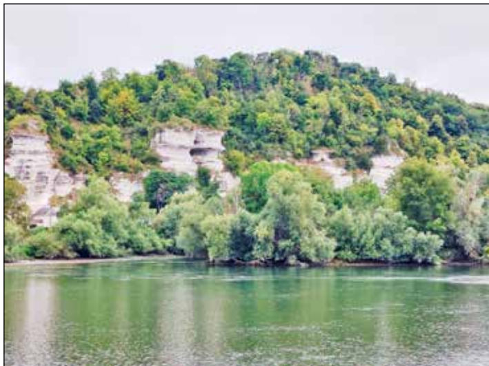
Der Vortrag Die Krone Frankreichs - Seine und Rhône bietet Gelegenheit, in das Urlaubsland Frankreich einzutauchen.