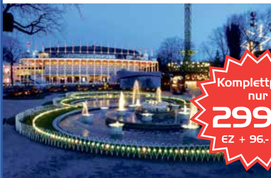
Weltberühmter Konzert-Saal mit großer Geschichte: Die „Tivoli Concert Hall“ in Kopenhagen