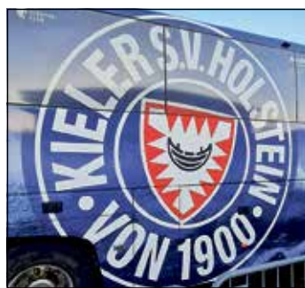
Rollt dieser Bus bald durch die 1. Bundesliga?

Kreis Plön (dif). „Diese Mannschaft macht einfach nur Spaß“. Damit hatte der Kieler Fan eigentlich alles zum Zweitligaspiel der KSV Holstein beim 1. FC Nürnberg gesagt, nachdem Holstein die Hürde im Aufstiegskampf gegen den 1. FC Nürnberg locker mit 4:0 genommen hatte. Der Fan trank sein Bier aus und machte sich mit rund 1100 weiteren Holsteinern auf den langen Weg (700 Kilometer) heim nach Kiel. Vorher hatten seine Störche bei perfektem Fußballwetter eine mehr als starke Vorstellung bei den Franken absolviert und zeigten einmal mehr: Ja, wir wollen hoch! Bedingt wurde dieser klare Erfolg durch die rote Karte für den Nürnberger Joseph Hungbo schon nach zwölf Minuten, der dem Rapp-Team natürlich in die Hände spielte. Marko Ivezic, (20.), Shuto Machino (34.) und Alexander Bernhardsson (43.) nutzten diesen Vorteil eiskalt aus und stellten auf 3:0. Bis zum Halbzeitpfeiff hätten die Kieler aber durch Timo Becker und Tom Rothe zu weiteren Treffern kommen können, ja sogar müssen. Nach dem Wechsel ließ es Holstein dann etwas ruhiger angehen, ohne in Gefahr zu geraten. Der eingewechselte Nicolai Remberg schoss nach 79 Minuten den Endstand heraus. Hier wurde dem Ligazweiten ein klarerer Handelfmeter verwehrt, weiter musste man den Sturm von Machino, der ebenfalls im