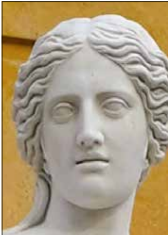
Glatte Haut gilt nicht nur als Schönheitsideal.