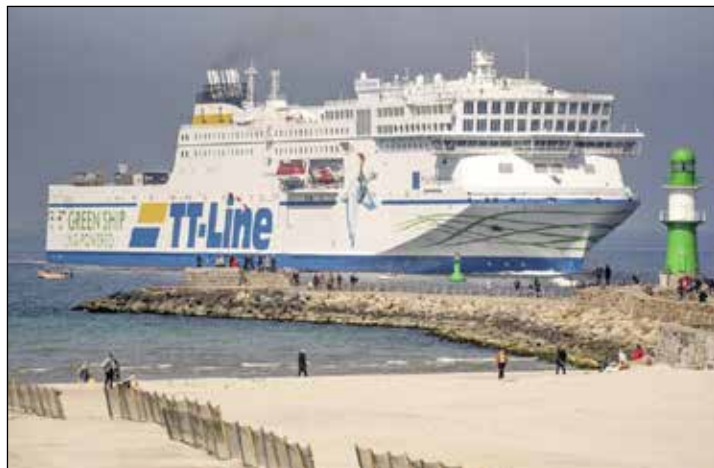
Die Probsteer-Leser*innen sind unterwegs mit den Jumbo-Linern der TT-Line zum großen Jubiläum Kurs Schweden.

auf Kurs Nord. An Bord werden die Probsteer-Leser mit schwedischen Schlemmer-Spezialitäten preisinklusive rundum verwöhnt. Sie genießen die komfortable Überfahrt auf dem Jumbo-Liner mit kostenloser Benutzung der herrlichen Sonnendecks zum Entspannen. In Malmö erwartet die Probsteer-Gäste sodann ein internationales First-Class-Top-Hotel in der südschwedischen Hafen-Metropole mit modernsten Komfortzimmern und dem