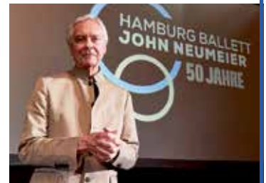
Moderiert seine Jubiläums-Gala höchstpersönlich: John Neumeier