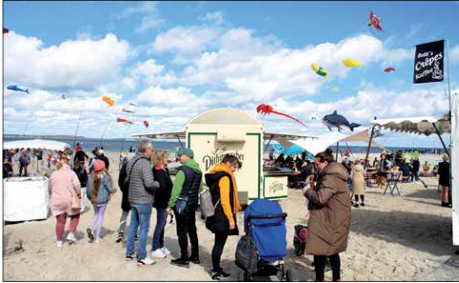
Das Drachenfest fasziniert Jung und Alt gleichermaßen.

Laboe (kas). Der Frühling ist endlich da! Bei sommerlichen Temperaturen um die 20 Grad stieg am Sonnabend, 6. April, der erste Höhepunkt in der Saison – das Drachenfest am Laboer Strandhimmel – vom Tourismusbetrieb Laboe als Veranstalter. Zwischen der Schwimmhalle und der alten Lesehalle konnten die kleinen und großen Drachen aufsteigen. Das Wetter spielte mit, und so wie auch der Reporter des Probsteer kamen viele Besucher aus ganz Schleswig-Holstein, um dem Spektakel beizuwohnen. Schön und gut, aber Parkplätze durch Einbahnstraßen und absolute Halteverbote Mangelware, denn