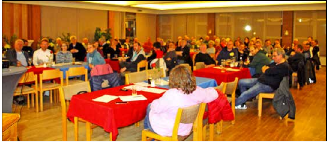
Gut besuchte Mitgliederversammlung im Sportheim.