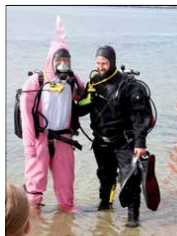
Der Osterhase war natürlich auch dabei.