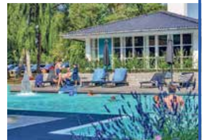
Traumhafte Hotel-Anlage mit grossem Pool direkt am Meer

● Zusatz-Reisetermine: ● 19. - 22.09.2024 ● 26. - 29.09.2024