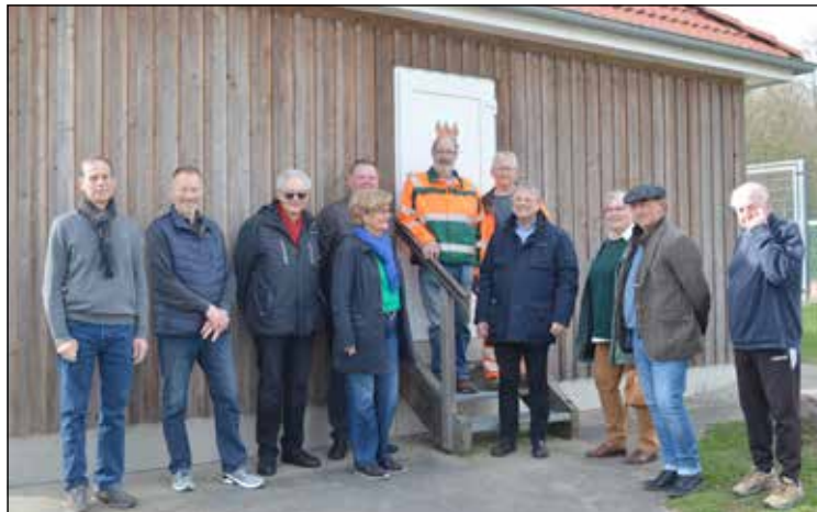
Das Interesse an dem neuen Sanitärbereich auf dem Wohnmobilparkplatz war am vergangenen Mittwoch groß.

Lütjenburg (cm). Im vergangenen Jahr wurde der Wohnmobilparkplatz auf dem ehemaligen Kasernengelände eröffnet, ein Projekt, über das zuvor innerhalb der Stadtvertretung viel diskutiert wurde, bis dann schlussendlich die Entscheidung fiel, es umzusetzen. Denn es gab doch die ein oder anderen Bedenken in den Reihen, ob der Standort angenommen wird: Sorgen, die sich jetzt als völlig unbegründet herausgestellt haben. Die neun Stellplätze waren in der vergangenen Saison sehr gut gebucht, was sich