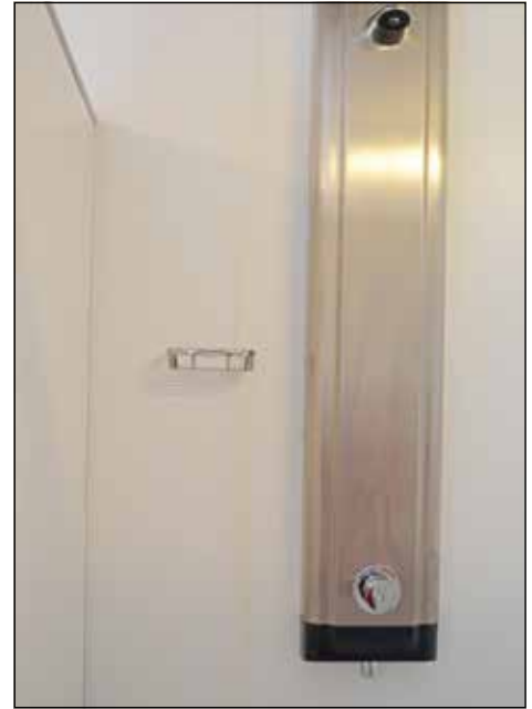
Eine der modernen neuen Duschen, die in dieser Saison neu auf dem Stellplatz hinzugekommen sind.

Entfernung vom Innenstadtbereich einen so schönen Platz mit modernster Technik präsentieren kann, der unmittelbar an das Wander- und Radwegenetz angrenzt und auch die Ostsee nach nur rund 7 km erreichbar ist.