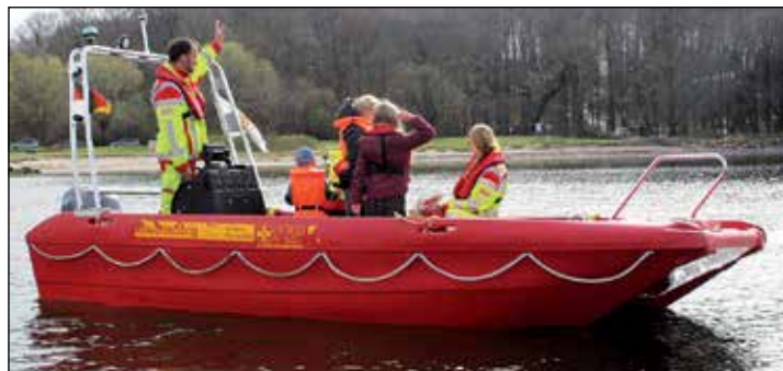
Kinder warfen vom ASB-Boot die Eier ins Wasser.