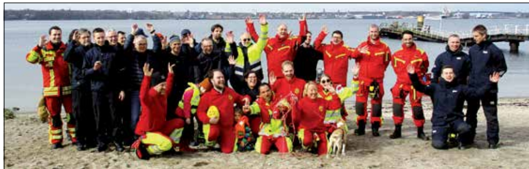
Die gesamte Taucher-Einsatzstaffel.

Kitzberg (kas). Kurz zur Geschichte des ASB: Im Jahre 1888 legten sechs Berliner Zimmerleute mit dem von ihnen organisierten „Lehrkursus über die Erste Hilfe bei Unglücksfällen“ den Grundstein für den heutigen Arbeiter-Samariter-Bund. Arbeiter sollten fortan eigenständig Verunglückte in Werkstätten und Betrieben versorgen können. So setzten also sechs Zimmerleute in einer Zeit, in der es weder Arbeitsschutzvorschriften noch Rettungsdienste gab und sich viele Arbeiter schwer verletzten, gegen viele Widerstände den ersten