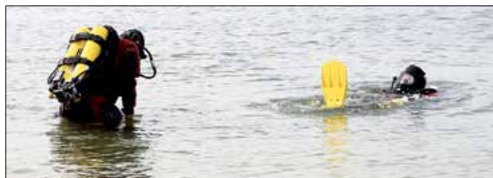
Noch sind die beiden Taucher an der Oberfläche zu sehen.

Der gemütliche Teil folgte zuletzt: Als krönenden Abschluss gab es Kaffee und Kuchen, es wurde gegrillt und alle Beteiligten haben eine tolle Zeit verbracht. Unterstützt wurden die Rettungskräfte vom Restaurant Kiek-Ut. Ein erfolgreicher und schöner Tag bei sommerlichen Temperaturen neigte sich dem Ende zu, und so traten die Einsatzkräfte ihre Heimfahrt an. Das nächste Ostereiertauen findet am 19. April 2025 statt!