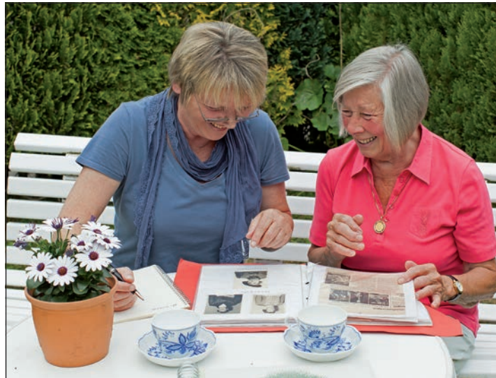
Senioren-Assistenten unterstützen ältere Menschen, langfristig in der häuslichen Umgebung wohnen zu bleiben.

Schwentinental (t). Eine neue 120-stündige Seminarreihe in der professionellen Senioren-Assistenz nach dem Plöner Modell findet ab Freitag, 10. Mai, in Schwentinental statt. Das Seminar umfasst zwei erweiterte Wochenenden und einen sechstägigen Block. Wenn ein Elternteil pflegebedürftig wird, sind es meist die Frauen, die ihren Job reduzieren oder ganz aussteigen. Nach einer solchen Pflegezeit ist es häufig schwer, im alten Beruf wieder Fuß zu fassen. Auf das Naheliegende kommen viele dabei nicht. Sie können das Know-how aus der Pflegezeit für den beruflichen Neuanfang nutzen. Denn sie sind besonders gut geeignet für eine professionelle Seniorenbegleitung. Das Berufsbild