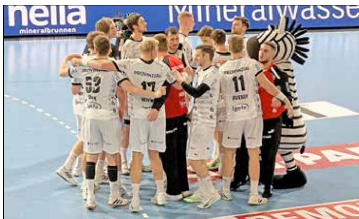
So will man in Kiel auch gegen die SG jubeln.

Kreis Plön (dif). Die Deutsche Handball-Nationalmannschaft hat unter Coach Alfred Gislason die Olympia-Qualifikation für Paris im Sommer geschafft. Nach einem klaren aber nicht gänzlich überzeugenden 41:29-Erfolg gegen Algerien gab es zwei Tage später eine 30:33-Niederlage gegen Kroatien. Somit kam es vergangenen Sonntag zum „Finale um das Olympiaticket“ zwischen Deutschland und Österreich in Hannover, in dem es auch um den Job von Trainer Gislason ging. Dessen Vertrag verlängert sich nur bei einer Teilnahme an den Sommerspielen. Gegen Österreich führte sein Team zwar meist mit drei Toren Vorsprung, so richtig sicher konnte man sich aber nie sein. Erst als die Ösis offensiver wurden, kam das deutsche Team zu den entscheidenden Toren und siegte mit 34:31. Ebenfalls in Frankreich dabei sind