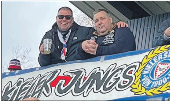
Auswärtsdreier: Jubelnde Holstein-Anhänger in Elversberg.

terschaft im eigenen Land holen. Am 23. März geht es nun geht Vizeweltmeister Frankreich, drei Tage später warten die Niederlande auf die Nagelsmann-Kicker. Viele Neulinge hat der Trainer in seinen Kader geholt, was interessant werden kann, denn im dann folgenden Match geht es gegen Schottland schon um EM-Punkte. Davon völlig losgelöst sollte die 2. Mannschaft Holsteins sein, die am 24. März um 14 Uhr auf den VfB Oldenburg treffen wird. Die leicht schwächelnden Jungstörche sind hier Favorit, also auch auf Sieg