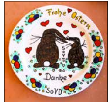
Der „Danke-Teller“ von der Kinderkrebstation.