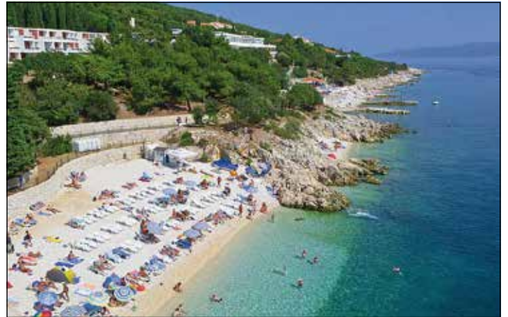
Traumhafte Strände bei noch warmen Temperaturen erwarten die Leser bei der großen Verlags-Sonderfahrt in den Herbstferien nach Kroatien.

in direkter Nähe zum Meer und der drei Kilometer langen Strandpromenade. Außerdem gibt es sehr reichhaltige Halbpension mit großen Schlemmerbuffets zum Frühstück und Abendessen. Als ganz besondere Verlags-Zugabe sind zudem alle Getränke (Weine/Biere/Softdrinks, Wasser) zum Abendessen ohne Begrenzung im Reisepreis mit enthalten. Zum großen Leistungspaket gehören neben der komfortablen Busreise im erstklassigen Fernreisebus mit Waschraum/WC und Bordküche ab Kiel, Schwentinental und Preetz auf der Hin- und Rückreise jeweils eine komfortable Zwischenübernachtung in Bayern mit Halbpension sowie vier Nächte mit Halbpension und abendlichem Getränke-Paket in Kroatien, ein großer Panorama-Ausflug in das weltberühmte mondäne Seebad Opatija mit seiner einmaligen Gründerzeit-Architektur und herrlichen Stränden. Gegen Aufpreis von 25 Euro