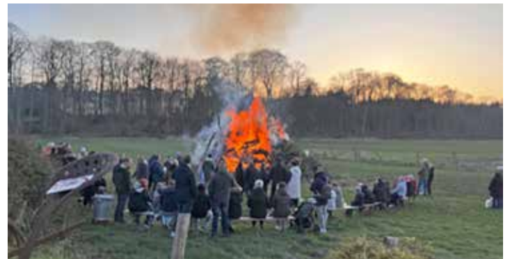
Erleben Sie die Wärme und Gemeinschaft des Osterfeuers im Bredeneeker – ein leuchtendes Symbol der Tradition und des Frühlingsbeginns.

Das Bredeneeker Gasthaus lädt alle herzlich ein, diese Neuerungen selbst zu erleben und die Wiedereröffnung zu feiern.