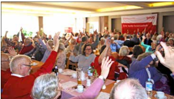
Volles Haus im Sportheim.

gab die Grüße der Gemeinde Heikendorf und ging noch einmal auf das Thema des Preetzer Tafelmobils ein, wo vor wenigen Tagen das Amt Schrevenborn mit der Preetzer Tafel eine Kooperationsvereinbarung geschlossen hatte.