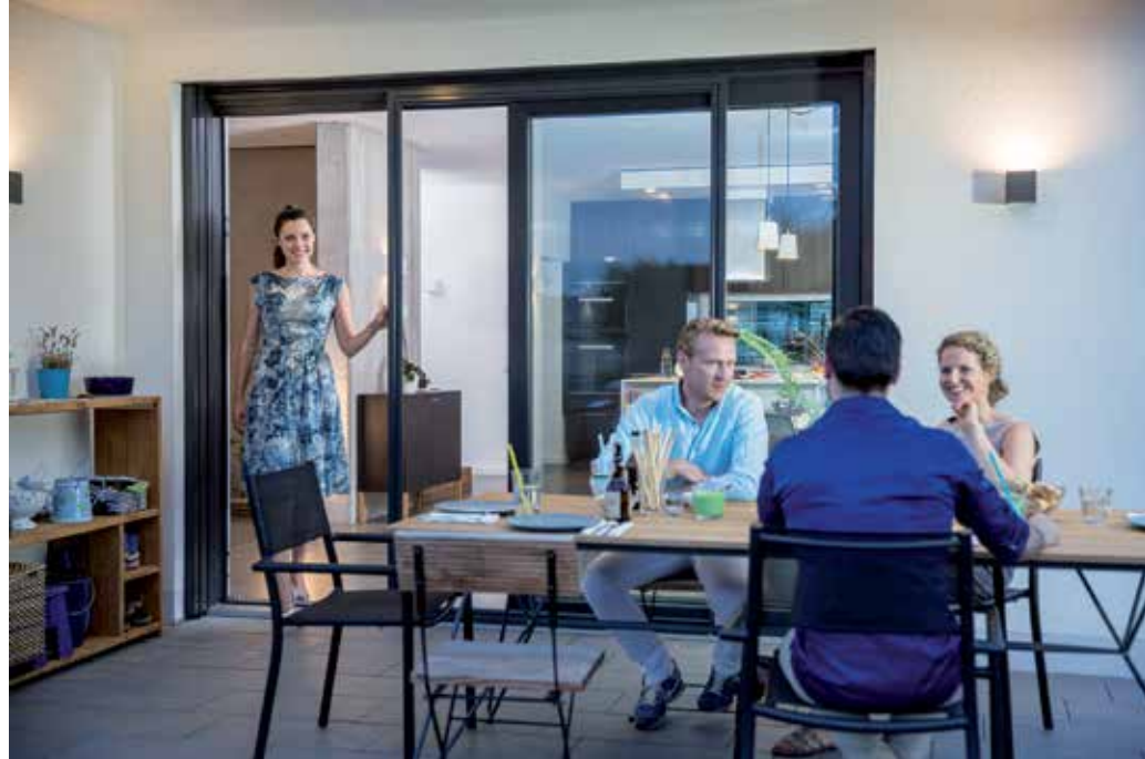
Zutritt nur für erwünschte Gäste: Ein maßgeschneiderter Insektenschutz für Terrassen- und Schiebetüren hält Krabber und Summer wirksam fern.

Kreis Plön (DJD). Große Türen für Balkone, Terrassen oder Wintergärten, die sich weit öffnen und zur Seite schieben lassen, sind in der warmen Jahreszeit ein echter Genuss. Mit ihnen können viel frische Luft und Sonne ins Haus strömen. Allerdings lassen auch die unerwünschten Begleiterscheinungen des schönen Wetters nicht allzu lange auf sich warten. Mücken, Fliegen, Spinnen und Co. bevölkern nicht nur den Garten, sondern dringen durch die weiten Öffnungen auch ins Haus oder die Wohnung ein – und können einem hier buchstäblich den Schlaf rauben. Insekten sind in der Natur unverzichtbar. Deshalb sind tier-