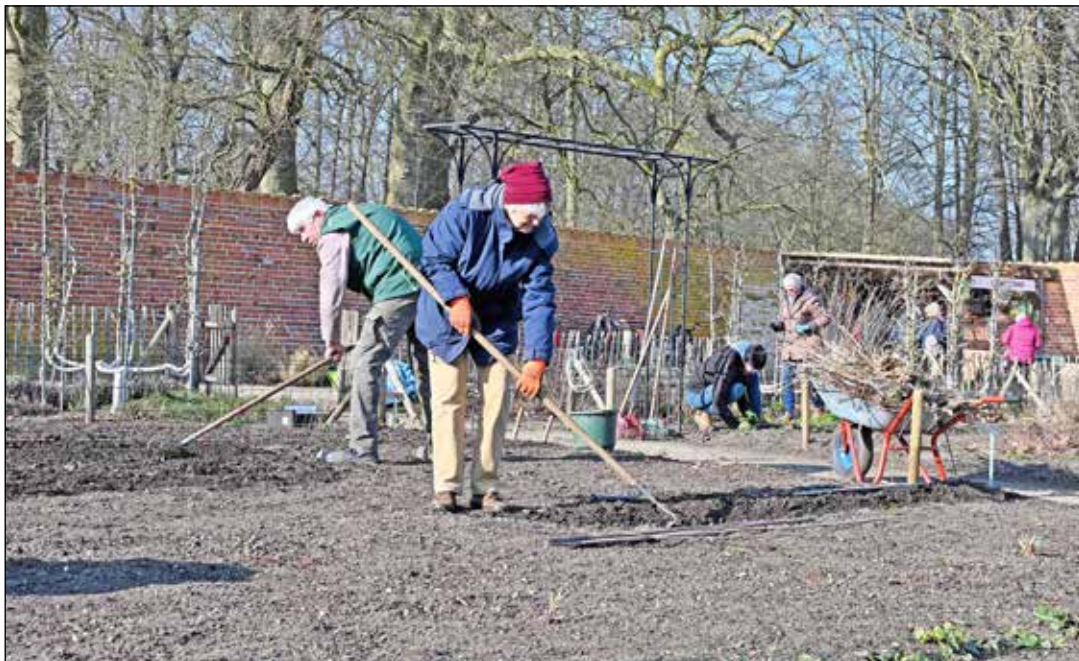
Außen gibt's Blumen, auf der Innenfläche Gemüse: Planmäßig bereiten die Ehrenamtler die Parzelle für die Saison vor.

Was in die Beete kommt, folgt einem System und gebuddelt wird nach Plan. Zucchini der Sorte Zuboda haben die Ehrenamtler für die Saison 2024 (unter anderem) gewählt, die Buschbohnsensorten Saxa und Purple Teepee und Bete-Rüben, eine Sorte rot eine gelb. Und damit den Küchengartenbesuchern etwas blüht, kommen auch Blumensamen ein-