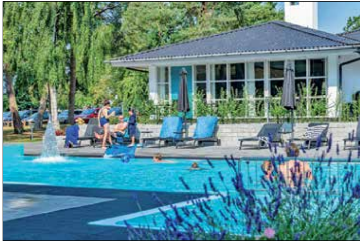
Auf die Gäste wartet eine traumhafte Hotel-Anlage mit großem Pool direkt am Meer.

ßem, beheiztem Außenpool und sehr großzügigen Zimmern mit Balkon oder Terrasse. Das Haus befindet sich in einmaliger, ruhiger Lage in einem zauberhaften Kiefern-Park am Meer und an einem der schönsten Sandstrände im Süden der Insel. Die deutschsprachige Hotelleitung verwöhnt die Urlauber zudem mit skandinavischem Gaumenkitzel vom Frühstücksbuffet bis zu den leckeren Abendmenüs oder -buffets. Zum großen Leistungspaket der