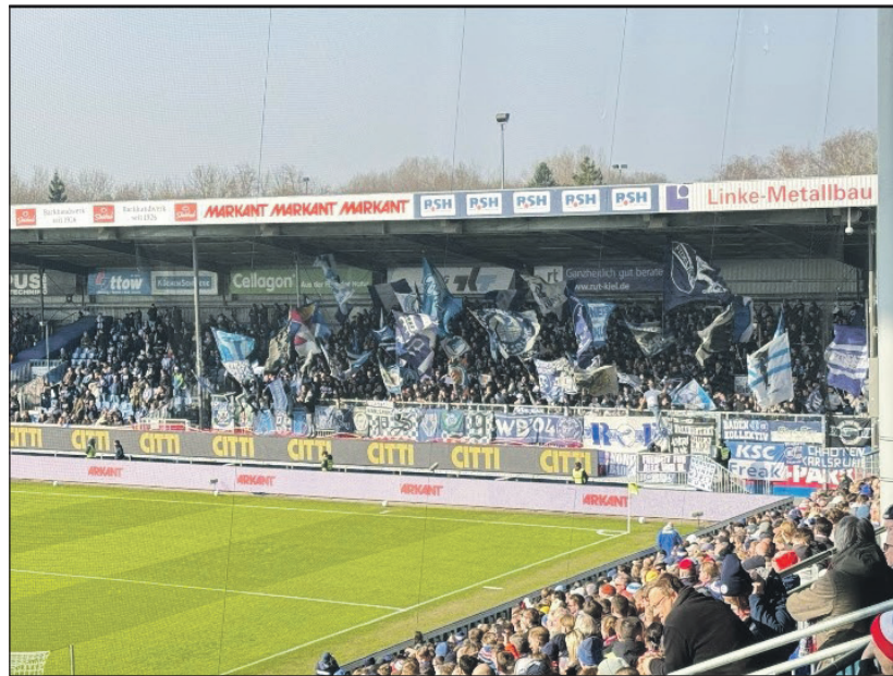
Die Gästefans vom KSC fuhrten ohne Punkte heim.

Am kommenden Sonnabend, 16. März, um 13 Uhr geht es für die Kieler weiter zu Aufsteiger SV Elversberg. Die Truppe von Trainer Horst Steffen spielt eine solide und überraschend starke Serie und sollte nach dem 4:1 in Fürth mit dem Ligaverlust nicht mehr in Berührung kommen. Da der