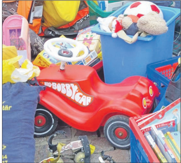
Die Schönberger Landfrauen veranstalten zum Frühlingsanfang einen 1 Euro Flohmarkt – wer Dinge anbieten möchte, kann sich jetzt dazu anmelden.

Auto und Fahrrad, Basteln, Blumen und Garten, CD und Hörbücher, Deko für Frühling, Sommer, Herbst und Winter, DVD, Glas und Porzellan, Handarbeiten, für