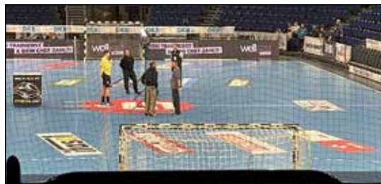
Der „Schiri-Check“ vor dem Anpfiff.