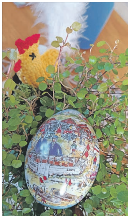
Das Fischerboot an den Fischerhütten am Hohwachter Strand ziert die Ostereier als pittoreskes Detail.

Die Ostereier und die Kalender können auch direkt beim Club bestellt werden und werden dann ins Haus gebracht: kielreport@aol.com oder Tel.: 0162-893 30 34.