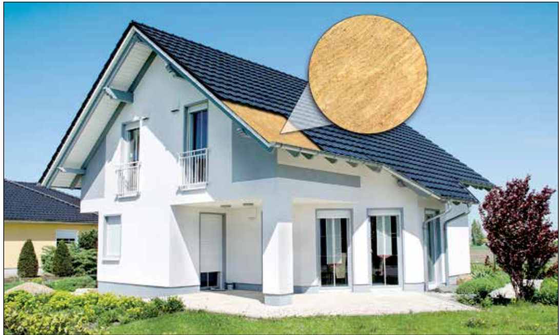
Eine gute Dämmung beispielsweise des Dachs sorgt dafür, dass Heiztechniken wie eine Wärmepumpe effizient laufen können.

Viele Dämmarbeiten wie die Dämmung des Dachbodens oder die Zwischensparrendämmung lassen sich auch in Eigenleistung erledigen. Werden für aufwendigere Sanierungsmaßnahmen Fachfirmen beauftragt und die technischen Mindestanforderungen eingehalten, kann man die energetischen Maßnahmen steuerlich absetzen oder mit Unterstützung eines Energieberaters vor Auftragsvergabe eine