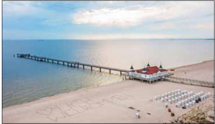
Deutschlands sonnenreichste Ostseeinsel erwartet die Probsteer-Leser zum Top-Termin des Jahres zu Pfingsten.

sehr reichhaltiger Halbpension – große Buffets zum Frühstück und Abendessen – und das große Entdecker- und Genießerprogramm. Zum umfangreichen Leistungspaket der Sonderreise gehören neben der Fahrt im erstklassigen Fernreisebus ab Kiel, Schwentinental und Preetz drei Übernachtungen im Top-Hotel „Hilton by Hampton“ mit exklusiven Designer-Zimmern mit DU/WC, TV etc., der Begrü-