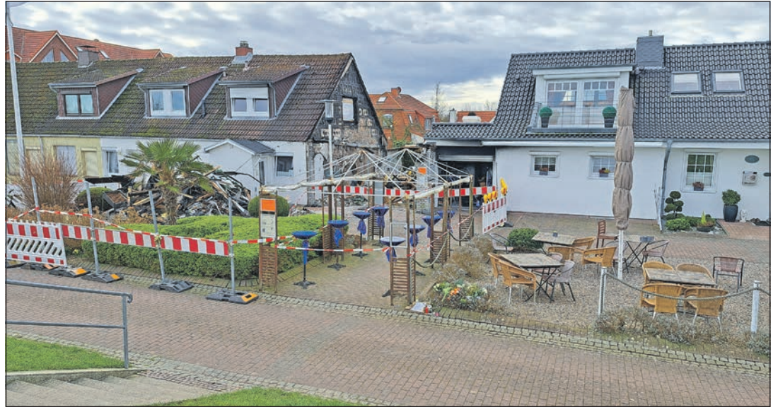
Hier hat sich die Tragödie abgespielt.

Schönberg (aj/t). Eine Tote und zwei Verletzte nach Brand in Fischrancherei sind die erschütternde Folge des Brandes in der Fischrancherei in Schönberg. Eine Frau starb, zwei Männer erlitten Verletzungen. Das Gebäude brannte bis auf die Grundmauern nieder. Nach der Brandortbegehung durch Ermittler der Kriminalpolizei Plön und weiteren Sachverständigen steht die Ursache für den Brand in der Fischrancherei Ehlers am Schönberger Strand fest. Die Polizei geht von einem Unfallgeschehen aus. Das ist geschehen: Am Sonnabend, 17. Februar, gegen 10.20 Uhr entwickelte sich in der Fischrancherei Ehlers in der Straße Promenade 20 ein Feuer. Zu diesem Zeitpunkt befanden sich