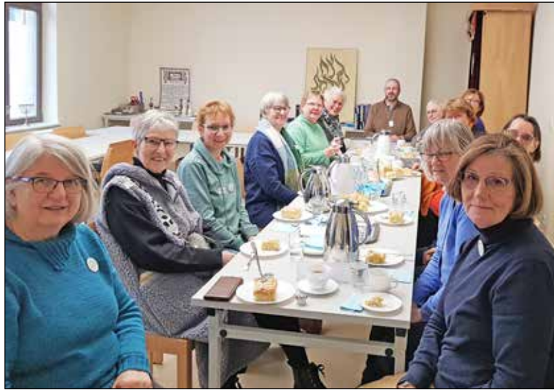
Die Omas gegen Rechts waren zu Gast in der Synagoge der liberalen jüdischen Gemeinde in Kiel.

Pannbacker gab einen sehr interessanten Einblick in das religiöse und familiäre jüdische Leben und auch in die Unterschiede der einzelnen Richtungen der jüdischen Gemeinden von orthodox bis liberal. Besonders interessierte die „Omas“ der „alltägliche“ Antisemitismus“ gegenüber jüdischen Menschen in unserem Land und wie sie als Bewegung in dieser Frage unterstützend tätig werden können. Die Kriegsereignisse in Israel