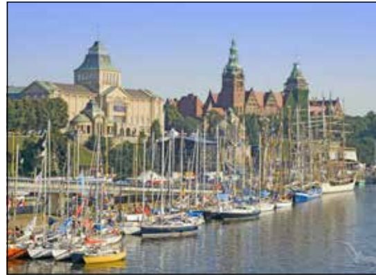
Die alte Hansestadt Stettin entdecken die Leser bei der großen Stadtrundfahrt mit Reiseleitung.

ßungs-Cocktail im Hotel, drei große Schlemmer-Frühstücke vom Buffet sowie drei Abendessen im Hotel als Schlemmer-Bufferet oder Drei-Gang-Menü. Bereits auf der Anreise erfolgt der Besuch der alten Hansestadt Stettin mit großer Stadtrundfahrt