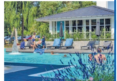
Traumhafte Hotel-Anlage mit grossem Pool direkt am Meer