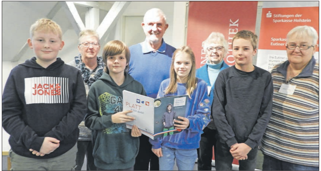
Die Freude am Plattdeutschen verbindet Jury und Schölers.

Eutin (aj). Täuscht der Eindruck oder geht es bei einem plattdeutschen Vorlesewettbewerb besonders gemütlich zu? Der Dialekt jedenfalls steht dafür, Dinge direkt beim Namen zu nennen und das ohne Schärfe. Nicht der einzige Grund, warum der Schleswig-Holsteinische Heimatbund sich unermüdlich um den Erhalt des Niederdeutschen bemüht. Ein Format, um auch den Nachwuchs zu begeistern, ist der Vorlesewettbewerb „Schölers leest Platt“. Vier junge Plattschnacker oder besser Plattleser trafen jüngst zum Landschaftsentscheid in der Eutiner Landesbibliothek aufeinander. Bestens präpariert und in daumendrückender Begleitung von Familien und Lehrerinnen gaben sie „De Aadler in’n