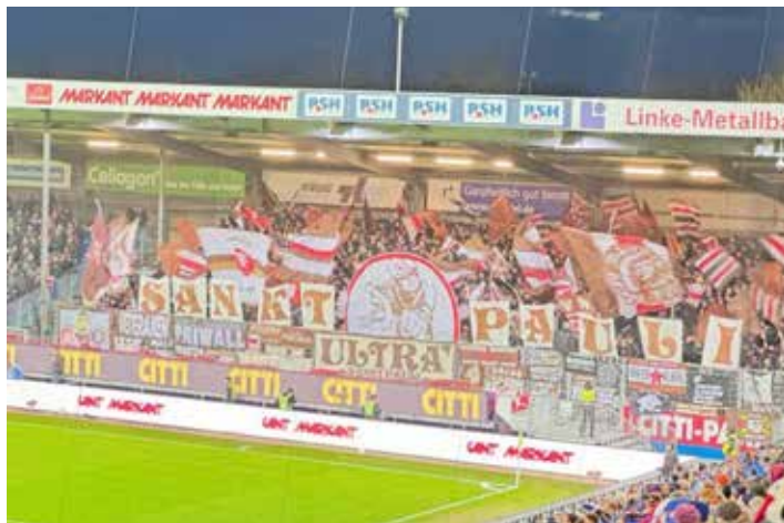
Der Hamburger Gästeblock durfte gleich viermal jubeln