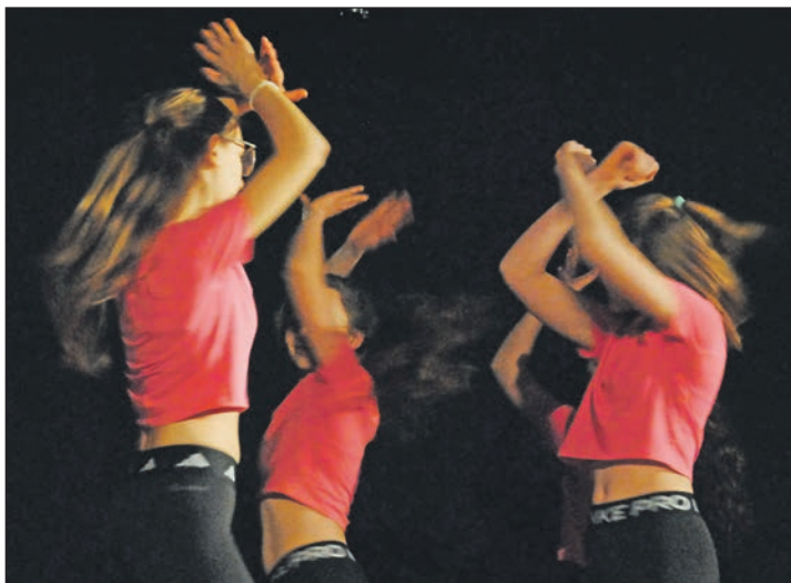
Tanzvorführungen und Musik als willkommene Abwechslung auf einem wortlastigen Neujahrsempfang. Hier die Vorführung einer Jugendgruppe des Tanzsportclubs Schönberg