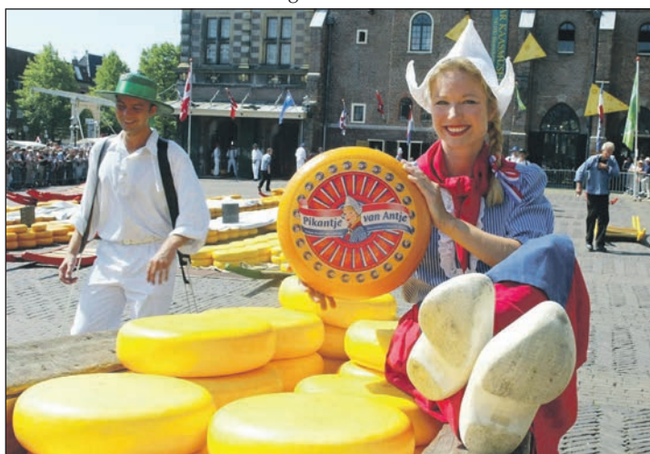
Weltberühmt in Holland ist natürlich der Käsemarkt.