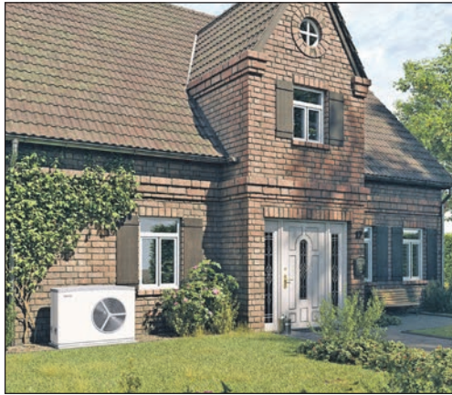
Umweltfreundlich und nachhaltig heizen: Wärmepumpen sind auch für die Modernisierung im Altbau vielfach die richtige Wahl.

Kreis Plön/ Ostholstein (DJD). Unabhängig von Öl und Gas werden und den Klimaschutz unterstützen, ohne in Sachen Heizung auf Komfort verzichten zu müssen: Diese Argumente sprechen für den Umstieg von Öl- oder Gaskesseln auf moderne Heizsysteme wie eine Wärmepumpe. Im Neubau bilden sie schon heute die dominierende Technik. Allerdings