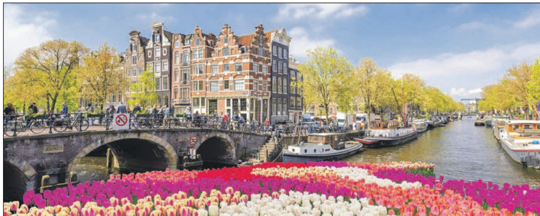
Ein ganzes Land blüht im Tulpenrausch, und Amsterdam begeistert die Besucher mit einer großen Grachten-Rundfahrt.

Sie findet zu Top-Terminen vom 18. bis 21. April 2024 mit dem einmaligen Erlebnis des weltweit größten Blumencorsos sowie zum Feiertag vom 1. bis 4. Mai 2024 statt. Auf die Gäste warten ein exklusives First-Class-Designer-Hotel mit modernsten Hotelzimmern und reichhaltiger