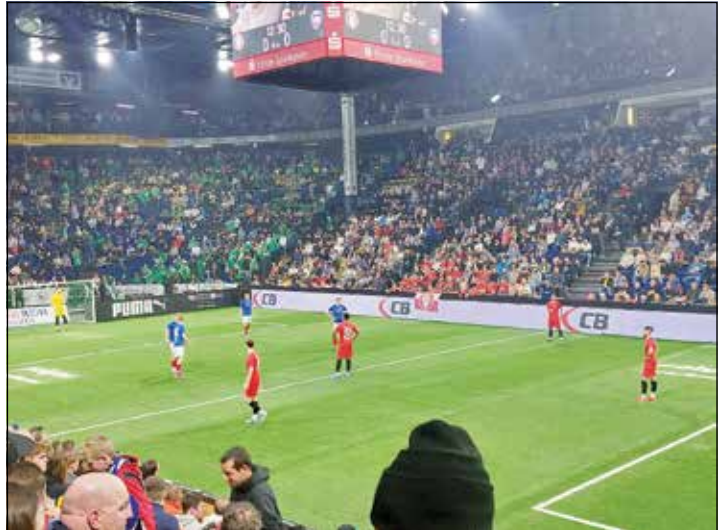
Klarer 4:0-Derbysieg für den FC Kilia.

1:0. Das goldene Tor zum erstmaligen Cup-Sieg schoss Tom Baller. Die Flensburger hatten sich im Halbfinale gegen den einmal mehr mit einer starken Fangemeinde angereisten SV Todesfelde nach Neunmeter-schiessen mit 5:4 durchgesetzt,