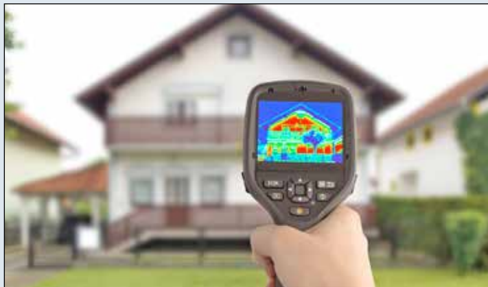
Die Wärmebildkamera zeigt, wo es im Haus energetischen Sanierungsbedarf gibt. Mit einer richtigen Dämmung können die Wärmeverluste vermieden werden.

vier Wänden und reduziert somit den Energiebedarf. Durch einen geringen Wärmebedarf des gesamten Gebäudes wird der Betrieb der Wärmepumpe effizient. Umso einfacher gelingt die Umstellung auf eine