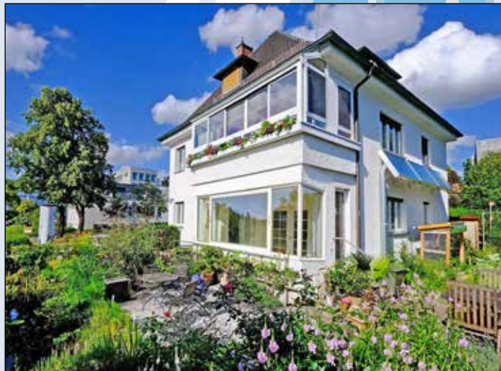
Eine Solarlüftung an der Südfassade sorgt jetzt für ein besseres Raumklima im Keller.

Das schmucke Eigenheim der Familie Streich in Amberg in der Oberpfalz wurde bereits 1936 gebaut und seitdem liebevoll gepflegt. Nur die Raumluft im Untergeschoss sorgte immer wieder für Kopfzerbrechen. Der Hauseigentümer ließ sich umfassend beraten und entschied sich für eine Solarluftanlage. Dazu ließ er eine sechs Quadratmeter große Luftkollektoranlage an der Südfassade installieren. Sie reicht aus, um eine Kellerfläche von 40 bis 60 Quadratmetern zu belüften sowie zu entfeuchten. Das Funktionsprinzip ist einfach: Mit solarer Unterstützung wird Frischluft von außen nach Bedarf vorgewärmt und in die Kellerräume geführt. Die Wirkung der Anlage von Grammer Solar überzeugt den Eigentümer Bernhard Streich: „Bereits nach we-