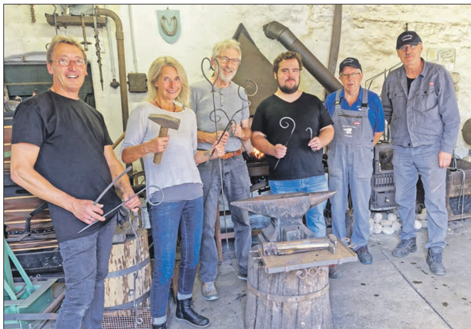
In der Alten Lutterbeker Schmiede führen am 27. April zwei Mitglieder des Trägervereins in das Schmiedehandwerks ein.