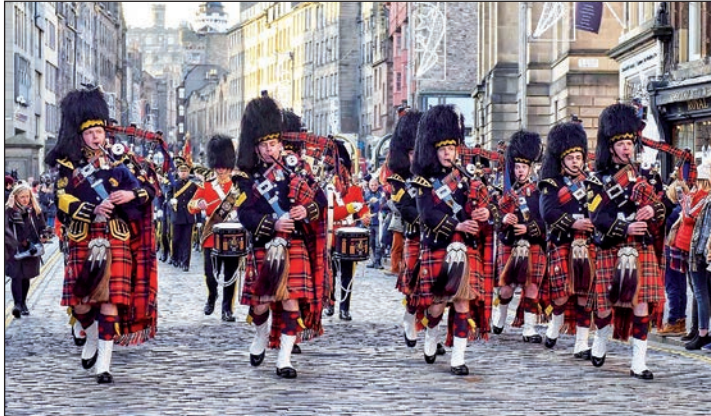
Eine der schönsten Welt-Metropolen erwartet unsere Leser mit Edinburgh zwischen der zauberhaften Altstadt und dem Schloss mit der weltberühmten Garde.

Metropole. Zum großen Leistungspaket der Probsteer-Sonderreise zum Schnäppchenpreis gehören neben der Busfahrt direkt ab Kiel, Schwentimental und Preetz im Vier-Sterne-Reisebus zwei Übernachtungen an Bord der großen Jumbo-Direktfähren der DFDS auf der Strecke Amsterdam-