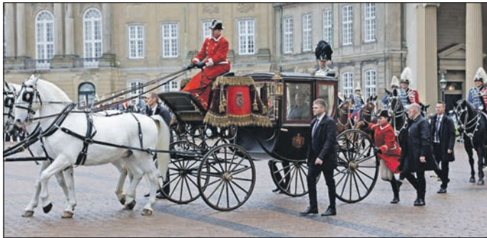
55 „reporter“-Reisende waren dabei, als in Kopenhagen Geschichte geschrieben wurde.