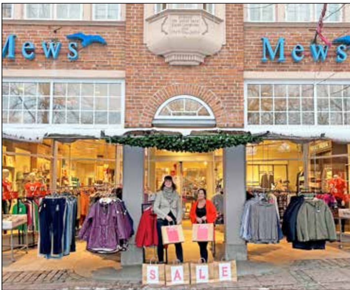
Das Modehaus Mews startet in den Winterschlussverkauf mit attraktiven Angeboten.