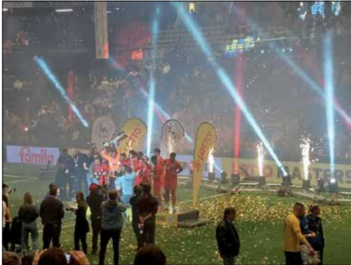
Der verdiente Masters-Sieger Kilia Kiel

Diesmal gingen die Punkte mit 4:0 an Kilia. Das entscheidende Duell zum Weiterkommen für die Störche wurde dann gegen den späteren Finalteilnehmer TSB Flensburg mit 0:1 verloren. Auch Drittligist VfB Lübeck, der ebenfalls seine Nachwuchsspieler schickte, sowie Titelverteidiger Weiche Flensburg, schieden frühzeitig aus. In Kiel gab es, wie in allen Bundesligastadien, eine Gedenkminute für Franz Beckenbauer. Der „Kaiser“ war am 7. Januar 2024 im Alter von 78 Jahren verstorben.