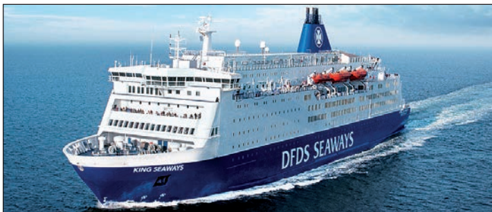
Auf Entdecker-Kurs mit den großen Jumbo-Fährschiffen reisen die Probsteer-Leser zum Schnäppchenpreis nach Schottland.

Newcastle-Amsterdam inklusive Zwei-Bett-Kabinen mit DU/WC sowie zwei großen Schlemmer-Frühstücksbuffets an Bord (komfortable Zwei-Bett-Außenkabinen mit unteren Betten für Hin- und Rückfahrt sind gegen Aufpreis von nur 39 Euro pro Person zusätzlich buchbar), eine Hotel-Übernachtung im guten