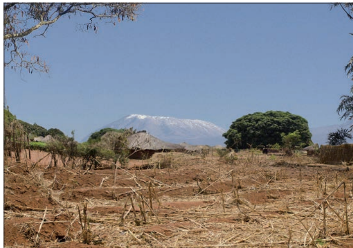
Ausgetrocknete Kaffeeplantage am Kilimanjaro: eines der Themen, die auf dem Info-Abend erörtert werden.