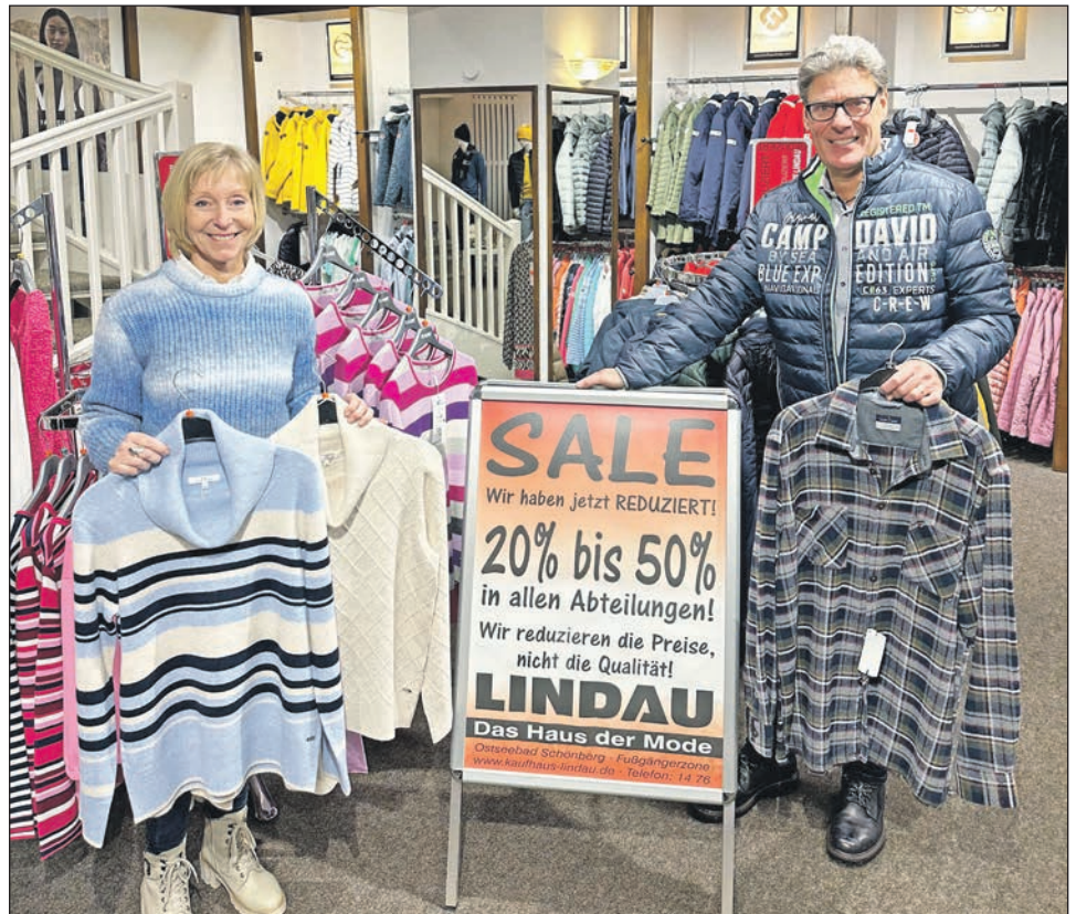
Der Winterschlussverkauf mit vielen attraktiven Angeboten startet bereits am Mittwoch, 17. Januar.