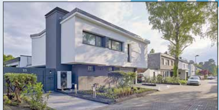
Eine Wärmepumpe ist im Regelfall nur in Kombination mit einer adäquaten Gebäudedämmung effizient: Die Reihenfolge energetischer Sanierungsarbeiten ist entscheidend für ihre Wirkweise.

Unverzichtbar ist dabei die Expertise von Fachbetrieben. Sie können die nötigen Dämmmaßnahmen ermitteln und fach-