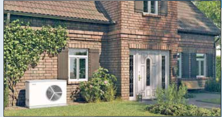
Umweltfreundlich und nachhaltig heizen: Wärmepumpen sind auch für die Modernisierung im Altbau vielfach die richtige Wahl.

Vorurteil 1: Wärmepumpen verbrauchen viel Strom. Treiben Wärmepumpen die Kosten fürs Heizen in die Höhe - und heizt man womöglich das Zuhause ausschließlich mit Strom? Dieses Vorurteil lässt sich schnell widerlegen: Tatsächlich machen sich die Anlagen kostenfrei Umweltenergie etwa aus der Umgebungsluft zunutze. Dazu benötigen Wärmepumpen den Strom lediglich als Antriebsenergie. „Auf diese Weise machen