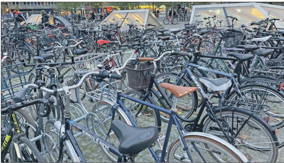
Bei den Bestandszahlen haben Bio-Fahrräder derzeit noch die Nase vorn. In Deutschland wird er auf etwa 70 Millionen geschätzt, gegenüber 10 Millionen Fahrrädern mit Elektromotor.