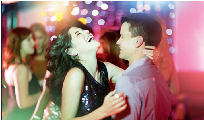
Mit Tanzen lässt sich Schwung ins neue Jahr bringen.