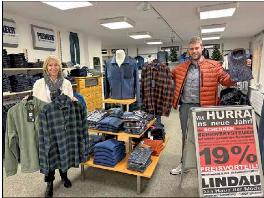
Bis Samstag, 6. Januar läuft im Modehaus Lindau die Inventur-Verkaufs-Aktion.

Schönberg (t). Noch 4 Tage läuft im Schönberger Modehaus Lindau die Inventur-Verkaufs-Aktion. Während der Inventur hat das Modehaus weiterhin in allen Abteilungen radikal alle Einzelstücke reduziert. Jeder Kunde bekommt noch bis Samstag, 6. Januar die Mehrwertsteuer von 19 Prozent auf seinen Einkauf geschenkt. Ausgenommen davon sind lediglich bereits reduzierte Ware, sowie aktuelle Frühjahrsware 2024, nachlieferbare Artikel und weiße Wäsche. Ansonsten gilt der Rabatt von 19 Prozent auf die gesamte modische aktuelle Winterkollektion 2023. Das Modehaus Lindau in Schönberg in der Fußgängerzone bie-