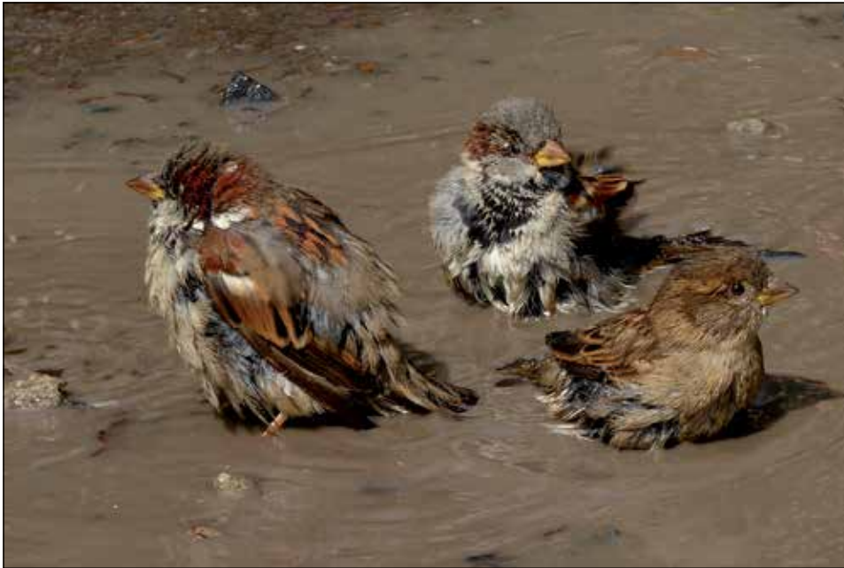
Anfang Januar ist wieder Vogelzählung. Mehr Infos dazu auf Seite 3.