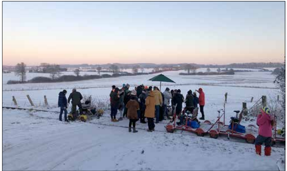
Auf ins Wintervergnügen: Der Verein Schienenverkehr Malente-Lütjenburg lädt zur Neujahrsfahrt ein.

Von Lütjenburg ist die Rückfahrt per Bus/Bahn mit dem ÖPNV möglich, sodass man eine Rundfahrt erlebt und warm & trocken zurück zum Ausgangspunkt kommt. Die Fahrt im ÖPNV ist nicht im Preis inbegriffen. Preis p.P. für Erwachsene 30 EUR, für Kinder bis 14 Jahren 15 EUR (Verpflegung inklusive).