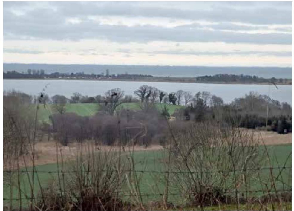
Auf dem Hessenstein genießen Ausflügler einen weiten Blick über die Hügellandschaft.

Vom Hessenstein aus schweift der Blick über den Selenter See und die Probstei bis zur Kieler Bucht, weit über die Ostsee und in die Holsteinische Schweiz. Die höchste