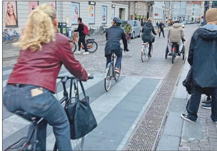
E-Bikes auf der Überholspur: Geht höheres Tempo womöglich zu Lasten der Sicherheit?

Zunächst ein Blick hinter die Kulissen. Seit Jahren bereits ist die Fahrradbranche mit viel Rückenwind unterwegs. Das machen Zahlen des Zweirad-Industrieverbandes (ZIV) deutlich. Eigenen Angaben zufolge hat sich der Branchenumsatz seit 2012 fast vervierfacht, 2022 waren es bereits mehr als 7 Milliarden Euro. „Treiber dieser Entwicklung ist ganz klar das E-Bike“, sagt ZIV-Pressesprecher Reiner Kolberg. Wurden 2014 erst