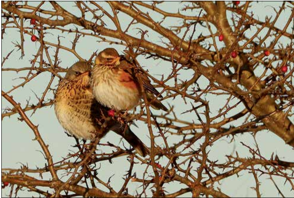
Wacholderdrosseln im Weißdorn. Die Beeren heimischer Sträucher sind im Winter die Nahrung vieler Vogelarten.

Und noch etwas Wichtiges: Auch wenn nur wenige Vögel während