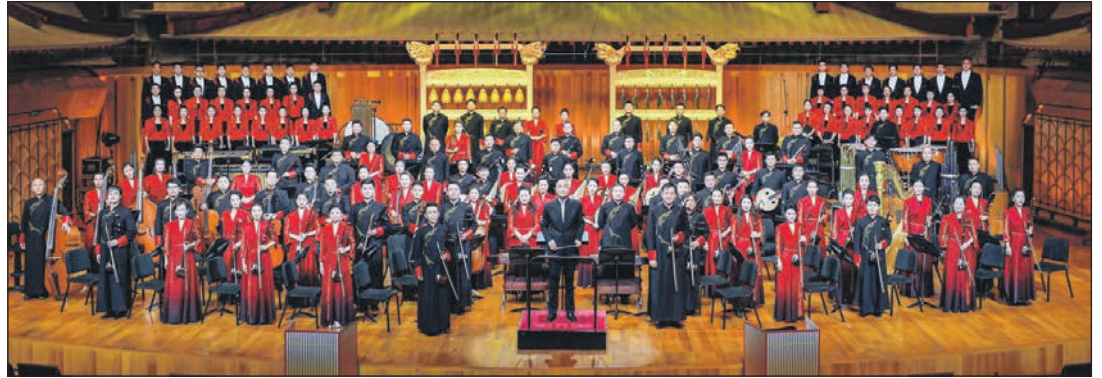
Mit weit mehr als 100 Mitwirkenden reist das weltberühmte „China Orchestra National“ erstmals zum großen Neujahrs-Konzert nach Deutschland.

Heikendorf/ Mönkeberg (t). Berauschte Klangwelten der Spitzenklasse erwarten unsere Leser:innen beim sensationellen Gala-Konzert im großen Saal der Elbphilharmonie Hamburg, mit dem weltberühmten „National Orchestra China“ in ganz großer Besetzung: mit Chor und Musikern mit weit mehr als 100 Mitwirkenden im kongenialen Zusammenspiel mit der weltbesten Pipa-Spielerin Thao Cong. Mit dem erstmaligen Gala-Konzert in Hamburg feiert das internationale Top-Orchester den Auftakt zum Jahr des Drachen mit einem populären und beschwingten Neujahrs-Konzert. Die Busfahrt erfolgt ab Kiel, Schwentental und Preetz! Eintrittskarten inklusive der Busfahrt gibt es bereits zum Kom-