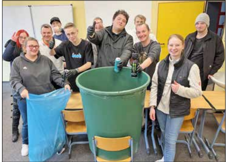
Nachhaltigkeit lohnt sich. Fleischereiauszubildende konnten durch das Sammeln von Dosen- und Flaschenpfand 105 Euro spenden.