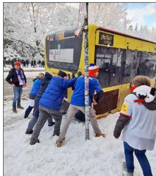
Vollen Einsatz zeigen die Holsteins-Fans auch vor dem Stadion.

In Kiel ist man eigentlich komplett ohne Druck in die Saison gestartet, Ziel war es nach den vielen Abgängen eine neue Mannschaft zu formen und natürlich die Klasse zu halten. Letzteres ist wohl nur noch eine Formsache. Doch