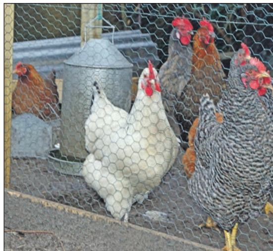
„Wir müssen drinnen bleiben“ – ab sofort gilt in der Schutzzone die Aufstallung des Geflügels.

Anzeigepflicht des Tierbestandes Absonderung zum Schutz vor