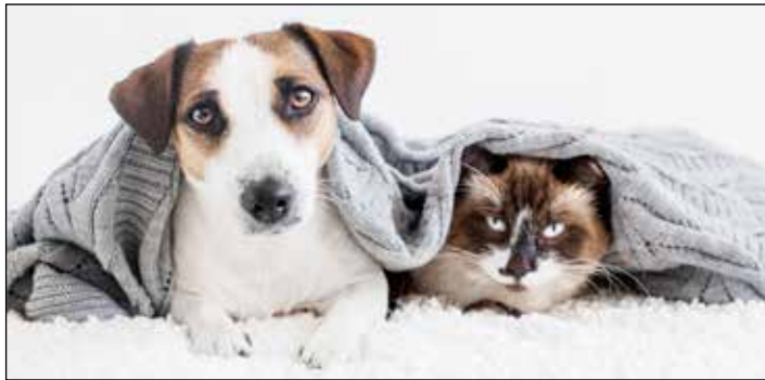
Man kann einige Dinge beachten, damit es den Haustieren an Silvester gutgeht.

Spätestens am 31. Dezember, wenn die Dämmerung einbricht, sind die ersten Böller zu hören. Auch noch Tage nach dem Jahreswechsel knallt es vereinzelt hier und da. „Hunde sollten in dieser Zeit immer an der Leine geführt werden, um zu verhindern, dass