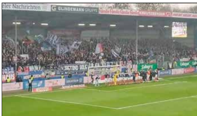
So wollen sie Störche auch 2024 feiern.