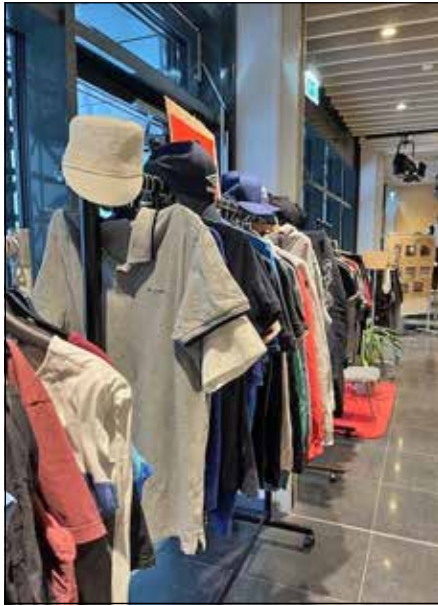
Oberstufenschüler sortierten die Kleiderspenden