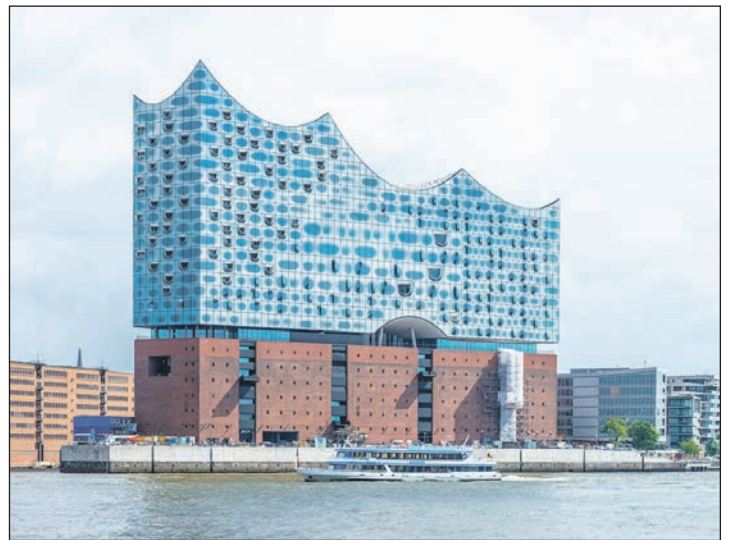
Berauschte Klangwelten am Elbufer: Unsere Leser:innen sind zu Gast im großen Saal der Elbphilharmonie