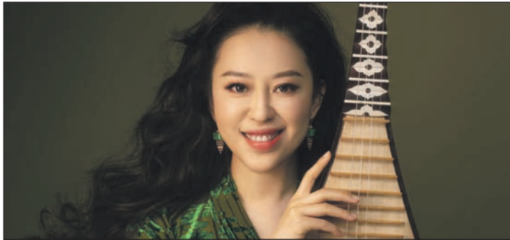
Die berühmteste Pipa-Spielerin der Welt zu Gast in der „Elphi“: Thao Cong