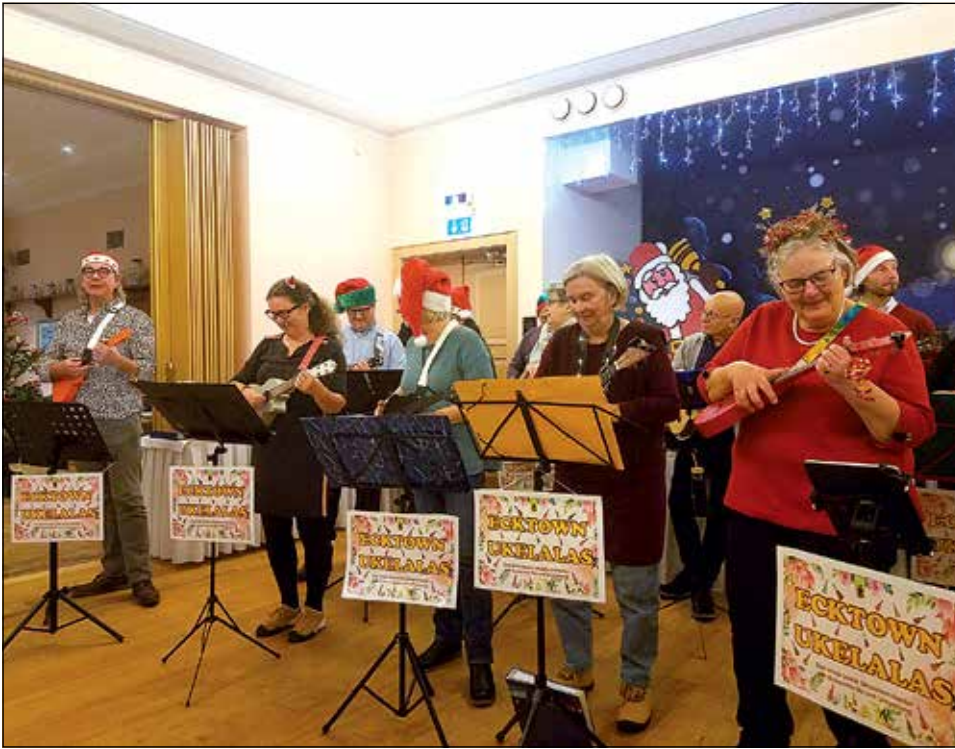
Die Ecktown Ukelalas sorgten bei der Weihnachtsfeier der Schönberger Landfrauen für Musik und gute Stimmung.

Der Chorleiter der Ecktown Ukelalas animierte immer wieder zum Mitsingen. Und mit seiner lockeren humorvollen Art schaffte er es, dass alle Landfrauen begeistert mitmachten. Auf dem Programm stand ein Repertoire, das von klassischen Weihnachtsliedern wie „Alle Jahre wieder“ über