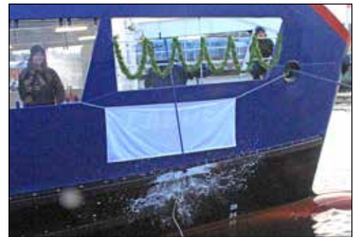
Erst beim zweiten Versuch zerschellt die Sektflasche an der Scheuerleiste

Im Anschluss an die Schiffstaufe der „MS Laboe“ war dort der Empfang für geladene Gäste. Ab 12 Uhr konnte das neue Schiff besichtigt werden.