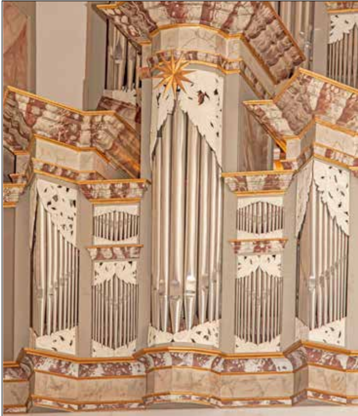
Blick auf das Rückpositiv der historischen Orgel aus der Barockzeit.

Rhythmusgefühl Rechnung tragen, runden die musikalischen Darbietungen ab. Nicht zuletzt wird auch die schöne historische Barockorgel von St. Katharinen in dem Kirchenschiff erklingen. Karten zu dem Konzert gibt es ab sofort zu den Öffnungszeiten des Kirchenbüros, Alte Dorfstraße 49 in Probsteierhagen, und an der Abendkasse ab 17.30 Uhr.