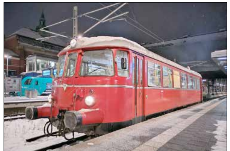
Mit dem historischen Schienenbus geht es zum Lübecker Weihnachtsmarkt.

rück. Die Abfahrten sind in Neumünster um 12.18 Uhr, ab Kiel um 12.55 Uhr, Preetz um 13.11 Uhr, Plön um 13.26 Uhr, Malente um 13.35 Uhr und Eutin um 13.40 Uhr. Die Bordbar sorgt mit Glühwein, heißer Bockwurst und Getränken für das leibliche Wohl der Fahrgäste. Die Platzzahl des Triebwagens ist begrenzt. Es empfiehlt sich daher, den Vorverkauf auf www.hehs-eisenbahn.de/termine/ zu nutzen.