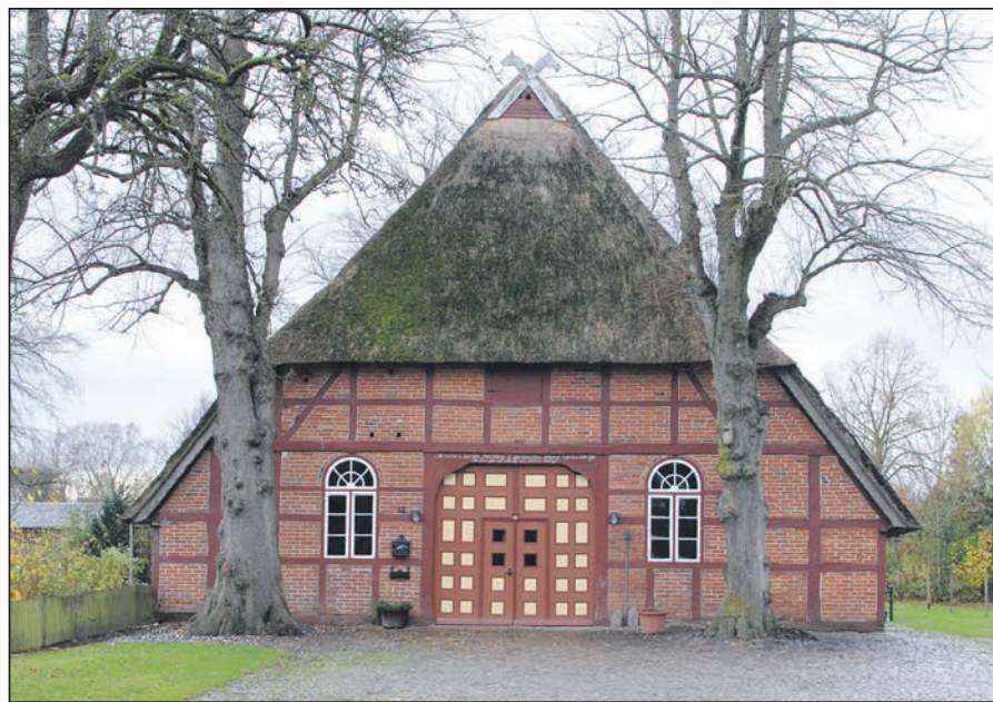
Zwei alte Linden flankieren die Dielentür, die „Groot Döör“, hinter der sich der historische Wirtschaftsbereich des Niederdeutschen Hallenhauses verbirgt.

das gutsherrliche Forsthaus „Liebeseele“ des ehemaligen Gutes Schönweide und den geretteten Schafstall berichten wir in der kommenden Woche.