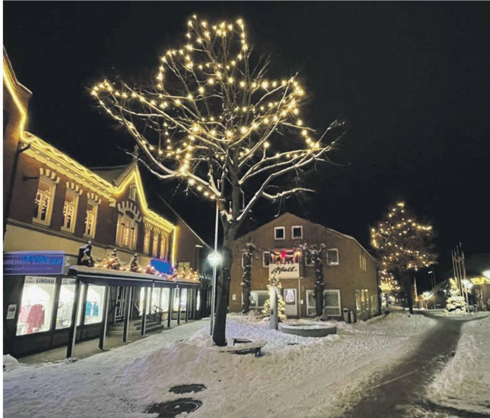
Winterliche Atmosphäre im Modehaus Lindau

Schönberg (t). Auf drei Etagen präsentiert das traditionsreiche Modehaus Lindau in der mit den Marken Calida, Mey, Schiesser und Triumph. Hier bleiben keine Wünsche offen.