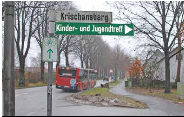
Zufahrt zur Straße „Krischansbarg“. In den nächsten Jahren sollen hier 25 Hektar bebaut werden. Für die weitere Planung ist jetzt der Bauausschuss gefragt.

Heikendorf (mm). Ende einer wochenlangen und hitzigen Diskussion: 25 Hektar Land am „Krischansbarg“ werden zum Baugebiet. In öffentlicher und namentlicher Abstimmung kippten die Gemeindevertreter vorige Woche ihren ursprünglichen Beschluss vom 8. Februar dieses Jahres. Demzufolge wäre eine Wohnbebauung für die nächsten fünf Jahre auf Eis gelegt worden. Der Weg ist nun frei: Auf dem Krischansbarg soll nicht nur ein neues Gymnasium entstehen, sondern auch bis zu 500 Wohneinheiten. Der Bauausschuss ist gefragt, um konkrete Vorschläge zu machen. Er muss klären, welche Forderungen die Gemeinde stellen will, wenn sie am Verhandlungstisch dem Kronsahgener Stadtentwickler BIG