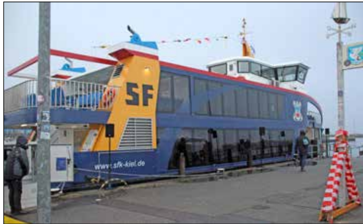
„MS Laboe“ vor der Taufe

Die Schiffstaufe ist ein feierlicher Akt, durch den das Boot seinen Namen erhält: Sie erfolgt traditi-