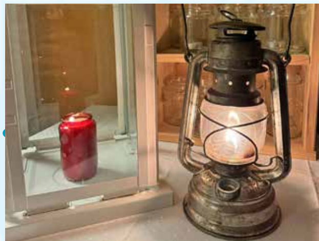
Das Friedenslicht der Pfadfinder wird in ganz Europa seit 1986 verteilt