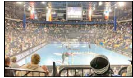
In Kiel muss man noch bis zum 20. Dezember auf ein Heimspiel warten.

Kreis Plön (dif). Mit einem 31:27-Erfolg der Marke „Pflichtsieg“ kehrte der THW Kiel am vergangenen Samstag aus Erlangen zurück. Auch wenn das Spiel beim Ligasechzehnten doch ein wenig mühsam daherkam, zwei wichtige Zähler allemal und den Kontakt zu den „Top vier“ der Handballbundesliga gehalten. Am