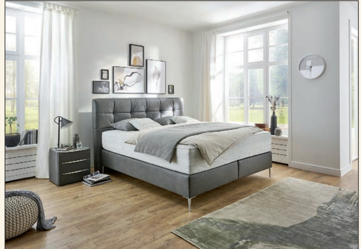
Schlafkomfort fängt beim passenden Bett an.

Hinzu kommt das individuelle Empfinden von Komfort und Gemütlichkeit, das sich bereits beim Probeliegen einstellen muss. „Verbraucher im Möbelgeschäft sollten sich mindestens 15 Minuten Zeit nehmen, allein um die Matratze beim Aufstehen und Hinlegen sowie in verschiedenen Liegepositionen auf die individuellen Bedürfnisse hin zu testen. Denn schließlich werden sie nach dem Kauf rund ein Drittel ihrer