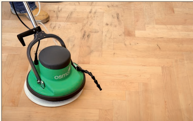
Auch hartnäckiger Schmutz kann beseitigt werden.