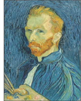
Meisterwerke von weltberühmten Malern aus aller Welt entdecken unsere Leser bei den Kunst-Sonderfahrten nach Bremen direkt ab Eutin.

der Weser. Anmeldungen sind ab sofort möglich bei den Probsteer-Leser-Reisen des Burg-Verlages, Montag bis Freitag von 9 bis 13 Uhr oder per Telefon 04521/701130 oder direkt im Internet online unter „www.burg-verlag.info/leserreisen“.