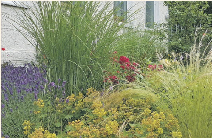
Auch die breite Palette der Ziergräser ist für einen pflegeleichten Vorgarten ideal.

Flechten setzen sich fest und schon ist das Einheitsgrau dahin.