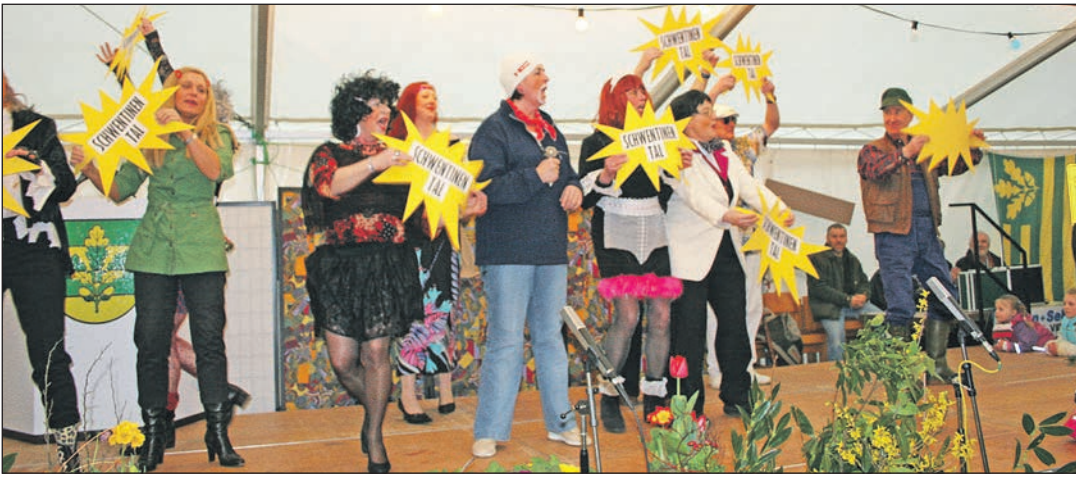
Schlusspunkt und Startschuss zugleich: Am 01. April 2008 entstand aus den ehemals selbständigen Orten Klausdorf und Raisdorf die Stadt Schwentental. Hier ein Foto von den Gründungsfeierlichkeiten