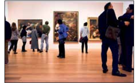
Das derzeit berühmteste Kunst-Museum Europas erwartet unsere Leser in Potsdam mit dem Barberini-Museum mit der sensationellen neuen Munch-Ausstellung.

Anmeldungen sind ab sofort täglich von 9 bis 13 Uhr bei den Probsteer-Leser-Reisen des Burg-Verlages in Eutin sowie unter Telefon 04521-701130 oder direkt online im Internet auf leserreisen.der-reporter.info möglich.