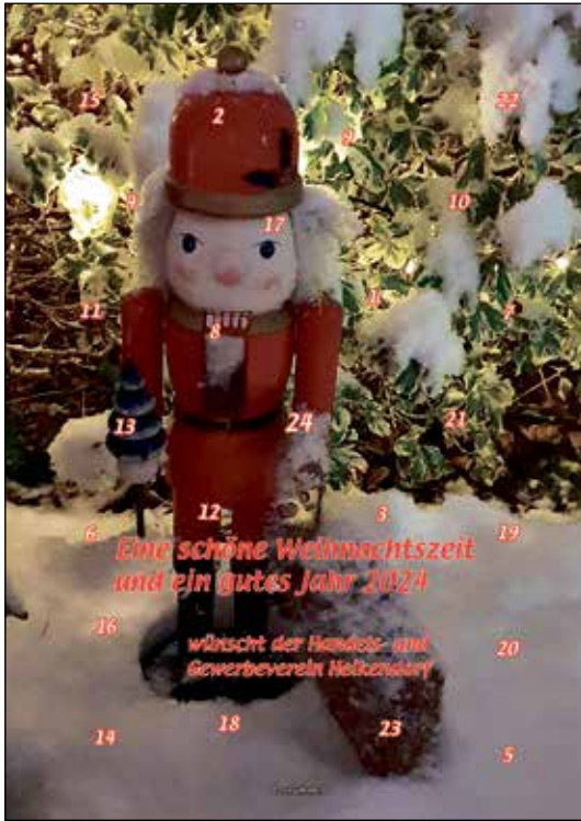
HGV Adventskalender 2023

alljährlich die Arbeit von Vereinen, Initiativen und Institutionen