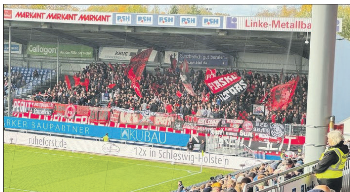
Die Gäste hatten zahlreiche Franken mitgebracht...