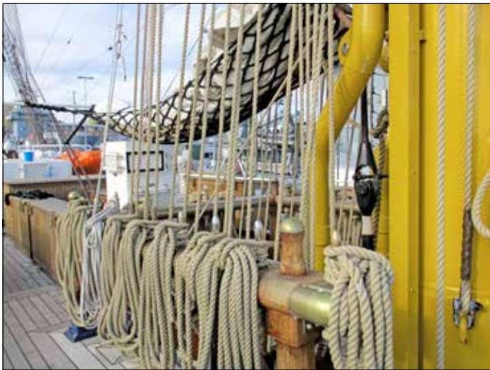
Welcher Tampen gehört wohin.

Und auch „De Brummelbuttjes“ freuten sich über ein Geschenk zum Abschied: „Uns wurde als Dank für unseren Besuch und Gesang eine Flasche 40-prozentiger Gorch Fock-Manöverschluck überreicht.“