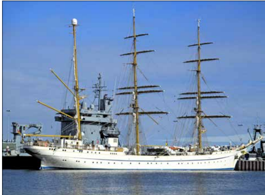
Die Gorch Fock von der Kiellinie aus gesehen.