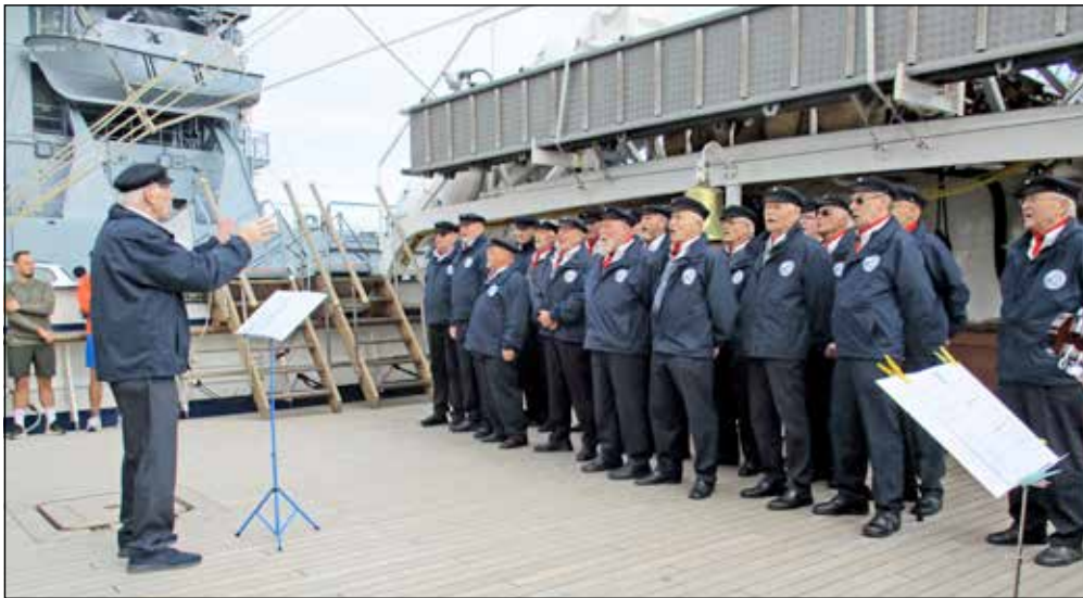
Gesangseinlage auf dem Mitteldeck.

Die Offizierschüler lernen die Elemente kennen, die für ihr künftiges Berufsleben natürliche Umgebung sein werden. „Dabei wird kein Unterschied zwischen Frauen und Männern gemacht“, so Straßner. „Die vielen Seile und Tampen haben alle ihre Bedeutung, und da muss beim Setzen der Segel jeder Handgriff auf Anheiß sitzen.“ Immerhin müssen rund 1800 Quadratmeter Segelfläche – zehn Rah-, drei Gaffel- und