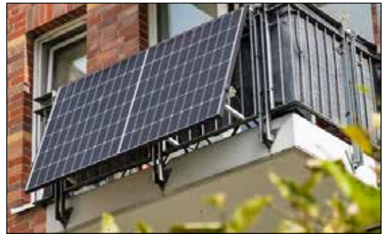
In diesem Jahr können mit dem Heikendorfer Adventskalender unter anderem zwei Balkonkraftwerke gewonnen werden (Symbolbild).

gibt es Sonderpreise im Wert von 200 bis 1.000 Euro. In diesem Jahr enthält der Kalender Preise im Gesamtwert von rund 6.500 Euro. Die Ziehung der Gewinnzahlen erfolgt unter der Aufsicht des Gemeindeführers. Vom 1. bis zum 24. Dezember finden Sie täglich aktuell diese gezogenen Zahlen auf der Homepage des HGV unter www.hgv-heikendorf.de und im Schaufenster des Eiscafé Venezia in der Dorfstraße 18 sowie wöchentlich zusammengefasst in dieser Zeitung. Wir drücken die Daumen, dass die aufgedruckte Zahl auf Ihrem Adventskalender mit einer der Gewinnzahlen übereinstimmt und Sie damit bald einen der attraktiven Preise in den Händen halten können.