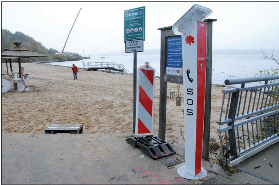
Schnell vom Strand erreichbar: Notrufsäule in Mönkeberg.

und Schwentine-Holsteinische Schweiz, der Kreis Plön weitere 25 Prozent. Für die Gemeinden blieben nur noch die restlichen zehn Prozent, und die „laufenden Kosten“. Doch die seien sehr gering, erläutert Projektmanager Mihm. „Denn die Säulen sind praktisch wartungsfrei, die eingebauten Akkus halten drei bis vier Jahre“. Die meisten Notrufsäulen benötigen wegen des eingebauten Solarmoduls noch nicht einmal Strom von außen. „Die ist nur an einigen wenigen