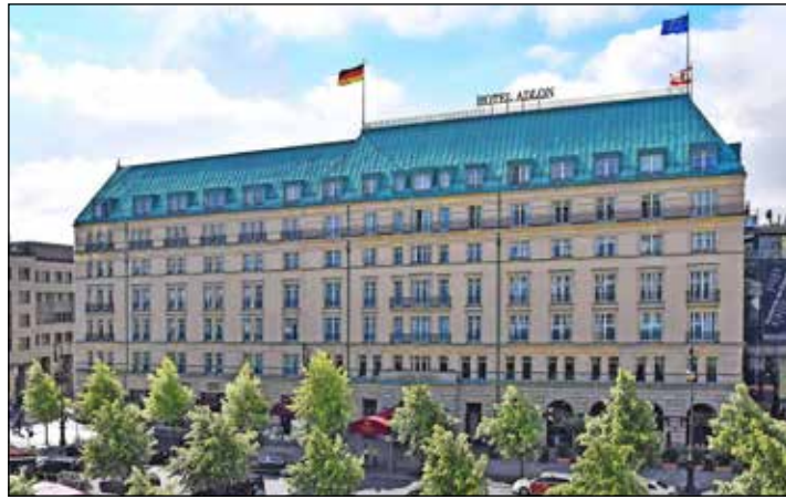
Das „berühmteste Hotel der Welt“ am Pariser Platz in Berlin können die Probsteer-Leser im Januar 2024 ausführlich genießen.

Als kulturellen Höhepunkt der dreitägigen Sonderreise zum Top-Termin vom 28. bis 30. Januar 2024 zum sehr günstigen Komplettpreis von nur 475 Euro genießen unsere Leser inklusive Eintritt ohne Warteschlangen und einschließlich Hin- und Rücktransfer das weltberühmte Barberini-Museum in Potsdam mit der gerade frisch eröffneten großen Sonderausstellung