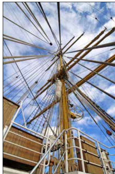
Die hohen Masten.