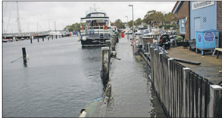
Gewerbehafen beim Hafenmeister

seit der Mittagszeit bis um 17.20 Uhr acht Einsätze im Amtsgebiet durchgeführt. Es waren überwiegend entwurzelte Bäume, die von der Feuerwehr zu beseitigen waren.