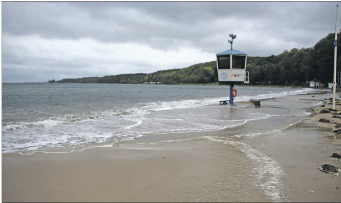
Am Möltenorter Kurstrand

In Heikendorf waren die Strandkörbe bereits ins Winterlager gekommen. In der Heikendorfer Bucht lagen einige Frachtschiffe auf Reede, um den Sturm abzuwarten. Die Freiwillige Feuerwehr Heikendorf hatte am Freitag