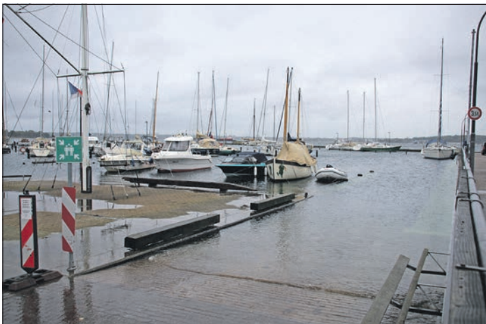
Slipplanlage im Yachthafen