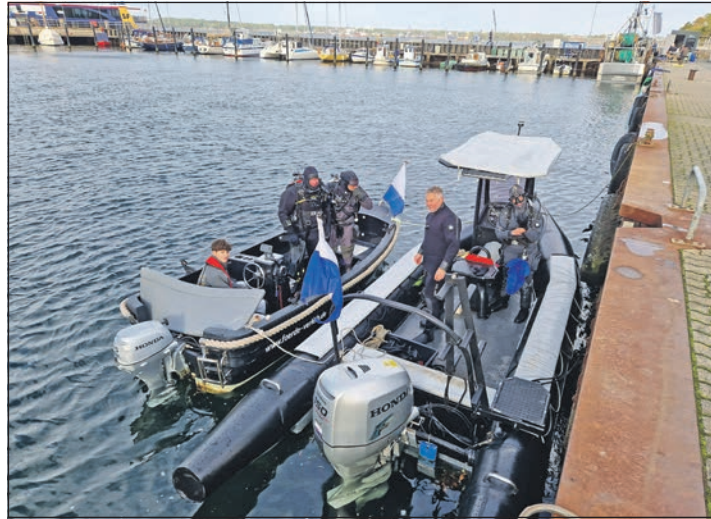
Unterstützung gab es vom Boot aus.

Schläuche, Teppich- und Netzreste bis hin zu Autoreifen und vielen Gartenstühlen. Von der Landseite aus wurden die Taucher von zwei Teams unterstützt, die die Gegenstände in Empfang