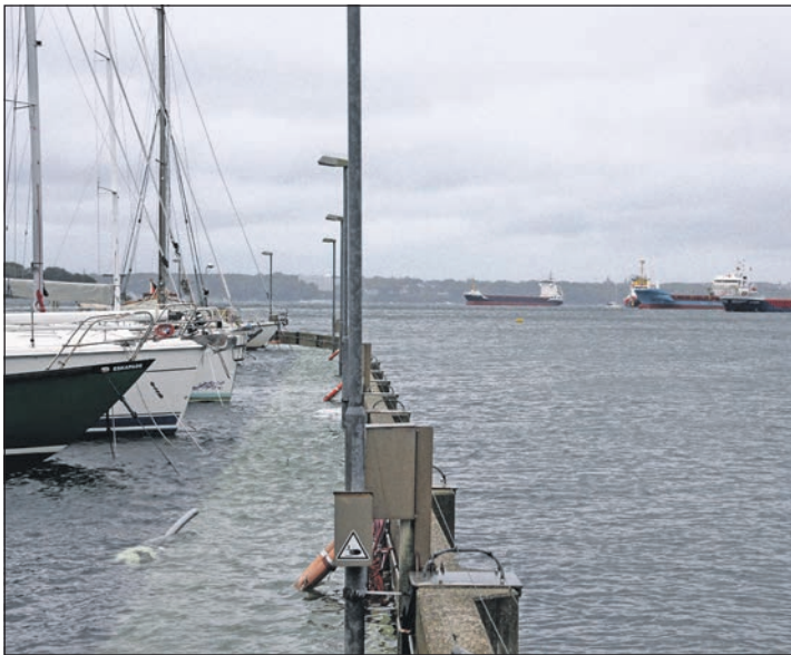
Yachthafen und Frachtschiffe in der Heikendorfer Bucht vor Anker