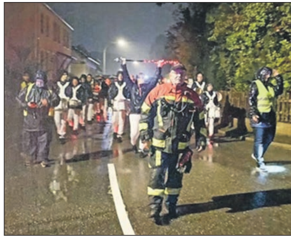
Laternenumzug in Schönkirchen – von der Feuerwehr begleitet im Sturm.

Schönkirchen (dc). Es war ein regnerischer Freitag, der 6. Oktober in Schönkirchen. Doch an diesem Abend waren die kleinen Laternen, beleuchteten Bugbys und knallgelben Regenjacken im regnerischen Sturm unübersehbar. Die Freiwillige Feuerwehr in Schönkirchen veranstaltete trotz des nassen Wetters den Laternenumzug. Dabei gab es zwei Spielmannszüge. Sie starteten bei der Feuerwehr in Schönkirchen und beim Bahnhof im nahe gelegenen Oppendorf. Seit über 25 Jahren hat der La-