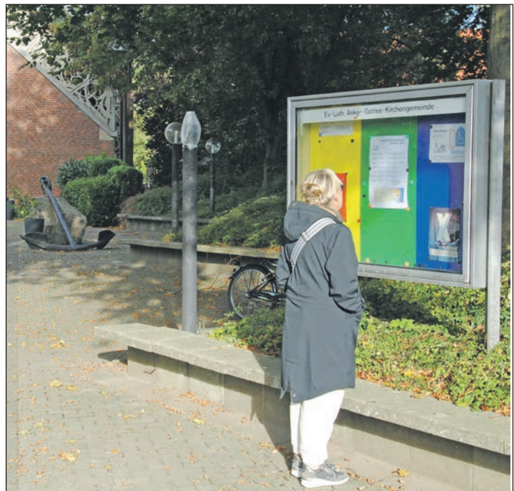
Eine Frau informiert sich über Veranstaltungen der Anker-Gottes-Gemeinde Laboe. Bei den kirchlichen Angeboten wird sich hier und in den anderen Gemeinden zunächst nichts ändern.