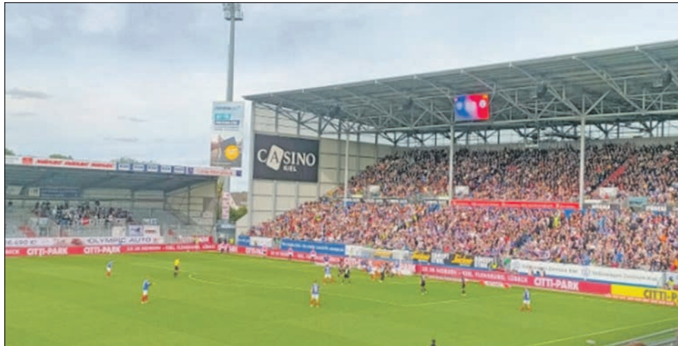
Bühne frei: Sonntag kommt Nürnberg auf den Holsteinplatz.