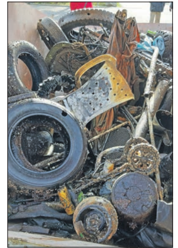
Reichlich Unrat - und das war noch nicht alles.