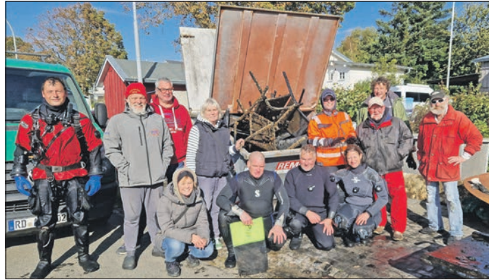
Der Hafenverein sammelte mit Unterstützung von fünf Mitgliedern des Tauch-Sport-Clubs Eckernförde Müll aus dem Hafenbecken.

Heikendorf (t). Fernab von allen Querelen um die umstrittene Umgestaltung des Heikendorfer Hafens schritt der Hafenverein Möltenort jüngst zur Tat: Unter dem Motto „Wie auch immer – erstmal muss der Schiet weg!“ sorgten zahlreiche freiwillige Helferinnen und Helfer, allen voran eine Gruppe von fünf Tauchern und einer Taucherin des Tauch-Sport-Clubs Eckernförde (ein Taucherpaar aus dem Hafenverein konnte vier weitere Clubmitglieder für die Aktion gewinnen) für eine Grundreinigung des Möltenorter Fischereihafens. Dabei konnte eine Unmenge von über Bord oder Steg gegangenen Gerümpel vom Grund geborgen werden: von Getränkedosen und -flaschen über diverse