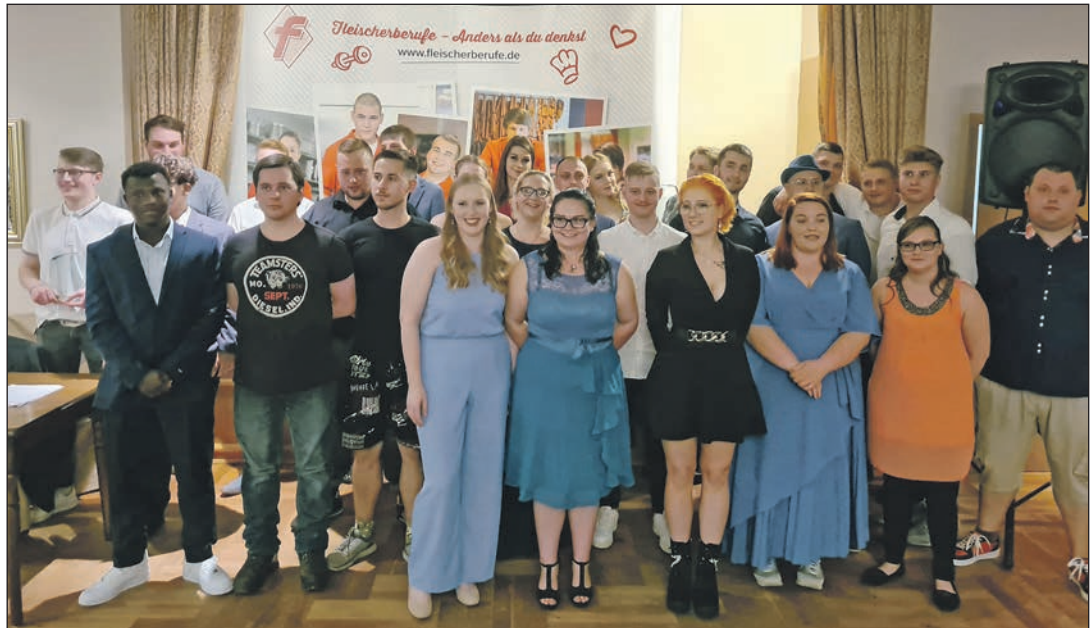
Die in der Abschlussprüfung des Jahres 2023 erfolgreichen Junggesell/innen des Fleischerhandwerks sowie Fachverkäufer/innen im Lebensmittelhandwerk – Schwerpunkt Fleischerei.

In seiner Ansprache hob der Obermeister der größten Innung des Fleischerhandwerks im Land zwischen den Meeren hervor, dass die jungen Fachkräfte einen Großteil ihrer Ausbildungszeit von den Einschränkungen der Corona-Pandemie betroffen waren und sich dennoch nicht