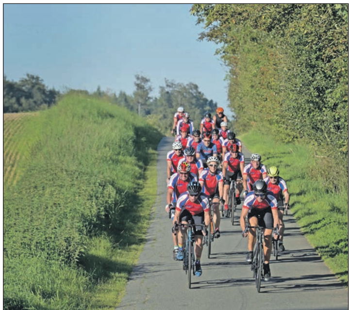
Auf und ab durchs Hügelland: Die Rennradgruppe des LTV Kiel-Ost schwärmt aus und freut sich über Gleichgesinnte, die mit Spaß am 3. Oktober am Almatrieb teilnehmen.

Für die Versorgung aller rüstigen Radler, die zum Almatrieb starten, richtet der Verein auf den Strecken Depots ein, so dass sich die Teilnehmer nach rund 45 Kilometern verpflegen können.