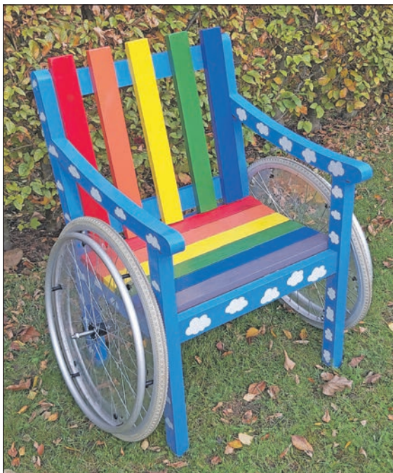
Einer von vielen gestalteten Stühlen, die in der Ausstellung zu sehen sind – Öffnungszeiten: jeweils Montag bis Freitag von 9 bis 16 Uhr im Haus der Diakonie, Preetz.

die Perspektive gewechselt, Barrieren überwunden und die Wahrnehmung gefördert. Das Ergebnis wird in Form von gestalteten Holzstühlen sichtbar, die in mehreren Ausstellungen an verschiedenen Orten gezeigt werden.“