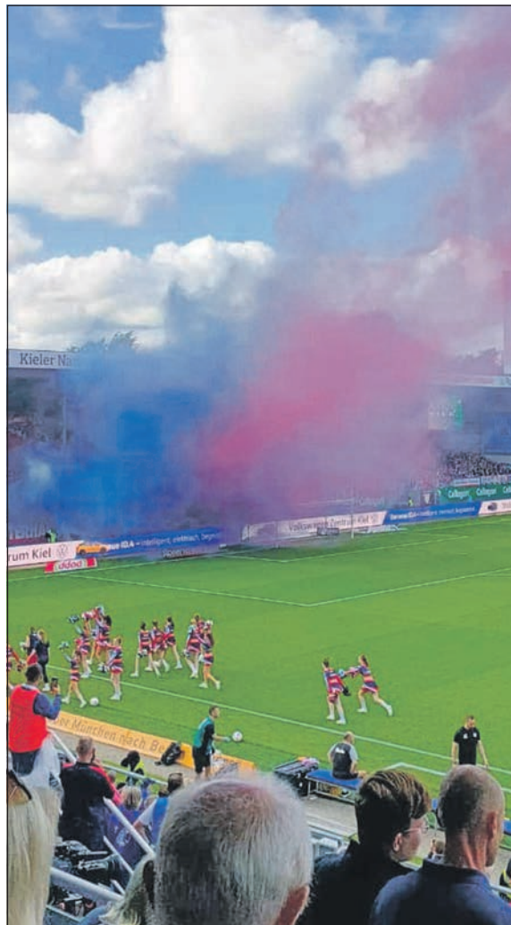
Der Holstein Fanblock glänzte mit Pyrotechnik.