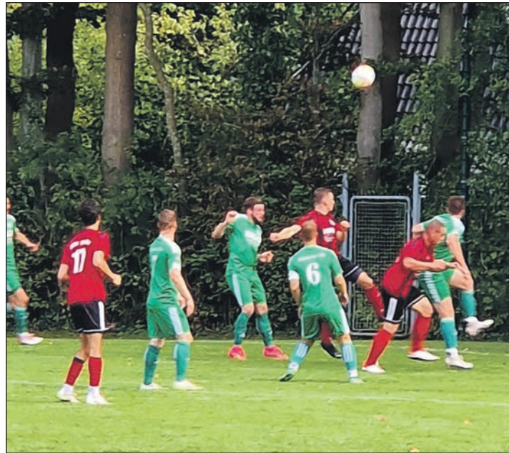
Im Kreisligaspiel des TSV Raisdorf gegen den TSV Stein ist der Ball immer umkämpft.