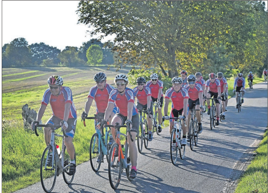
Die Radsportgruppe des LTV Kiel-Ost trainiert in der Saison wöchentlich. Der Almatrieb kennzeichnet das Saisonende und ist als RTF-Veranstaltung ein Ereignis für alle („Jedermann“).

Je nach Kondition und Laune können länger und kürzere Strecken gewählt werden. So bietet der Verein eine etwas kürzere Familien-Tour an, bei der 50 Kilometer gefahren werden. Wer sich für die Cappuccino-Tour entscheidet, legt noch 27 Kilometer mehr zurück. 122 Kilometer werden es bei der Hobby-Tour. Eine vierte Möglichkeit ist die Sport-Tour, bei der die Teilnehmer 162 Kilometer unterwegs sein werden. Da keine Zeitnahme erfolgt, ist mit dem Streckenangebot eine individuelle Belastungsmöglichkeit ge-