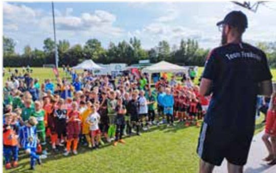
Der 1. Rewe Cup war ein voller Erfolg.