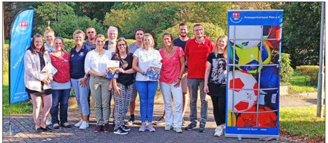
Teilnehmerinnen des Seminars „Aktiv im Kinderschutz“.

Kreis Plön (t). Kinder- und Jugendschutz wird in der Öffentlichkeit mit großer Aufmerksamkeit verfolgt. Alle gesellschaftlichen Gruppen sind aufgefordert noch aktiver zu werden, um den Schutz von Kindern und Jugendlichen zu verbessern. Dies möchte auch der Kreissportverband Plön e.V. ausbauen und bot ein Tagesseminar mit Ausbildung zum Ansprechpartner im Kinderschutz- Schutz vor sexualisierter Gewalt im Sport am 16.09.2023 in Blekendorf an. Mit Hilfe der Sportjugend Schleswig-Holstein, die die Referentin stellte, wurden 15 Teilnehmer/innen zum Ansprechpartner/in für Kinder- und Jugendschutz in Sportvereinen ausgebildet. Themenschwerpunkte waren Kinderrechte, Definition interpersonaler Gewalt, Strafrecht, Kindeswohlgefährdung, Täter/innen Strategien und Profile, Prävention und Intervention von sexualisierter Gewalt, Aufgaben einer Ansprechperson inklusive Handlungsleitfaden und vielem mehr. Sport, Spiel und Bewegung ha-