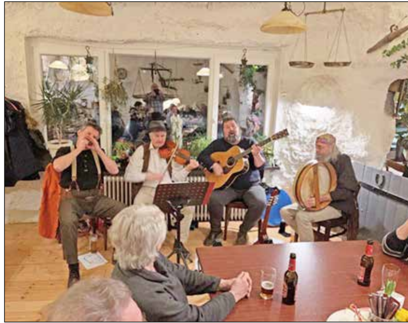
The Inner Tradition sorgt für stimmungsvolle Musik von der Grünen Insel.

Am Freitag, 27. Oktober wird es dann irisch im Bredeneeker Gasthaus: Die Gruppe The Inner Tradition sorgt für stimmungsvolle Musik von der Grünen In-