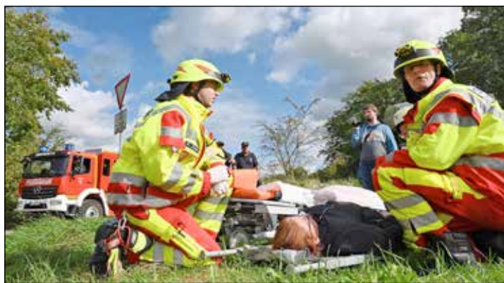
Nach der Explosion finden Rettungskräfte erste Verletzte auf dem Gelände.

zu bringen. Und noch immer sind Schreie von Verschlussenen zu hören, deren brandgefährlicher Lage sich die Atemschutzgeräteträger nähern, während der Pyrotechniker eine erneute Explosion das Gelände erschüttern und den Adrenalinpegel steigen lässt – zum Glück spielt sich nur eine Übung ab. Doch es geht um den Ernstfall.