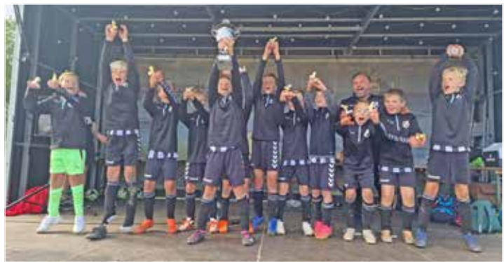
Der HSV siegte bei den E-Junioren und erhielt den Rewe Cup Wanderpokal.

die Veranstaltung „so tatkräftig unterstützt haben und somit zum Erfolg dieses Tages beigetragen haben“.