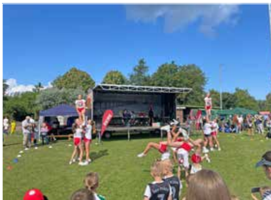
Die CFA-Cheerleader aus Kiel.

Cheerleader aus Kiel sowie der Gastauftritt von Dino Hermann, dem Maskottchen des Hamburger SV. Beim Rewe Cup war für jeden etwas dabei. Vor allem gab es viele strahlende Kinder, die einen tollen Turniertag hatten. Besonders gestrahlt haben die Kinder mit Trainer Kevin des Heikendorfer SV. Sie haben den 1. Platz bei den E-Junioren belegt