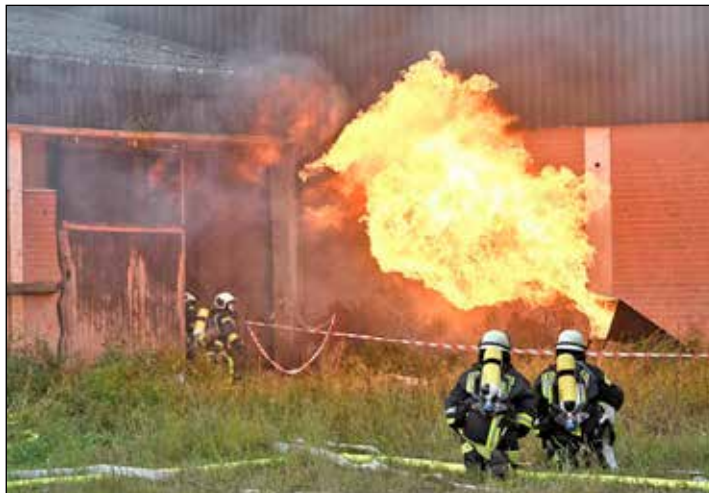
Pyrotechnik bot beeindruckende Effekte bei der Übung des Katastrophenschutzes des Kreises Plön.

Ranzau (los). Hilferufe, Schreie, Rauchschwaden am Horizont: Nicht mit zaghaftem Zündeln sondern zünftiger Pyrotechnik Marke XXL ging es bei der Katastrophenschutzübung am Sonnabend (23. September 2023) auf Gut Ranzau explosiv zur Sache. Das komplexe Szenario schlimmer Ereignisse mit Feuer, Panik und Schwerverletzten diente der Erprobung einer koordinierten Rettungsaktion unter Einbindung von Kräften der Feuerwehr, Rettungsdiensten und Technischem Hilfswerk (THW), die für den Ernstfall zusammengezogen wurden. Diese Zusammenarbeit gelte es nun auszuwerten, zieht Kreiswehrführer Karsten Krohn