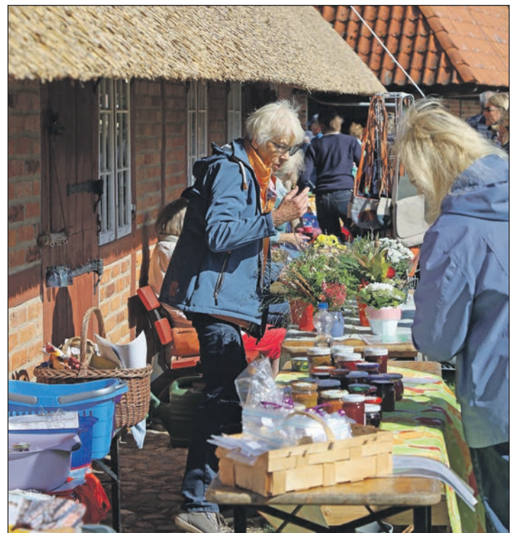
Reger Handel auf dem Herbstmarkt im Probstei Museum.

Neuheikendorfer Weg 110 • 24226 Heikendorf Tel. 04 31 / 24 17 20 • Fax 04 31 / 24 37 07