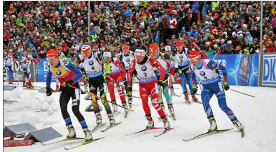
Gänsehaut pur und Hochspannung versprechen die spannenden Wettkämpfe „auf Schalke“ im Dezember 2023.

dem gigantischen Wintersport-Event zudem das große „Wintendorf“ mit freiem Eintritt direkt an der Halle mit 15000 Quadrat-