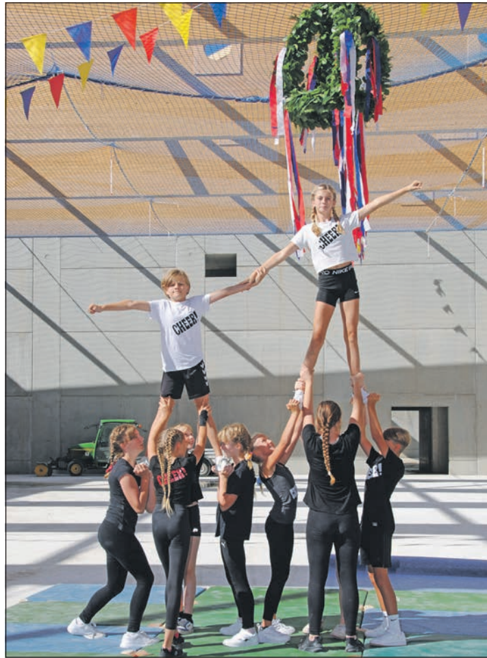
Cheerleader der sechsten Jahrgangsstufe unterhalten die Gäste mit einer akrobatischen Vorführung.

Schlüsen auch für alle, die bei der Planung mitwirken. „Das Gebäude ist in dieser Form nur deshalb möglich geworden, weil alle politischen Gremien an einem Strang gezogen haben, aller berechtigter Kritik an der deutschen Bürokratie zum Trotz“, betonte er. Wegen des erfolgreichen Baufortschritts geht er davon aus, dass die Halle von Sommer 2024 an genutzt werden kann. Doch bei aller Freude über das zügige Vorankommen gab es einen