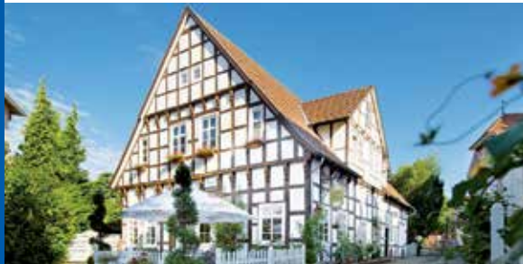
Histor. Fachwerk-Hotel in Top-Lage

● Fahrt im erstklassigen Fernreisebus ab Kiel, Schwentinal, Preetz ● 3 x Übern. im histor. Wohlfühl-Hotel mit Gästehaus mit reichhaltigem Frühstück vom Buffet ● 2 x Abendessen im Hotel als 3-Gang-Schlemmer-Menü oder Buffet ● Silvesterparty mit exklusivem 4-Gang-Menü bzw. festlichem Buffet, beste Stimmung bei Musik und Tanz, 1 Glas Sekt um Mitternacht ● Kostenlose Nutzung der Wellnessabteilung mit Hallenbad und stilvollem Saunahaus ● WLAN kostenlos im Hotel ● Anreise mit Mittagspause an der Weser in der Hansestadt Bremen ● Gr. Panorama-Ausflug in die alte Hansestadt Münster mit der herrlichen