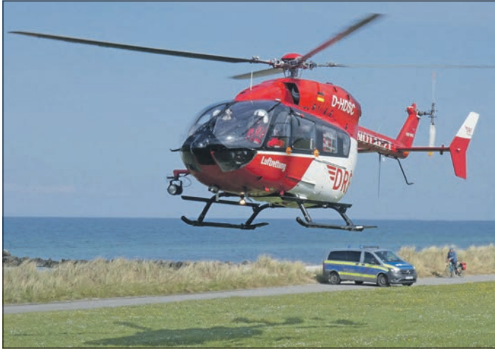
Der Rettungshubschrauber „CHRISTOPH 42“ bei einem Einsatz am Stakendorfer Strand.

schaft, der Tag und Nacht Einsätze fliegt. Aus Sicherheitsgründen sind bei Nachtflügen immer zwei Piloten an Bord. Insbesondere für die nordfriesischen Inseln ist die schnelle Hilfe aus der Luft lebensnotwendig, da es dort nachts keinen Schiffsverkehr gibt.