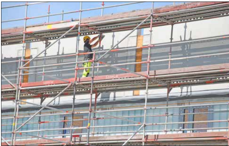
Gerüstbauer bereiten die Arbeiten an der Außenfassade vor.