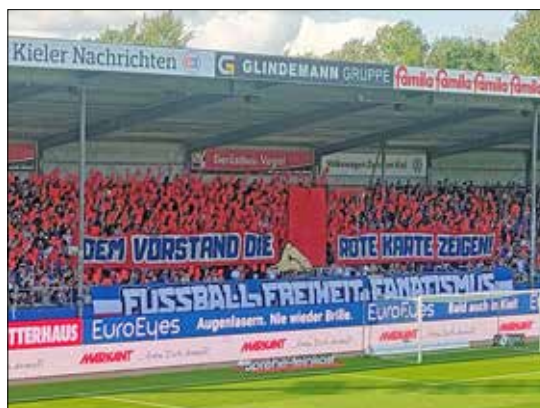
Der Streit Fans vs. Vorstand zeigte sich auch gegen Paderborn.

Nach den völlig normalen Anfangsschwierigkeiten hat sich die Mannschaft aber langsam gefunden. Nicht von ungefähr kam gegen Eimsbüttel der erste Saisonserfolg, der Auftrieb geben sollte. Starke Moral dann bei der Aufholjagd in Hamburg, wo man gegen St. Pauli noch ein 2:2 holte. Leicht wird das Unterfangen Ligaverbleib nicht werden, völlig chancenlos agiert der Neuling aber nicht. Zu einem wichtigen Faustpfand könnte die starke Heimkulisse werden. Stand jetzt: Kilia schafft-wenn auch knappen Verbleib in der vierten Liga. Landesliga Holstein/Preetzer TSV: Nein, glücklich war man mit der Einteilung in die neue Staffel beim PTSV beileibe nicht. Die attraktiven Duelle gegen die Nachbarvereine fielen weg, es blieben