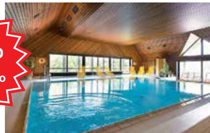
Hallenbad im Hotel