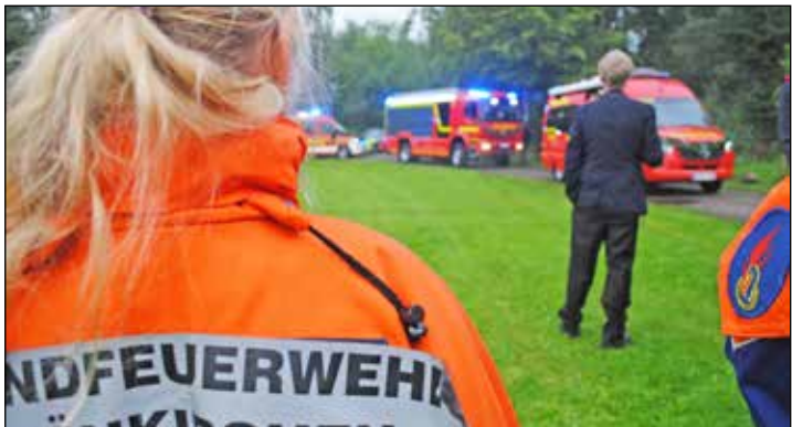
Mädchen und Jungen der Jugendfeuerwehr verfolgen gespannt die Einfahrt der neuen Fahrzeuge.