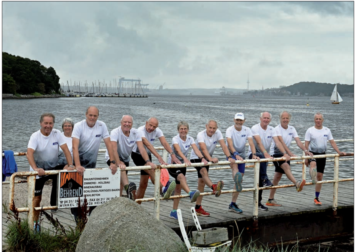
Fit wie der sprichwörtliche Turnschuh wird, wer sich auf regelmäßiges Training einlässt - die Läufer vom LTV Kiel Ost sammeln rund ums Jahr Kilometer. Ein paar Dehnübungen dürfen dabei nicht fehlen.

Gezielt trainieren die Läufer vom LTV Kiel Ost im Winter dienstags, donnerstags und sonntags in verschiedenen Gruppen, auch solche, die auf ihre Marathon-Endzeiten hinarbeiten. Um zusätzliche Muskeln anzusprechen und die Gelenke nicht überstrapazieren, stehen für sie noch Schwimmen und Radfahren auf dem Wochenplan. Für das Radfahren gilt der Faktor 2: „Zwei Stunden laufen entsprechen vier