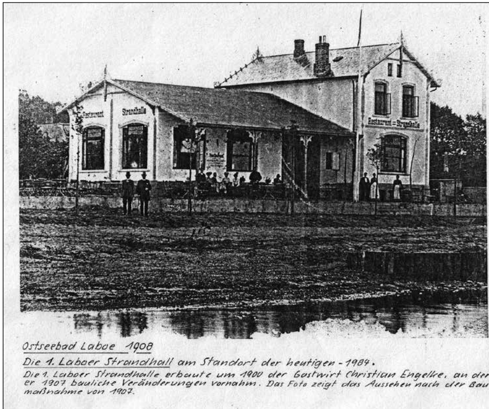
Ostseebad Laboe 1908

Am Freitag, dem 8. September 2023, um 19.30 Uhr wird „Dahmals und heute - ein Spaziergang