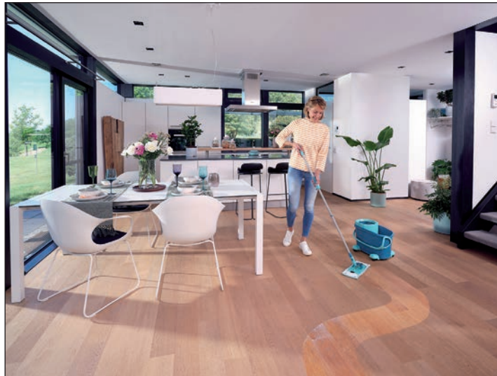
Schwungvoll oder geradlinig will das Parkett gepflegt sein.