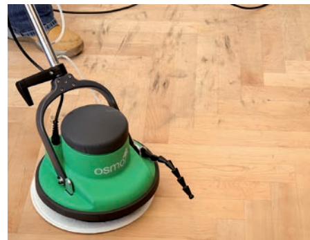
So werden Sie auch hartnäckigen Schmutz los.

• Saugen und Wischen Sie den Parkettboden regelmäßig, zumindest aber einmal pro Woche. • Benutzen Sie beim Saugen von Parkettböden den Bürstenkranz Ihres Staubsaugers, um Kratzer im Boden zu vermeiden.