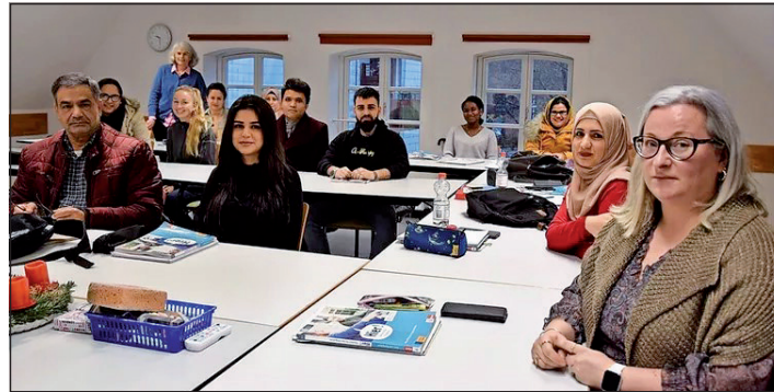
Die Teilnehmer des Integrationskurses der Kvhs Plön stehen kurz vor dem Abschluss ihrer Sprachprüfung.

Plön (t). Von vielen heiß ersehnt: das Herbstprogramm der Volkshochschulen im Kreis Plön ist frisch gedruckt und liegt ab Ende August an den bekannten Stellen zur Abholung bereit. Mit über 100 Seiten ist das Programm in diesem Jahr besonders üppig ausgefallen. Von Aquarellmalen über das Papiertheatertreffen in Preetz bis zum Yoga-Kurs: die Volkshochschulen bieten zahlreiche Angebote für die aktive Lebensgestaltung, ob malen, musizieren oder diskutieren: über 100 Kurse bieten vielfältige Möglichkeiten, schlummernde Talente zu entwickeln, um - kurz gesagt - die eigene Lebensqualität zu steigern. Die Volkshochschulen sind zudem Lern- und Begegnungsstätten für Menschen jeglichen Alters und jeglicher Herkunft. So finden neben klassischen Angeboten zum Sprachen lernen auch Deutschkurse für Zugewanderte statt sowie Tanzkurse für Kinder und Jugendliche verschiedenen Alters. Musisch Interessierte können sich in einem Chor betätigen oder ihre literarischen oder kunsthistorischen Kenntnisse über Vorträge, Workshops und Bildungsreisen vertiefen. Neben bewährten Angeboten aus den Bereichen