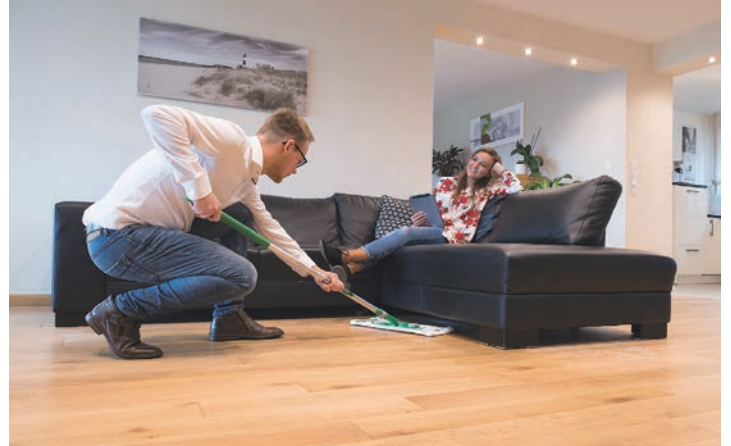
Parkettpflege im Wohnzimmer.

Fußboden sorgt für lange Freude am Parkett. Das A und O: Gute Reinigung und regelmäßige Pflege mit den richtigen Mitteln sind zum Schutz der Oberfläche notwendig. Das gilt für die beliebte Eichen-Deckschicht ebenso wie für andere Holzarten wie Kirsche oder Kiefer, für Dielenfußböden ebenso wie für Fischgrät-, Mosaik-, Tafel- oder Stabparkett. Für welches Finish Ihres Parketts Sie sich auch entschieden haben: Öl und Wachs ebenso wie Lack schützen das Parkett erst einmal. Beim Öl-Finish kann der Parkettboden atmen und die natürlichen Holzstrukturen bleiben