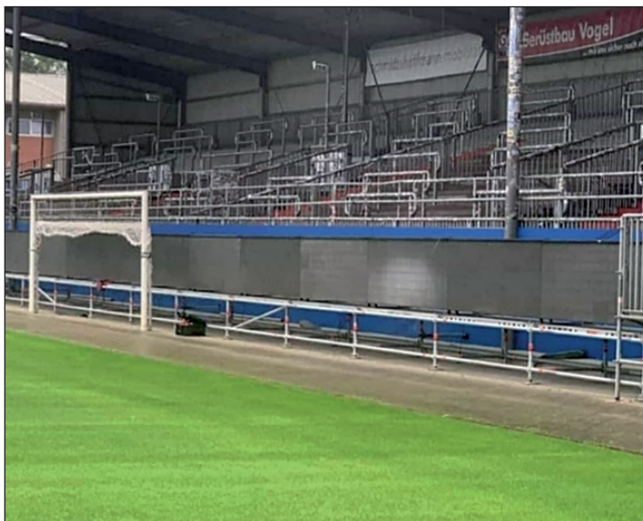
bleibt ein Ärgernis: Die neue LED-Bande vor dem Fanblock.