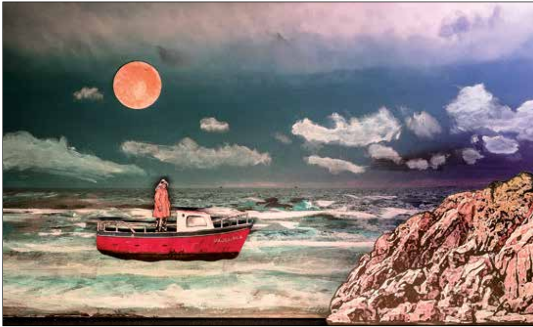
„Marie am Meer“, PAPIER & Theater.

Hintergrund: Schon in der Biedermeierzeit wurde das Papiertheater in den bürgerlichen Stuben vor familiärem Publikum gespielt. Auch Charles Dickens soll ein Papiertheater besessen und mit seinem engagierten Spiel die Nachbarn gestört haben. In Thomas Manns „Buddenbrooks“ bekommt Hanno zu Weihnachten ein Papiertheater geschenkt. Sammlern, Liebhabern und Künstlern ist es zu verdanken, dass bis heute das Papiertheaterspiel in vielen Ländern verbreitet ist. Ein Papiertheater ist eine kleine, dreidimensionale Bühne, mit Kulissen und Figuren aus Papier, die von der Seite oder von oben geführt werden. Im Normalfall finden 20-25 Personen vor der Bühne Platz. Das Preetzer Papiertheatertreffen ist die größte internationale Zusammenkunft von Papiertheaterspielern in Eu-