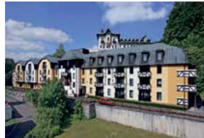
Komfort-Hotel in Marienbad