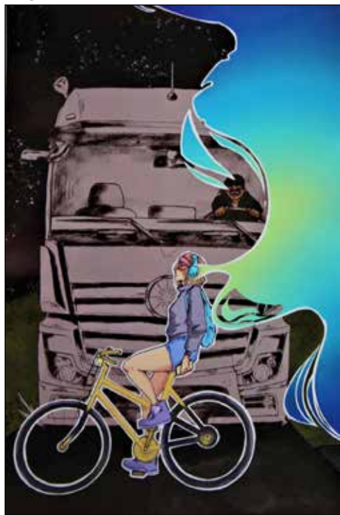
Das Siegerfoto, ein Bild, das Nachdenken anregen soll.

sen der Schule teilgenommen hat, und dann auch noch den 1. Preis errang. Verbunden mit den Glückwünschen und der Urkunde war noch ein Preisgeld von 500 Euro ausgesetzt und Lindenberg konnte es kaum fassen, dass gerade sie den Preis bekam. Nun können die Schülerinnen und Schüler ihrer Klassenstufe noch mehr darüber nachdenken: Warum habe ich nicht mitgemacht?