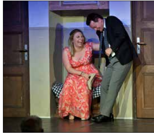
Techtelmechtel im Treppenhaus...