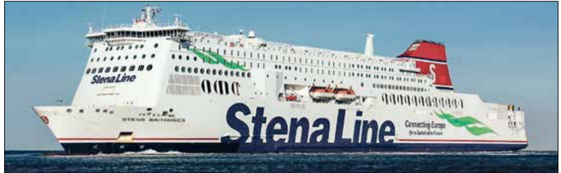
Mit den größten Stena Fähren Europas mit echtem Kreuzfahrt-Feeling an Bord geht es Kurs London

Die Welt-Metropole an der Themse erwartet unsere Leser zum grenzenlosen Shopping am langen Feiertags-Weekend mit eleganten Shops, weltberühmten Kaufhäusern, Outlets, Museen und farbenprächtiger Wachablösung am Buckingham