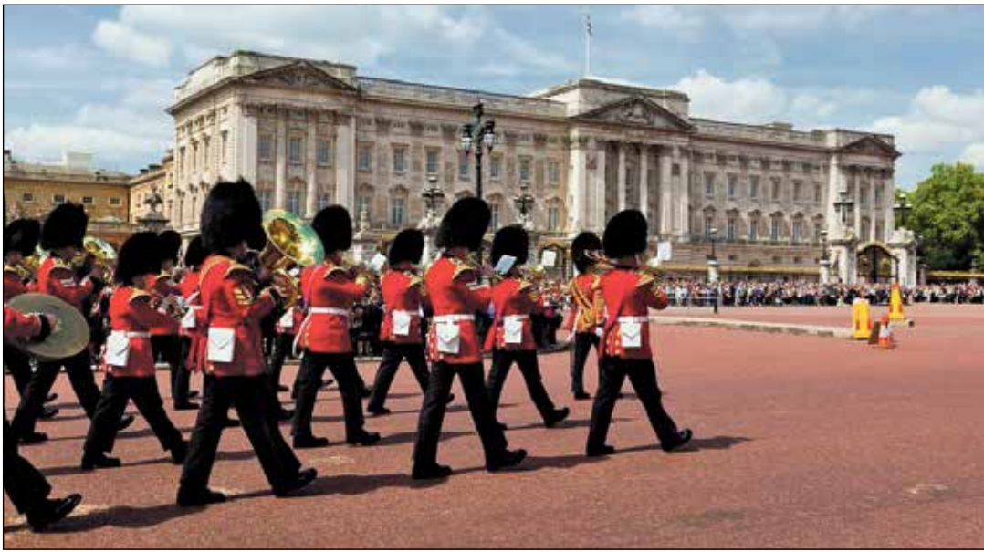
Ein Höhepunkt jeder Stadtrundfahrt: Die große Wachablösung in London am Buckingham Palace

Zum großen Leistungspaket der Sonder-Reise gehören neben der Fahrt erstklassigen Fernreisebus mit Waschaum WC., Bordküche etc. ab Kiel, Schwentinental und Preetz die erlebnisreiche