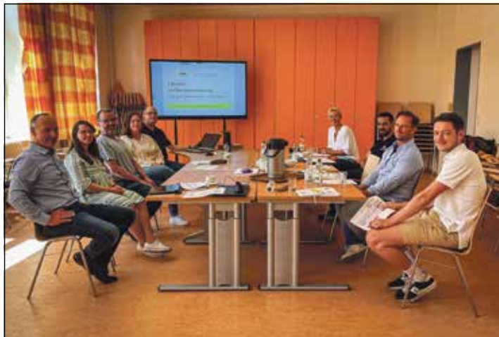
Am 17. Juli haben sich die Vertreter der Schule im Augustental und ihre Kooperationspartner getroffen, um den Fahrplan einer wirkungsvollen Berufsorientierungshilfe zu besprechen.

Jahrgang 7 solle zum Beispiel ein Stärken-Parkours in Preetz durchgeführt werden. Dort werden spielerisch die Stärken der Schüler festgestellt, wobei sie, als Beispiel, eine Wohnung, welche sie aufbauen müssen. Durch das Wissen der eigenen Stärke können die Schüler schneller eine Orientierung finden. Vor allem der beruflichen Orientierung. Einige Kooperationspartner berichteten, dass sie ebenfalls bei dem letzten Stärken-Parkours, im vergangenen Jahr, vor Ort waren. Hierbei brachten die Kooperationspartner sowie die Schule verschiedene Meinungen, Perspektiven und Ideen ein. Als es um die Jahrgänge 8 bis 9 ging, war das große Thema das Berufs-Praktikum.