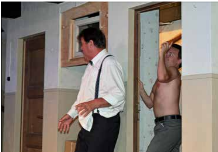
Für Bernhard Tramsen (Michael Schmidt, l.) und Dieter Brummer (Christian Becker) geht's nicht um die Wurst, sondern um die Frau.

Die letzte Aufführung von „Sludree op de Trepp“ ist am Dienstag, 24. Oktober 2023. Die Vorstellungen im Lachmöwentheater, Katzbeek 4, beginnen sonntags um 16 Uhr, dienstags, freitags und sonnabends um 20 Uhr. Die Gastronomie öffnet 1,5 Stunden vor Beginn. Kartenvorverkauf: 04343 – 49 46 440, www.lachmoewen.de oder in der Vorverkaufsstelle Dorfstraße 8 in Laboe. ÖPNV: ALFA-Linie 120; www.vkp.de/fahrplaene/alfa-ploen