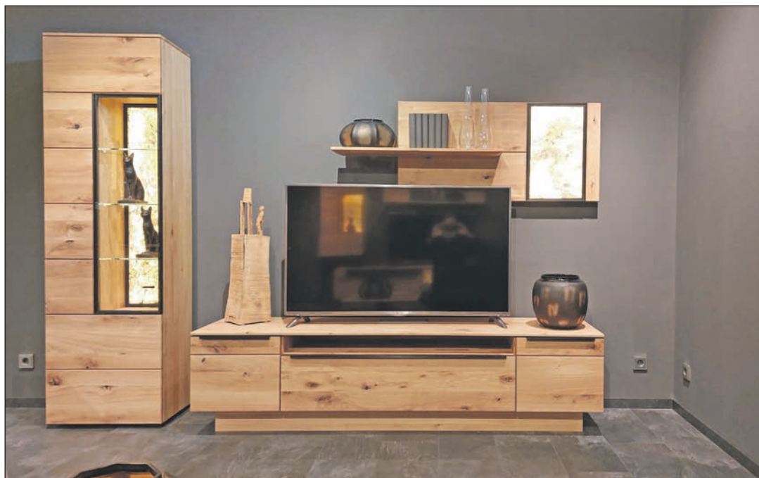
Im Schlaf geben Menschen viel Feuchtigkeit durch Atmen und Schwitzen ab, die Massivholzmöbel in sich aufnehmen und beim Lüften am nächsten Morgen wieder abgeben können.

Eine maßgebliche Rolle können hierbei auch Einrichtungsgegenstände wie Massivholzmöbel spielen. Diese haben einen unmittelbaren Einfluss auf das Raumklima und damit auch auf das Wohlbefinden der Bewohner. „Massivholz kann dank seines Aufbaus Feuchtigkeitsüberschüsse aus der Raumluft aufnehmen und bei trockener Luft zum Ausgleich wieder abgeben. Dies kann gerade bei Küchen- sowie Badezimmermöbeln von Vorteil sein, da in diesen Räumen immer wieder eine hohe Luftfeuchtigkeit entstehen kann“, so Ruf. Diese besondere Eigenschaft des Holzes nennt sich „Hygroskopie“ und findet sich nur bei Naturmaterialien. Die Ursache der Hygroskopie liegt im Inneren des Holzes. Es besitzt eine besondere Zellstruktur aus Fasern, die die Festigkeit ins Holz bringen, sowie aus Gefäßen, die für den Wassertransport beim lebenden Baum zuständig sind. Die Querleitungen von der Außenseite des Baumes nach Innen sind die