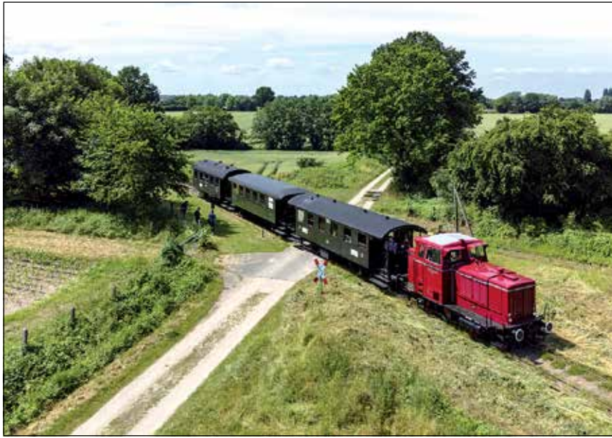
Am Pfingstwochenende bietet die Museumseisenbahn eine Abendfahrt durch die Probstei an.

Der VVM als lebendiger Verein mit über fünfzigjähriger Tradition betreibt in ausschließlich ehrenamtlicher Arbeit das Eisenbahnmuseum Lokschuppen Aumühle im Großraum Hamburg, das Nahverkehrsmuseum Kleinbahnhof Wohldorf sowie