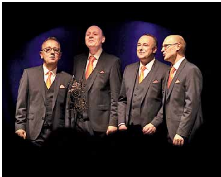
Take Four singen am 2. Juni im Schmidt-Haus in Schönkirchen.

Schönkirchen (t). Am Freitag, dem 2. Juni 2023, um 19 Uhr wird das A Cappella Quartett 'TAKE FOUR' zum ersten Mal zu Gast beim Kultur- und Landschaftspflegeverein im Schmidt-Haus in Schönkirchen sein. Ursprünglich war geplant, dass auch die Formation Quartett Komplet aufzutreten wird, dies ist krankheitsbedingt leider nicht möglich.