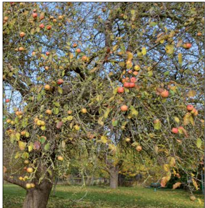
Streuobstwiese im Herbst (Apfelgarten Karpe): Je nach Sorte hängt das Obst lange an den Bäumen und bietet Vögeln im Winter Nahrung. Insekten wie z. B. Schmetterlinge lieben gärendes Fallobst.

2016 gepflanzt, teils regionsspezifische, denn auch um die Erhaltung lokaler Sorten geht es. Hierzu zählen die nordfriesischen wie „Agathe von Klanxbüll“ vom Agathenhof oder „Arlewatt“ („Schöner von Arlewatt“), die „Lübecker Prinzessinbirne“ und „Lübecker Sommerbergamotte“ – „der Lübecker Raum war für