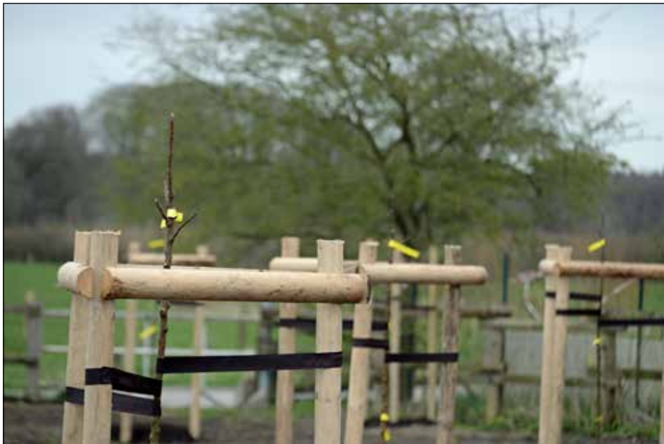
Die jungen Hochstämme werden durch gezielten Schnitt in Form gebracht. Regelmäßiges schneiden hält die Bäume vital.

2016 gepflanzt, teils regionsspezifische, denn auch um die Erhaltung lokaler Sorten geht es. Hierzu zählen die nordfriesischen wie „Agathe von Klanxbüll“ vom Agathenhof oder „Arlewatt“ („Schöner von Arlewatt“), die „Lübecker Prinzessinbirne“ und „Lübecker Sommerbergamotte“ – „der Lübecker Raum war für