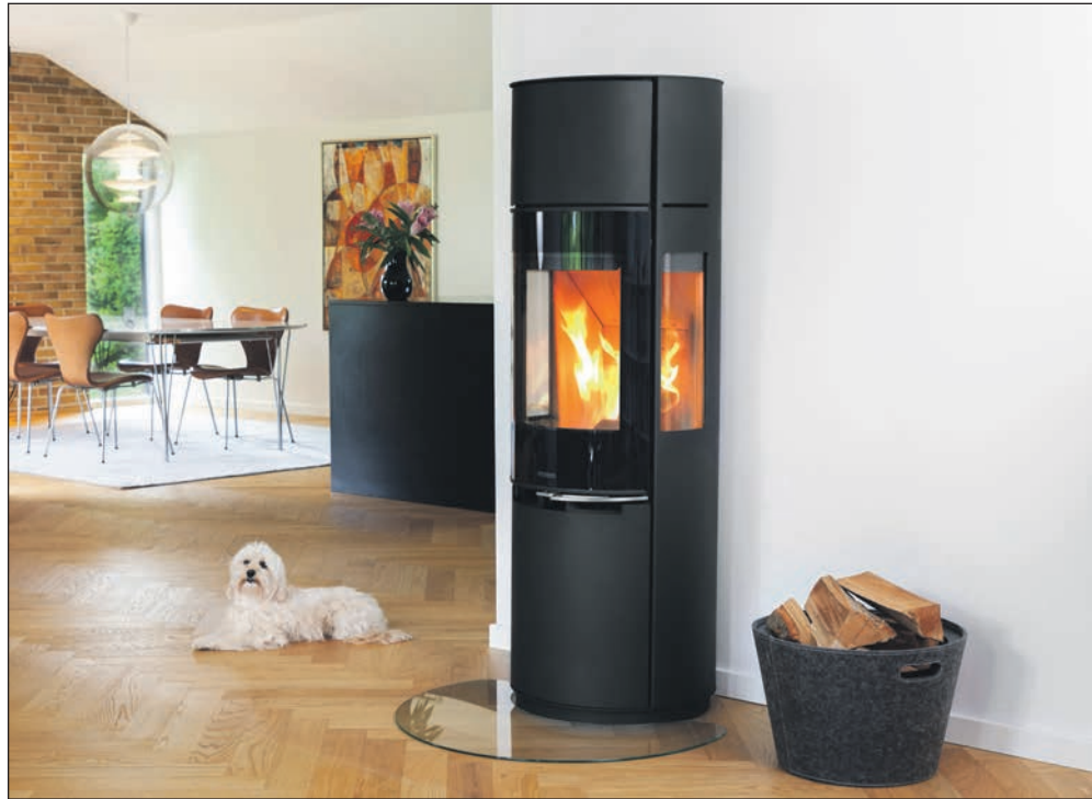
Moderne Feuerstätten überzeugen nicht nur durch Technik und Design, sondern sind auch deutlich sparsamer und emissionsärmer als Altgeräte

ab, aber je früher man handelt, desto besser ist es für die Umwelt. Neue Kaminöfen, Heizka-