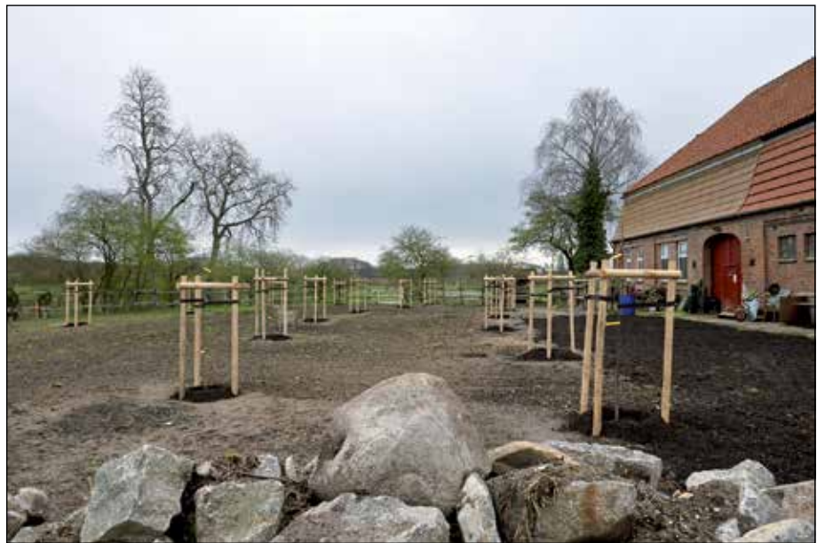
Steinhaufen im Randbereich: in der Sonne erwärmtes Gestein ist Lebensraum für Eidechsen. Zwischen den Bäumen wird eine Blühwiese für kleine Summer entstehen.

Eine weitere Voraussetzung ist die Bereitschaft des Grundstückseigentümers zur nachhaltigen und fachgerechten Pflege des Areals. Das gelte unter anderem für den Schnitt, der für die Erhaltung der Vitalität der Obstbäume