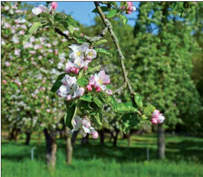
Apfelblüte im Frühjahr (Apfelgarten Plön): Zahlreiche Insekten finden hier eiweißhaltigen Pollen für ihre Larven und zuckerhaltigen Nektar als Energielieferant.

Die alten Sorten sind sehr verschieden in Aussehen und Geschmacksausprägungen, manches Obst reift früh, manches sehr spät. Das herbstliche Fallobst lockt mit zuckrigen Gärstoffen Insekten wie zum Beispiel Schmetterlinge an. Auch Singvögel wie Amseln picken an den Früchten. Es gibt Äpfel, die erst im Winter ihr bestes Aroma entwickeln. Manche dieser zum Teil sehr alten Kultursorten sind zudem für Allergiker geeignet.