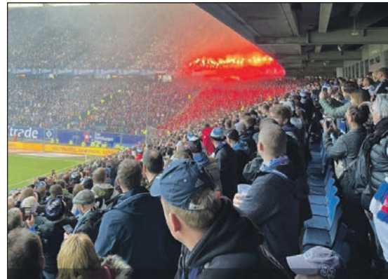
Die mitgereisten Kieler Anhänger „zündelten“ eifrig