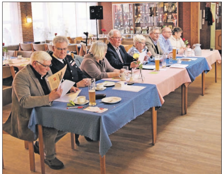
Der Vorstandstisch mit geladenen Gästen.