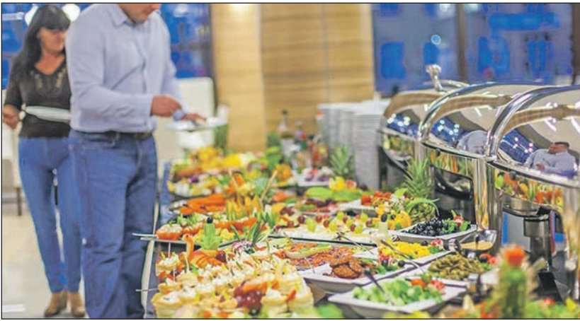
Schlemmen und genießen „ohne Ende“ können unsere Leser bei der großen Oster-Tagesfahrt mit den Probsteer-Leser-Reisen in die Lüneburger Heide.