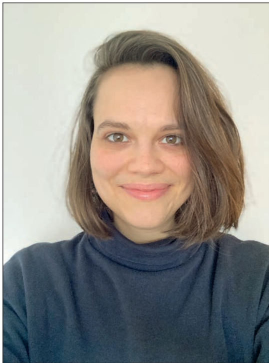
Biologische Uhren am Max-Planck-Institut für Evolutionsbiologie in Plön.