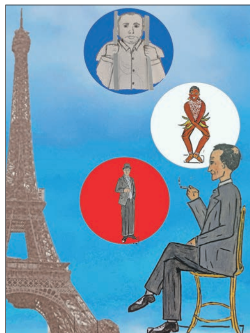
„Eiffelturm zu verkaufen“ - ein neues Stück des Théâtre Mont d'Hiver.

ein gewisser Graf Victor Lustig auf eine geniale Idee: Warum den Eiffelturm nicht einfach verkaufen? Dass es hierzu zu keiner Zeit von irgendjemandem eine Legitimation gab, störte den Trickbetrüger Victor Lustig nicht im Geringsten. Die beinahe historisch korrekte Geschichte über den Jahrhundertcoup des Grafen Victor Lustig, der den Eiffelturm verkaufte, entführt die Zuschauerinnen und Zuschauer in die bezaubernde Welt des Papiertheaters. Das Stück dauert 40 Minuten mit anschließender Besichtigung des Papiertheaters und Gesprächsmöglichkeiten mit den Künstlern. Die Livevorstellung ist für Er-