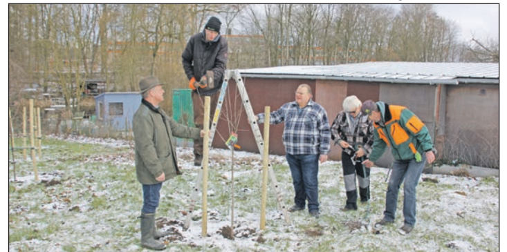
Die Kleingärtner hatten die Obstbaumpflanzaktion vorbereitet

Auf dem Vereinsgelände findet außerdem am Sonnabend, 6. Mai das traditionelle „Maifeuer“ ab 18 Uhr statt. Weitere Veranstaltungen: Kinderfest, Senioren Nachmittag, am 7. 10.