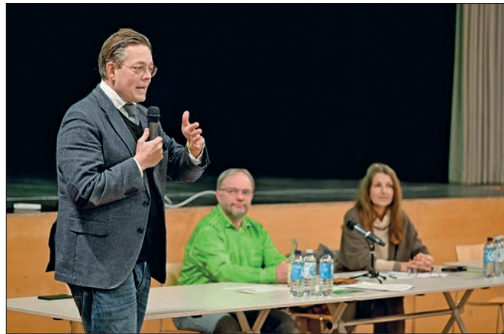
Renommierte Experten aus Politik und Rechtsberatung, wie Dr. Konstantin von Notz, MdB, stellvertretender Fraktionsvorsitzender Bündnis 90/Die Grünen, - hier bei einer Veranstaltung am 8. März in Plön - diskutieren am Montag, 3. April in Kiel das Thema „Legal Tech: Bedrohung oder Chance für den Rechtsberatungsmarkt?“