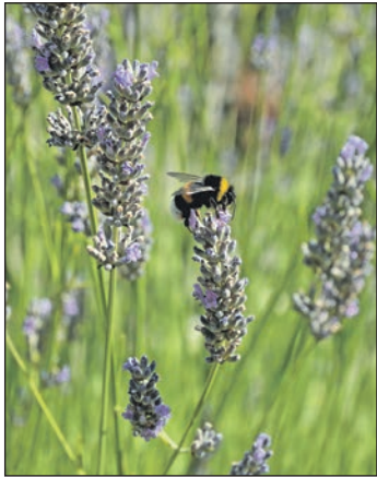
Wenn Lavendel regelmäßig zurückgeschnitten wird, verzweigt er sich kompakt und blüht üppiger.

Kreis Plön (t). In vielen Gärten verbreitet Lavendel seinen frischen Duft. Längst sind es nicht mehr nur die klassisch violetten