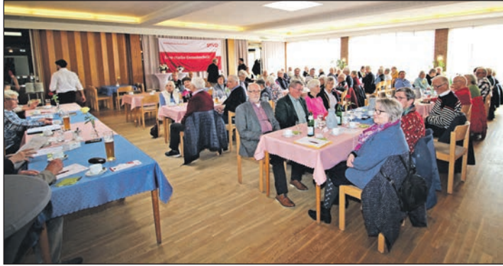
Gut besuchte JHV im Sportheim Heikendorf.

Heikendorf (kas). Der Sozialverband SoVD, Ortsverband Heikendorf, konnte von seinen insgesamt 440 Mitgliedern 59 Teilnehmer zur Jahreshauptversammlung im Heikendorfer Sportheim begrüßen. In locke-