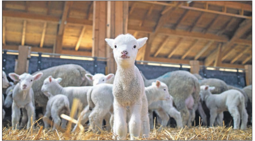
Die berühmten Oster-Lämmer in der Lüneburger Heide erwarten unsere Probsteer-Leser am 10. April.

Zum Abschluss des Tages besteht die Gelegenheit zur Oster-Kaffee-Tafel in der Heide, bevor gegen 16.30 Uhr die Rückfahrt nach Eutin erfolgt. Anmeldungen zur großen Oster-