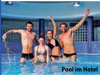
Pool im Hotel

Die magischen Insel-Perlen der Ostsee am Baltischen Meer entdecken die Leser:innen zu Top-Terminen des Jahres zum absoluten Superpreis mit einem großen Entdecker- & Genießer-Programm. Residieren werden unsere Leser im Top-Hotel mit Hallenbad, Sauna und Fitnessraum in der Nähe der Strandpromenade auf der berühmten Bernstein-Insel Wollin mit genussvoller Halbpension mit reichhaltigen Frühstücks- und Abend-Bufferets. Im Ausflugspaket bereits enthalten ist eine große Insel-Rundfahrt auf Wollin, der Schwester-Insel von Usedom, mit Besuch des legendären Seebades Misdroy und Besichtigung des berühmten See-Heilbades Swinemünde mit opulenter Strandpromenade und idyllischem Hafen-Flair. Bereits auf der Anreise erfolgt ein Abstecher zur weltbekanntesten Kreidefelsen-Insel