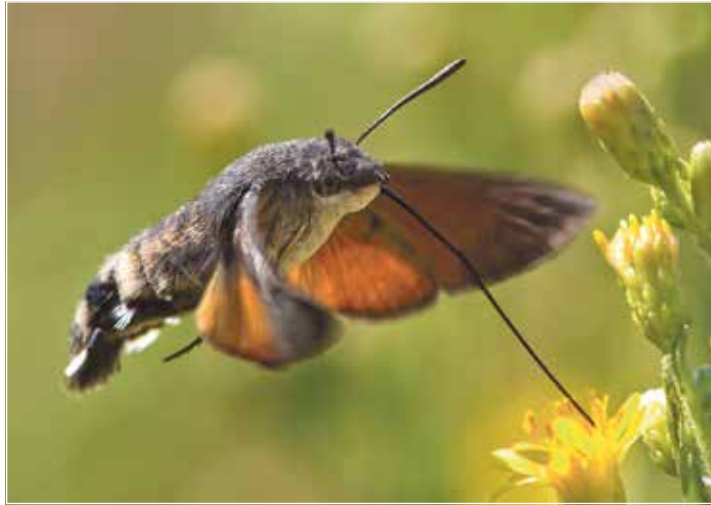
Kein Vogel, sondern ein Falter: Wie ein Kolibri saugt das Taubenschwänzchen an der Blüte Nektar.

burg in der Kieler Straße 30 statt. Die Veranstaltung beginnt um 19 Uhr und soll etwa zwei Stunden dauern. Der Eintritt ist frei.