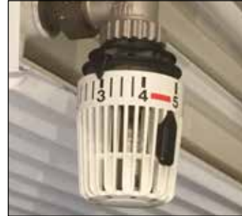
Energiesparen ja, aber geheizt werden muss trotzdem.