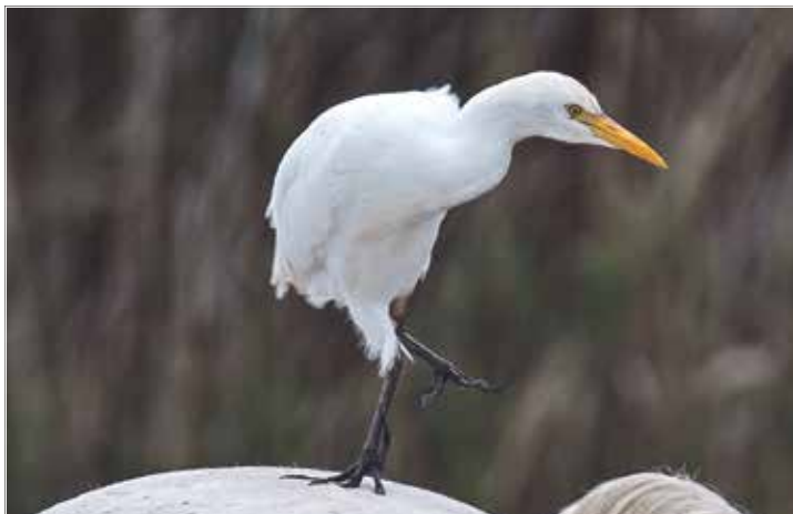
Der Kuhreiher ist auf einem Carmargue-Pferd gelandet.

Verde mit eindrucksvollen Großtrappen weiter zum Atlantik. Hier empfangen den Reisenden die gewaltigen Wellen des Ozeans mit malerischen Stränden und Steilküsten. Auf ihren vielen Reisen von den Natur- und Nationalparks der Algarve an der portugiesischen Küste, in Südspanien bis zum Ebro-Delta an der Mittelmeerküste sind die Naturliebhaber mit ihrer Kamera immer auf der Suche nach seltenen Vögeln, Pflanzen und Schmetterlingen. All diese Ent-