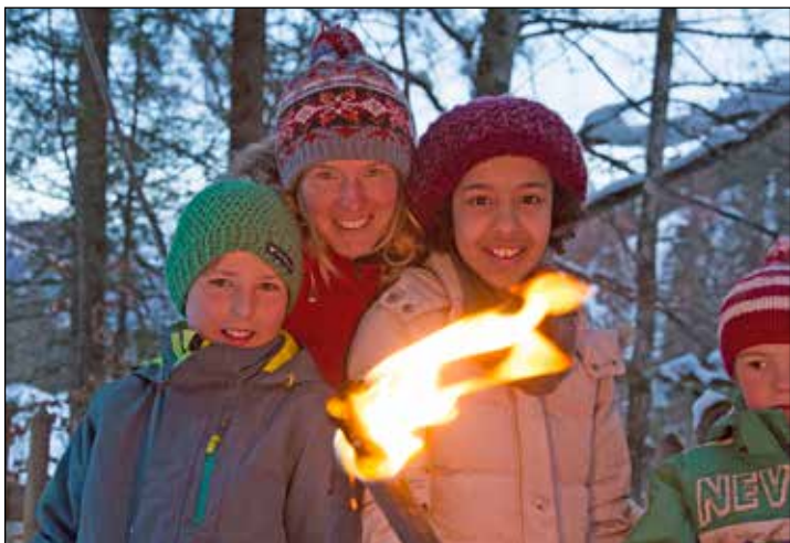
Das Lütjenburger SOS Kinderdorf lädt zum Lichterzauber ein.