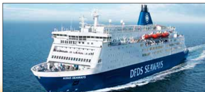
Auf Entdecker-Kurs mit den großen Jumbo-Fährschiffen reisen die Probstee-Leser zum Schnäppchenpreis nach Schottland.

Anmeldungen sind ab sofort möglich bei den Probstee-Leser-Reisen des Burg-Verlages in Eutin, täglich von 9 bis 13 Uhr, per Telefon 04521/7011-30 oder direkt per Mail unter leserreisen@der-reporter.info