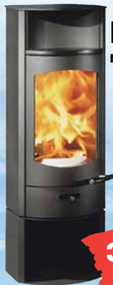
Flok 2.0 mit Sockel