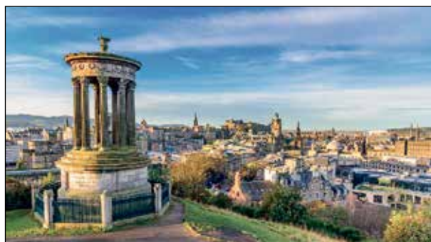
Eine der schönsten Welt-Metropolen erwartet unsere Leser in Edinburgh mit der zauberhaften Altstadt und dem Schloss.

Zum großen Leistungspaket der Probstee-Sonder-Reise zum Schnäppchenpreis gehören neben der Busfahrt ab Kiel, Schwentinental, Preetz im 4-Sterne-Reisebus zwei Übernachtungen an Bord der großen Jumbo-Direktfähren der DFDS auf der Strecke Amsterdam-Newcastle-Amsterdam inklusive 2-Bett-Kabinen mit DU/WC sowie 2 x großes Schlemmer-Frühstücks-Buffer an Bord (komfortable 2-Bett-Aussenkabinen mit unteren Betten für Hin- und Rückfahrt sind gegen Aufpreis von nur 59 Euro p. P. zusätz-