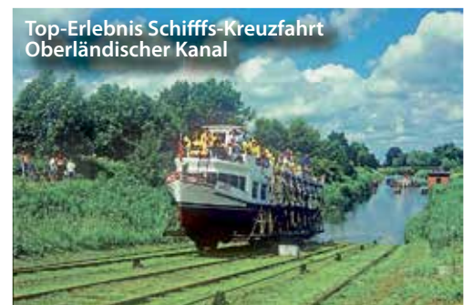
Top-Erlebnis Schiffs-Kreuzfahrt Oberländischer Kanal