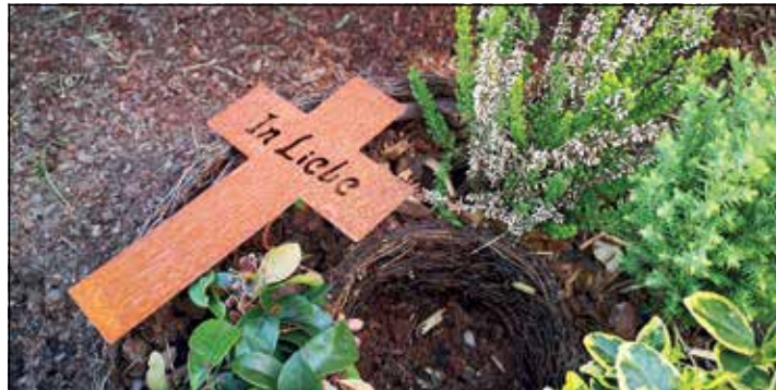
Welche Bestattungsart ist am umweltverträglichsten? Spielen Fragen der Nachhaltigkeit bei Beerdigungen eine Rolle?

Kreis Plön (t). Kann man den eigenen Tod umweltbewusst planen? Oder die Beerdigung eines geliebten Menschen unter nachhaltigen Gesichtspunkten organisieren? Der Fokus unserer Gesellschaft auf Umwelt- und Klimaschutz kommt auch in der Bestattungskultur immer stärker zum Tragen. Mehr und mehr Menschen wollen über ihr Leben hinaus, auch in Tod und Bestattung, auf ihren ökologischen Fußabdruck achten. Sie fragen sich, wie kann ich noch vor meinem Tod auf diese Entscheidungen Einfluss nehmen, zum Beispiel im Rahmen einer Bestattungsvorsorge.