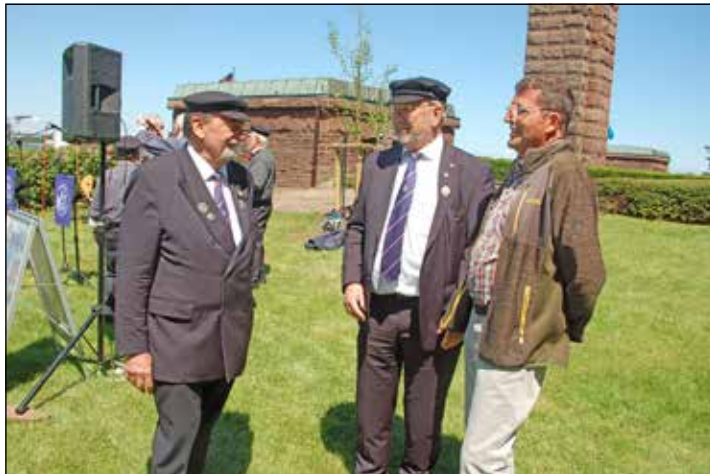
Viele Besucher hatten viel zu erzählen über ihre Vorfahren in den U-Booten.

„Kriegsgräber und Gedenkstätten für die Toten und Vermissten sind Orte der Trauer und der Erinnerung. Sie mahnen uns zu Verständigung, Versöhnung und Frieden.“