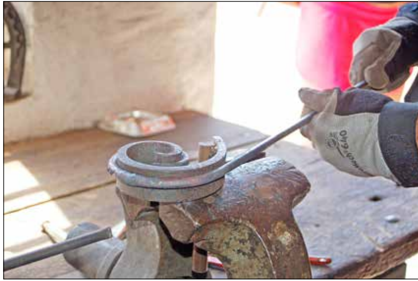
So entsteht aus hartem Eisen eine Schnecke

Lutterbek (kud). Schon von draußen sind die kräftigen Schläge zu hören. Drinnen ist es an diesem warmen Sonntag deutlich wärmer als draußen. In der Esse glüht es, Eisen wird an einer langen Zange rot und wandert in ein Gestell, an dem in Blitzeseile eine Schnecke entsteht. Ein altes Handwerk, längst als Beruf ausgestorben, lebt in der „Alten Lutterbeker Schmiede“ weiter, weil sich Menschen gefunden haben, die nicht hinnehmen wollten, dass nach und nach jede Tradition in der Versenkung verschwindet. 14 Jahre gibt es den Verein „Alte Lutterbeker Schmiede e.V.“ nun schon.