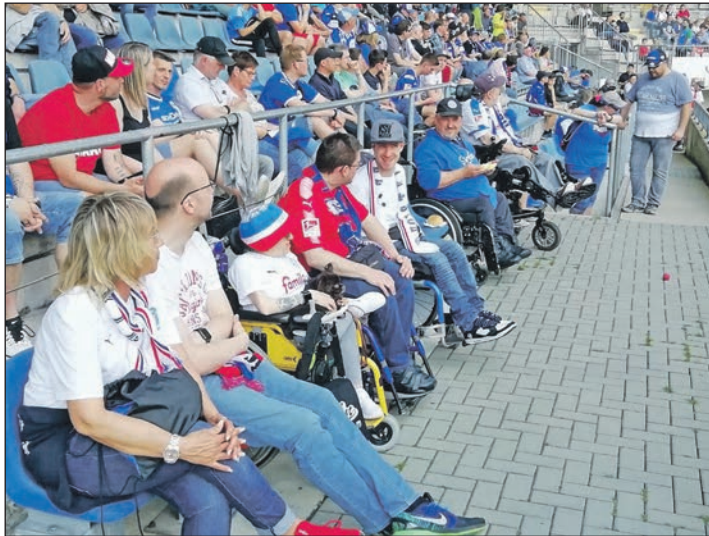
Wachsen stetig: Die Rolli-Fans der Störche.