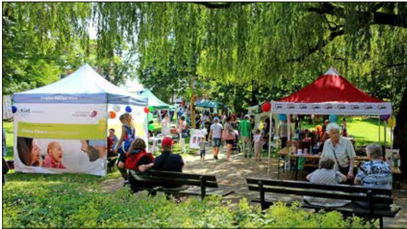
Mitmachaktionen auf dem gesamten Rasengelände