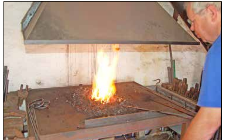
Das Eisen im Feuer. Erst dann geht es weiter mit der Verarbeitung

Seit 1979 das unabhängige Wochenblatt für unsere Region