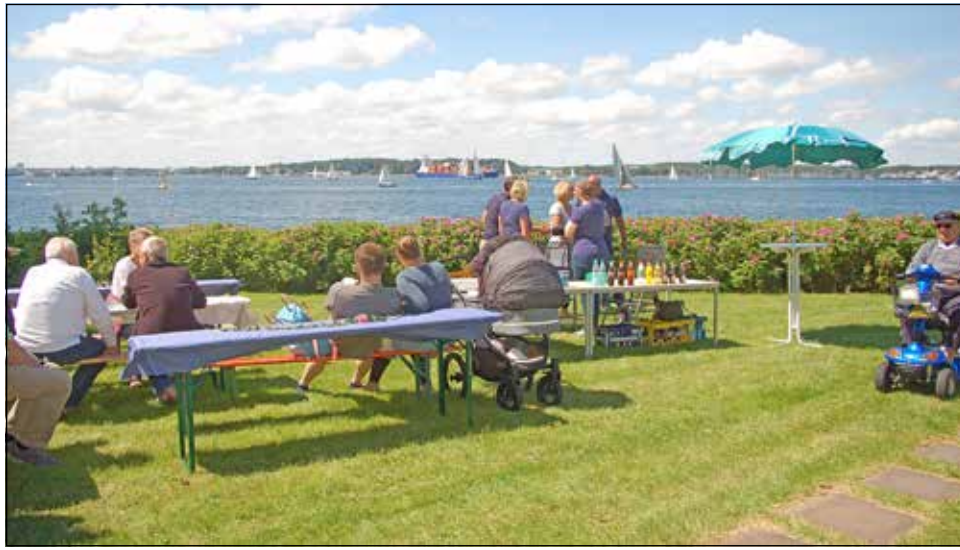
Sommerliches Ambiente am Heikendorfer Ehrenmal

Ein kleiner Gingko-Baum steht auf dem Rasen. Unter einer Folie verborgen wartet ein Gedenkstein darauf, enthüllt zu werden. Es gibt etwas zu feiern: 100 Jahre U-Bootkameradschaft Kiel und Volksbund Deutsche Kriegsgräberfürsorge. Gemeinsam tragen sie dafür Sorge, dass Soldaten, die in U-Booten nach Abschüssen auf See geblieben sind, nicht in Vergessenheit geraten. Rupert Bischoff ist Vorsit-