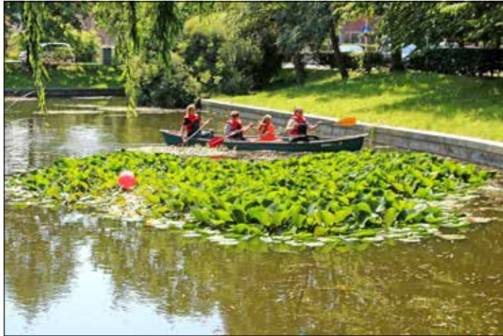
Paddeltour auf dem Dorfteich