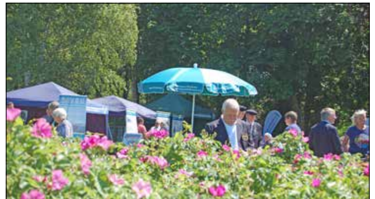
Mit einem bunten Info-Programm lockten Volksbund und U-Boot-Kameraden die Gäste an.

tafeln zu löschen. „Wir haben es nicht getan. Denn natürlich gab es auch bei den Besatzungen auch Menschen, hinter denen wir heute nicht mehr stehen