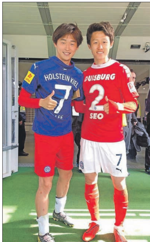
Holsteins Korea-Doppel Lee(li) und Seo(kam vom MSV Duisburg).

ßen wird. Der 27-jährige kommt für eine Ablöse von 300.000