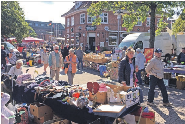
Viel Betrieb in der Fußgängerzone Knüll: Am Sonntag, 30. Juni ist wieder Flohmarkt in Schönberg.

Schönberg (t). Der Sommer ist da, und mit viel Charme und Gemütlichkeit werden am kommenden Sonntag wieder zahlreiche Schönberger Betriebe in der Fußgängerzone und in der Bahnhofstraße von 11 Uhr bis 15 Uhr ihre Türen zum „Erlebnis-Shopping“ öffnen und zum Bummeln und Stöbern einladen. In vielen Einzelhandels-Geschäften kann man jetzt die neue Sommerware entdecken. Besonders natürlich in den Mode- und Schuhgeschäften werden jetzt die ganz besonderen modischen Sommerhits präsentiert. Sicher kann man, wie immer an Schönberger Markttagen, sich das eine oder andere Angebot sichern. In der Fußgängerzone Knüll wird am kommenden Sonntag, 30. Juni auch