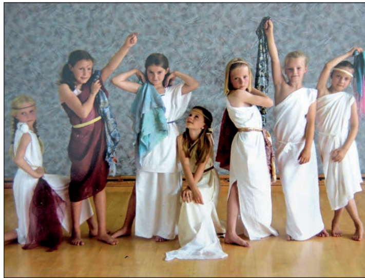
In der Vorweihnachtszeit haben die Heikendorfer Nachwuchstänzer ihren großen Auftritt in der Sporthalle.

Ein persönliches Erfolgserlebnis und Motivation, am Ball zu blei-ben – weshalb Dvorak regelmä-ßig Auftritte plant, bei denen der Tanznachwuchs zeigen kann, was er gelernt hat. Dabei werde