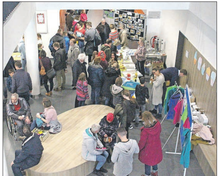
Blick von der 1. Etage in das Foyer.