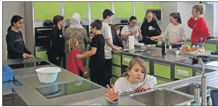
Die neue Küche wird ausprobiert.