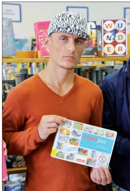
Das Bild-Wörterbuch Arabisch-Deutsch hilft den Asylsuchenden aus vielen Ländern dabei, sich schneller einzuleben, denn Sprache ist nach wie vor der Schlüssel zur Integration.

braucht werden, können nicht produziert werden. Die Anzahl hört sich gewaltig an, aber durch Flure, Sanitäräume, Gemeinschaftsräume und so fort können nur 200 Personen untergebracht werden. Probleme können nicht alle auf einmal gelöst werden. Alles braucht seine Zeit und ist nur durch ein „Miteinander“ lösbar.