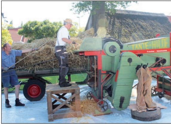
Der alte Stiftdrescher „Tante Hilde“ ist fast 100 Jahre alt und drischt noch heute alle zwei Jahre im Probsteimuseum.