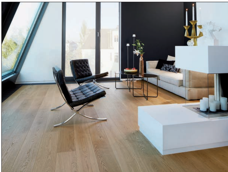
Wer die Pflegehinweise des Herstellers einhält, hat dauerhaft Freude an seinem Traumboden.

Kreis Plön (t). Parkett erbringt kontinuierlich Höchstleistungen – schließlich wird der natürliche Bodenbelag von allen Hausbewohnern stark beansprucht. Je größer der „Durchgangsverkehr“ ist, desto höher ist auch der Reinigungs- und Pflegeaufwand. Hält man jedoch ein paar Spielregeln ein, weiß der Holzboden nicht nur mit seiner edlen Optik, sondern auch mit Langlebigkeit zu überzeugen. Entscheidend ist, dass die vom Parketthersteller oder -verleger empfohlenen Pflegehinweise eingehalten werden. Je nach Art der Oberflächenbehandlung gibt es spezielle Pflegemittel, die mit den Herstellern der eingesetzten Lacke oder Öle abgestimmt sind. Nur so kann das Holz vor Kratzern, Flecken und Schmutz geschützt werden. Wie auch immer die Oberfläche beschaffen ist: Bei der Reinigung von Parkett sollte stets behutsam vorgegangen werden. Grober Schmutz wird durch vorsichtiges Fegen mit einem weichen Besen oder mit dem Staubsauger und einem feinen Bürstenaufsatz entfernt. Weiter gilt: Durch die Versiegelung wird lediglich ein Schutz vor Feuchtigkeit erreicht, jedoch kein Nässeschutz. Das heißt, dass kein stehendes Wasser oder Reinigungsmittel in Lachen auf der Oberfläche zurückbleiben dürfen. Eine geeignete Reinigung erfolgt mit einem Tuch oder einem nebelfeuchten