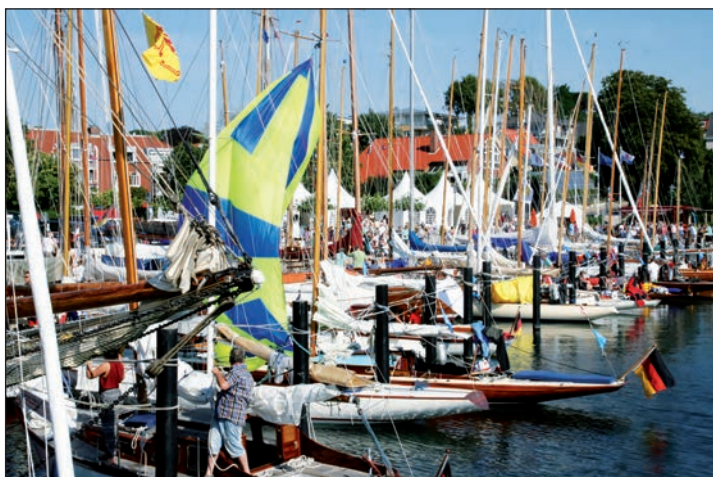
Ein buntes Bild an der Kaimauer