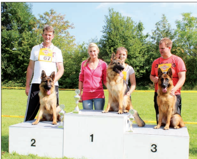
Die Hündinnen Elisa vom Holtkämper See, Farina vom Holtkämper Tor und Only Kranichzug sicherten sich in der Jugendklasse die begehrten Plätze auf dem Treppchen.

Die Ortsgruppe Heikendorf im Verein für deutsche Schäferhunde veranstaltete zum ersten und einzigen Mal in diesem Jahr die Hundeschau für Schäferhunde auf ihrem Trainingsgelände. In den Kategorien Nachwuchsklasse (9 bis 12 Monate), Jugendklasse (12 bis 18 Monate), Junghundklasse (18 bis 24 Monate) und Gebrauchshundklasse (ab 24 Monate) und unterteilt in Rüden und Hündinnen beurteilten die Zuchtrichter Wolfgang Haßgall und Hans Peter Schweimer die Tiere auf ihre Zuchtfähigkeit. Anatomische Merkmale wie Größe, Gewicht,