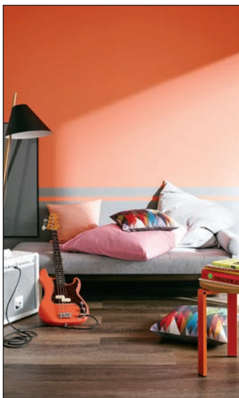
Leuchtend und warm kommt die Trendfarbe „Coral“ in einer Mischung aus Rot und Orange daher.

nur wenig Arbeit, verändert aber die Wirkung eines Raums vollständig. Neben den dunklen Schönheiten liegen weiterhin auch kräftige warme Wohnfarben wie Korallenrot und Goldorange oder kontrastierendes klares Blau-Türkis mit einer kühlen Wir-