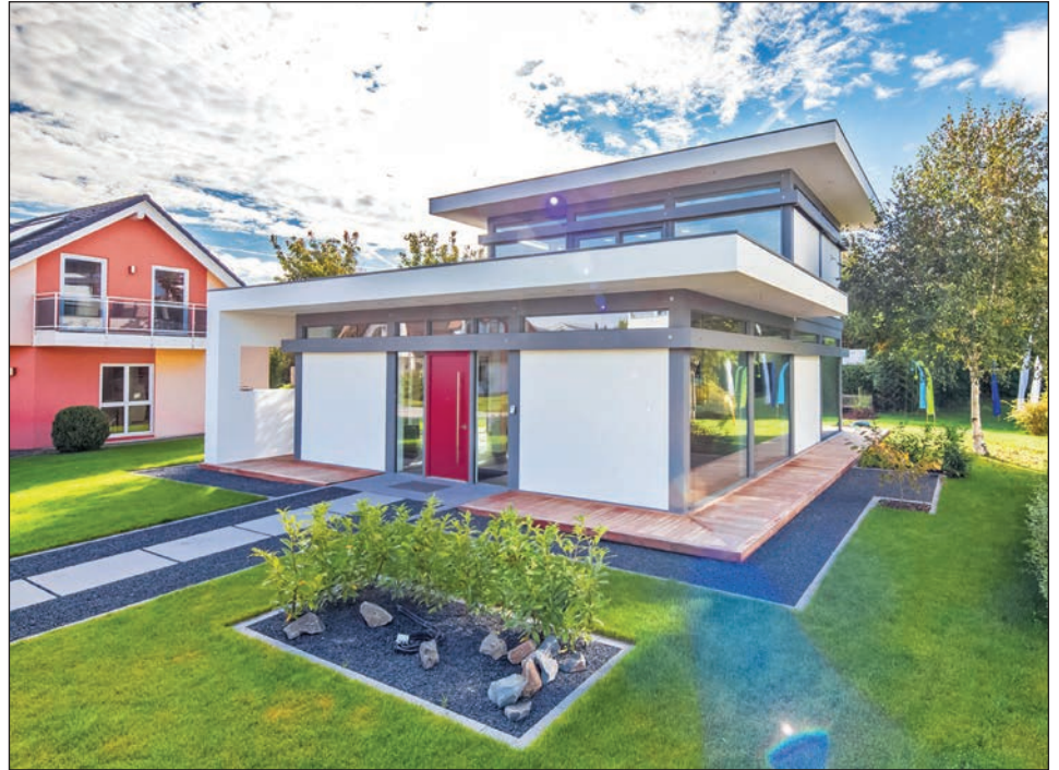
Dank großzügiger Glasflächen sind die Übergänge zwischen Innen- und Außenbereich fließend.

Kreis Plön (djd). Das Bauen mit natürlichen Materialien liegt im Trend. Traditionelle Holzhäuser etwa erleben derzeit ihre Renaissance. Das ist eine Frage des persönlichen Geschmacks, hat aber auch höchst praktische Aspekte. "Holz atmet und beeinflusst damit auf positive Weise das Raumklima, etwa indem es dabei hilft, die Luftfeuchtigkeit in einem angenehmen Gleichgewicht zu halten", erläutert Martin Blömer vom Verbraucherportal Ratgeberzentrale.de. Von diesen Vorteilen können Bauherren auch in Holzkonstruktionen profitieren, die al-