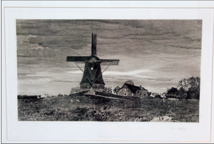
Das Werk „Die Mühle“ ist eines der beiden großformatigen Radierungen, die eine Besonderheit in Größe und Präzision darstellen.