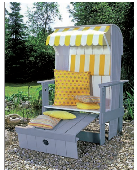
Auch für den Außenbereich, für Gartenmöbel oder den Strandkorb, eignen sich strapazierfähige Lacke auf Wasserbasis.

Auf Grundierung und Vorstreichfarbe folgt der Buntlack, der nach ein bis zwei Stunden oberflächentrocken ist.