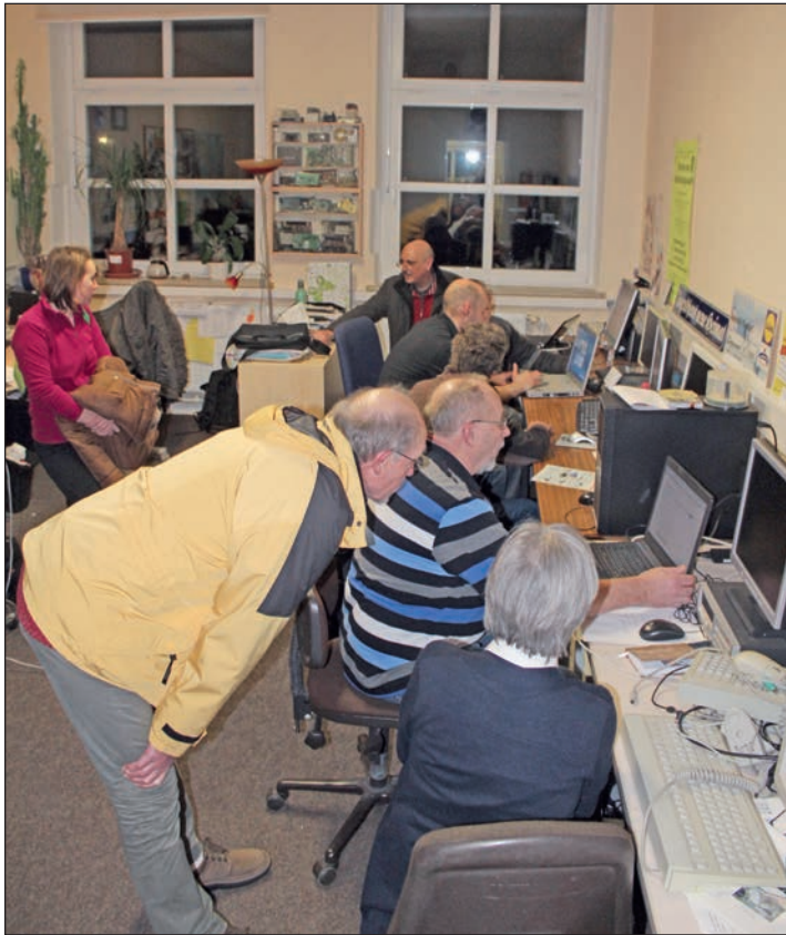
In den Räumlichkeiten des Kinder- und Jugendhauses Klausdorf kann sich jeder mit PC-Problemen an die Helfer des CCK wenden.

dem Thema zu tun“, so Preuß. Die verschiedenen Probleme der Gäste können so an den jeweils bestinformierten Computerhelfer weitergegeben werden. Zur Zeit kümmern sich sechs ehrenamtlich tätige Helfer um die Computerbedürfnisse ihrer Gäste und die nächsten Termine stehen auch schon fest. Am 23. März, 20. April, 18. Mai, 15. Juni, 13. Juli, 7. September, 5. Oktober, 2. und 30. November stehen die Computerhelfer ihren Besuchern wieder jeweils von 18 bis 19 Uhr im Kinder- und Jugendhaus in Klausdorf mit Rat und Tat zur Seite.