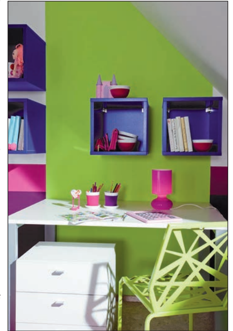
Mit einem frischen Anstrich - am besten umweltfreundlich auf Wasserbasis - wirken Möbel wie neu.

stoßfest erweist oder gar mit "chemisch" anmutenden Gerüchen tagelang das Raumklima beeinträchtigt. Gerade beim Arbeiten mit Lack lohnt es sich, vor dem Kauf genau auf die Produkteigenschaften zu achten. Wasserbasierte Lacke etwa punkten mit ihrer schnellen Trocknung, ihrer Umweltfreundlichkeit und der ausbleibenden Geruchsbelästigung. In Sachen Robustheit stehen diese Materialien den klassischen lösemittelhaltigen Lacken in nichts nach. So weisen etwa neue Acryllacke auf Wasserbasis eine Strapazierfähigkeit sowie Oberflächenhärte auf, wie man sie bislang eher bei lösemittelhaltigen Lacken vermutete. Hohe Deckkraft, guter Verlauf und schnelle Trocknung ermöglichen somit Ergebnisse wie aus Profihand, und das alles noch besonders ökologisch.