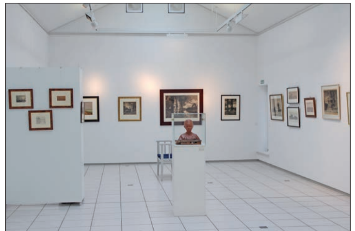
Der erste Raum der Ausstellungshalle widmet sich den Landschaften, Portraits und dem Wachsmodell der Künstlers Hans am Ende.