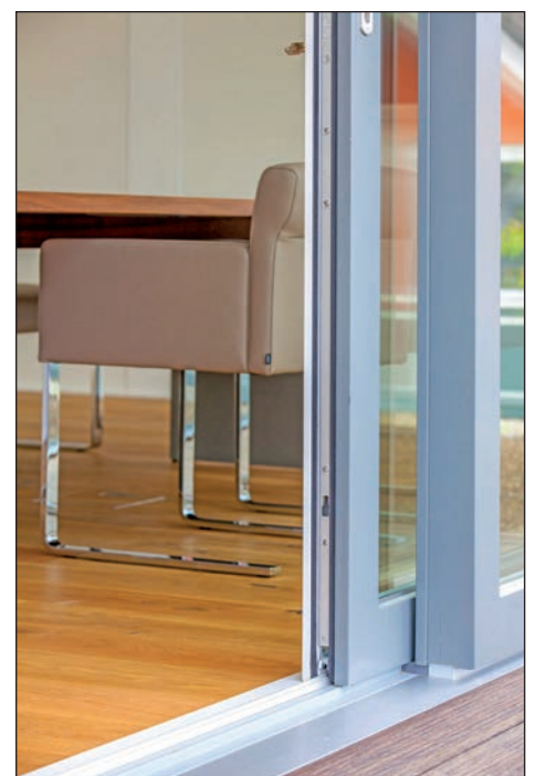
Dank großzügiger Glasflächen sind die Übergänge zwischen Innen- und Außenbereich fließend.

klassische Fachwerktechnik ist zudem auch in energetischer Hinsicht 2=Scup to date". Großzügigkeit und Transparenz.