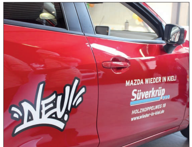
Nach mehr als einem Jahr ist Mazda wieder zurück in Kiel.