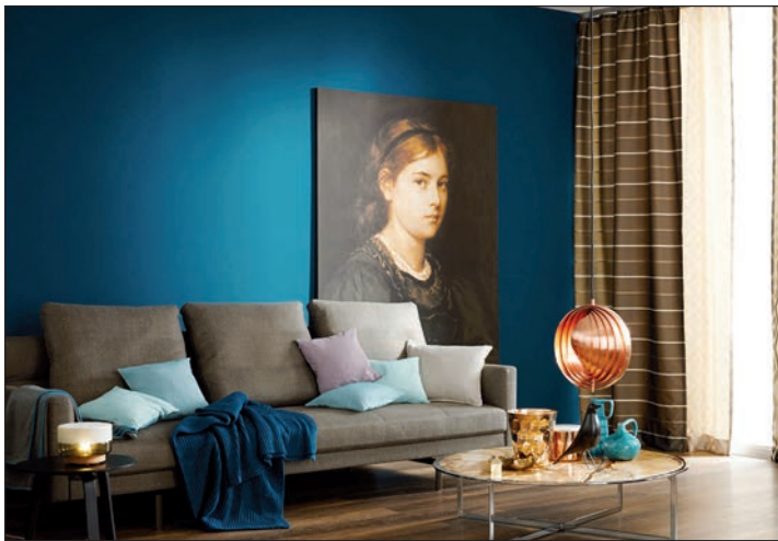
Das kräftige Blaugrün „Deep“, das den Wänden Tiefe verleiht, zählt zu den aktuellen Trendfarben für die Innengestaltung.

man kann sie aber ebenso als kraftvolle Akzentfarben einsetzen, in Verbindung mit ruhigeren, klassischen Farbtönen.