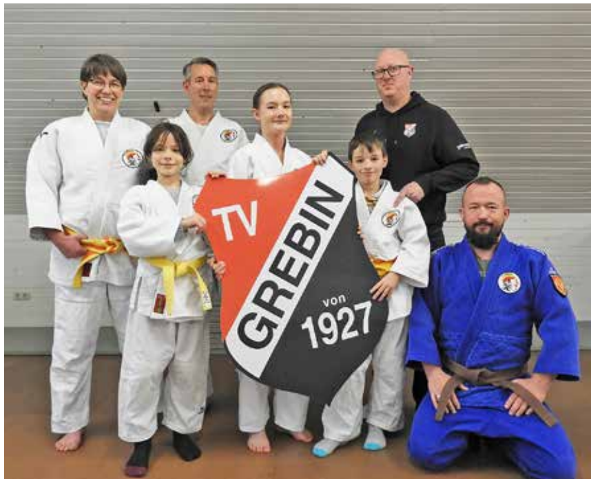
Judo für alle Generationen, dafür steht die Judosparte des TV Grebin.

Uhr an der Reihe ist, ehe von 19 bis 20.30 Uhr die Erwachsenen trainiert werden. Hier arbeiten Judoka verschiedener Grade daran, ihre Fähigkeiten zu verbessern. Mitbringen muss man zunächst nur Lust und Spaß an der Bewegung, wer Feuer fängt, legt sich bald einen Anzug zu. Und erfahrungsgemäß bleiben diejenigen, die zum Reinschnuppern kommen, auch dabei: „Der Trainer geht auf alle in der Gruppe ein und alle wollen sich weiterentwickeln“, beschreibt Günter von Kniese die gute Stimmung in der Mix-Truppe: „Alle machen so viel, wie sie können.“ Eine Einheit beginnt mit Erwärmung und