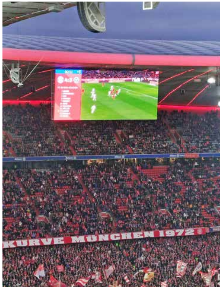
Am Ende stand ein achtbares 3:4 gegen München.

Kreis Plön (dif). Die KSV Holstein kehrte vom Bundesligaspiel bei den Münchner Bayern mit einer 3:4 (0:2)-Niederlage zurück. Keine Punkte, aber mit einer Leistung, die aller Ehren wert war. Sicher wurde den mitgereisten 6.500 Kieler Anhängern (Rekord für ein KSV Auswärtsspiel) anfangs doch etwas bange, als der Rekordmeister nach einer Stunde schon mit 4:0 in Front lag. Jamal Musiala, Harry Kane (2) und Serge Gnabry trafen einfach zu leicht. Weiter hielt Keeper Timon Weiner seine Farben mit starken Paraden im Spiel. Bis dahin hätte es gut und gerne 6:0 oder gar 7:0 stehen können, auch wenn die Rapp-Jungs eine gute Möglichkeit besaßen. Doch die Gäste zeigten einmal mehr Moral und schafften durch Finn Porath (62.) zumindest den Ehrentreffer, so meinte man. Der Aufsteiger nahm das Spiel an, erspielte sich die eine oder andere gute Möglichkeit und konnte durch einen Doppelpack des eingewechselten Steven Skrzybski (91. und 93. Minute) noch auf 3:4 verkürzen. Mit einer „Halbmöglichkeit“ wäre sogar fast noch ein Remis möglich gewesen. Am Ende ein kurioses Bild: Die KSV-Akteure wurden von ihren Anhängern frenetisch gefeiert, die Bayern-Sieger gingen nach einer kurzen und halbherzigen „Klatschrunde“