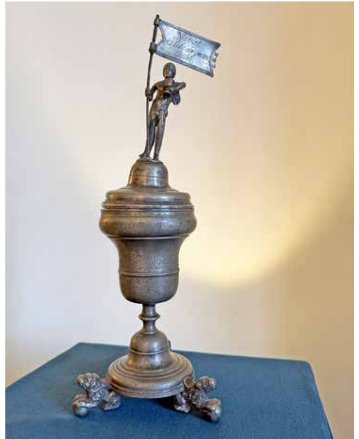
Der „Willkomm“ aus der Zeit der Neugründung der Lütjenburger Schützen-Todtengilde von 1791.