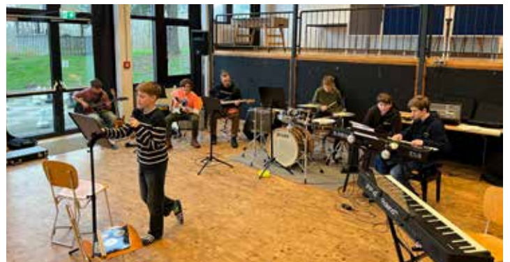
The Rookies vom GSP probten auf dem Scheersberg.

ler. Die Schüler*innen der Technik-AG unterstützten unter der Leitung von Merlan Bromisch die Ensembles wieder tatkräftig und bilden sich intensiv zum Thema Bühnentechnik fort. Die Jugendlichen der Jahrgänge sieben bis 13 entwickelten auch in diesem Jahr während mehrerer Proben am Tag Programme, die sie bis zu den Sommerferien aufführen werden. Nicht zuletzt nutzten sie die Zeit, um durch gemeinsame Aktivitäten in und außerhalb der Musik als jahrgangsübergreifende Gruppe zusammenzuwachsen.