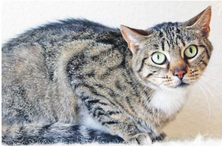
Diese beiden Samtpfoten sind vermutlich Geschwister: Tiffy und ...

suchen. Neu im Tierheim sind die beiden Samtpfoten Tiffy und Samson, die vermutlich Geschwister sind und daher auch im Doppelpack adoptiert werden sollen.