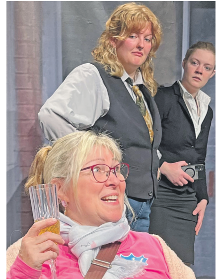
Mit einer Bahnsatire kommt das Theater Zeitgeist nach Preetz.

Preetz (t). Eine Bahnsatire von Winnie Abel spielt das Theater Zeitgeist Sonnabend, 8. Februar, um 19.30 Uhr in der Aula des Friedrich-Schiller-Gymnasiums in Preetz. Antje Kemmler-Reder und Conny Neugebauer haben „Es fährt kein Zug nach Irgendwo“ inszeniert. Den Kartenvorverkauf übernimmt die Buchhandlung am Markt in Preetz, man kann auch online auf www.theaterzeitgeist.de Tickets kaufen. Und darum geht es: Wer ist nicht schon mal schwer bepackt durch den Bahnhof gesprintet, weil das Gleis spontan geändert wurde? Oder durch einen Zug mit falscher Wagenreihung geirrt? Wer jetzt sagt: „Klar! Ist doch typisch Bahn!“, ist bestens vorbereitet auf dieses fulminante Bahn-Abenteuer: Der ICE 6948 wird einen außerplanmäßigen Halt einlegen müssen und die Fahrgäste an einem trost-