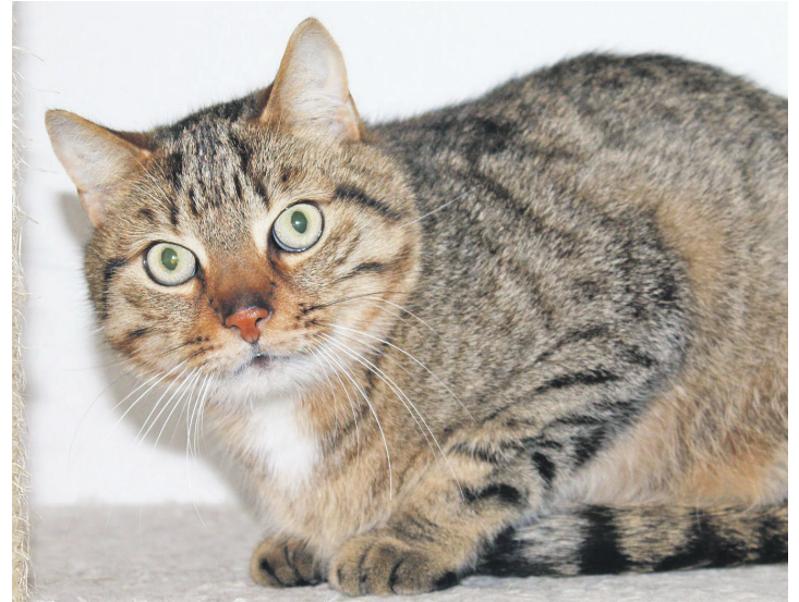
... Samson sollen im Doppelpack vermittelt werden.

Beide haben ein wunderschön gepflegtes, braun-getigertes Fell. Auffällig dabei ist Samsons leicht goldene Färbung und bei Tiffy die cremefarbene. Ihre Pfötchenspitzen sehen zudem aus, als wären sie in helle Farbe getunkt. Die hübschen Tigerchen könnten etwa um die drei Jahre alt sein. Sie verstehen sich so gut miteinander, dass sie sogar zusammen im Kuschel-Tipi schlafen. Eigentlich ist das viel zu winzig für zwei ausgewachsene Katzen, doch die beiden schaffen es irgendwie immer wieder, sich da zu zweit reinzuquetschen und stundenlang bequem zu dösen.