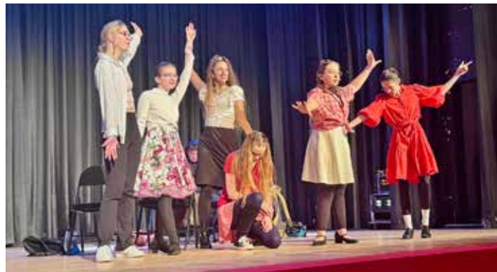
Die Musical-Akteure erteten viel Beifall.

Preetz (t). Vor vollbesetzten Reihen und begleitet von anhaltendem Jubel präsentierte die Musical-AG des Friedrich-Schiller-Gymnasiums (FSG) an zwei Abenden erstmals ihr selbstent-