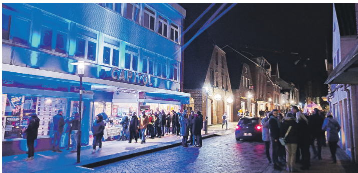
Die Kulturnacht lockt: Am 21. Februar sind die Geschäfte und Straßen in der Preetzer Innenstadt auch abends voll.