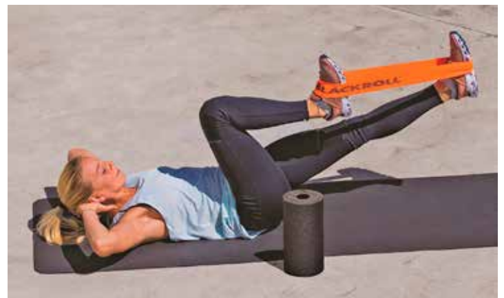
Blackroll hilft, gesund in Form zu kommen.

Kundinnen und Kunden von familia und Markant punkten bei jedem Einkauf. Für nur 20 Treuepunkte können sie sich einen Treueartikel zum stark vergünstigten Sonderpreis aussuchen. Nach dem bewährten Prinzip erhalten sie an der Kasse