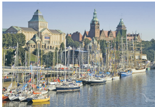
Die alte Hansestadt Stettin entdecken die Leser bei der großen Stadtrundfahrt mit Reiseleitung.

mal großes Schlemmerfrühstück vom Buffet sowie drei Abendessen im Hotel als Schlemmerbuffet oder Drei-Gang-Menü. Bereits auf der Anreise erfolgt der Besuch der alten Hansestadt Stettin mit großer Stadtrundfahrt mit Reiseleitung und Freizeit, am zweiten Tag eine große Insel-Rundfahrt Usedom mit perfekter Reiseleitung unter dem Motto „Noble Kaiserbäder“