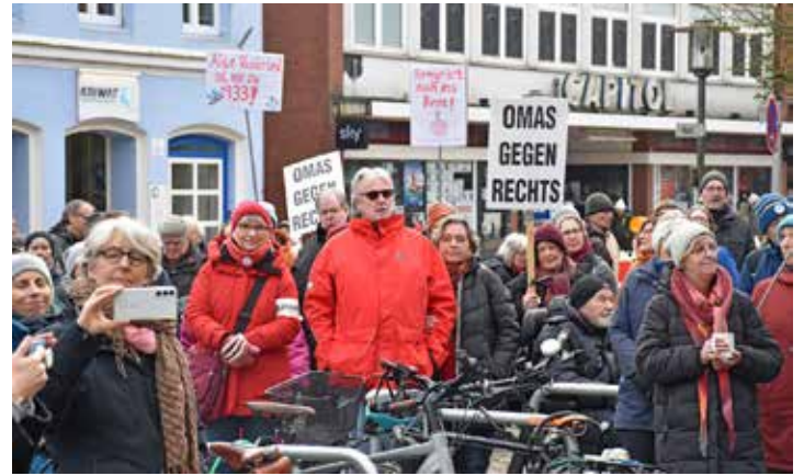
Bis zu 150 Teilnehmer sind Sonnabend für Sonnabend bei den Kundgebungen in Preetz dabei.