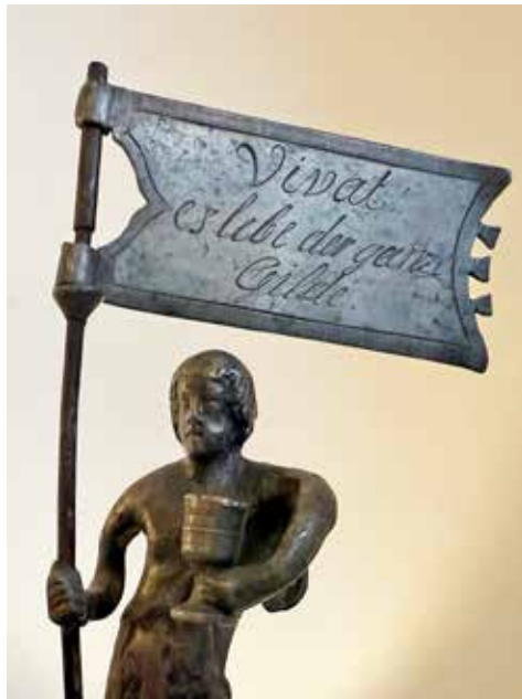
Blick aufs Detail: Die kleine Figur wurde mit einem Trinkpokal gestaltet.

Dabei enthielt die Abbildung nur wenige Auskünfte. „Das war nicht sehr ergiebig“, berichtet Constanze Köster, „aber die Figur hatte mich angesprochen.“