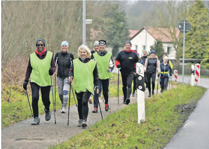
Rund sechs Kilometer legten die Walker bei der Jahresendrunde zurück.