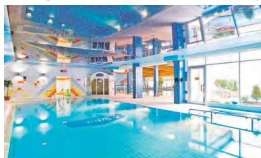
Herrliche Entspannung bietet die große Wellness- und Schwimmbad-Abteilung des Hotels Lidia.

Außen-Whirlpool sowie einer Flasche Wasser zur Begrüßung auf dem Zimmer, eine große Panorama-Rundfahrt mit Reiseleitung „Auf den Spuren des Bernstein“ mit Abstecher in den bekannten Slowinski-Nationalpark sowie eine Ostsee-