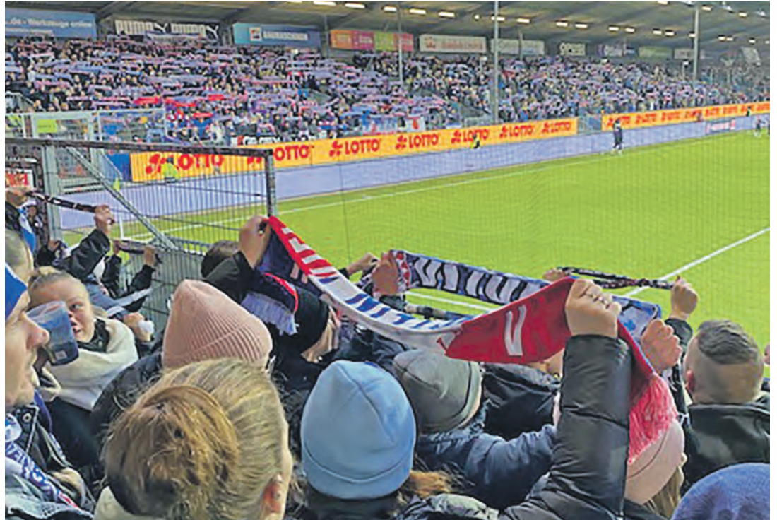
Jubeln die KSV-Anhänger auch in Freiburg wieder?