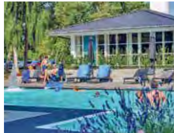
Traumhafte Hotel-Anlage mit großem Pool direkt am Meer