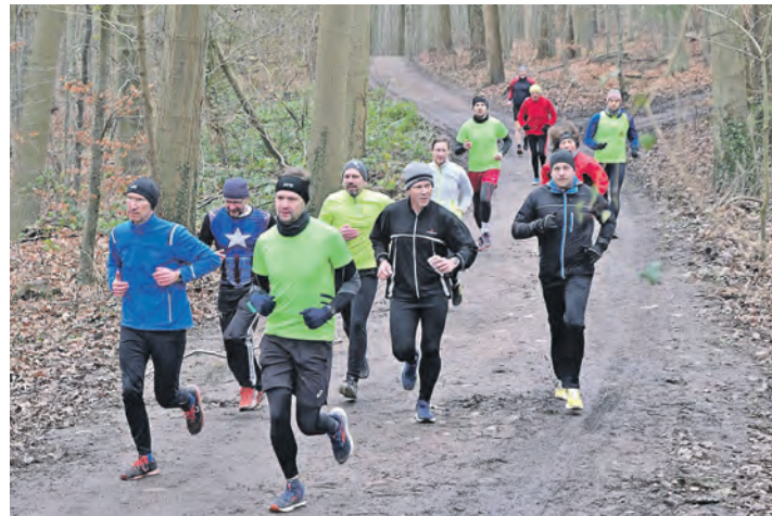
Die Zehnkilometerläufer passierten das ansteigende Gelände im Mühlenwald mit Tempo.

bin ich meinen ersten Marathon gelaufen.“