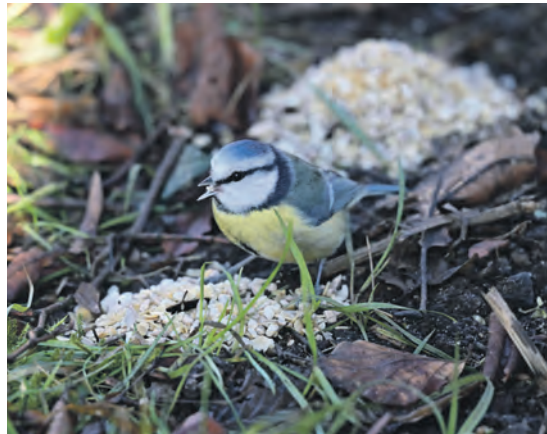
Nur so groß wie ein Buchenblatt kann die kleine Blaumeise sich gut im dichten Geäst schützender Hecken fortbewegen.