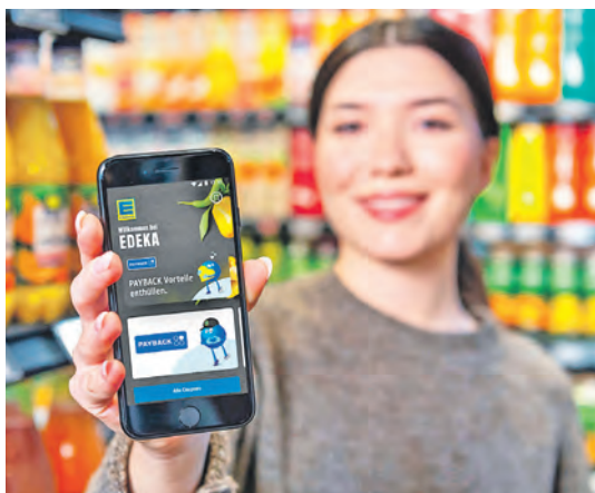
Endlich punkten: Der EDEKA-Verbund ist ab sofort Partner von „Payback“.

count verknüpfen und mit nur einem Scan die Vorteile aus beiden Welten nutzen. „Payback“ überzeugt mit seiner hohen Alltagsrelevanz und Attraktivität, wovon auch die selbstständigen EDEKA-Kaufleute profitieren.