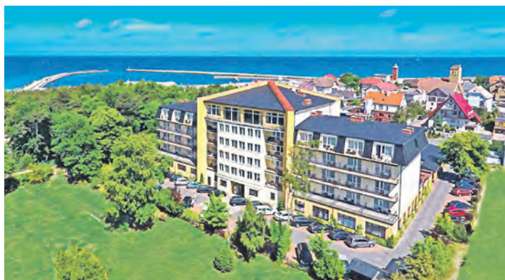
In Top-Lage am Meer befindet sich das exklusive Verwöhn-Hotel „Lidia“ an der Pommerschen Bernsteinküste.

Zum großen Leistungspaket gehören neben der Fahrt im erstklassigen Fernreisebus ab Preetz, Plön und Eutin ohne Einsammeltour vier Übernachtungen im Vier-Sterne-Top-Hotel Lidia mit großzügigen und reichhaltigen Schlemmerbuffets zum Frühstück und Abendessen, die kostenlose Benutzung der großen Wellness-Abteilung mit zwei Schwimmbädern, Whirlpool, Dampfbad und