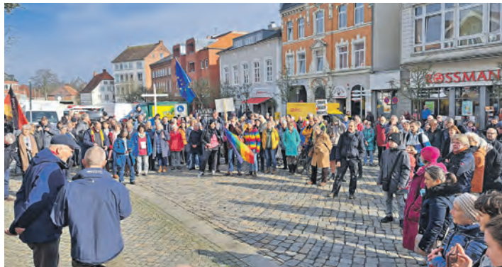
Bereits zur Europawahl fanden die Kundgebungen eine gute Resonanz und setzten Zeichen.