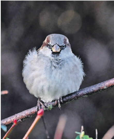
Wer beobachtet hier wen? Der junge Spatz hat den Zweibeiner mit dem großen Kameraobjektiv genau im Blick.

„Melden Sie Ihre Vogelbeobachtungen über unser Online-Formular www.NABU.de/