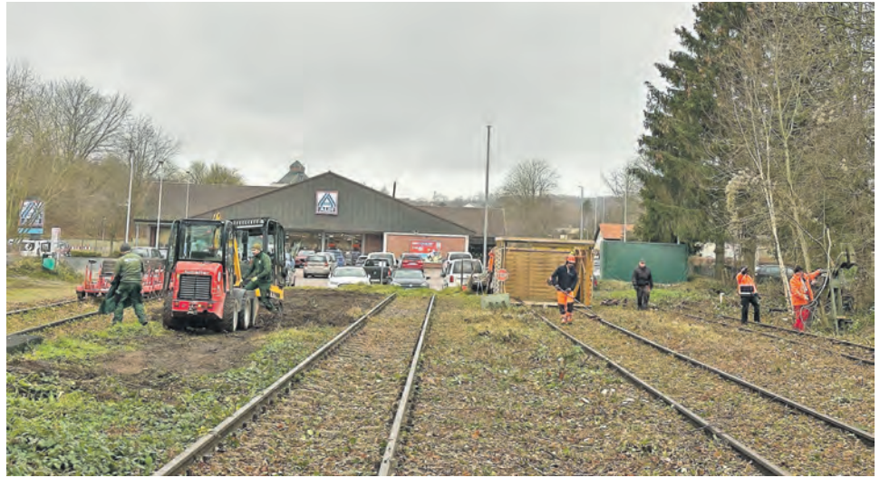
Der Verein Schienenverkehr hat die Haltestelle in Lütjenburg ...

Im November 2024 hatte die aus dem Verein Schienenverkehr Malente-Lütjenburg hervorgegangene Trägergesellschaft zum Erhalt der Bahnstrecke Malente-Lütjenburg einen Zuschuss vom Bürgerbeirat der Stadt Lütjenburg erhalten. Der Bürgerbeirat der Stadt Lütjenburg ( https://www.stadt-luetjenburg.de/buergerbeirat ) ist ein städtisches Gremium aus ehrenamtlichen Vertretern der Bewohnerschaft,