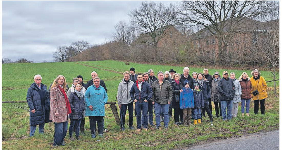
Im Frühjahr hatte viele Anwohner der Fußsteigkoppel gegen die Bebauung des Feldes in direkter Nachbarschaft an der Wakendorfer Straße mobil gemacht.

Ausnahmslose Zustimmung der Ratsmitglieder gab es für den Bebauungsplan Nr. 106 „Großflächiger Einzelhandel nördlich der Fußsteigkoppel“. Dort soll ein Penny-Markt entstehen. Zuletzt hatte eine Anwohnerinitiative gegen das Vorhaben mobil gemacht. Verschiedene Kritikpunkte und Anregungen wurden von der Kommunalpolitik aufgegriffen. So werde ein Linksabbieger auf der Wakendorfer Straße aus Richtung Ortsausgang gebaut und der Fuß- und Radweg auf der östlichen Straßenseite verlängert. In Sa-