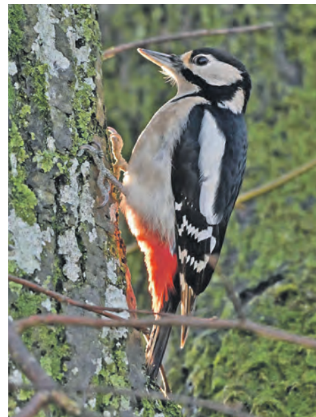
Das Weibchen des großen Buntspechts sucht die zerklüftete Rinde des Parkbaums nach kleinen Insekten ab.

onlinemeldung“, empfiehlt Carsten Pusch. Auch über die kostenlose App „Vogelwelt“, die unter www.NABU.de/vogelwelt zu finden ist, können die Zählergebnisse übermittelt werden. Eine dritte Möglichkeit ist es, sie auf dem Postweg schriftlich mit dem Meldecoupon zu versenden.