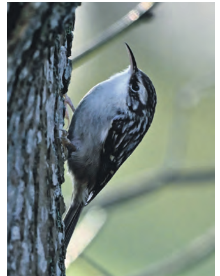
Gut getarnt: Nur wenn er sich bewegt, fällt der Baumläufer auf...

vögel“ bereits in 15. Auflage durchgeführt. Auch Landesvorsitzen-