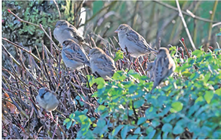
Sie lieben es gesellig: Haussperlinge sind am liebsten in Gruppen unterwegs.

Mit einer Stunde Zeit, Block und Bleistift sowie einem geeigneten Plätzchen am Fenster, auf Balkon oder Terrasse, im Garten oder Park kann jeder zu dem Langzeitprojekt des NABU beitragen. Dabei wird die „Stunde der Winter-