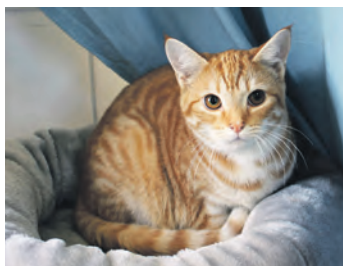
Auf der Suche nach einem liebevollen „Katzenversteh“: die sanfte Pina.

Kossau/ Lebrade (t). Auch in dieser Ausgabe wollen wir Ihnen wieder zwei tolle Bewohner des Tierheims Kossau-Lebrade vorstellen, die ein neues und liebevolles Zuhause mit großem Garten suchen. Tiger ist etwa ein dreiviertel Jahr alt und hat ein graubraun-gegrügeltes Fell mit weißem Latz, Bauch und weißen Pfötchen. Der kleine Racker wurde alleine um-