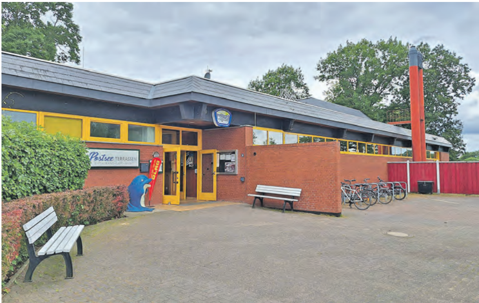
Die Preetzer Schwimmhalle wird Ende des Jahres für etwa ein halbes Jahr geschlossen. Die Technik hinter den Kulissen wird modernisiert.