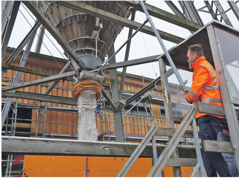
Verkehrsminister Madsen befüllt in Klausdorf den ersten LKW mit Salz und startet so symbolisch den Winterdienst.