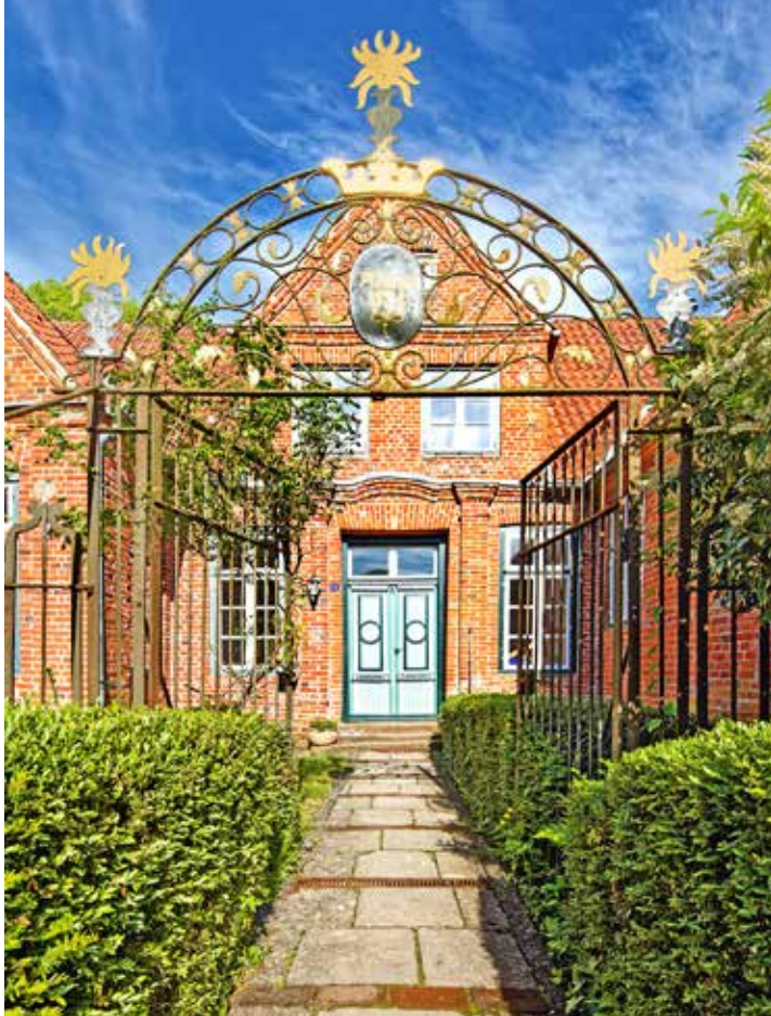
Das Wardenburgsche Haus im Klosterhof 14 mit seinem schmiedeeisernen Gitter.

„Die Bilder, die ich für den Klosterführer angefertigt habe, zeigen das Kloster in einem idealisierten, zeitlosen Zustand. Dazu wurden alle störenden Zufälligkeiten, etwa auch geparkte Autos, die Hinweise auf ein Hier und Jetzt geben, sorgfältig aus dem Blickwinkel der Kamera verbannt. Das war oft nur durch ein Mitwirken der Klosterbewohner