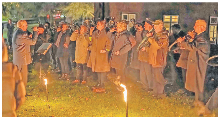
Feierlich klingt die Hubertusmesse bei Fackelschein aus.