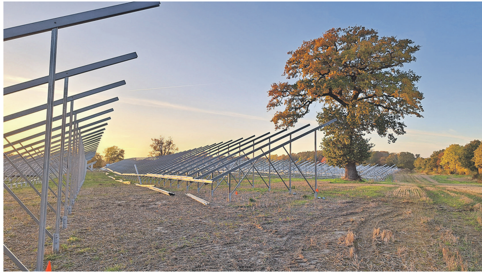
Auf einer 40 Hektar großen Fläche an der B 76 entsteht in Höhe Wittmoldt ein großer Solarpark.

Der Vorteil der Planung vor Ort hat sich schnell gezeigt: Der Draht zu den oft herausfordernden Behörden ist kürzer und die Interessen der Gemeinde können passgenau ins Projekt eingearbeitet werden. So ergeben