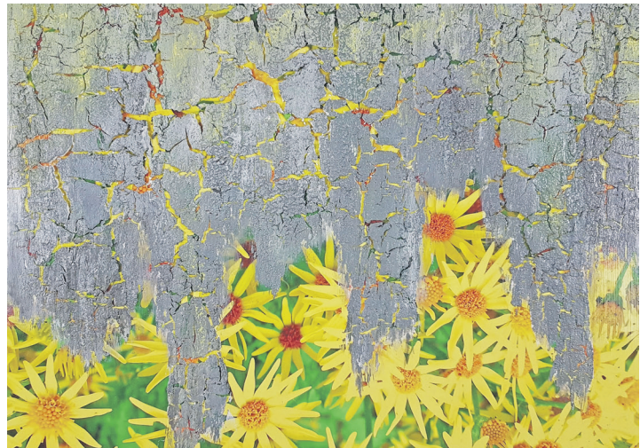
Diese Collage von Kirsten Reimers trägt den Titel „Klimawandel“.

rantiert, denn die Mitglieder des Kunstkreises bieten unterschiedliche Gewerke an. So ist mit Malerei, Fotografie, Skulptur und diversen angrenzenden Techniken