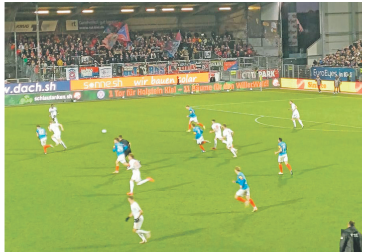
Endlich der ersten Holstein-Dreier in der Bundesliga.

Holtby wandte sich über die sozialen Medien an die Anhänger. Dies alles schien gefruchtet zu haben und macht Hoffnung am Samstag (9. November, 15.30 Uhr) bei Werder Bremen Zählbares mit an die Förde bringen zu können. Beim Club von Ex-Stürmer Marvin Duksch werden die Aufsteiger von 4000 Fans unterstützt werden. Der Ausblick auf die kommenden Spiele unserer Vereine: In der Landesliga Holstein hat der Preetzer TSV ein Auswärtsspiel vor der Brust und muss zum SV Eichede reisen. Ein Dreier und man kann ein wenig entspannter in den Herbst blicken. Anpfiff für dieses Spiel ist am 10. November um 14 Uhr. Auch in der Verbandsliga Ost geht es weiter. Wie in den Landesligen, so ist auch hier Spieltag 15 angesagt. Die SG Oldenburg/Göhl und der SVE Comet treffen sich schon am 8. November ab 19.30 Uhr bei der Spielgemeinschaft. Die Cometen sind hier nicht nur Gäste, sondern als Ligaprimus auch der klare Favorit auf einen Dreier. Der Druck liegt bei den Hausherrn, die im Abstiegskampf Punkte holen müssen. Am Samstag, 9. November, startet dann die SG Probstei mit einem Heimspiel gegen die Wik, der Barkelsbyer SV hat Heim-