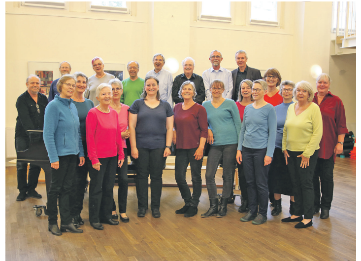
Der Plöner Chor Zwischentöne stimmt bei seinen Novemberkonzerten ein buntes Programm von Liedern zum Thema Liebe an.

Unter dem Titel „And so it goes - contemporary love songs“ setzen die Sänger inhaltlich einen Kontrapunkt zu den ausgesuchten Klassikern von Protestsongs ihrer letzten Konzerte. Diesmal