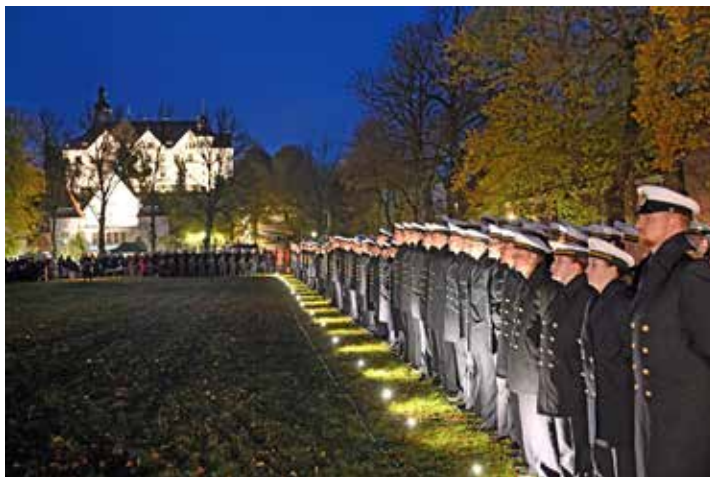
Im Rahmen der öffentlichen Vereidigung und Gelöbnisfeier treten die Soldaten auf der historischen Reitbahn im Plöner Schlossgebiet an.

Ministerpräsident Daniel Günther in Plön. Den Hintergrund zu dem Termin der Veranstaltung bildet der Gründungstag der Bundeswehr am 12. November 1955 ab. Damals erhielten die ersten 101 Freiwilligen ihre Ernennungsurkunden aus der Hand des ersten Verteidigungsministers der Bundesrepublik Deutschland Theodor Blank.