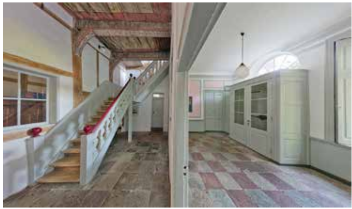
Die schwer zu fotografierende Eingangsdiele des Thienenhauses im Klosterhof 11: links der ursprüngliche Zustand von 1624/25, rechts die 1730 abgetrennte vordere Diele mit abgehängter Gipsdecke.

möglich“, erzählt Perlbach von seiner Arbeitsweise. Und da er selbst seit 1997 auf dem Klostergelände wohnt, konnte er die Gebäude unter optimalen Lichtbedingungen zu jeder Tageszeit bildwirksam in Szene setzen. „Obgleich ich als professioneller Architekturfotograf die Gebäude gemäß eines strengen Regel-