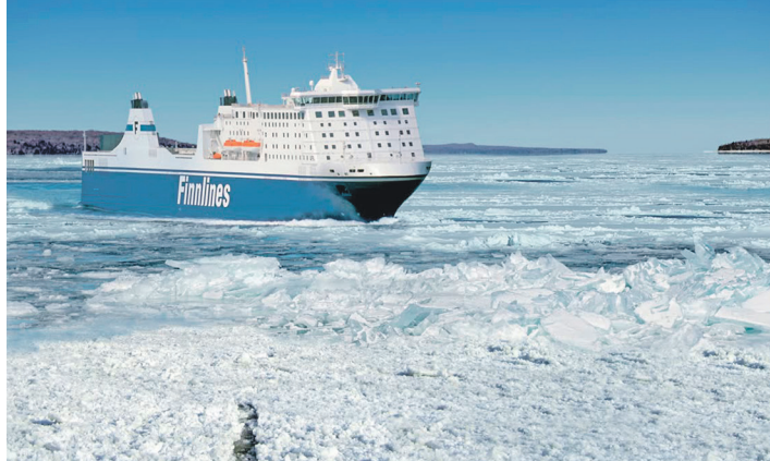
Auf großer Eisfahrt mit Finnlines-Jumbofährschiffen reisen die Reporter-Leser nach Helsinki.

Die komfortablen Kabinen (nach Wahl innen oder außen) bieten