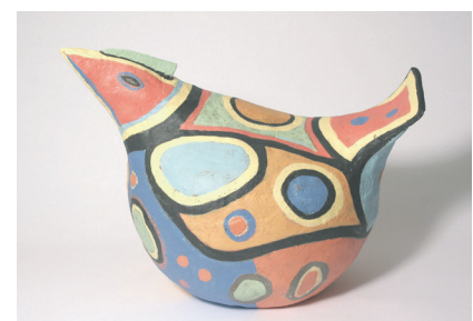
„Nico von der Pfalz“ nennt Künstler Jens Rahn diese Arbeit.

Nach der Eröffnung ist die Schau zwischen dem 15. November und 1. Dezember jeweils freitags bis sonntags von 15 bis 18 Uhr geöffnet. Der Eintritt ist frei.