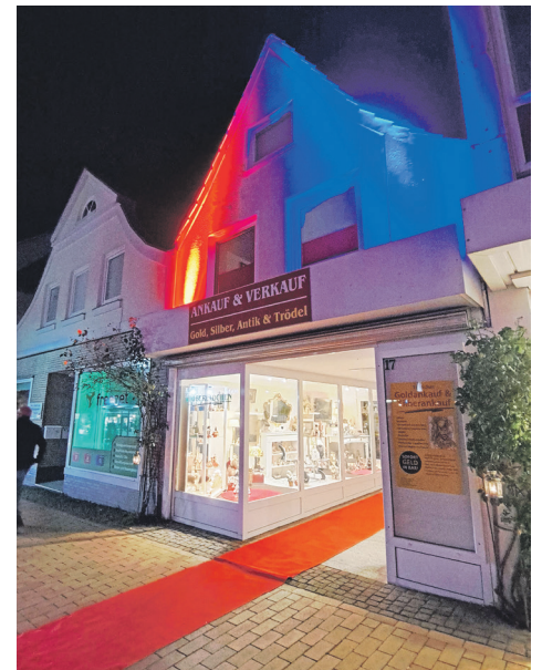
Am Freitag werden die Preetzer Fachgeschäfte in stimmungsvolles Licht getaucht.

wurde die Silent Disco von Kindern, Jugendlichen und Erwachsenen gleichermaßen genutzt – auch weit über 21.30 Uhr hinaus.