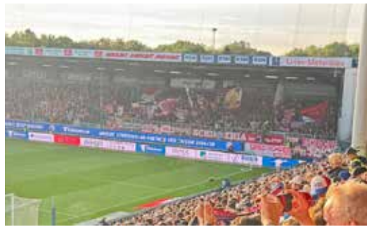
Der Bayern Fanblock hatte Grund zum Jubeln.