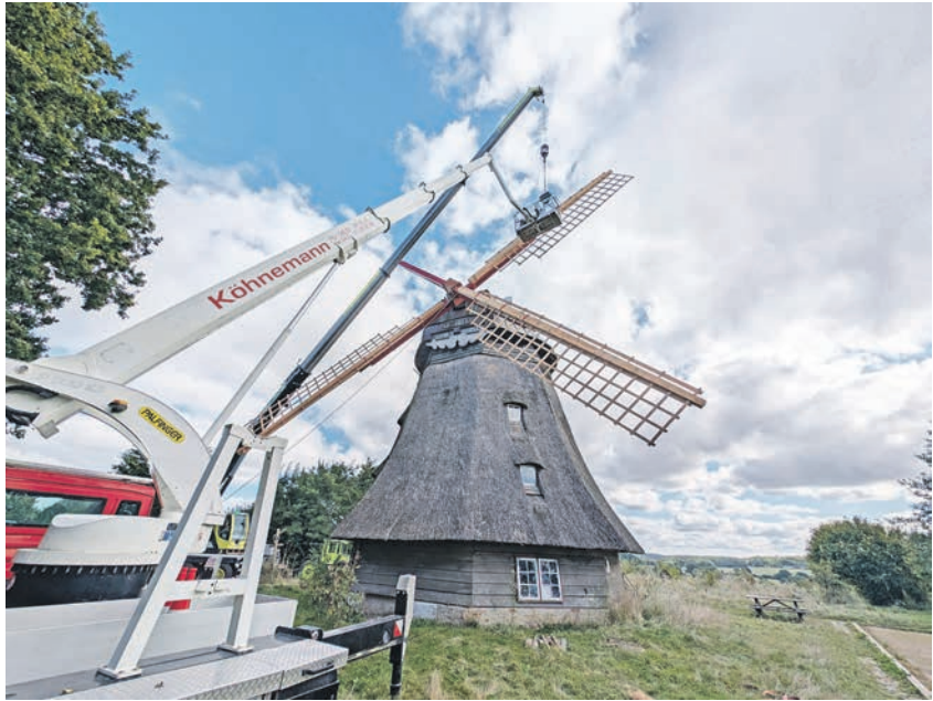
Die Windmühle von Grebin hat am 14. September neue Flügel erhalten.

Dank der ehrenamtlichen Mithilfe der Grebiner Bürger und dem Einsatz schwerer Maschinen, die zum Teil gespendet wurden, konnten die Flügel am 14. September 2024 in Eigenregie montiert werden.