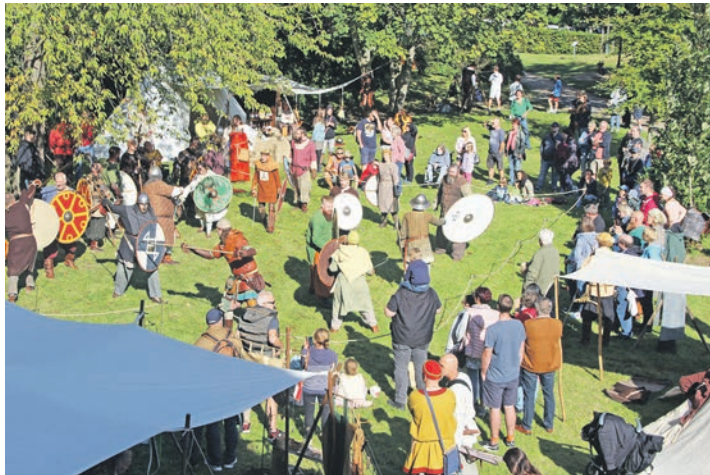
Das Lager im Museumsgarten vermittelt Geschichte und veranschaulicht die Zeit vor 1000 Jahren.