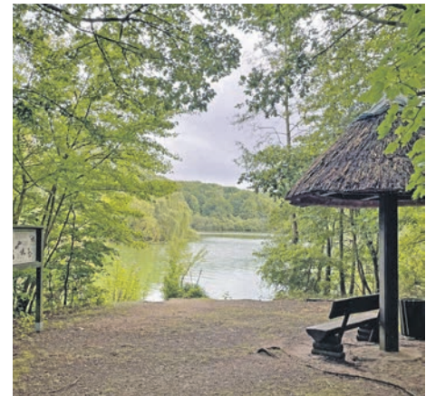
Auf Kleines Warder findet am Sonnabend die nächste Vogelerkundungstour der VHS Bosau statt.