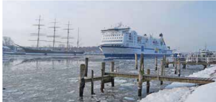
Unterwegs mit den Jumbo-Linern der TT-Line zum großen Jubiläum – Kurs Schweden.

Preetz/ Plön (t). Ein genussvoller Advents-City-Trip voller Erlebnisse zum einmaligen Superpreis von nur 225 Euro erwartet die Reporter-Leser zum Top-Termin des Jahres 2024 am zweiten Advent (6. bis 8. Dezember 2024) mit dem Genuss-Erlebnis der malerischen Weihnachtsmärkte in Schweden in der Universitätsstadt Lund und in der Hafenstadt Malmö, mit viel Freizeit zum ausgiebigen Weihnachts-Shopping. Der Kurs der Reise startet ab Preetz und Plön zur einmaligen Entdecker-Kreuzfahrt mit Bus und Jumbofähren nach Schweden: Die Einschiffung von Bus und Fahrgästen erfolgt in Travemünde auf eines der großen Märchenschiffe der TT-Line. An Bord werden die Leser mit schwedischen Schlemmer-Spezialitäten zum Mittagessen preisinklusive rundum verwöhnt, und Sie genießen die komfortable Überfahrt