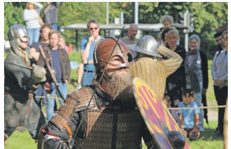
Darsteller zeigen den Umgang mit mittelalterlichen Waffen.

um, da hier die Originalfunde als Quelle ihrer aktiven Vermittlung von gelebter Geschichte Teil der Sammlung sind. Spenden zugunsten des Museums sind anstelle von Eintritt auch deshalb herzlich willkommen. Es handelt sich um eine nicht-kommerzielle, mit viel Herzblut und Engage-