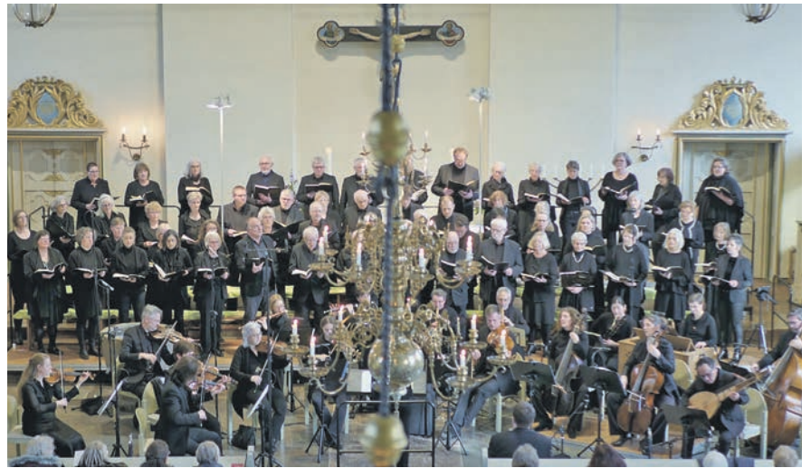
Händel erwartet die Besucher am 22. September in der Stadtkirche.

Eintrittskarten sind ab sofort im Vorverkauf zum Preis von 25, 20 und 15 Euro in den Preetzer Buchhandlungen und an der Abendkasse ab 16.30 Uhr erhältlich.