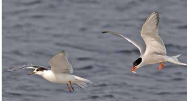
Das letzte Küken (links) kann fliegen und muss jetzt schnell lernen Fische zu fangen