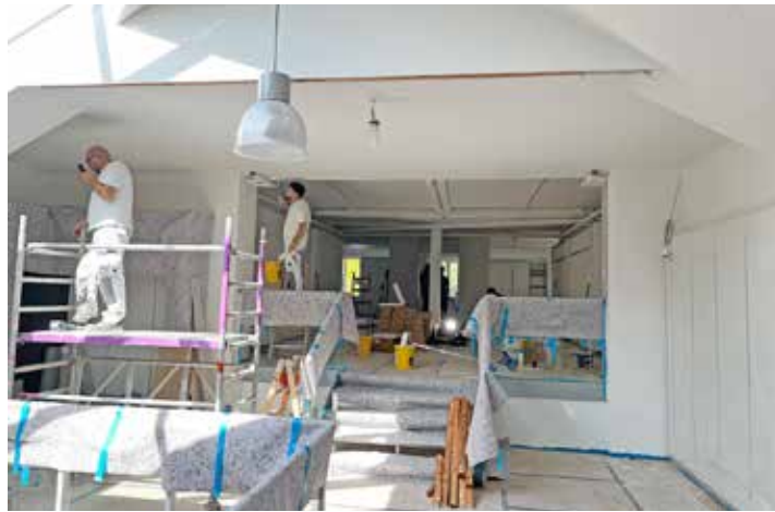
„Wir schließen nicht – unser Modehaus wird umgebaut!“, betont das Mews-Team.

Lütjenburg (t). Der Umbau im Lütjenburger Modehaus Mews ist in vollem Gange und geht gut voran. In wenigen Wochen soll bereits Neueröffnung mit vielen Überraschungen gefeiert werden. Damit die Kunden in dieser Übergangszeit nicht vollständig auf die vielfältige Mode verzichten müssen, hat das Traditionsunternehmen seit dem 2. September im kleinen Rahmen für die Kundschaft geöffnet. „Sie finden uns im Modehaus, wenn Sie den Eingang der Plöner Straße nutzen. Schauen Sie gerne vorbei, bestimmt finden Sie bei uns noch einige tolle Teile für Ihren Kleiderschrank“, lädt die