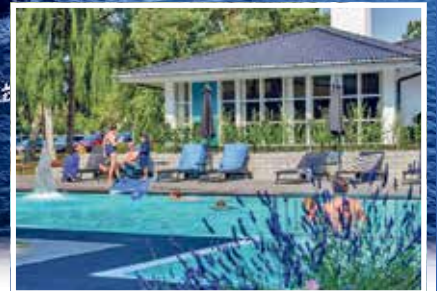
Traumhafte Hotel-Anlage mit großem Pool direkt am Meer

Die weltberühmte Felsen-Insel in der Ostsee mit malerischen Fischereihäfen, traumhaften Sandstränden und den weltberühmten Rundkirchen erwartet die Reporter-Leser zum Top-Termin im „ Goldenen September “ zum sehr günstigen Komplettpreis. Residieren werden unsere Gäste in einmaliger Lage in einem zauberhaften Kiefern-Park im sehr beliebten Bade-Hotel mit großem, beheiztem Außenpool und sehr grosszügigen Hotel-Zimmern mit Balkon oder Terrasse in absolut ruhiger Lage am Meer und an einem der schönsten Sandstrände im Süden der Insel. Die deutschsprachige Hotel-Führung verwöhnt die Urlauber zudem mit skandinavischem Gaumen-Kitzel vom Frühstücks-Bu et bis zu den leckeren Abend-Menüs oder Bu ets.