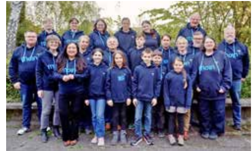
Serenaden, Bagatellen und Abendlieder bringt der Posaunenchor zu Gehör.

nachts um halb eins“ auf dem Programm. Im Anschluss an das Konzert wird zu einem Umtrunk bei Kerzenschein eingeladen. Die historischen Gräber und die Krypta der Stadtkirche sind an diesem Abend besonders beleuchtet. Der Eintritt ist frei.