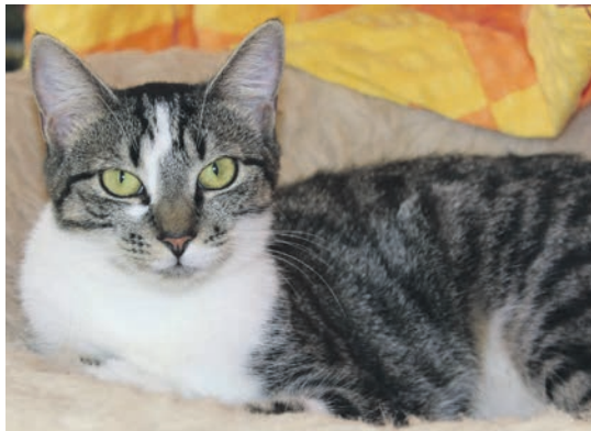
Odilia kehrt das große Schwesterchen heraus, obwohl ...

in das Außengehege, um sich abzureagieren. Während sich Odilia ein verdientes Sonnenplätzchen sucht, jagt Odin noch eine Weile den Fliegen und Faltern hinterher. Irgendwann hat auch er genug und legt sich neben seine Schwester.