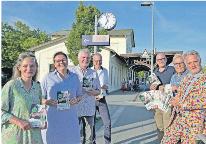
Die Vertreter des Vereins Stadtmarketing präsentieren am 6. September die 22. Plöner Kulturnacht.

Plön (los). Wer hat an der Uhr gedreht? Am Freitagabend, 6. September, ist wieder Plöner Kulturnacht, wie immer am ersten Freitag im September. Eröffnung ist um 18 Uhr vor dem Rathaus am Schlossberg. Quer durch die Innenstadt präsentiert der veranstaltende Verein „Stadtmarketing Plön am See“ eine hör- und sehenswerte Reihe von Einzelveranstaltungen. Es ist die 22. Auflage der Kulturnacht, die 2001 ihr Debüt feierte, jedoch 2020 und 2021 aufgrund der Corona-Beschränkungen ausfiel. Im Einzelnen kurzweilig klein und kompakt macht die Vielfalt den besonderen Reiz des kompakten Programms aus, das Christoph Kohrt für den Verein organisiert hat. Wer sich seine persönlichen Favoriten herausgepickt hat, kann zielstrebig draufloslaufen – doch genauso gut kann man sich natürlich treiben lassen und schauen, wohin der Abend führt. Eine Bühne der besonderen Art, die zwischen den Pavillons und der Hochzeitsschmiede am Markt geparkt wird, ist der VKP-Bus. Dort sorgt das Plön-Akustik-Duo mit Kay Duggen und Jürgen Hamann mit irischer und amerikanischer Folk-Musik für coole Klänge. Eine atemberaubende Feuershow gibt es um 22 Uhr auf dem Marktplatz. Bei „Rewe“ freuen sich die Kinder vom Lebrader Zirkus Sonnenschein auf ihr Publikum, dem die Kids ihre Artistik vorführen wollen. Und natürlich darf wunderliches Gespökel nicht fehlen: Zauberer