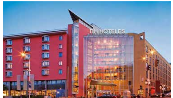
Eines der besten Hotels der Stadt erwartet unsere Leser mit dem luxuriösen NH-Hotel in Prag.