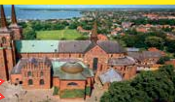
Wikinger-Dom Roskilde: UNESCO-Welt-Kulturerbe & Königsgräber