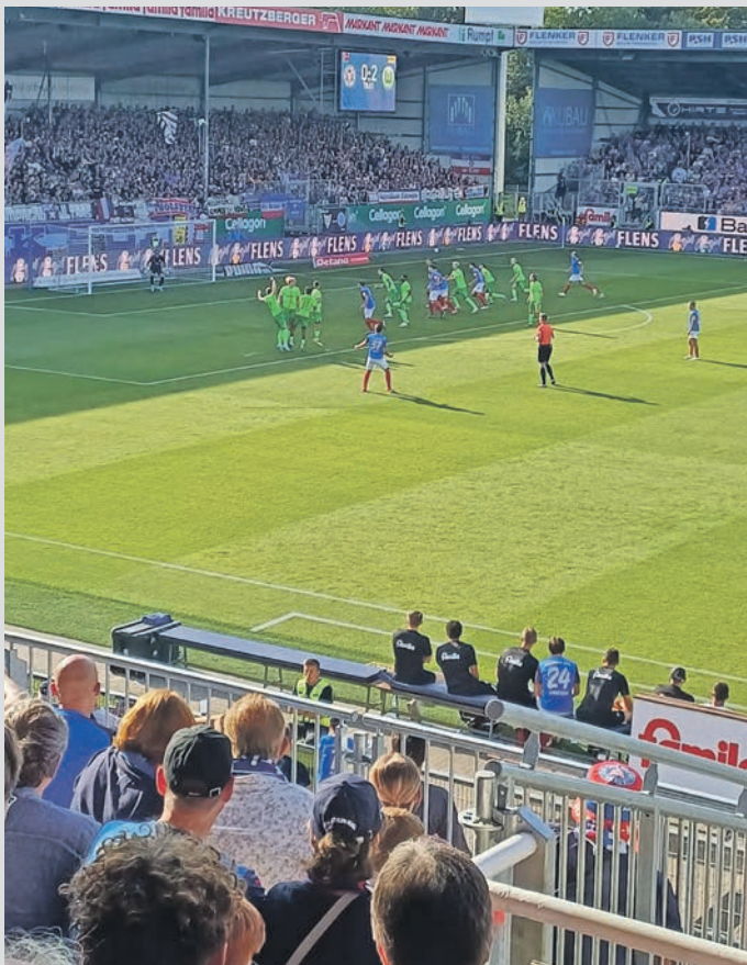
Kein Durchkommen im Strafraum vom VfL Wolfsburg für Holstein Kiel.

Kiel (dif). Die KSV Holstein hat auch ihr zweites Saisonspiel in der 1. Bundesliga verloren. Mit 0:2 unterlagen die Störche im ausverkauften Holstein-Stadion dem VfL Wolfsburg. Maximilian Arnold und Sebastiaan Bornauw schossen binnen drei Minuten (27./30.) den Dreier für die Wölfe heraus. Danach waren die Aufsteiger aus Kiel einfach zu harmlos und nicht griffig genug im Angriff. Echte