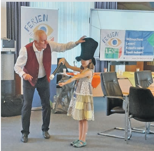
Bei der „Ferienleseclub“-Abschlussparty sorgte auch ein Zauberer für viel Vergnügen.

begeisterte Kinder haben mitgemacht, 35 von ihnen wurde eine Urkunde für die erfolgreiche Teilnahme überreicht“, berichtet Büchereileiterin Ulrike Barthel. Dafür mussten die Kids nachweislich mindestens zwei Bücher in der Ferienzeit