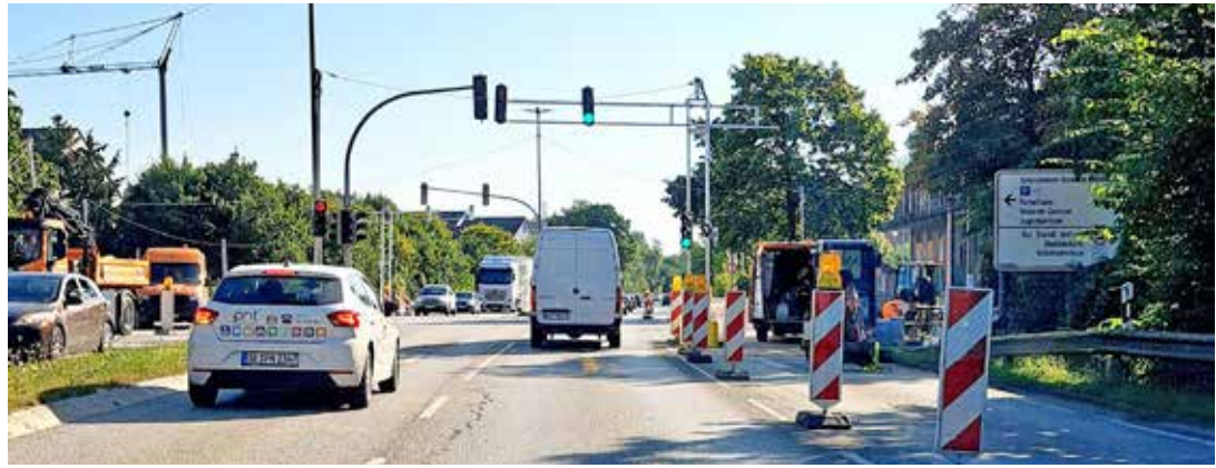
Die Fertigstellung der Ampel-Baustelle an der B 76 verzögert sich.

Plön (t). Der Landesbetrieb Straßenbau und Verkehr Schleswig-Holstein teilt mit, dass sich die Fertigstellung der Ampelanlage an der Kreuzung Rautenbergstraße/Rodomstorstraße in Plön im Verlauf der Bundesstraße 76 bis zum 15. September verzögern wird. Grund sind unerwartete Hindernisse – Steine – bei den notwendigen Bohrungen. Ursprünglich war die Fertigstellung für den 30. August geplant. Der motorisierte Verkehr wird einspurig je Fahrtrichtung über eine mobile Ampel am Arbeitsbereich