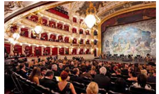
Eines der schönsten Opernhäuser in Europa: Die komplett restaurierte Prager Staatsoper im Herzen der Stadt.

Anmeldungen und Buchungen sind ab sofort bei den Reporter-Leser-Reisen des Burg-Verlages in Eutin des Telefon 04521-701130 (Montag bis Freitag von 9 bis 13 Uhr) oder direkt online auf leserreisen.der-reporter.info möglich.