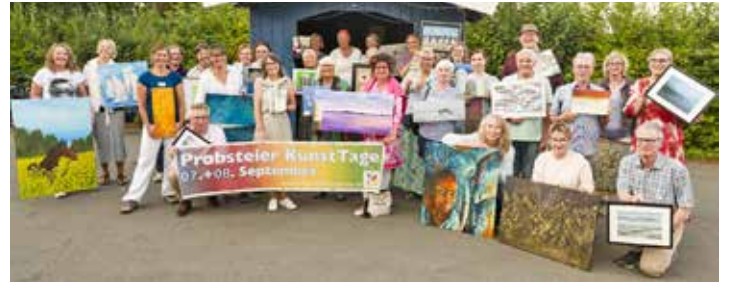
Der Kulturverein Probstei veranstaltet die Probsteier Kunsttage zum fünften Mal.

Ausstellungsorten. Sie sorgen für einen Kunstrausch erster Klasse. Auch in den kleinsten Ortschaften der Region wartet wieder ein vielfältiges Angebot aus Malerei, Zeichnung, Fotografie, Objekt und Installation, hergestellt mit den unterschiedlichsten Techniken, ob bekannt, unbekannt, neu, überraschend oder gar ungewöhnlich. Aktuelle Informationen gibt es online auf www.kulturverein-probstei.de