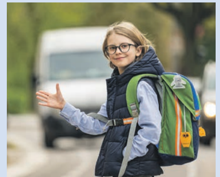
Die Reflektoren in Eulenform werden an der Jacke oder am Ranzen befestigt.

Mal startet Fielmann in diesem Jahr seine Verkehrssicherheitsaktion. Mehr als sechs Millionen Blinkis hat der Augenoptiker insgesamt an Schulanfänger*innen in Deutschland verteilt und so einen wichtigen Beitrag zum Thema Verkehrserziehung geleistet. Die Blinki-Reflektoren sorgen in Kombination mit heller Kleidung für eine verbesserte Sichtbarkeit. Einfach am Ranzen oder der Kleidung befestigt, nehmen andere Verkehrsteilnehmende die Kinder besser und früher wahr. „Unsere Blinkis sensibilisieren Schulanfänger*innen für die Themen Sicherheit und gutes Sehen im Straßenverkehr“,