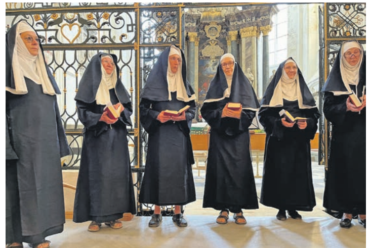
Mitglieder des Stadtkirchenchores wurden für ein Konzert zu Nonnen in Benediktinerinnen-Kutte.