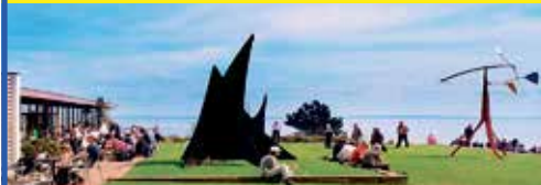
Kunst-Museum „Louisiana“ in einmaliger Lage am Öresund