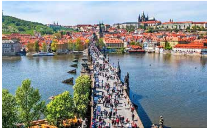
Die „goldene Stadt“ Prag genießen unsere Leser zum Superpreis zu Top-Terminen.

Die Gäste genießen auf Schritt und Tritt Geschichte und Kultur, denn nirgendwo auf der Welt ist ein historischer Stadtkern in derartiger Vollständigkeit und Schönheit erhalten geblieben und zu bewundern: Bei der großen Stadtrundfahrt/Stadtführung mit der so beliebten deutschen Reiseleiterin in Prag entdecken die Teilnehmer die Schönheiten der „goldenen Stadt“, und die Leser haben zu-