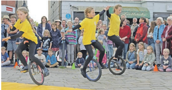
Die Kinder und Jugendlichen vom Zirkus Sonnenschein treten in einer bunten Show auf.