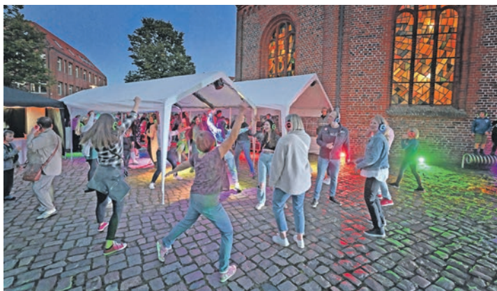
Tanzen mit Kopfhörern: die Silent Disco.

Weil's um mehr als Geld geht. foerde-sparkasse.de