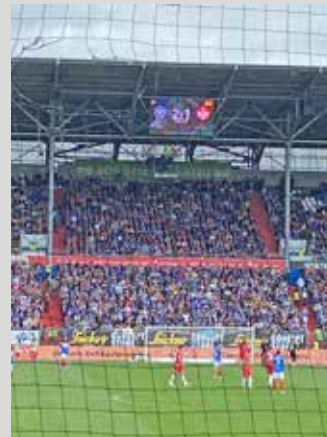
Die Holsteinfans erwarten Sonnabend den VfL Wolfsburg.