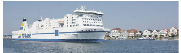
Unterwegs mit den Jumbo-Linern der TT-Line zum großen Jubiläum Kurs Schweden.

onale First-Class-Scandic-Hotel mit stilvollen Komfortzimmern und dem leckeren Frühstück vom Buffet für zwei Nächte. Am zweiten Tag ist eine große Stadtrundfahrt in Malmö mit fachkundiger, deutschsprachiger Reiseleitung zu