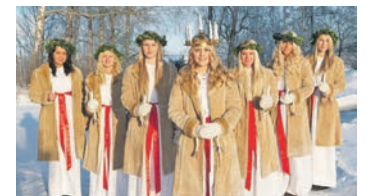
Das Lucia-Lichterfest wird in Schweden fröhlich und opulent gefeiert.

In Schweden erwartet die Reporter-Gäste sodann das internati-