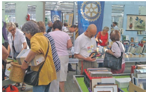
Besonders am Sonnabend ist der Ansturm auf den Benefiz-Flohmarkt in Krummsee stets groß.

Die von den Mitgliedern der Serviceclubs zusammengetragenen