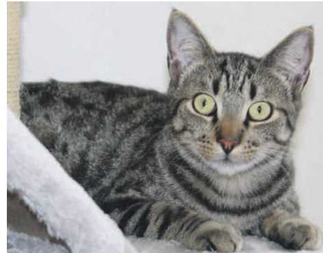
Seine Schwester Ollie hat durchgehend grau-getigertes Fell.

haben sie schon das ganze Zimmer minutiös erkundet und den großen Auslauf auf den Kopf gestellt. Obwohl sich die anderen drei Geschwister noch etwas zurückhalten, ist immer Schwung in der Bude. Stofftiere werden von A nach B transportiert, Bälle ins Ausgeschossen und was man herunterwerfen kann, wird heruntergeworfen. Das macht Krach und des-