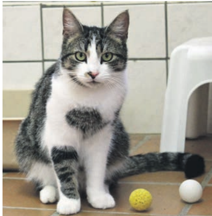
Kater Okito hat weiß-grau-getigertes Fell und einen dunklen Fleck auf der Nase.

Kossau (t). Auch in dieser Ausgabe stellt „der reporter“ wieder tolle Bewohner des Tierheims Kossau-Lebrade vor, die ein neues und liebevolles Zuhause mit großem Garten suchen. Kater