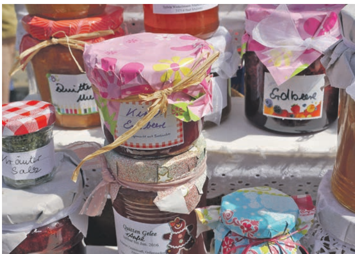
Ob Gartendekoration oder Marmelade, es gibt viele selbst gemachte Produkte zu entdecken.