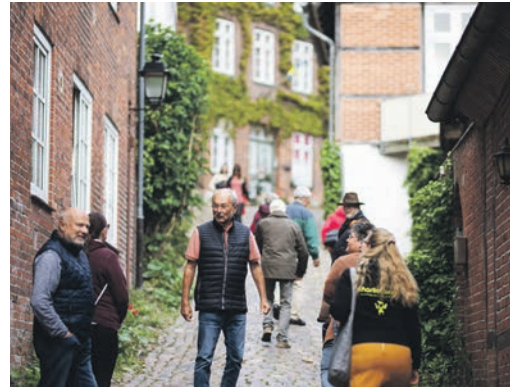
Die Tourist Info Plön bietet verschiedene Stadtführungen an.

Plön (t). In der kommenden Woche lädt die Tourist Info Plön wieder zu verschiedenen Führungen durch die Herzogstadt ein. Am Mittwoch, 28. August und 4. September, sowie am Sonntag, 1. September, werden jeweils um 15 Uhr Führungen durch das Plöner Prinzenhaus angeboten. Die