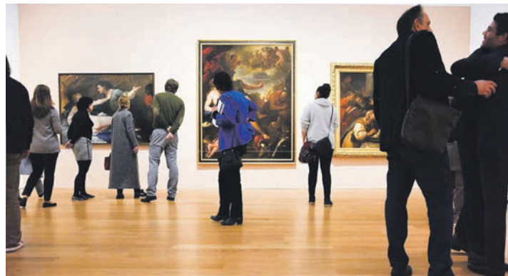
Das derzeit berühmteste Kunstmuseum Europas erwartet die Leser in Potsdam. Im Barberini-Museum läuft die sensationelle neue Vlaminck-Welt-Ausstellung.

Als kulturellen Höhepunkt der dreitägigen Sonderreise zum Termin vom 17. bis 19. November zum sehr günstigen Komplett-