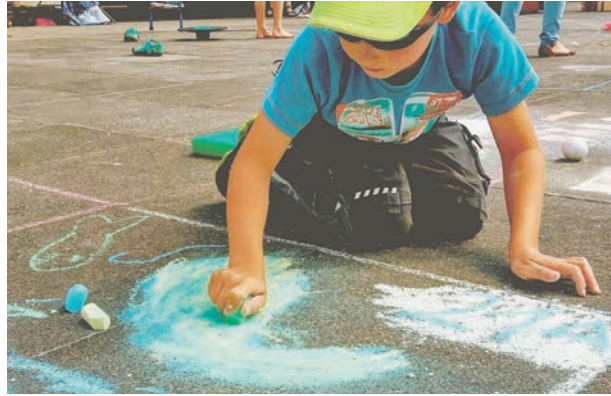
Am Sonnabend wird es bunt auf dem Schwentineplatz – wer malt die schönsten Bilder?

Plön (t). Die Plöner Tourist Info lädt zum 6. Plöner Kreidefestival ein. Die Veranstaltung findet am Sonnabend, 24. August statt und beginnt um 11 Uhr auf dem Schwentineplatz. Die Kinder erhalten kostenlos Kreide, um sich künstlerisch zu betätigen. Das Kreidefestival und das Rahmenprogramm organisiert Christoph Kohrt. Das Motto: „Wohin fährst du kleines Segelboot?“ Die Anmeldung erfolgt direkt am Tag der Veranstaltung. Die Kreidegemälde müssen bis 14 Uhr fertig werden; Siegerehrung ist um 15 Uhr.