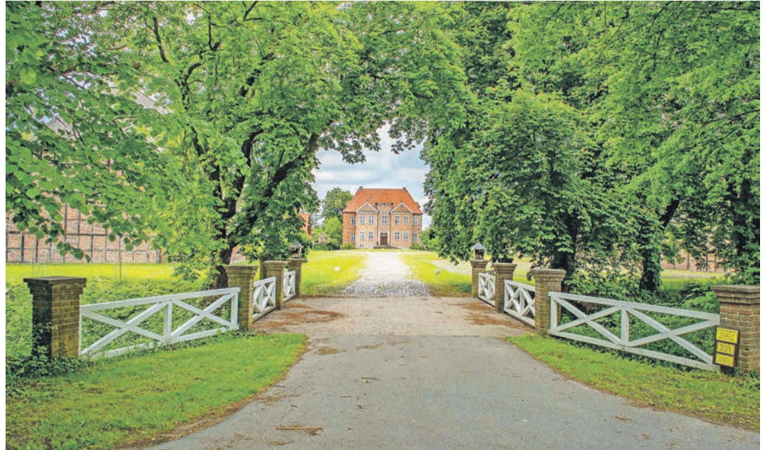
Auf dem herrlich am Lanker See gelegenen Gutshof findet der „1. Wahlstorfer Musiksonntag“ statt.