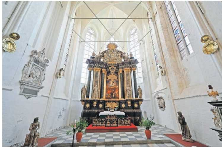
Chorraum der Klosterkirche Preetz.

Die Herrschaft der Dänen endete 25 Jahre später mit der Entschei-