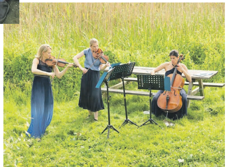
Das Ensemble „Capella Mobile“ gehört zu den Programmgestaltern des Musiksonntags.

und 5 Euro für Kinder ab sechs Jahren und Jugendliche. Letztere Preise gelten auch für das Nachmittags-Programm II inklusive „Musik und Dichtung“ (16 bis 18.30 Uhr) und das Abendprogramm einschließlich Salonmusik (18.30 Uhr bis 20 Uhr). Karten gibt es im Vorverkauf bei der Buchhandlung Schneider in Plön, der Buchhandlung am Markt in Preetz und der Preetzer Bücherstube. Tickets sind am Tag der Veranstaltung außerdem vor Ort auf Gut Wahlstorf erhältlich. Vorbestellungen von Tickets und Picknick-Boxen per E-Mail an info@gut-wahlstorf.com , bei Regen entfällt das Picknick auf der Wiese. Dann startet das Programm direkt um 15 Uhr in der Scheune.