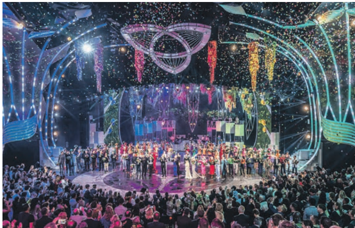
Weltklasse-Show like Las Vegas: Die Weltpremiere „Falling in Love“ begeistert das Publikum in Berlin.

der Bundeshauptstadt Berlin. Die Leser genießen Stil und Atmosphäre des „berühmtesten Hotels der Welt“ am Pariser Platz mit luxuriösen Hotelzimmern sowie dem legendären Adlon-Gourmet-Schlemmer-Frühstücksbuffet und der Möglichkeit zur Nutzung der großen Wellnessabtei-