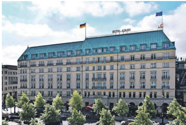
Das „berühmteste Hotel der Welt“ am Pariser Platz in Berlin können die Leser im November zum Weihnachts-Shopping ausführlich genießen.

preis von nur 475 Euro genießen die Gäste – inklusive Eintritt ohne Warteschlangen sowie Hin- und Rücktransfer – das weltberühmte Barberini-Museum in Potsdam mit der gerade neu eröffneten, sensationellen Sonderausstellung „Maurice de Vlaminck“ mit Leihgaben aus Museen in aller Welt und die große Impressionisten-Ausstellung von Hasso Platner. Am Abend lockt die Weltpremiere der neuen Großrevue