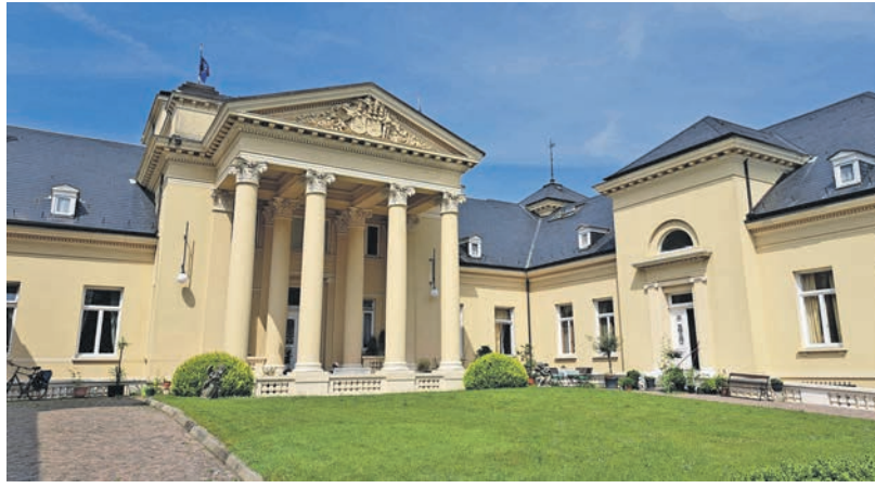
Im Schloss Bredeneek findet die Gesprächsreihe statt.