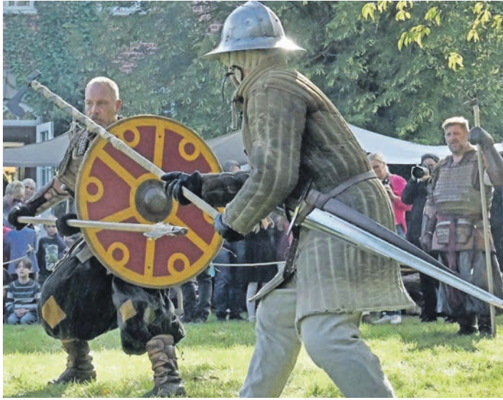
Kampfszene nach mittelalterlichem Vorbild, hier vorgestellt am Kreismuseum in Plön beim Slaventag 2023.

Jahrhundert entwickelten, während der Brandschutz in früheren Zeiten in den Händen des Klosters gelegen habe, ergänzt Christoph Pfeifer. „Die Feuerwehren waren aber auch für das Gesellschaftsleben in den Dörfern von Bedeutung.“ Und auch das Schulwesen werde thematisiert, denn „bis ins späte 19. Jahrhundert befand es sich unter der Regie des Klosters“.