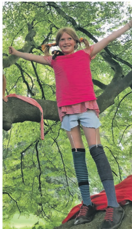
Auch Pippi Langstrumpf besucht die Premierenveranstaltung in Wahlstorf.

liche Schnitzeljagd über das Gutsgelände für Kinder ab sechs Jahren. Auf die Erwachsenen warten nachmittags Kuchen und Kaffee. „Stimmen der Natur – Streichquartett-Konzert mit Musik und Dichtung“ steht um 17 Uhr in der historischen Weizenscheune auf dem Programm. Anschließend können die Gäste sich mit kleinen Köstlichkeiten und Wein stärken, bevor um 19 Uhr das Abendprogramm beginnt. Dann erklingen in der