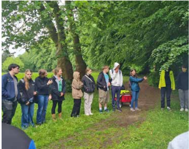
In mehreren Workshops beschäftigte sich die Plöner Schülerschaft mit dem Thema Nachhaltigkeit.

Im Anschluss ging es unter anderem in den Schlosspark, um dort mit FÖJlern des BUND interessante Stationen zu absolvieren. Es wurden Wasserproben aus dem Plöner Seen entnommen