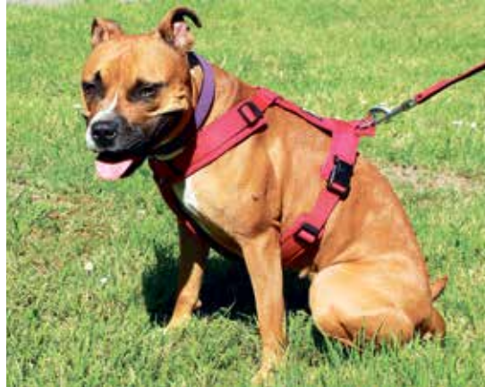
Sowohl Spürnase Blanca ...

mix-Hündin und Duman, eine cremefarbene Kangal-Hündin. Blanca hat erst vor kurzem ihr Zuhause verloren. Sie ist eine liebe Seele und kommt im Tierheim ganz gut mit allen klar. Man kann entspannt mit ihr Gassi gehen, ohne dass sie zieht oder andere Vierbeiner anbellt. Wenn man sich ihre Leine schnappt, juchzt Blanca aus Vorfreude und macht Luftsprün-