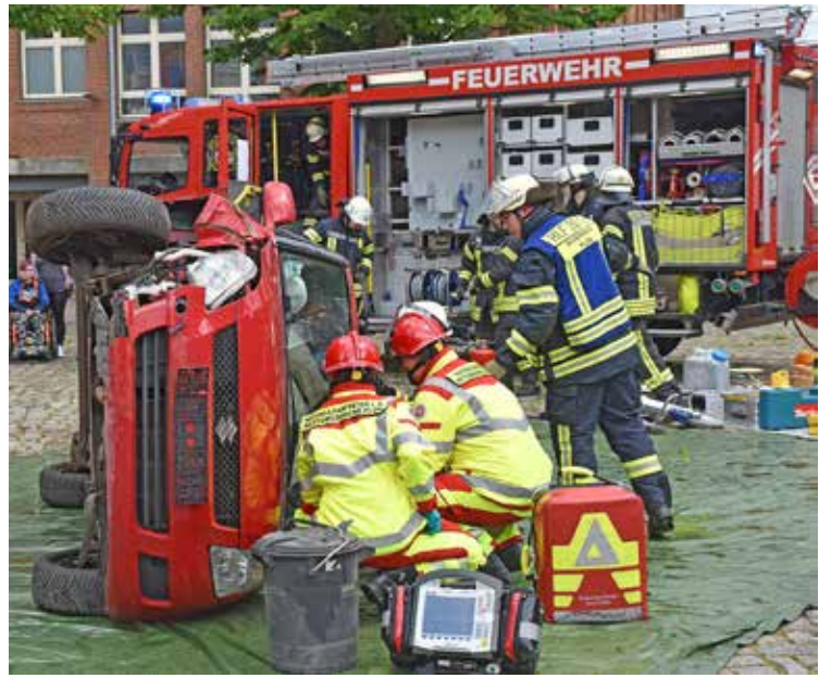
Vergangene Woche gab es eine Rettungsübung mit einem Unfallauto schon in Plön zu sehen. Es ist beeindruckend, was Feuerwehrleute alles wissen und können müssen.

Darüber hinaus erhalten die Besucher einen Einblick in die Technische Einsatzleitung und die Regie-Einheit Kreis Plön. Das Puppentheater Amt Probstei sorgt für die Unterhaltung der kleinen Gäste und die THW-Jugend Plön ist mit einer Hüpfburg dabei. Die DLRG stellt ihr Rettungsboot vor, und