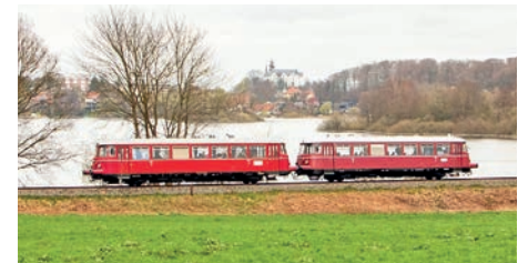
Ein historischer Schienenbus fährt durch die reizvolle Landschaft der Holsteinischen Schweiz.

und Plön nach Malente-Gremesmühlen und Eutin. Von Malente aus lässt sich zudem eine Draisinenfahrt Richtung Lütjenburg oder eine 5-Seen Fahrt zubuchen. Die Abfahrten sind in Neumünster Hauptbahnhof um 10.46 Uhr, in Kiel Hauptbahnhof um 11.28 Uhr und in Plön um 12.25 Uhr. Malente wird um 12.34 Uhr erreicht. Dort ist Umstieg zu den Draisinen (Abfahrt 13 Uhr) oder zum Schiff (Abfahrt 14 Uhr) möglich. Die Schienenbusfahrt endet um 12.41 Uhr in Eutin. Auf eigene Initiative ist eine Rundfahrt auf dem Eutiner See (Stadtbucht) ab 14 Uhr möglich. Zurück geht es um 16.16 Uhr von Eutin und um 16.23 Uhr von Malente. Ankunft in Plön ist um 16.32 Uhr, in Kiel um 17.11 Uhr und in Neumünster um 17.39 Uhr. Die Platzzahl ist begrenzt. Fahrkarten gibt es im Vorverkauf auf der Webseite des Vereins unter https://www.hehs-eisenbahn.de