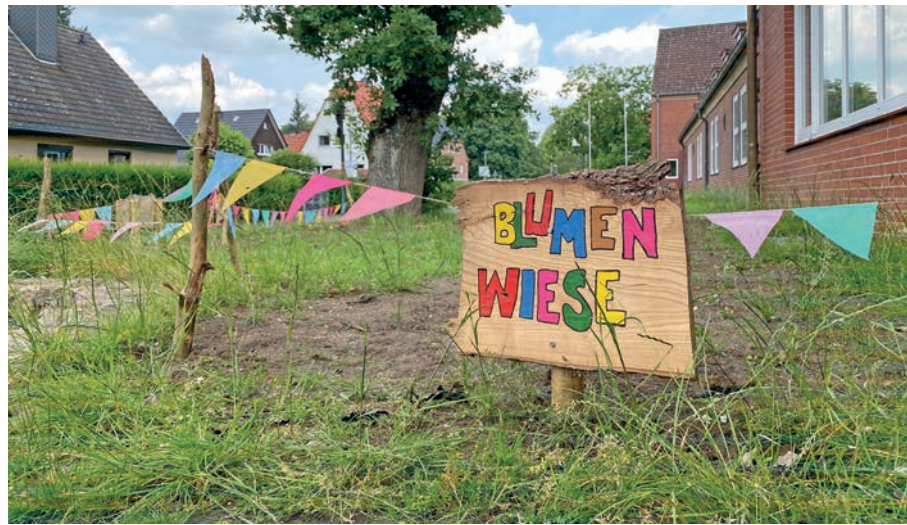
Auf einem 250 Quadratmeter großen Areal an der Breitenauschule entsteht eine Blumenwiese und ...

Plön (t). Seit bereits 14 Jahren wird die Breitenauschule in Plön jährlich als Zukunftsschule ausgezeichnet. Zukunftsschulen zeichnen sich durch nachhaltiges Handeln aus. Ziel ist es, den Nachkommen eine intakte ökologische, soziale und ökonomische Umwelt zu hinterlassen und sie an gesellschaftlichen Entwicklungsprozessen zu beteiligen. Das heißt: Umweltgesichtspunkte, das gemeinsame Miteinander und die wirtschaftliche Situation sind gleichberechtigt zu berücksichtigen. Durch eine „Bildung für Nachhaltige Entwicklung“ wird der Blick von Schülern für die Zukunft und ihre Herausforderungen geschärft. Dieses geschieht in Aktionen und Projekten der Jugendlichen, die sich engagiert beteiligen und ihre Ziele mit großer Motivation verfolgen. In diesem Rahmen verwandelt sich nun direkt vor der Breitenau-