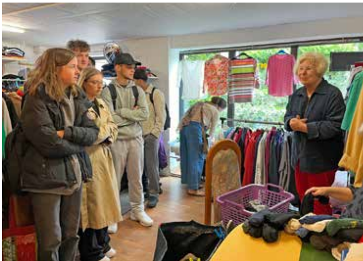
Die Plöner Kleidergarage gewährte den Schülerinnen und Schülern Einblick in den Verkauf von Secondhand-Kleidung für soziale Zwecke.

Am Ende der Aktionswoche waren sich die Schülerinnen und Schüler einig: Es ist wichtig, über die 17 Ziele der Nachhaltigkeit nachzudenken und Ideen für das eigene Handeln und für gemeinsame Projekte zu entwickeln.