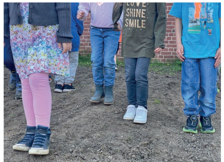
... das Saatgut traten 440 kleine Füße in die Erde.

stammende Künstler Pete Gavin, der einen Mix aus Folk, Blues und Rock präsentiert. Mit seinem rauen Gesang und dem Klang seiner Slide-Gitarre will er das Publikum begeistern.