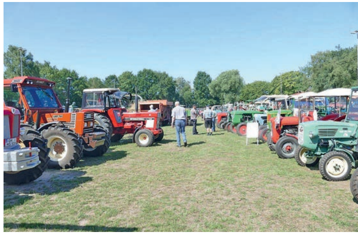
Zum 17. Mal werden am Sportzentrum in Hutzfeld Trecker und Oldtimer zu erleben sein.

Hutzfeld (t). Am kommenden Wochenende verwandelt sich das Sportzentrum Hutzfeld wieder zu einem Anziehungspunkt für Freunde alter Landmaschinen- und Feuerwehrentechnik. Dorfschaft und die Freiwillige Feuerwehr Hutzfeld-Brackrade laden zum mittlerweile 17. Trecker- und Oldtimertreffen in die Gemeinde Bosau ein. Los geht es am Sonnabend, 6. Juli, um 11 Uhr. Die Veranstalter rechnen wie in den vergangenen Jahren mit einer großen Resonanz. Eigener historischer Traktoren und Oldtimerfahrzeuge der Feuerwehren lassen es sich nicht nehmen, aus Nah und Fern mit ihren „Lieblingen“ zu diesem besonderen Event anzureisen. Höhepunkt der Show ist die Fahrzeugausstellung am Sonnabendnachmittag ab 13.30 Uhr. Geboten werden darüber hinaus Vorführungen alter Landmaschinentechnik (Buschhacker um 14.45 Uhr und Drescher um 15.15 Uhr) sowie das Arbeiten mit Spinnrad und Webstuhl um 14.15 Uhr. Außerdem richten die Veranstalter am Sonnabend eine Tauschbörse für eifrige Bildersammler der Feuerwehr-Stickerstars der Gemeinde