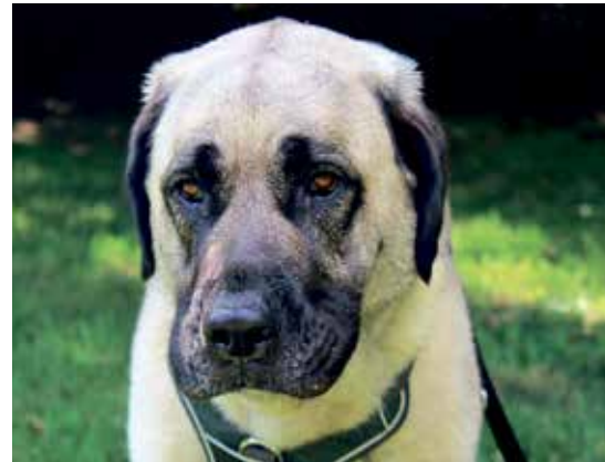
... als auch die große Duman lieben Spaziergänge mit erfahrenen Hundehaltern.

Ausflüge. Danach lässt sich Blanca gerne auf die Schulter klopfen und liebevoll streicheln. Es fällt einem schwer, sie wieder in ihre