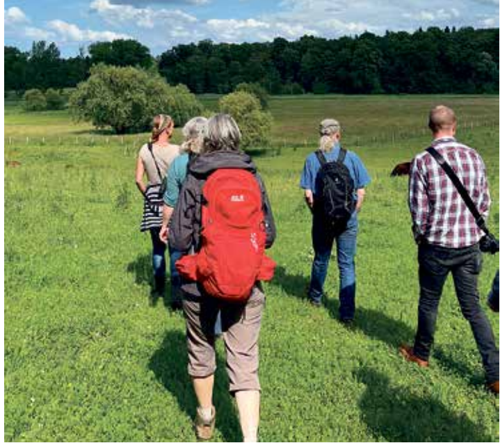
In der Weinbergsiedlung von Schwentinetal lassen sich wilde Orchideen, beruhigender Baldrian und gemütliche Galloways entdecken.

Uhr und dauert rund zweieinhalb Stunden. Das Mitwandern ist kostenlos. Spenden für die Stiftung Naturschutz sind willkommen. Wegen begrenzter Teilnehmerzahl ist eine Anmeldung erforderlich unter www.naturgenussfestival.de . Mit der Anmeldung wird mitgeteilt, wo genau die Wanderung startet. Sie führt durch die «Wilden Weiden», die von den Galloways, einer Rinderrasse, die für ihre Robustheit bekannt ist, beweidet