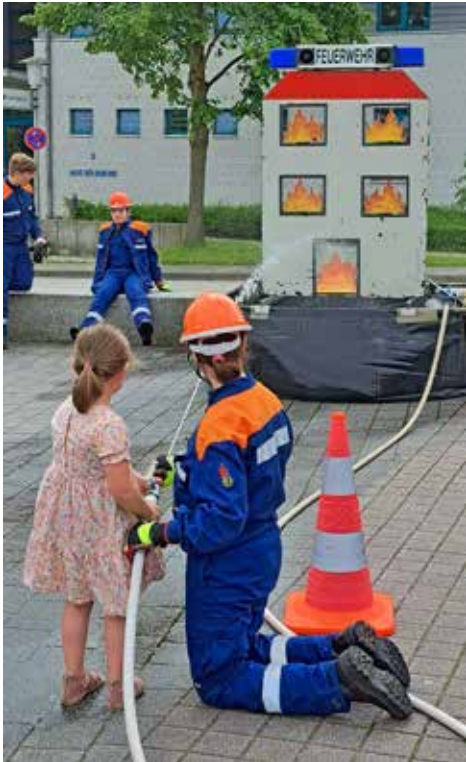
Zahlreiche Mitmachaktionen sorgen auf dem Cathrinplatz für Spaß.

Nach der Eröffnung um 10 Uhr fährt die Jugendfeuerwehr einen Löschangriff. Diese Einsatzübung beginnt um 10.30 Uhr.