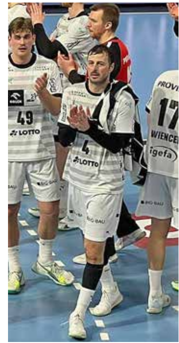
Im Halbfinale chancenlos: Domanogj Duvnjak.

ge Klatsche geben könnte. Dann fing sich die Jicha-Sieben ein wenig und konnte auf 14:20 verkürzen, verwarf in dieser Phase aber gleich zwei Siebenmeter. Magnus Landin und Eric Johannsson scheiterten am weiter überragenden Nielsen. Doch so richtig kamen die Kieler nicht mehr ins Rollen. Im Gegenteil. Die Katalanen setzten sich über 24:15 auf 27:17 ab. Am Ende stand ein mehr als klarer Erfolg zu Gunsten des FC Barcelona an der Hallendecke. Im Finale wartete nun Aalborg, das den zweiten deutschen Teilnehmer – den Deutschen Meister SC Magdeburg – mit 28:26 eliminierte. Dieses Endspiel gewann dann der FC Barcelona in einem hochklassigen und dramatischen Match mit 31:30. Im Spiel um Platz drei der beiden enttäuschten deutschen Teilnehmer siegte der THW mit 32:28. Für die Kieler war diese Pleite ein Spiegelbild der letzten Monate. Schon in der Meisterschaft - nur Platz vier - und dem frühen Ausscheiden im DHB-Pokal zeigte man ungewohnte Schwächen. Für die „Legenden“ Niclas Ekberg und Steffen Weinhold waren es die letzten beiden