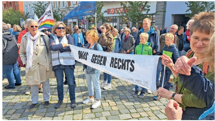
Auch die Initiative „Omas gegen rechts“ war bei der Demo in Preetz wieder am Start.

Am Sonnabend hatten Gnutzmann und Sturm noch ein positives Fazit des Demo-Marathons gezogen: Wichtig fanden sie, dass politische Diskussionen nicht im virtuellen Raum, sondern in aller Öffentlichkeit geführt wurden. Dass ein Stück Gemeinschaft geschaffen wurde, eine Plattform für interessante Gespräche. „Vielleicht könnte das auch für die Preetzer Kommunalpolitik eine Idee sein, den Bürgern mehr Gelegenheit zur Beteiligung zu geben“, meinte Sturm. Ob sie die Demonstrationen vor der Bundestagswahl im nächsten Jahr wieder aufnehmen, ließen die Organisatoren offen – wenn, dann jedoch nur, wenn sich weitere Einzelpersonen oder Initiativen finden, die sich zur Mitarbeit bereit erklären. Bleibt die Frage, ob das Ergebnis der Europawahl nun eher zu Demotivation oder zu einem Jetzt-erst-recht führt.