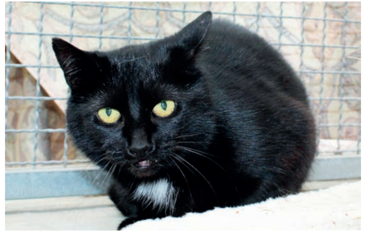
Katzendame Smilla sucht weiterhin ein neues Zuhause.

gemacht. Smilla beobachtet alles ganz genau und macht das eine oder andere Spielchen sogar schon mit. Aber das ersetzt natürlich kein eigenes Zuhause mit viel Platz, Vertrauen und Garten. Vielleicht findet sich nun jemand mit einem Herz für sie – dann hat die Wartezeit endlich ein Ende. Auch Kater Leo sucht eine neue Bleibe. Er hat komplett schwar-