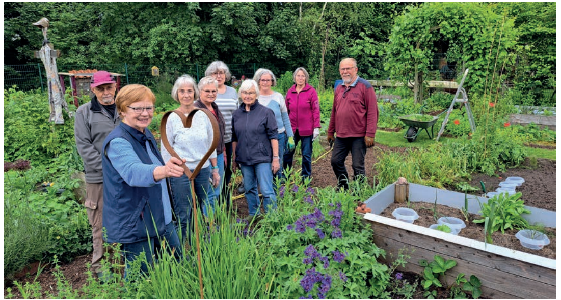
Die ehrenamtlichen Paten und Gartenbetreuer haben viel Spaß an ihrer Arbeit.