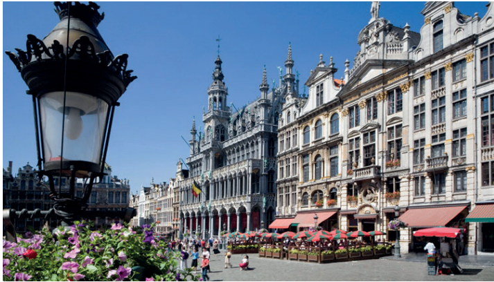
Hauptstadt Europas und Schlemmer-Paradies: Brüssel im Sommerkleid.

großem Schlemmerfrühstück vom Buffet in Brüssel, eine fachkundige Stadtführung/Stadtrundfahrt in Brüssel mit Reiseleitung sowie der Besuch des Top-Events „Blumen-Teppich“ und natürlich ganz viel Freizeit in Brüssel. Am dritten Tag sind Gäste zum großen Panorama-Ausflug in die weltberühmte Hansestadt Brügge