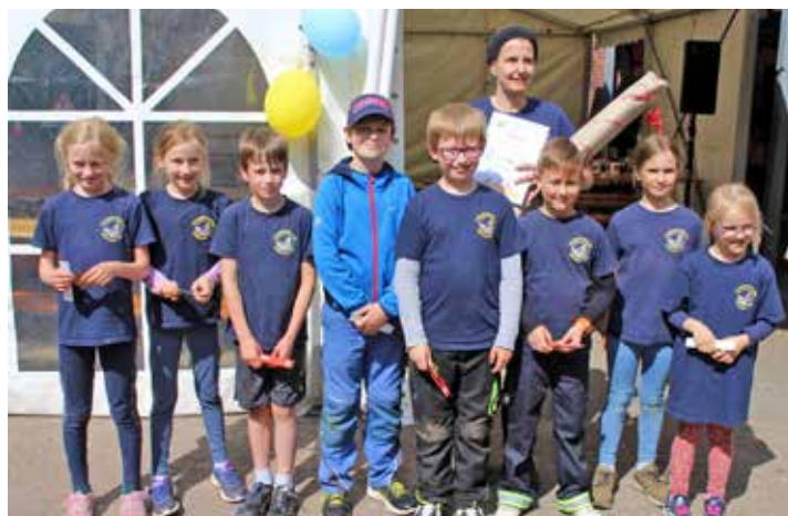
Gesamtsieger wurde die Gruppe Barkauer Land.

fein, durch einen Schlauch krabbeln, Getränkeboxen verlegen, Feuerwehrschlauch fachgerecht