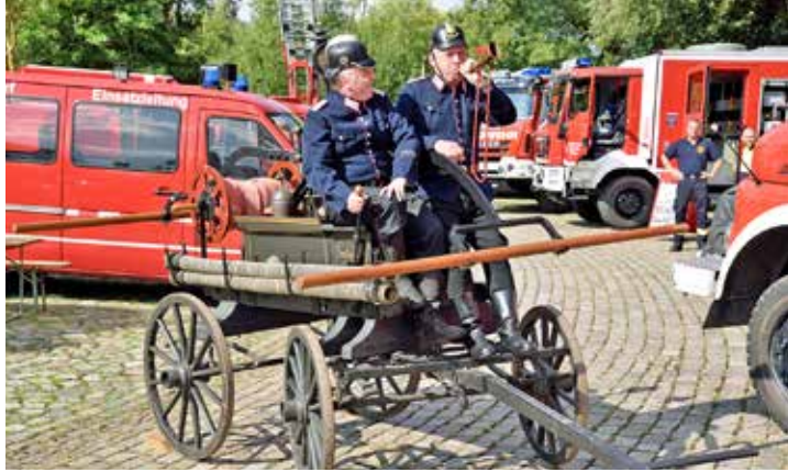
Zur modernen Technik der Kameraden zählte anno dazumal eine Saug- und Druckspritze (hier beim Plöner Blaulichttag 2018), die von Pferden an den Brandort gezogen werden musste.

2024, das Jahr der Jubiläen und „runden“ Geburtstage: Die Drehleiter wurde vor 20 Jahren angeschafft. Das Feuerwehrgerätehaus Am Alten Güterbahnhof wurde vor 30 Jahren eingeweiht. Und jetzt sind 150 Jahre Freiwillige Feuerwehr Plön zu feiern. Am 15. Juni steigt die große Sause unserer Feuerwehr, die aus dem Männerturnverein, dem TSV Plön von 1864, hervorgegangen ist – und der Sportverein zählt nun selbst schon 160 Jahre. Eine Feuerwehr, die als unverzichtbarste und wertvollste Einrichtung in der Stadt gelten muss: Die Leben rettet, die aber auch gesellschaftsstiftend wirkt und das Stadtleben fördert. Man denke