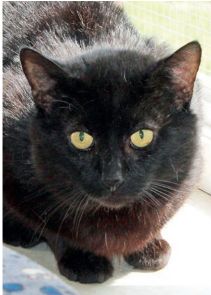
Kater Leo ist ganz frisch im Tierheim Kossau angekommen.

Kossau (t). Auch in dieser Ausgabe stellt „der reporter“ wieder tolle Bewohner des Tierheims Kossau-Lebrade vor, die ein neues und liebevolles Zuhause mit großem Garten suchen. Über Katzendame Smilla haben wir