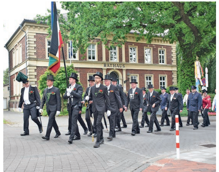
Abholung des Bürgermeisters: Das Rathaus war die erste Station des Gilde-Trosses.