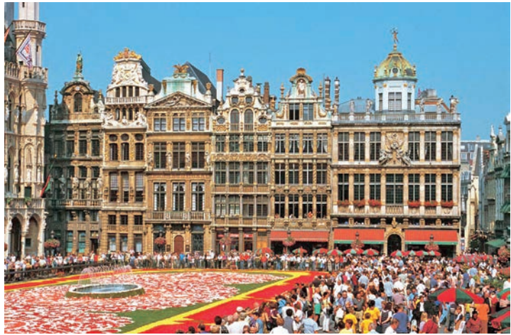
Eine Stadt blüht auf: Der „Brüsseler Blumen-Teppich 2024“ erwartet die Reporter-Leser*innen.

großartigen Bildern und Formaten verwandelt. Residieren werden die Gäste im internationalen First-Class-Hotel in guter Stadtlage von Brüssel mit exklusivem Komfort und einem großen Schlemmerfrühstück vom Buffet. Zum großen Leistungspaket zum Komplettpreis von nur 299,90 Euro gehören neben der Fahrt im erstklassigen Fernreisebus ab Preetz und Plön drei Übernachtungen im First-Class-Hotel mit