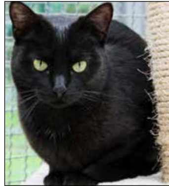
Die junge Katze Ria hat viel Energie.

An der B430 · 24306 Kossau/Lebrade · Tel. 04522 / 2389