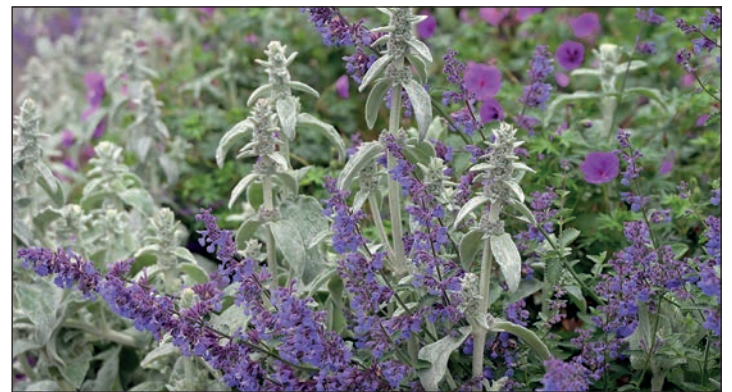
Eine Mischpflanzung mit Stauden, die sich mit Rosen perfekt kombinieren lassen: Blut-Storchschnabel, Wollziest