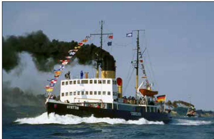
Unter Reporter-Flagge auf großer Voll dampf-Kreuzfahrt: Die Leser sind auf der „MS Stettin“ zu Gast.

Plön/Preetz (t). Zu einer einmaligen Sonder-Kreuzfahrt auf der schönsten Wasserstraße des Nordens starten die Reporter-Leser-Reisen am 22. Juni 2024 zum Top-Termin der Kieler Woche und am 4. August 2024 mit einer Voll dampf-Kreuzfahrt auf dem Nord-Ostsee-Kanal unter Reporter-Flagge ab Plön und Preetz mit dem historischen Dampf-Eisbrecher „MS Stettin“, dem weltweit größten schwimmenden historischen Denkmal. Alle Einnahmen dieser Extra-Kreuzfahrt dienen der Erhaltung des einmaligen Eisbrechers, der von einer liebenswerten ehrenamtlichen Besatzung als Verein geführt wird. Nach der Busanreise ab Plön und Preetz startet die große Nord-Ostsee-Kanal-Kreuzfahrt in Rendsburg auf einer der weltweit