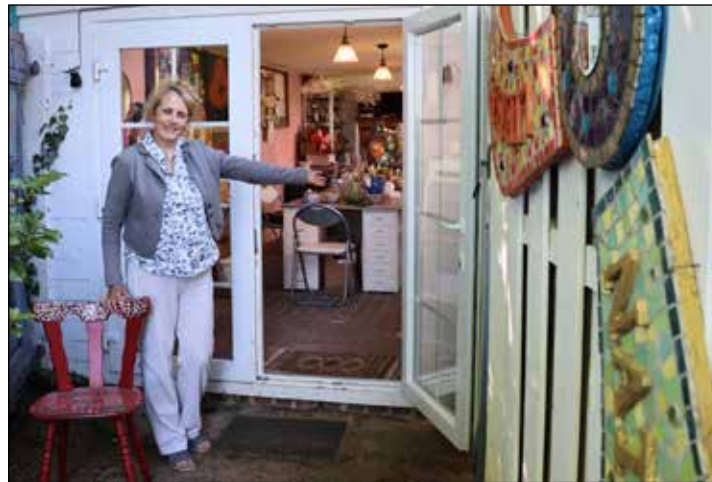
Zahlreiche Ateliers und Werkstätten der Holsteinischen Schweiz öffnen am 8. und 9. Juni ihre Türen.

Kreis Plön/ Ostholstein (t/los). Die Tourismuszentrale Holsteinische Schweiz lädt zu den Ateliertagen in elfter Auflage ein. 44 Künstler und Kunsthandwerker öffnen am Wochenende des 8. und 9. Juni in der Zeit von 11 bis 17 Uhr für Besucher ihre Pforten. Unter dem Motto Künstlerisches entdecken in der Region können sich Kunstfreunde zu einem Streifzug durch die reiche Kulturlandschaft der Holsteinischen Schweiz auf den Weg machen - in Malente, Plön sowie Eutin und Umgebung. Der „rote Stuhl“ als Symbol kennzeichnet die Orte. Das kreative Spektrum reicht von Plastiken bis zu Holz- und Eisenkunst, von Mosaikarbeiten bis zu Patchwork, von Töpfereien bis zu künstlerisch gestaltetem Schmuck und von Malereien bis zu Illustrationen und Fotografien. Viele Teilnehmer ermöglichen ihren Gästen während der Ateliertage, etwas selbst auszuprobieren, zeigen ihnen besondere Techniken, bieten Führungen, Lesungen oder Mitmachprojekte an oder halten Getränke und Fin-