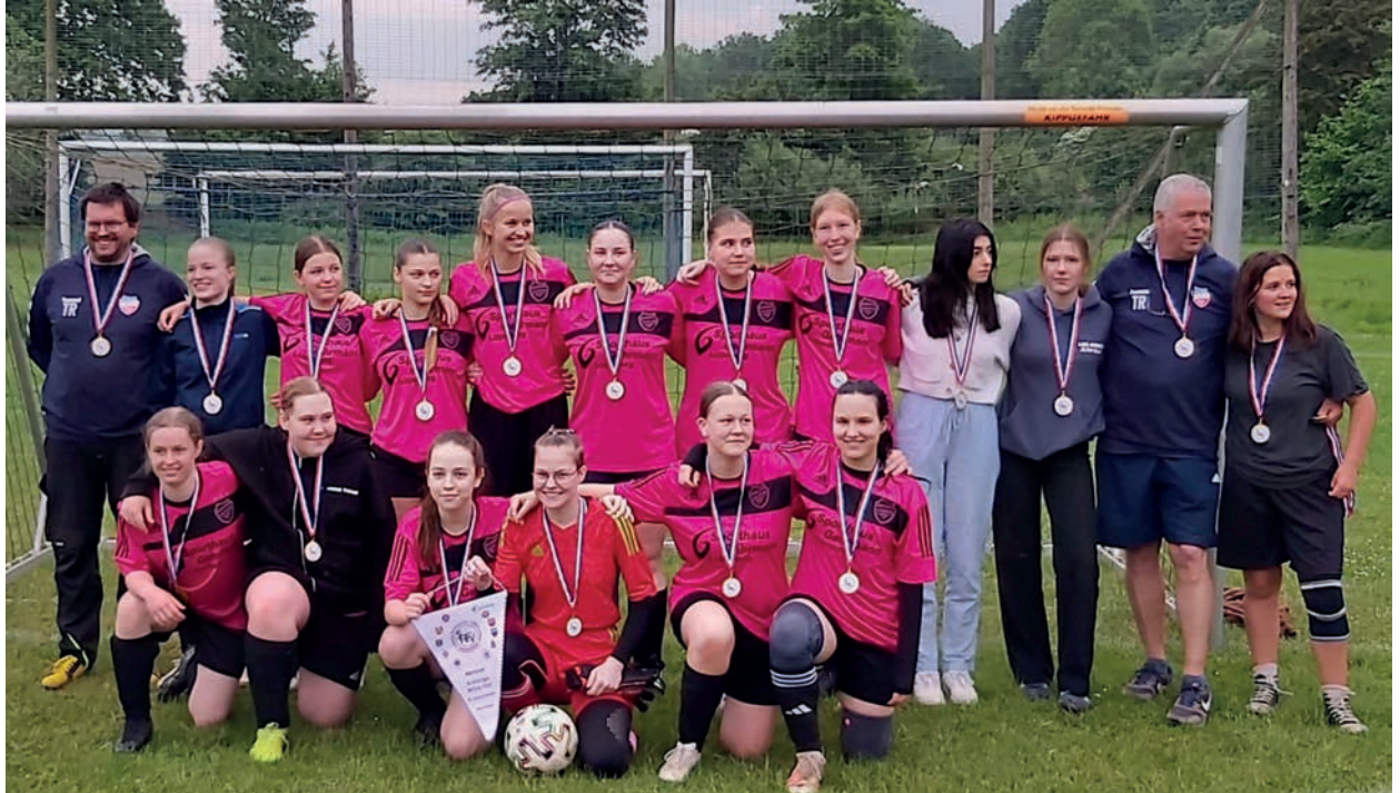
Die B-Mädchen beendeten die Saison als Kreismeisterinnen.

Giekau (t). Als Kreismeisterinnen beendeten die B-Mädchen des SV Knudde 88 Giekau die Saison 2024. Auch die Damenmannschaft hat am Sonntag, 26. Mai, ihr letztes Spiel zuhause 7:1 gegen die SG WI-SE deutlich gewonnen. Der endgültige Tabellenplatz hängt nun davon ab, wie die Damen des FC Süd Kiel ihr letztes Spiel abschließen werden. Aber nach der Saison ist bekanntlich vor der Saison. Immer montags findet nun das Training der Jahrgänge 2014-2017 mit dem neuen Trainerduo Lea Schröder und