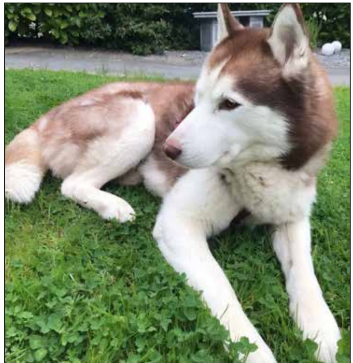
Dieser Vierbeiner sucht ein Zuhause.