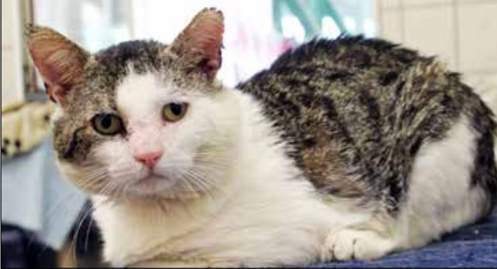
Harry ist etwas mitgenommen von seinen Abenteuern.

Kossau (t). Auch in dieser Ausgabe stellt „der reporter“ wieder tolle Bewohner des Tierheims Kossau-Lebrade vor, die ein neues und liebevolles Zuhause mit großem Garten suchen.