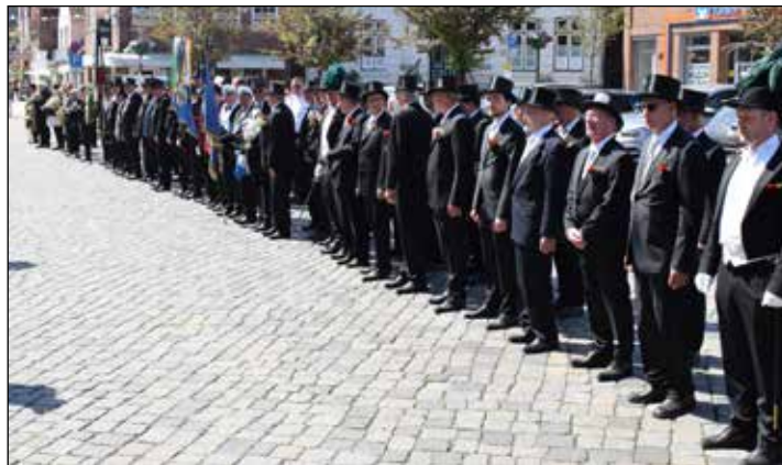
Gegen 10.30 Uhr wird auf dem Marktplatz der traditionelle „Gruß an die Stadt“ gespielt.

mit dessen Fall zu rechnen. Gegen 21.30 Uhr wird Wolfgang Schneider dann wieder das Gildegeschick befragen, das eine neue Majestät auserwählen wird. Der neue König wird die Geschichte der Gilde dann ein Jahr lang nach seinen Wünschen und Vorstellungen gestalten können.