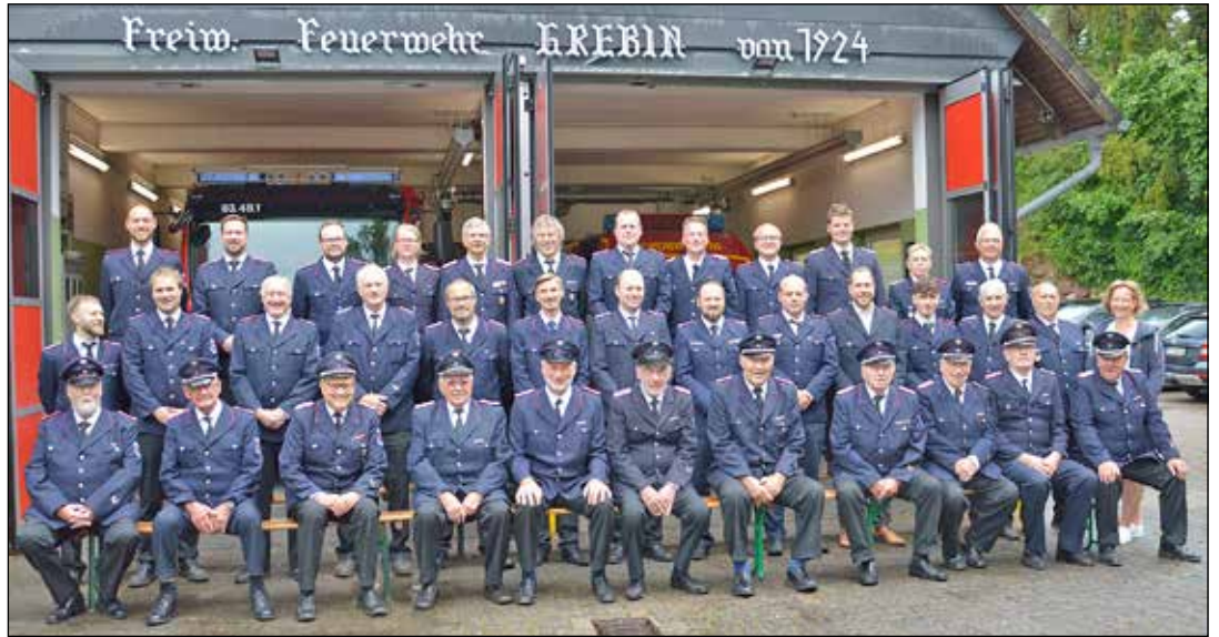
Die Einsatz-, Verwaltungs- und Ehrenabteilung der FFW Grebin.

Dazu sind drei Vorführungen geplant: Die Feuerwehr Plön zeigt die Hilfeleistung bei einem Unfall, danach folgt eine Vorführung der Jugendfeuerwehr Lebrade und zum Schluss zeigt die Feuerwehr Grebin das Löschen eines Brandes.